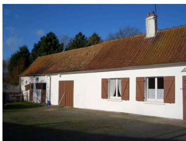
Vue des écuries dans le prolongement du logis.