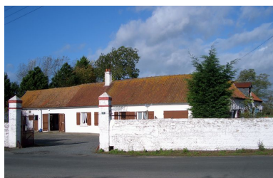
Vue générale. IVR22_20068005626NUCA