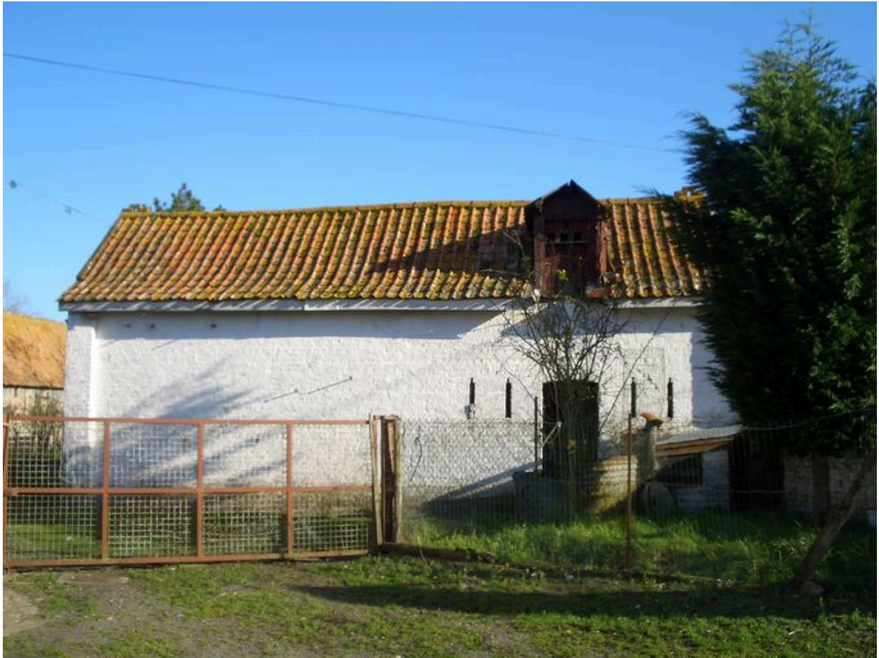
Vue du poulailler depuis la cour.