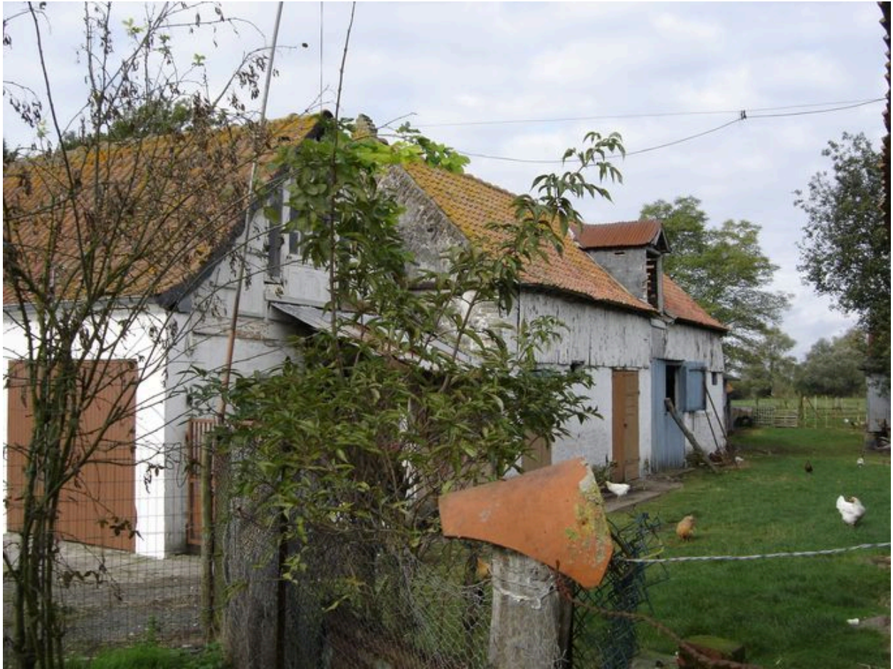
Vue des étables situées perpendiculairement au logis.