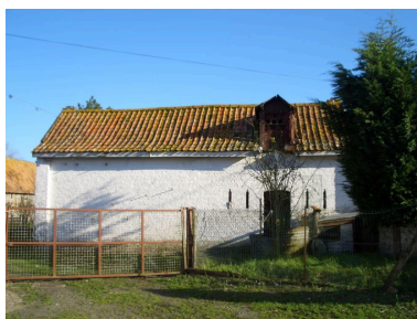
Vue du poulailler depuis la cour. IVR22_20068005633NUCA