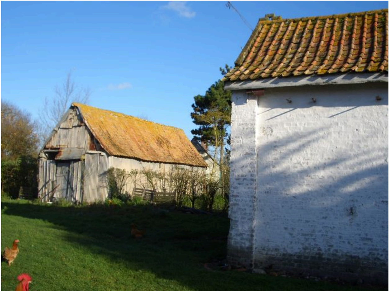
Vue de la grange.