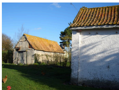
Vue de la grange. IVR22_20068005630NUCA