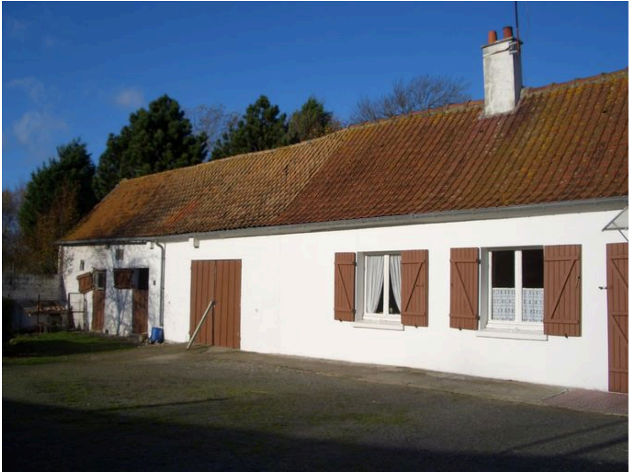
Vue des écuries dans le prolongement du logis.