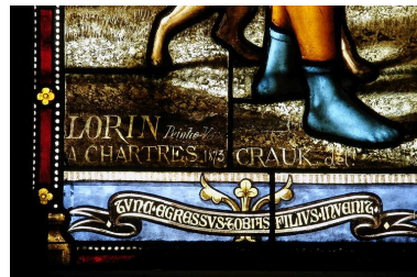
Baie 5, détail : signature. IVR22_20058001937NUCA