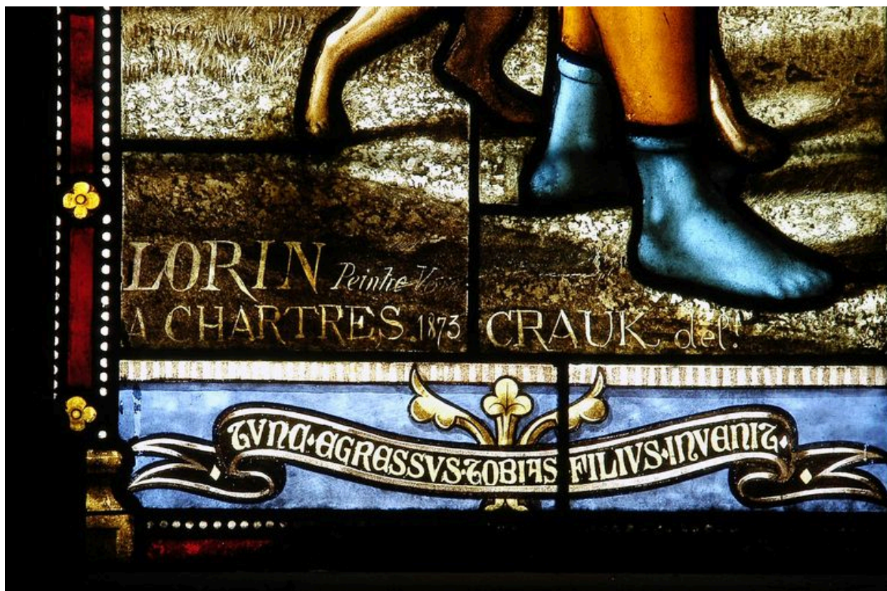
Baie 5, détail : signature.