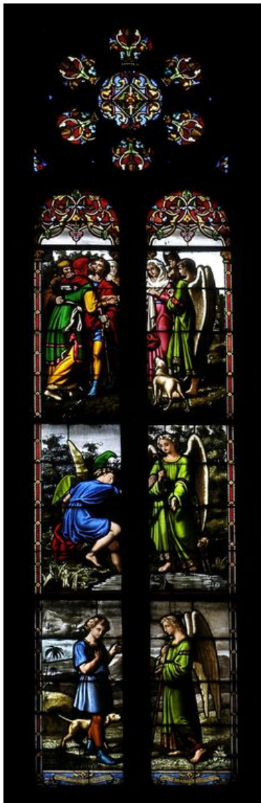
Baie 5. IVR22_20058001936NUCA