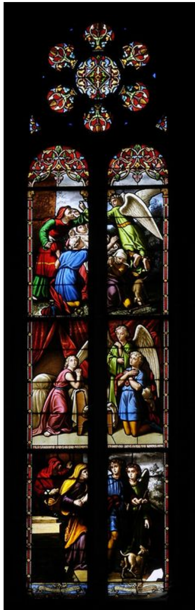
Baie 9.