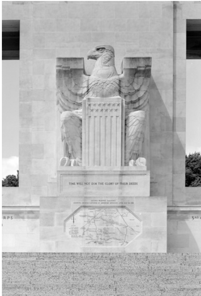
Vue de détail de l'aigle de la face sud.