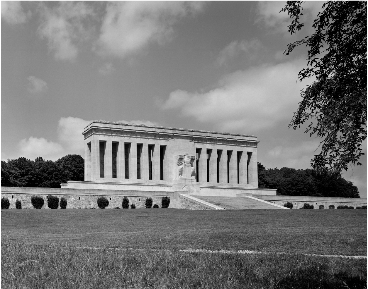
Vue d'ensemble de la face sud.