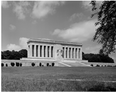
Vue d'ensemble de la face sud. IVR22_19950200350V