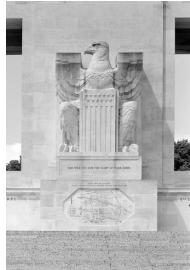
Vue de détail de l'aigle de la face sud.