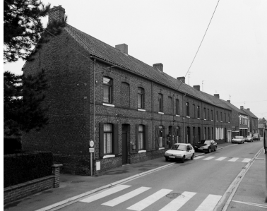
Vue générale. IVR31_20045900679X

Cadastre de 1913, extrait de la 6e feuille (AD Nord : P31/626). IVR31_20045905493NUCA