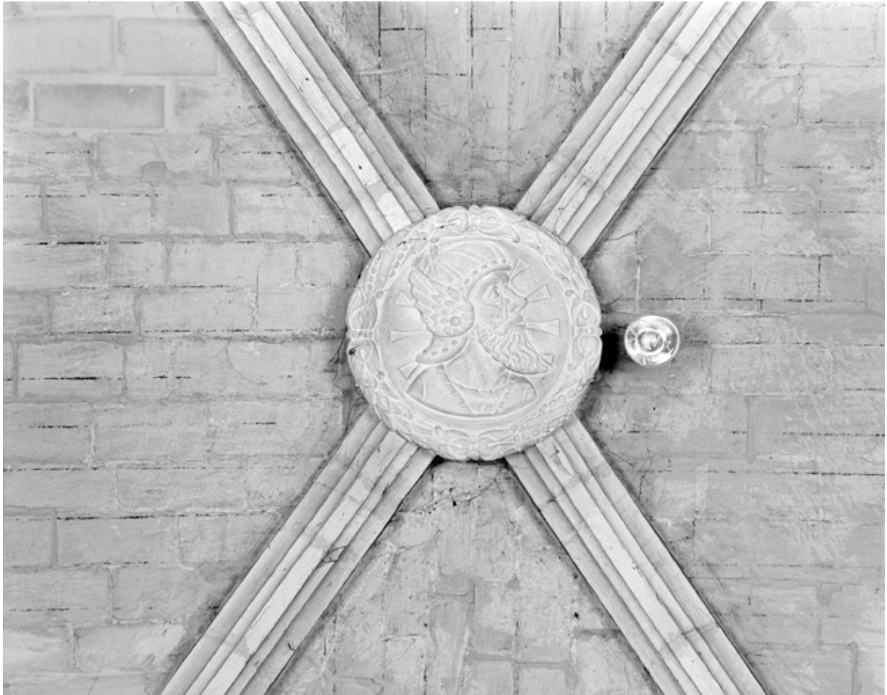
Médaillon circulaire, tête casquée, pierre, 16e siècle ; nef, 3e travée.