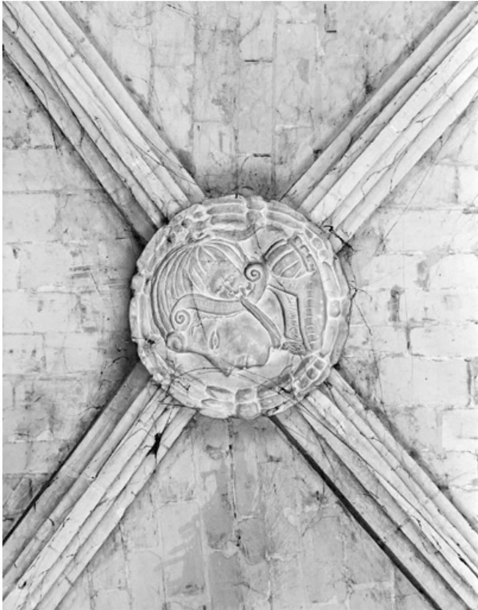
Médaille circulaire, figure casquée, pierre, 16e siècle ; bas côté sud, 3e travée.