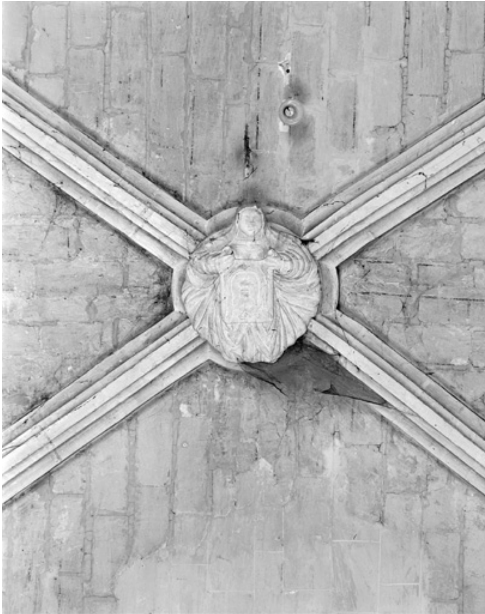
Sainte Véronique, pierre, 18e siècle ; nef, 2e travée.