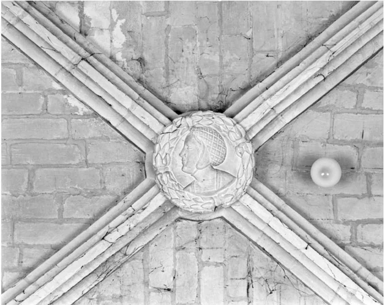
Médaillon circulaire à figure féminine, pierre, 16e siècle ; bas côté nord, 2e travée.