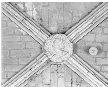
Médaille circulaire à figure féminine, pierre, 16e siècle ; bas côté nord, 2e travée. IVR22_19940200948X