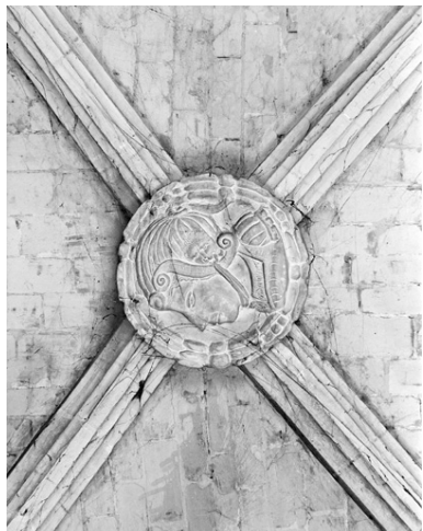
Médaille circulaire, figure casquée, pierre, 16e siècle ; bas côté sud, 3e travée.