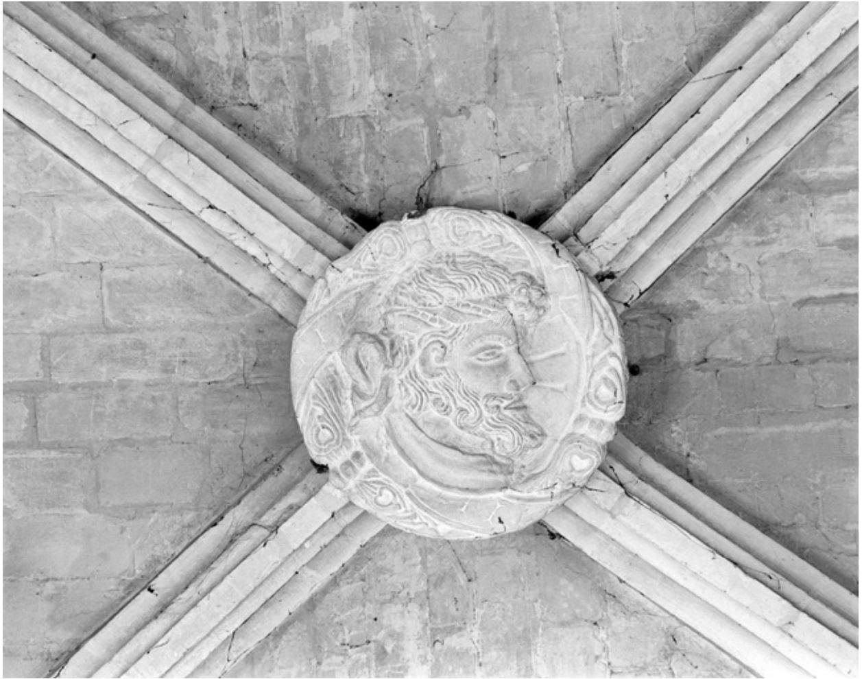
Médaille circulaire, pierre, 16e siècle ; bas côté nord, 1ère travée.