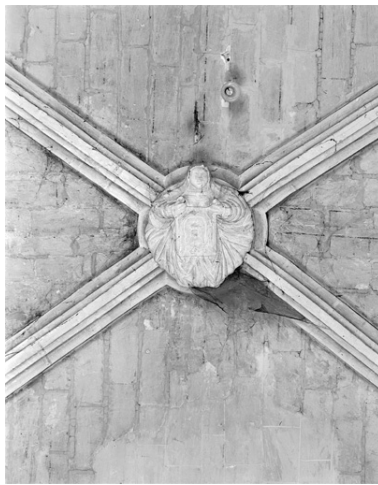
Sainte Véronique, pierre, 18e siècle ; nef, 2e travée. IVR22_19940200953X