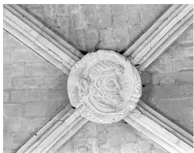
Médaille circulaire, pierre, 16e siècle ; bas côté nord, 1ère travée.