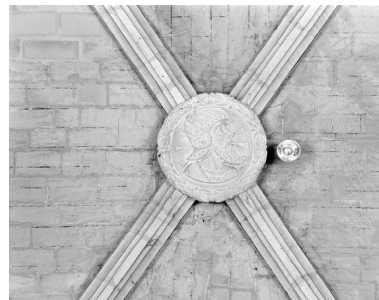
Médaille circulaire, tête casquée, pierre, 16e siècle ; nef, 3e travée.