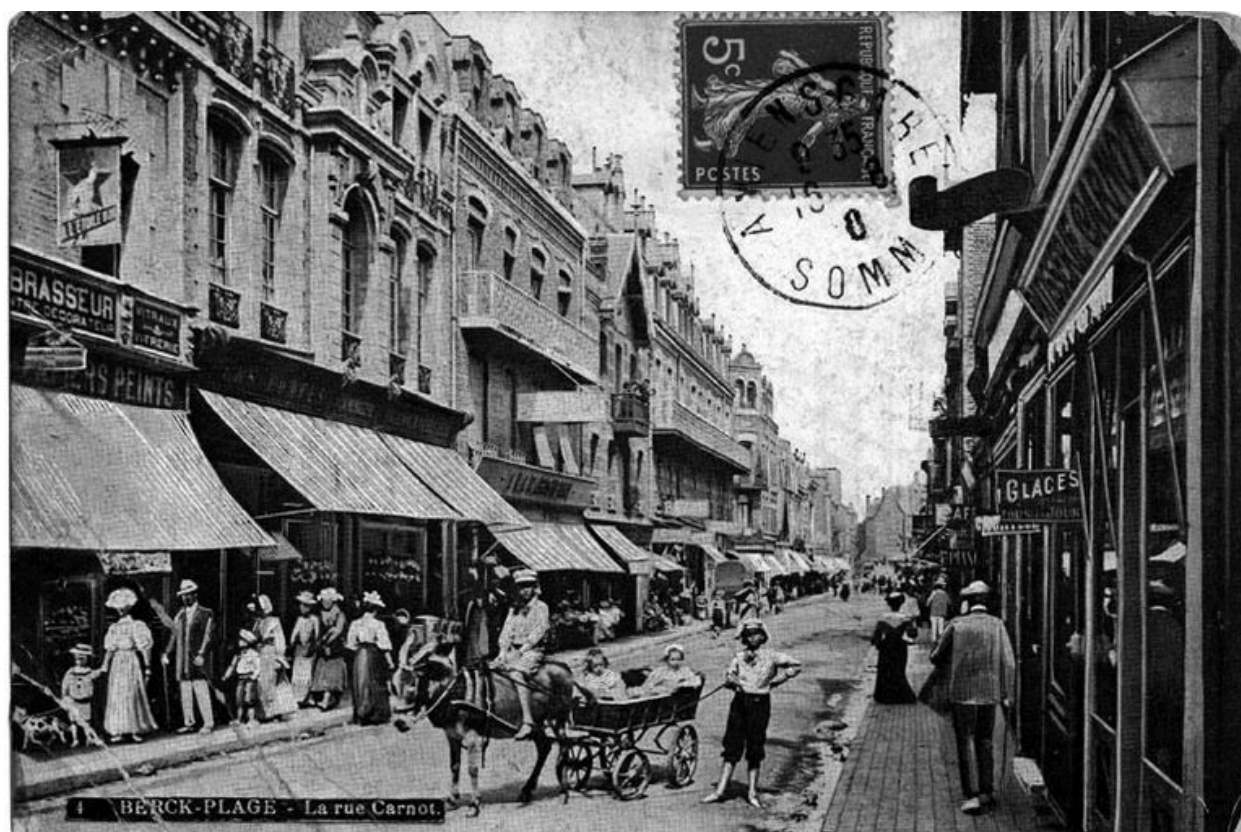
Vue générale au début du 20e siècle, carte postale (collection privée).