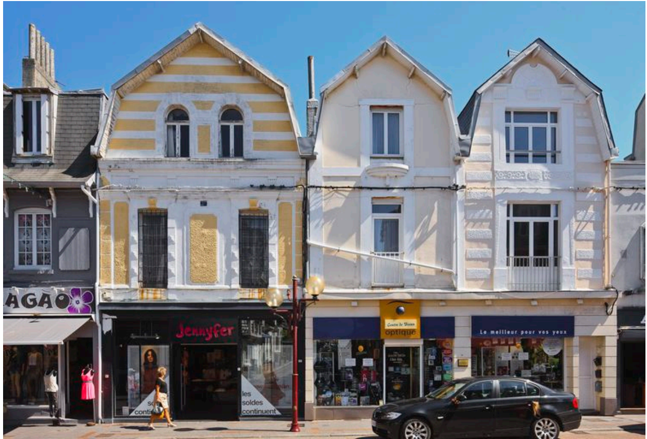
Alignement de chalets dans la rue Carnot.