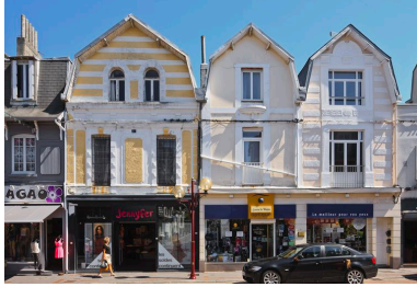
Alignement de chalets dans la rue Carnot. IVR31_20136200185NUCA