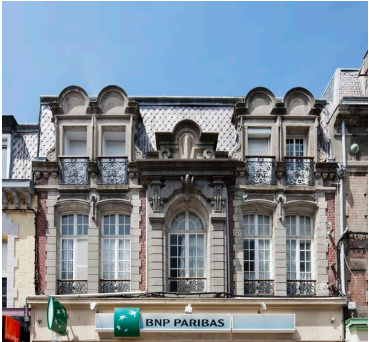
Vue générale de l'étage carré du 29 rue Carnot en 2013.