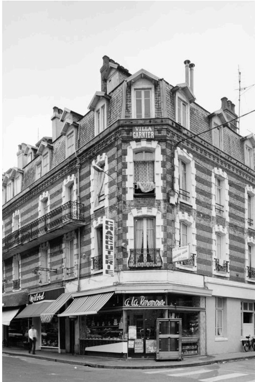
Vue générale de la Villa Garnier, immeuble 35 rue Carnot en 1981.