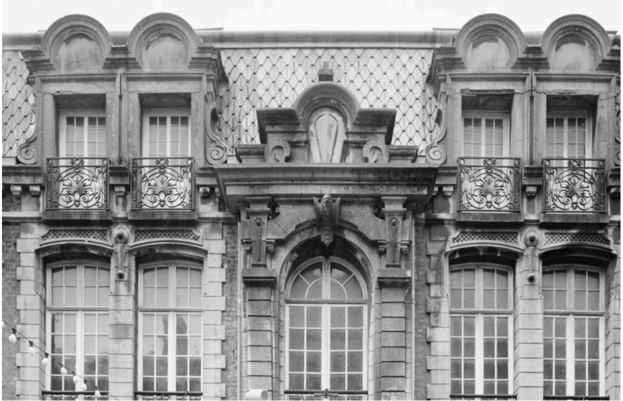
Vue générale de l'étage carré du 29 rue Carnot en 1981.