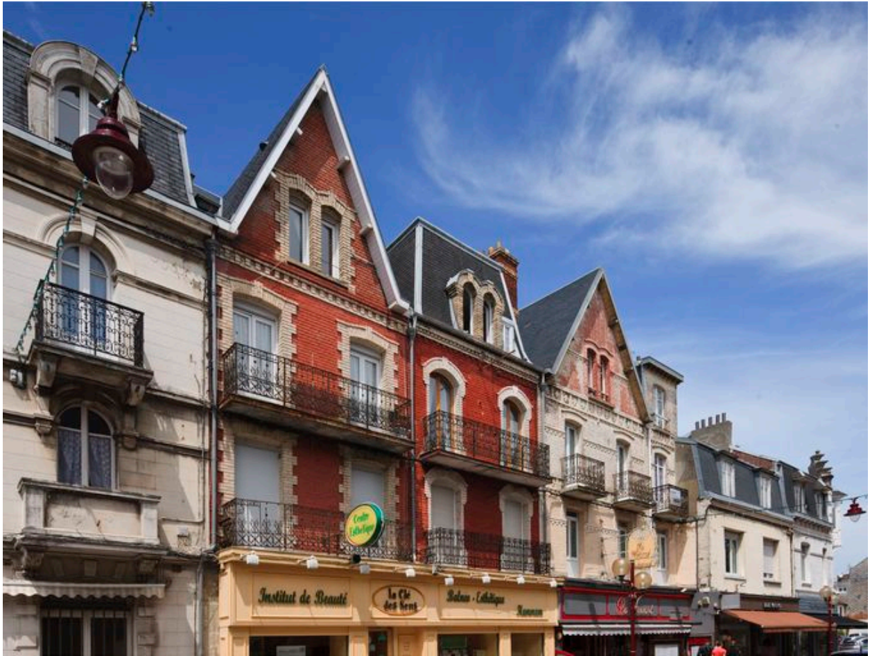
Vue générale d'un alignement d'immeubles de la rue.