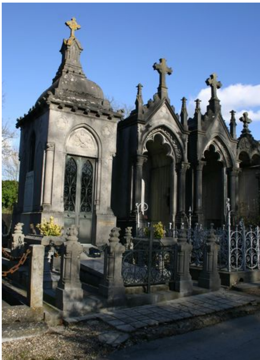
Vue générale, de trois-quarts.