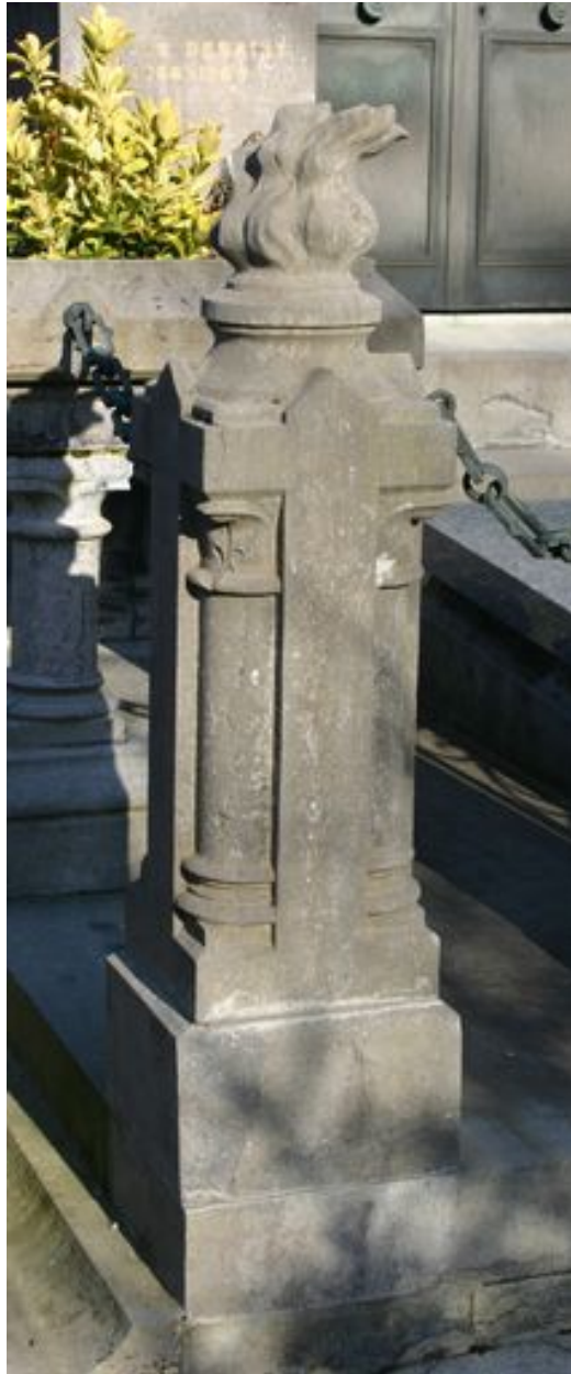
Détail de l'un des poteaux de clôture.