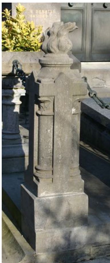
Détail de l'un des poteaux de clôture. IVR22_20088000374NUCA