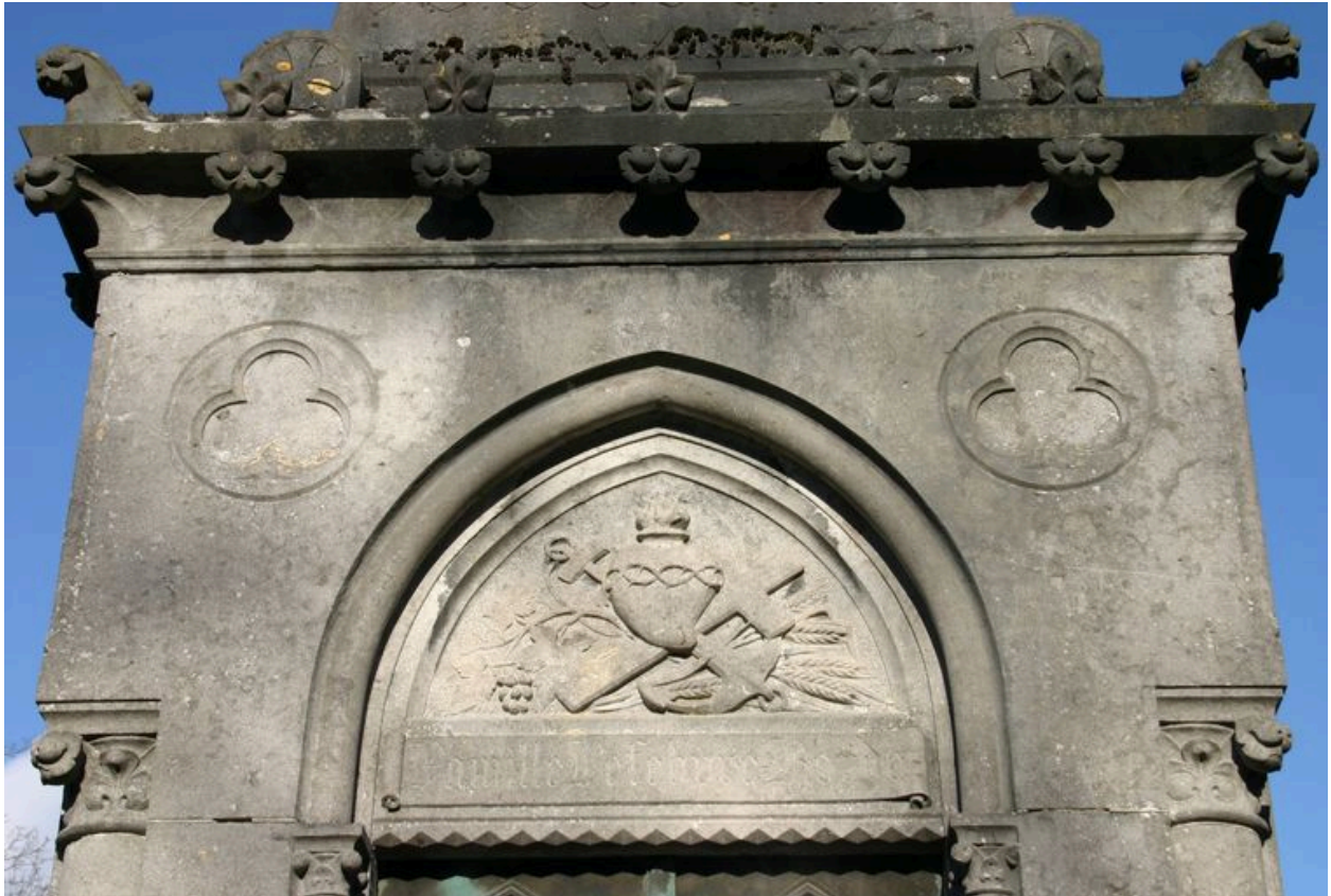
Détail du décor sculpté, ornant le tympan du tombeau-chapelle.