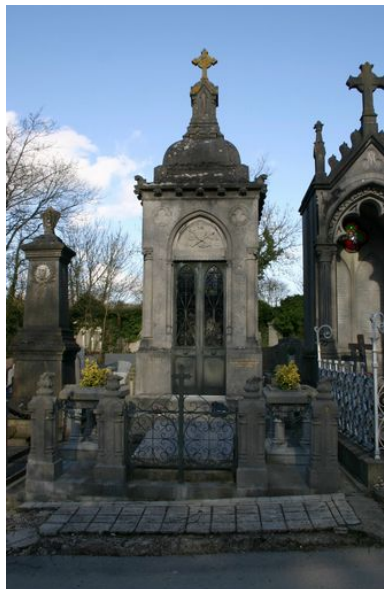
Vue générale. IVR22_20088000371NUCA