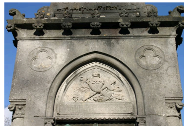
Détail du décor sculpté, ornant le tympan du tombeau-chapelle.