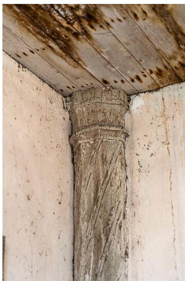
Colonne torse du clocher en entrant à gauche.