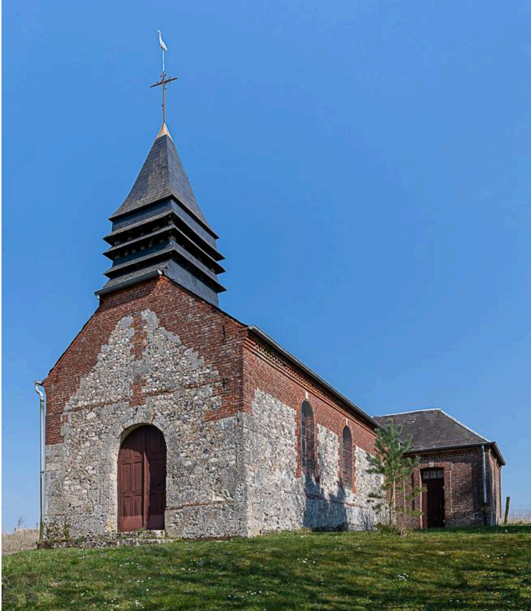
Vue depuis le sud-ouest.