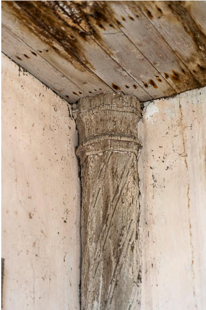
Détail de la colonne torse du clocher en entrant à gauche.