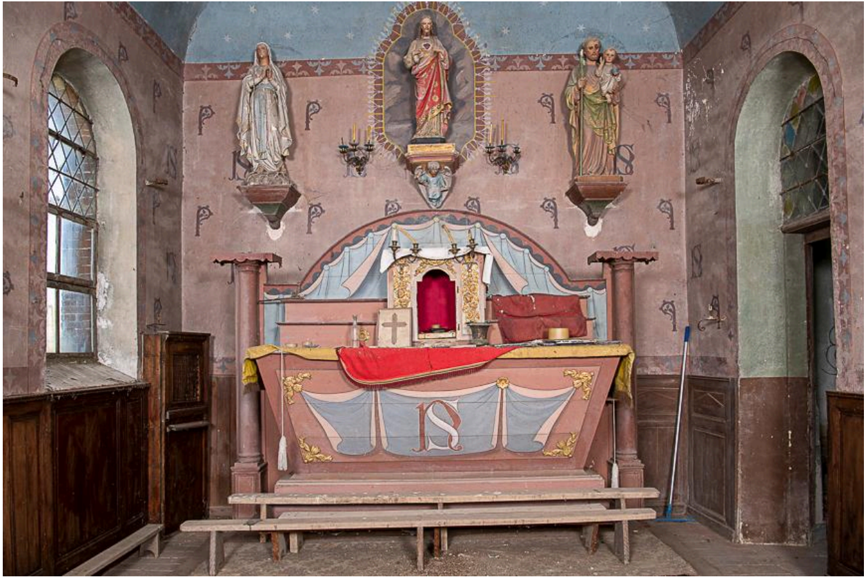
Vue du chœur.