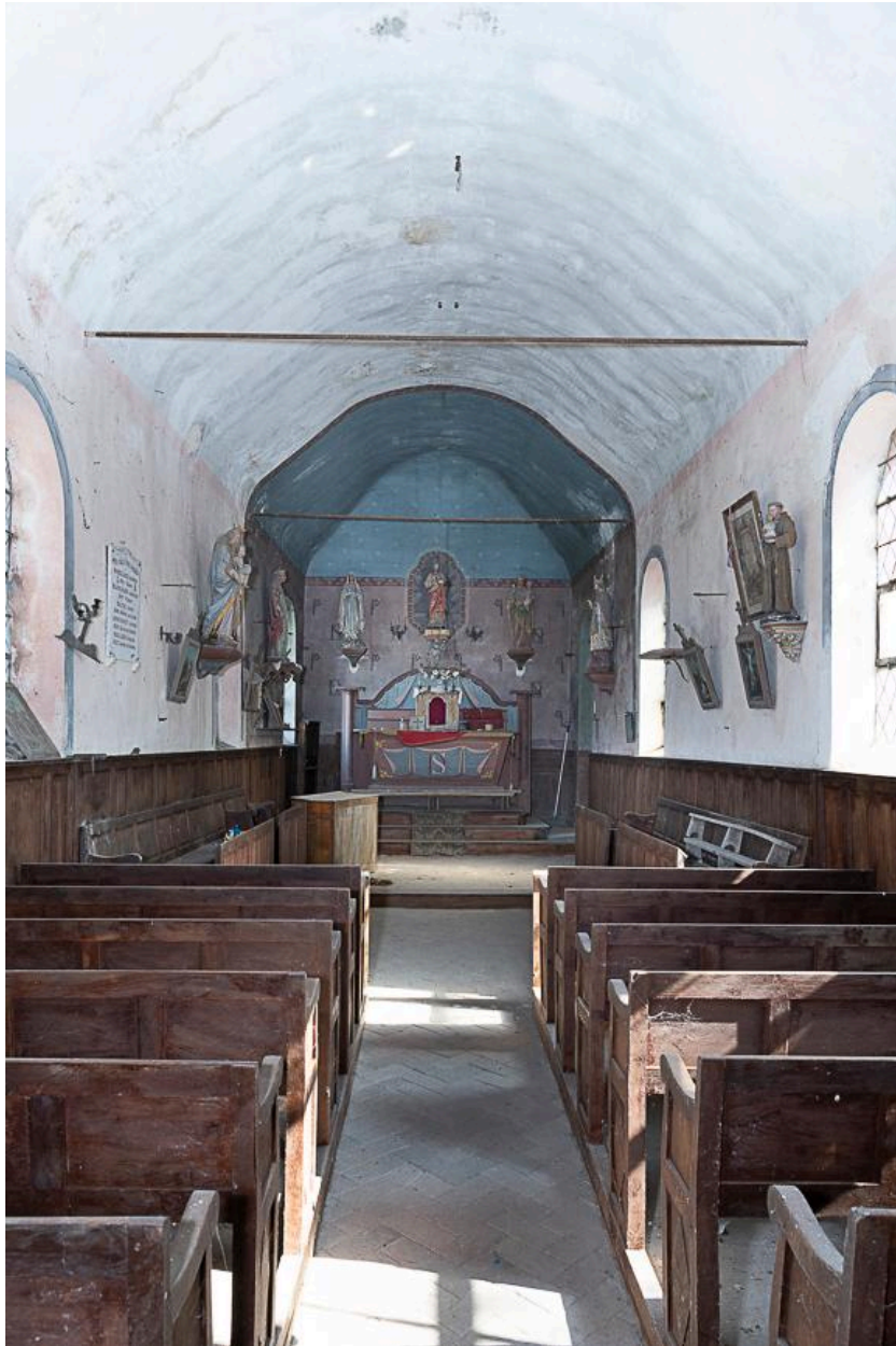
Vue vers le chœur.