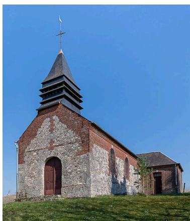
Vue depuis le sud-ouest.