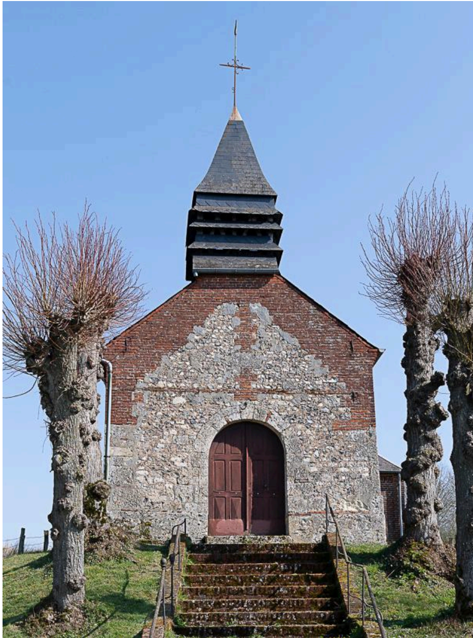
Vue de la façade occidentale.