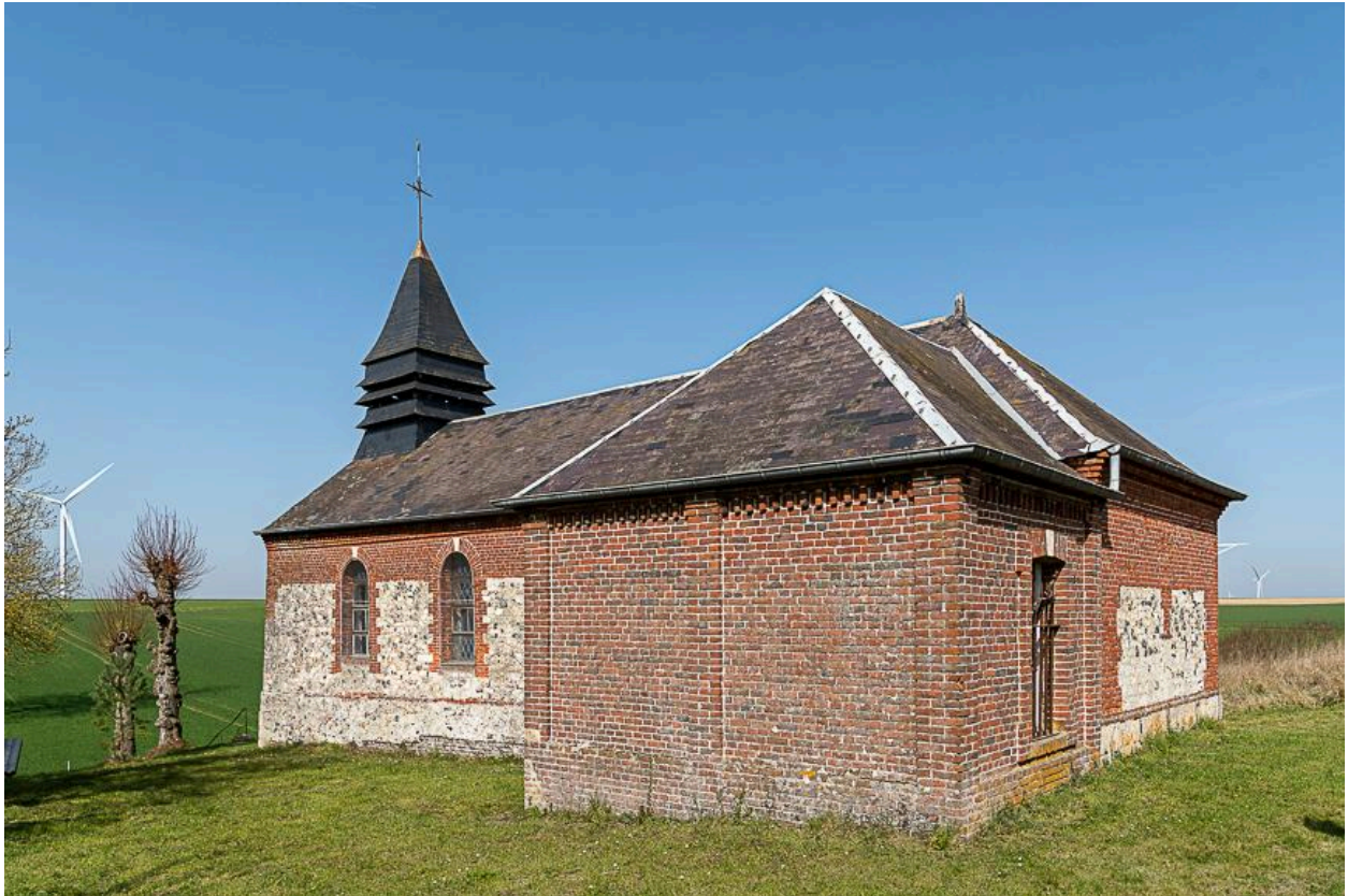
Vue depuis le sud-est.