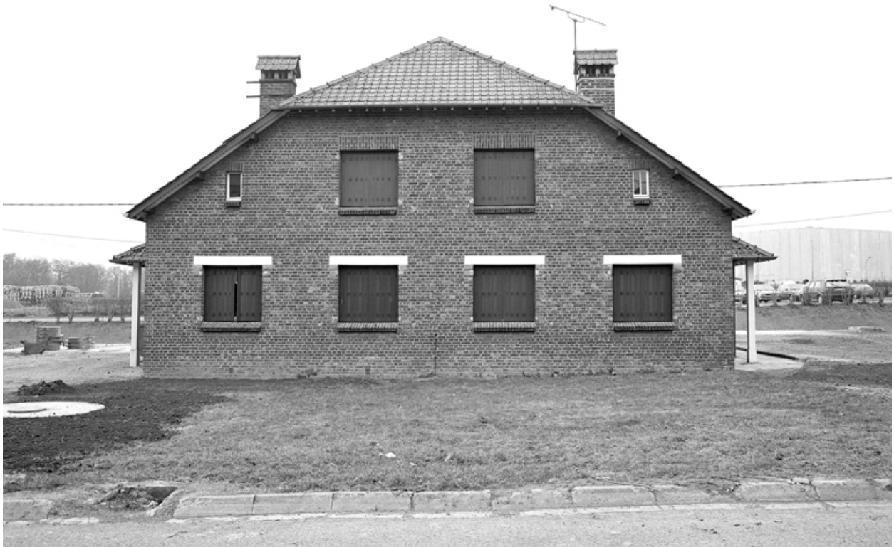
Façade d'une des maisons de la cité des cadres de l'usine, renfermant deux logements symétriques.