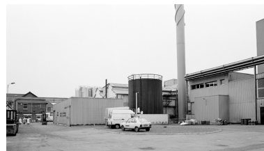
Partie sud-ouest de la cour de l'usine, occupée par la chaufferie, le réservoir de fuel et des stocks.