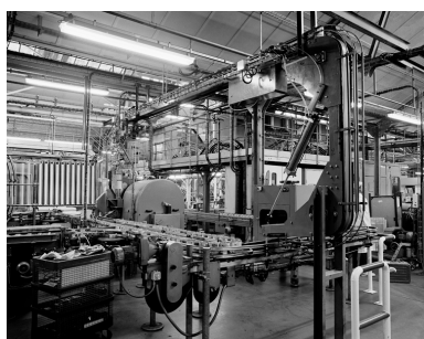
Vue intérieure partielle de la ferblanterie : fabrication des boîtes en métal destinées à contenir le lait en poudre.