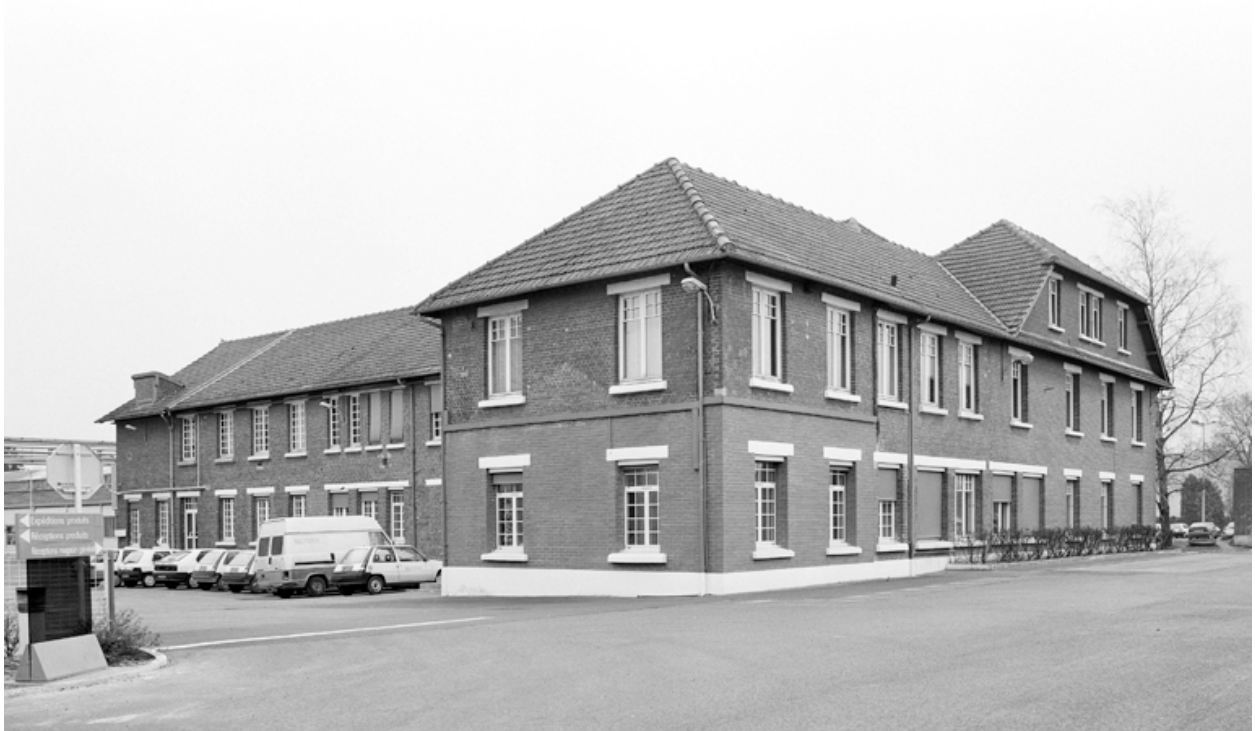
Vue des bureaux et de la réception, depuis le sud-ouest.