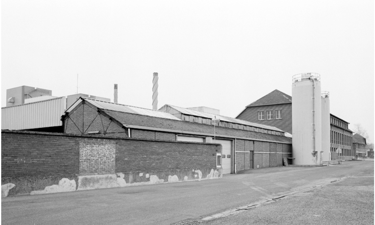
Vue du bâtiment social et d'un bâtiment à usage de remise et entrepôt, depuis le sud-ouest.