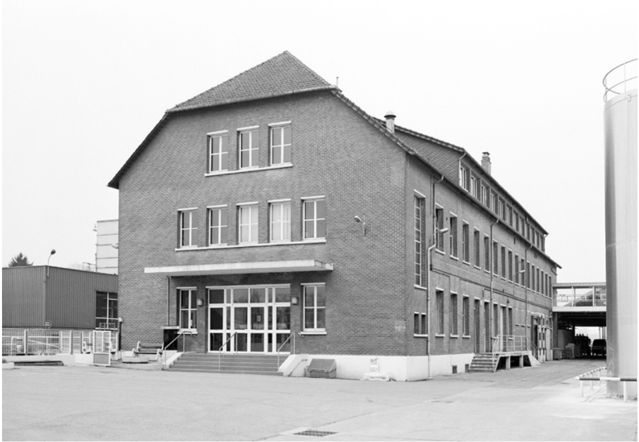
Vue générale nord-est du bâtiment social.