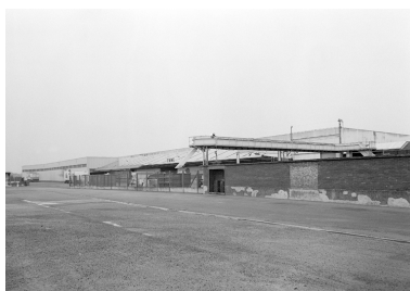
Vue de la partie sud de l'usine, occupée par les stocks.