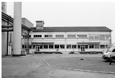
Elévation sud du laboratoire précédemment occupé par l'atelier de fabrication de biberons prêts à l'emploi. IVR22_19960200129X