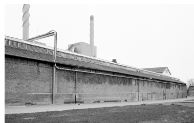
Elévation externe (est) du magasin général et de l'atelier de réparation. IVR22_19960200130X