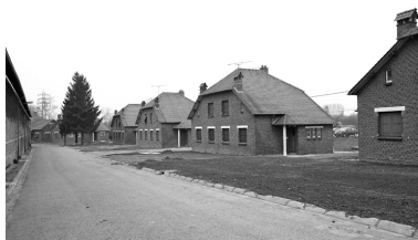
Vue générale de l'ancienne cité des cadres de l'usine.