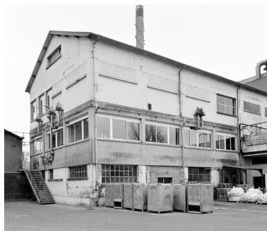
Vue partielle nord du laboratoire précédemment occupé par l'atelier de fabrication de biberons prêts à l'emploi.