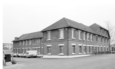
Vue des bureaux et de la réception, depuis le sud-ouest. IVR22_19960200126X