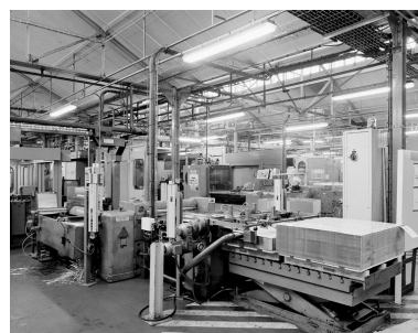
Intérieur de la ferblanterie : début de la chaîne de façonnage des boîtes en métal, à partir de plaques de métal imprimées.