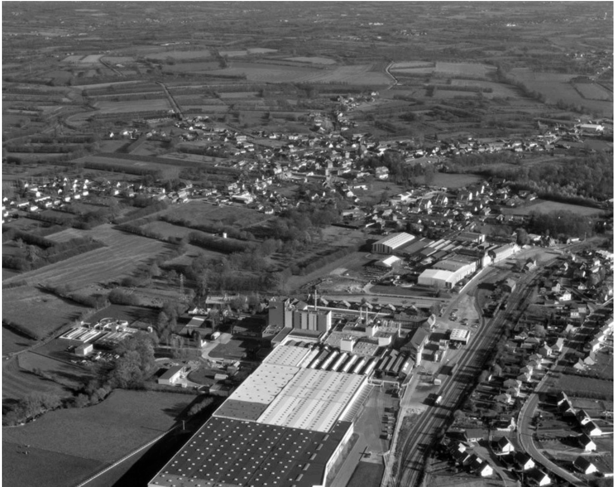
Vue aérienne de l'usine, depuis l'ouest.