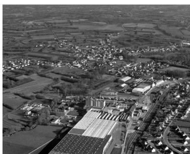
Vue aérienne de l'usine, depuis l'ouest.