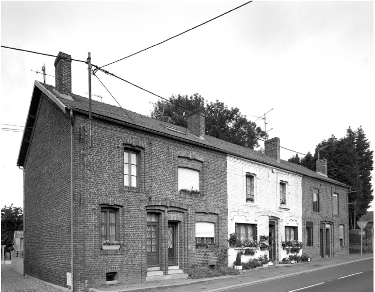
Vue partielle de la cité de l'usine Nestlé.