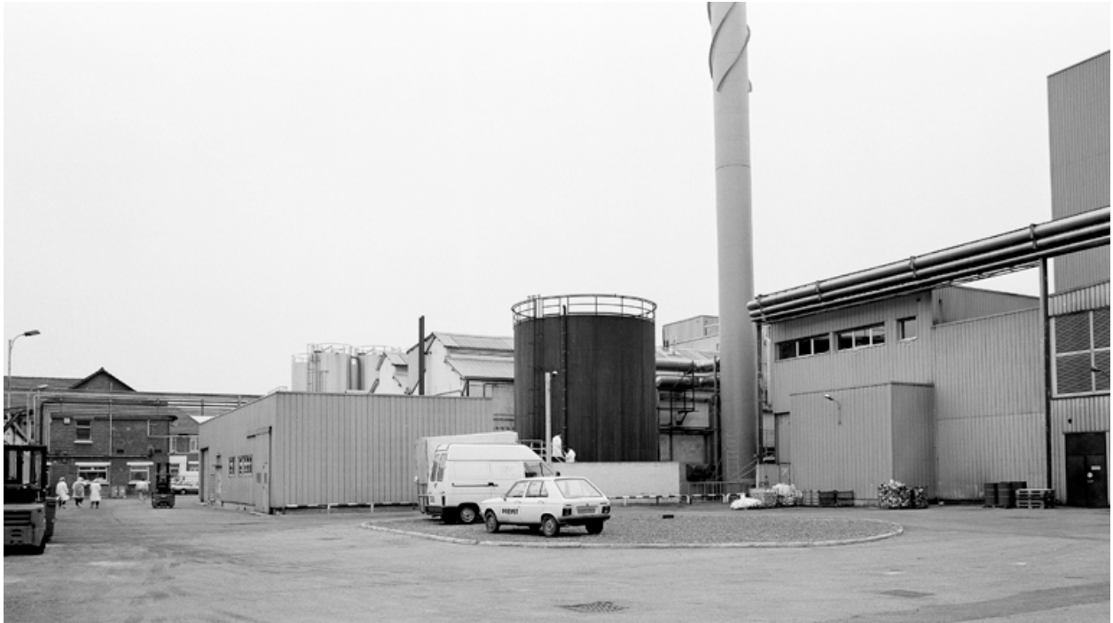
Partie sud-ouest de la cour de l'usine, occupée par la chaufferie, le réservoir de fuel et des stocks.