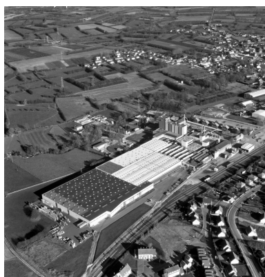
Vue aérienne de l'usine, depuis le sud-ouest.