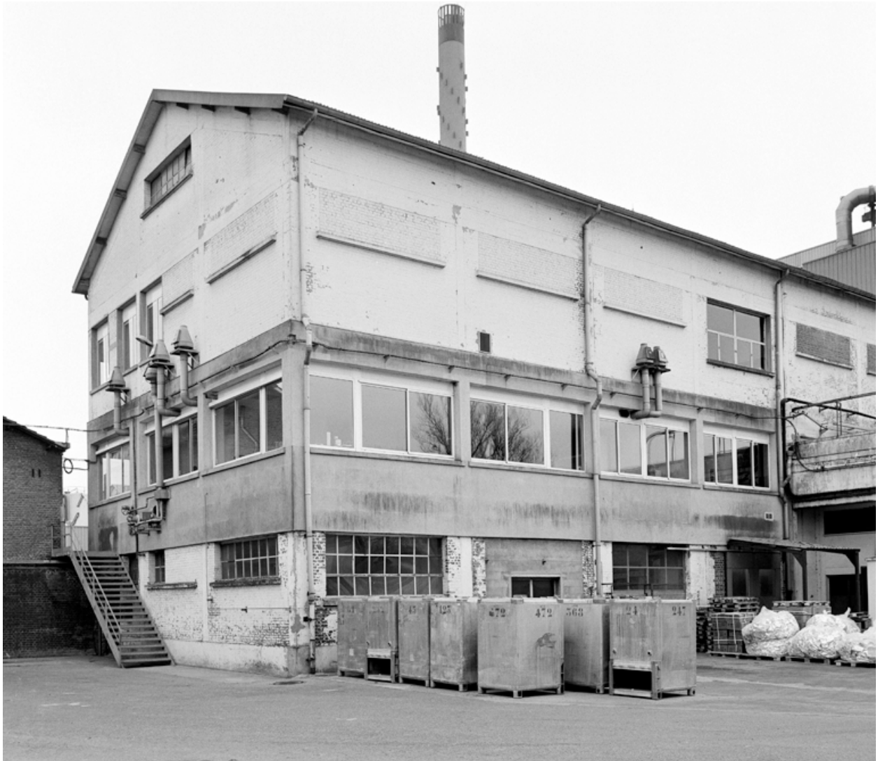
Vue partielle nord du laboratoire précédemment occupé par l'atelier de fabrication de biberons prêts à l'emploi.