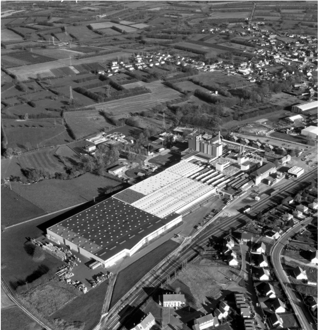
Vue aérienne de l'usine, depuis le sud-ouest.