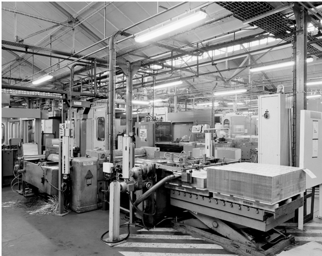
Intérieur de la ferblanterie : début de la chaîne de façonnage des boîtes en métal, à partir de plaques de métal imprimées.