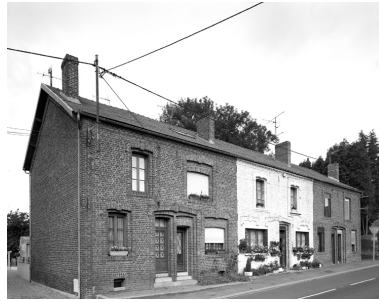
Vue partielle de la cité de l'usine Nestlé.