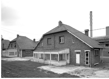
Elévation sur jardin d'une des maisons des cadres de l'usine.