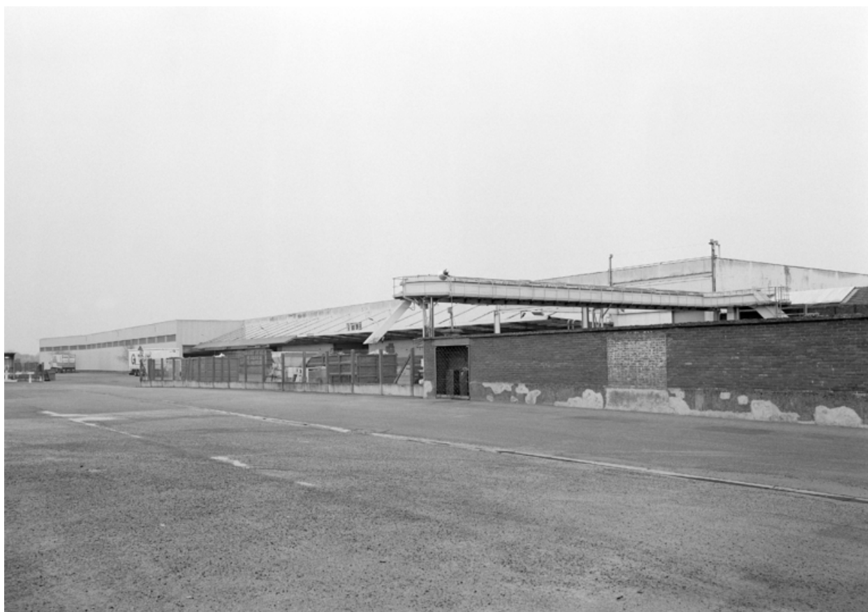
Vue de la partie sud de l'usine, occupée par les stocks.