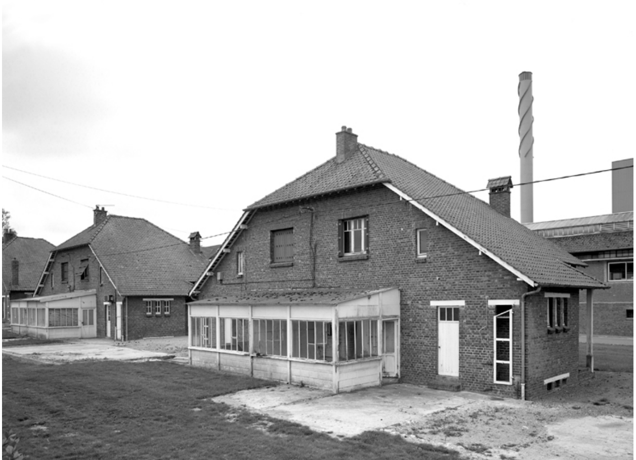
Elévation sur jardin d'une des maisons des cadres de l'usine.