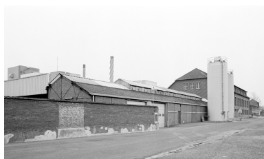
Vue du bâtiment social et d'un bâtiment à usage de remise et entrepôt, depuis le sud-ouest. IVR22_19960200124X