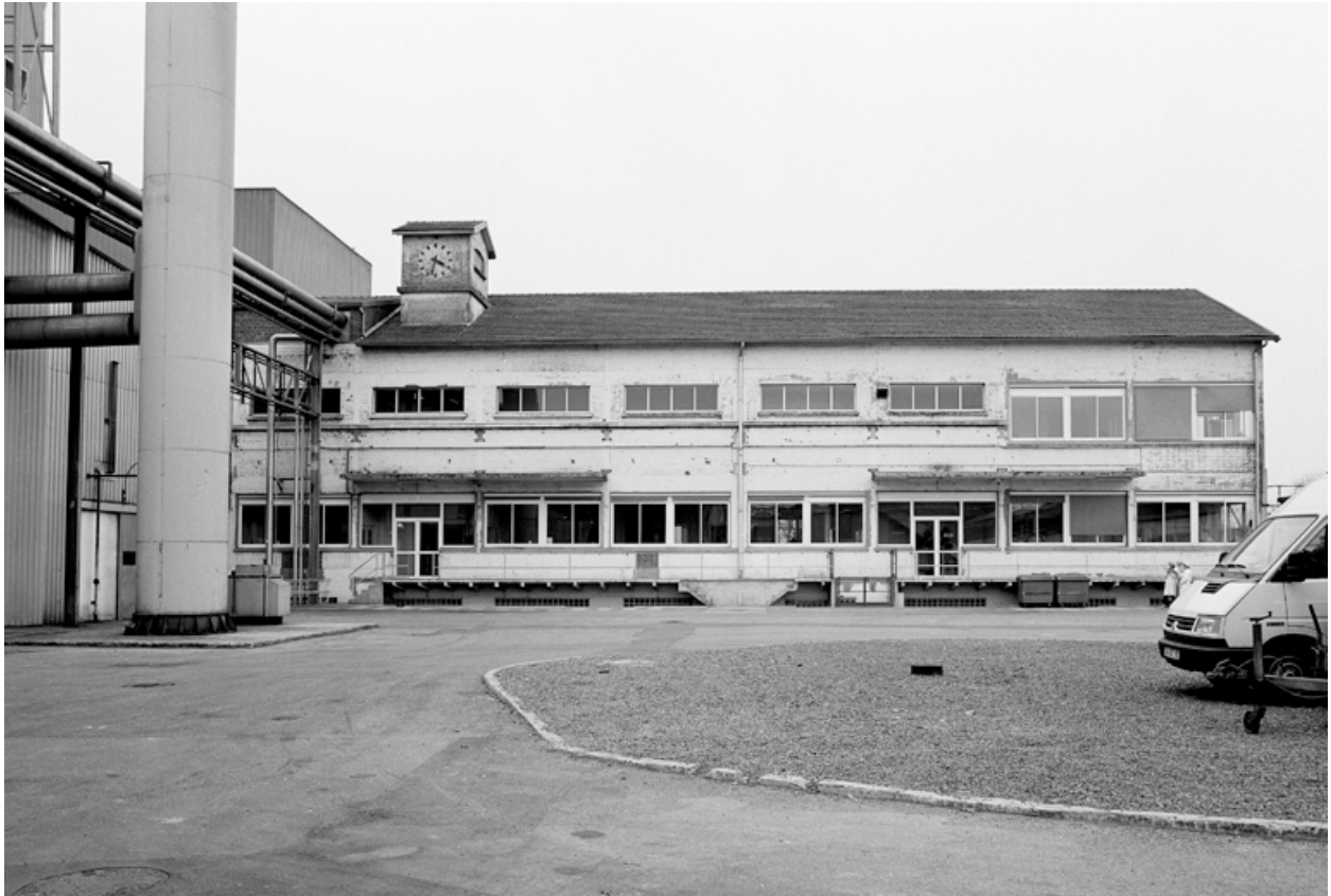
Elévation sud du laboratoire précédemment occupé par l'atelier de fabrication de biberons prêts à l'emploi.