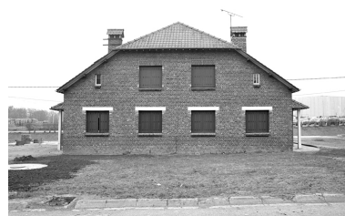
Façade d'une des maisons de la cité des cadres de l'usine, renfermant deux logements symétriques.