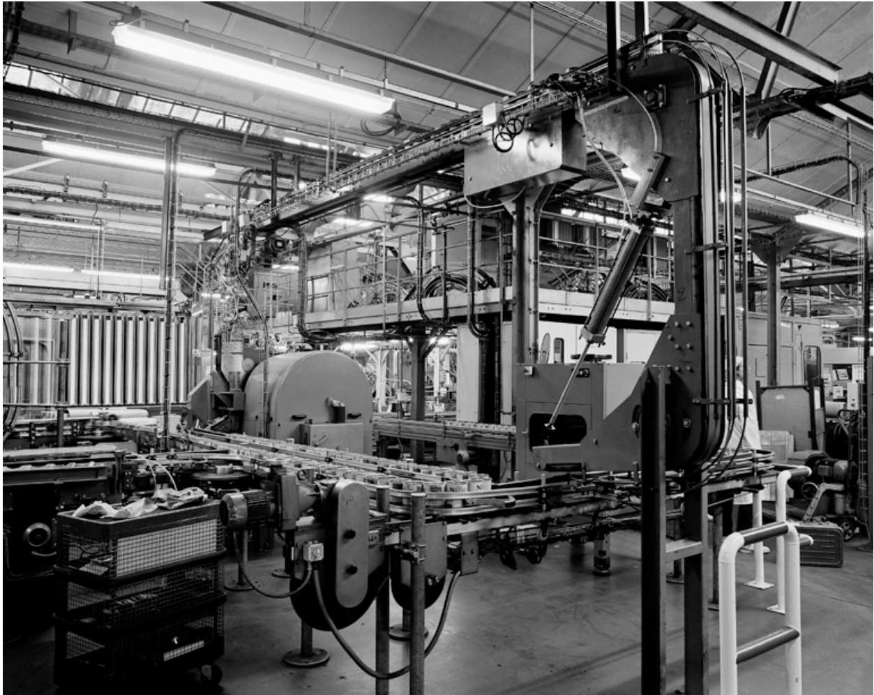
Vue intérieure partielle de la ferblanterie : fabrication des boîtes en métal destinées à contenir le lait en poudre.