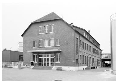
Vue générale nord-est du bâtiment social. IVR22_19960200127X