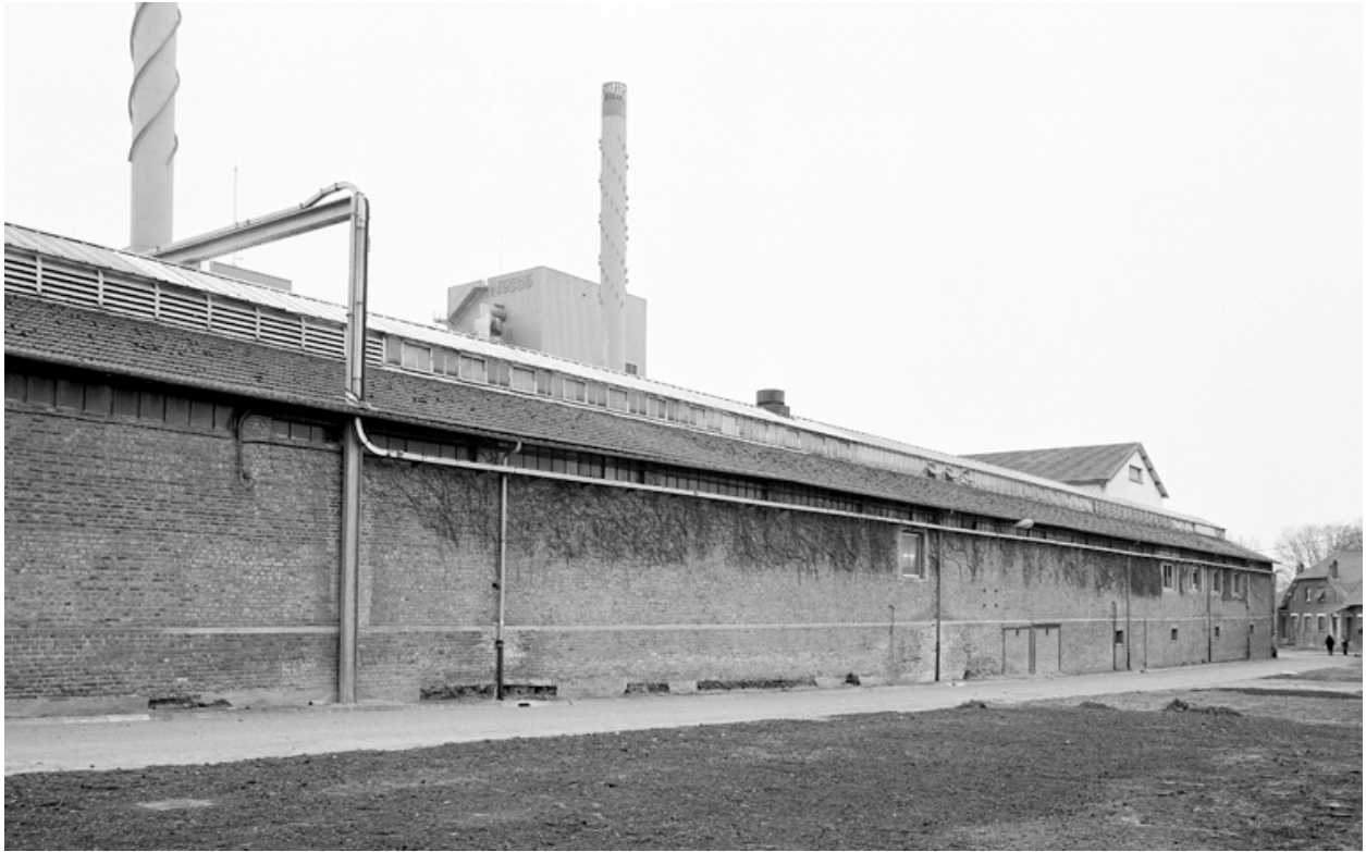
Elévation externe (est) du magasin général et de l'atelier de réparation.