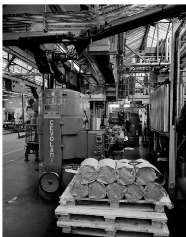
Vue intérieure partielle de la ferblanterie où sont fabriquées les boîtes de métal destinées à contenir le lait en poudre. IVR22_19960200137X