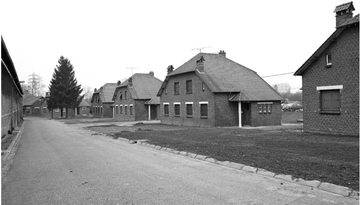
Vue générale de l'ancienne cité des cadres de l'usine.