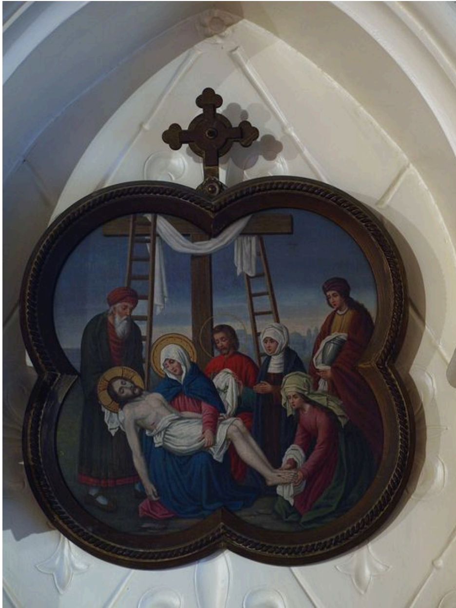
Vue générale d'une station