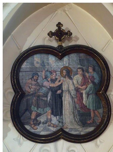
Vue générale d'une station IVR31_20106204784NUCA