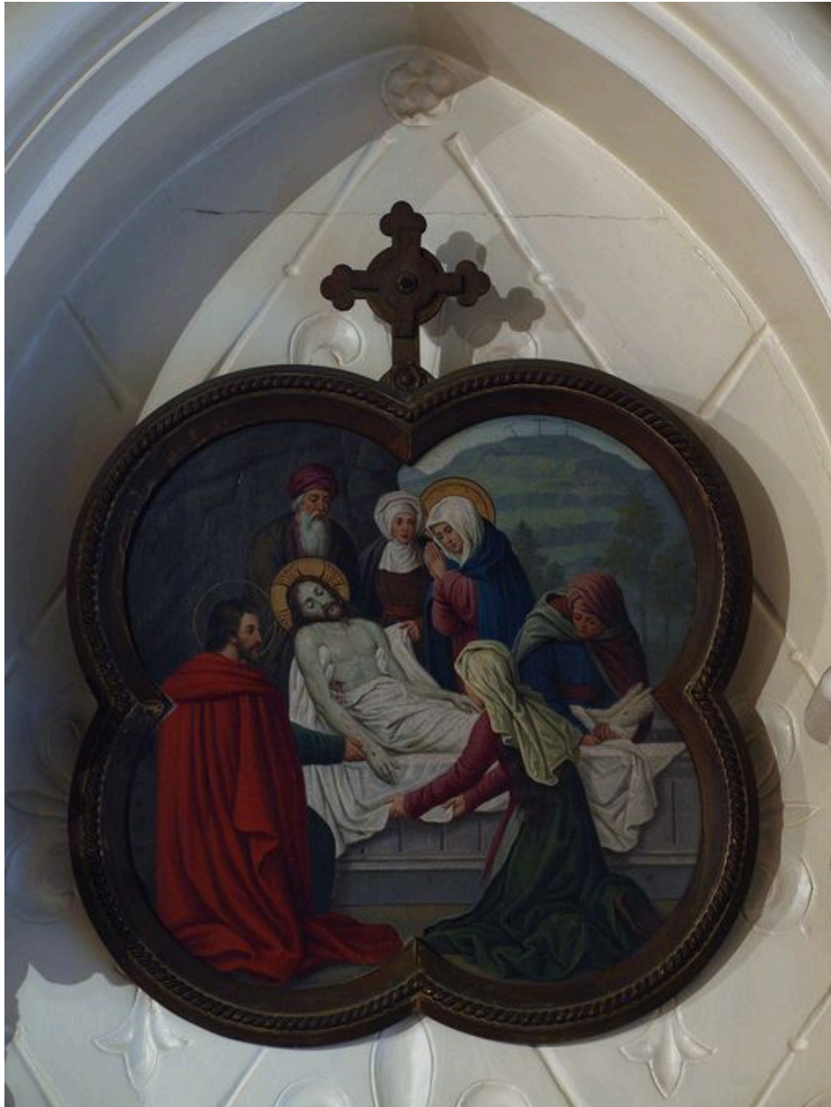
Vue générale d'une station