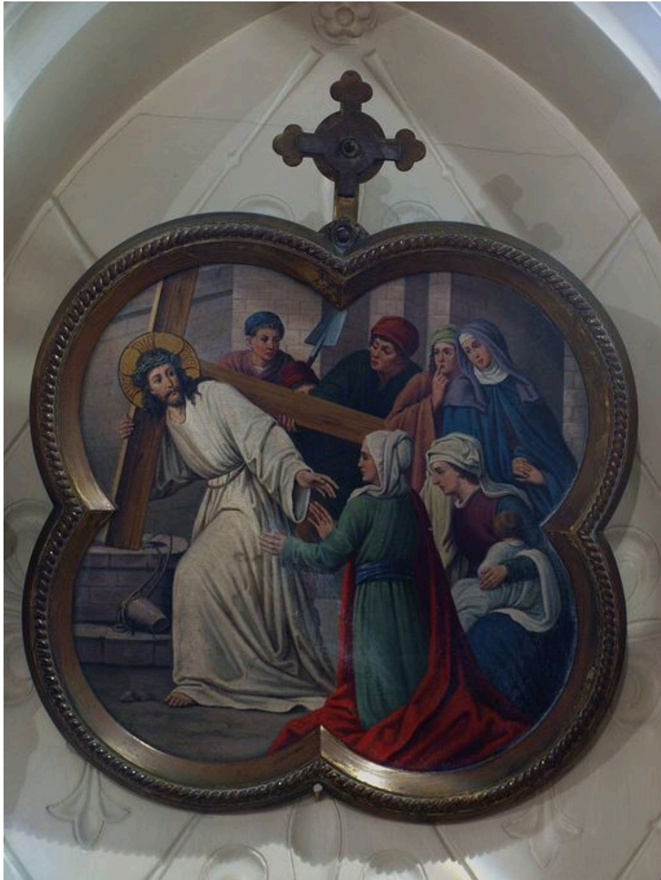
Vue générale d'une station