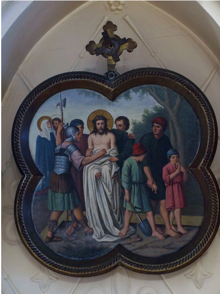
Vue générale d'une station