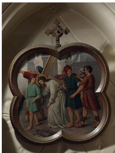
Vue générale d'une station