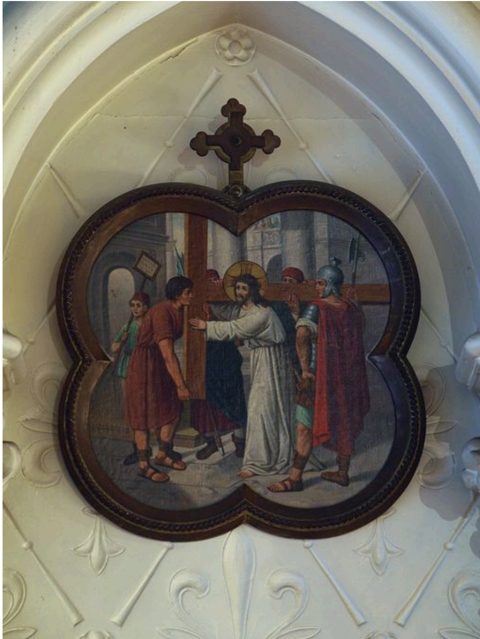
Vue générale d'une station