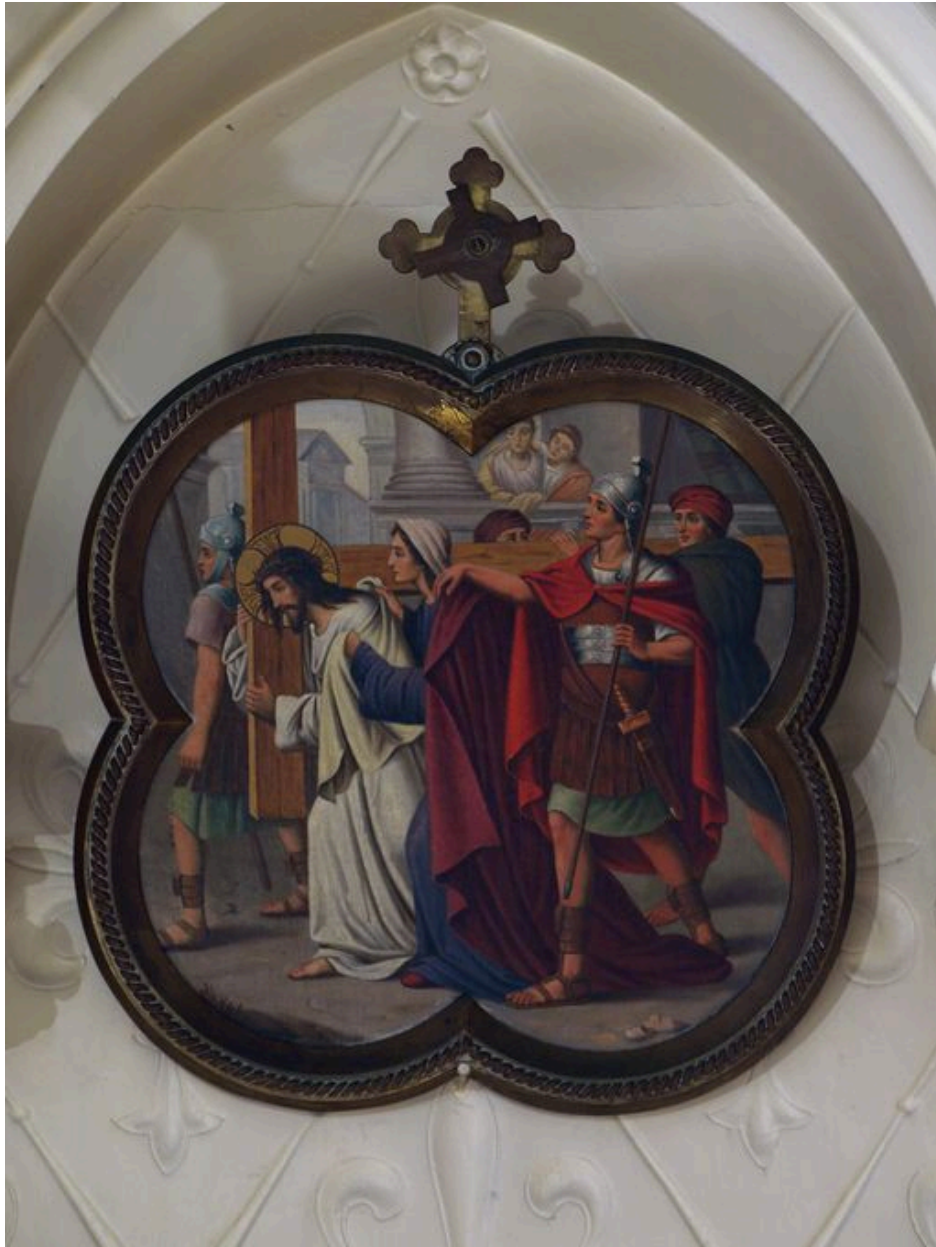
Vue générale d'une station