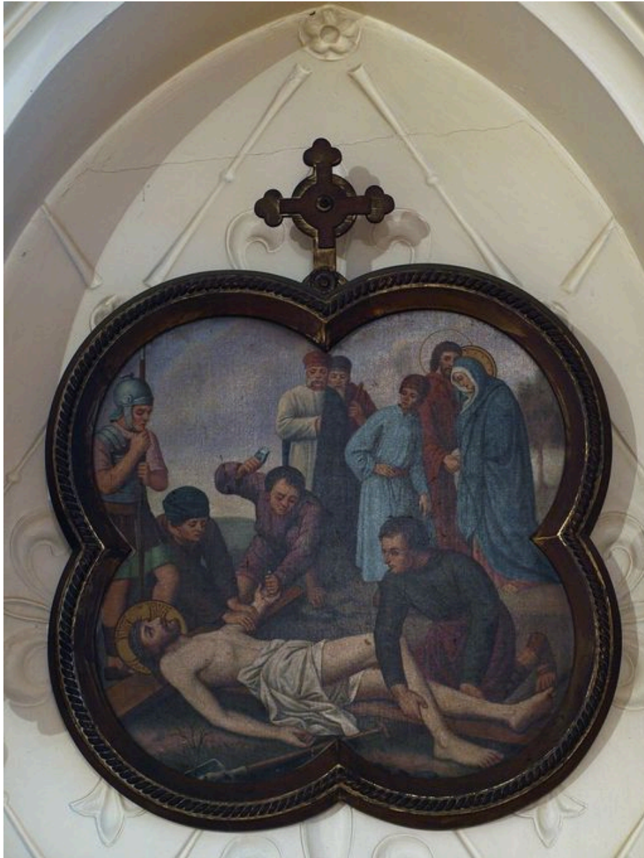
Vue générale d'une station