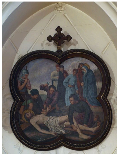
Vue générale d'une station