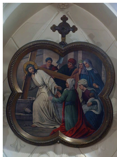
Vue générale d'une station