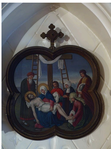
Vue générale d'une station IVR31_20106204788NUCA