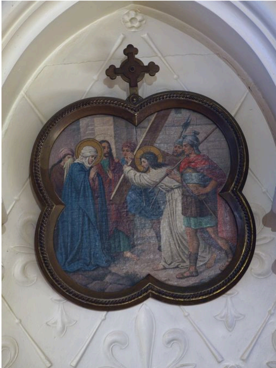
Vue générale d'une station