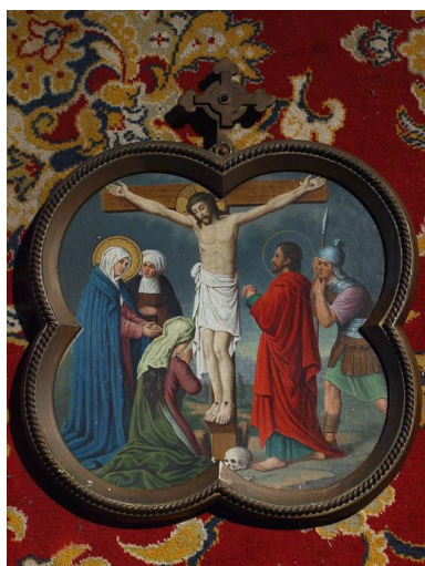
Vue générale d'une station