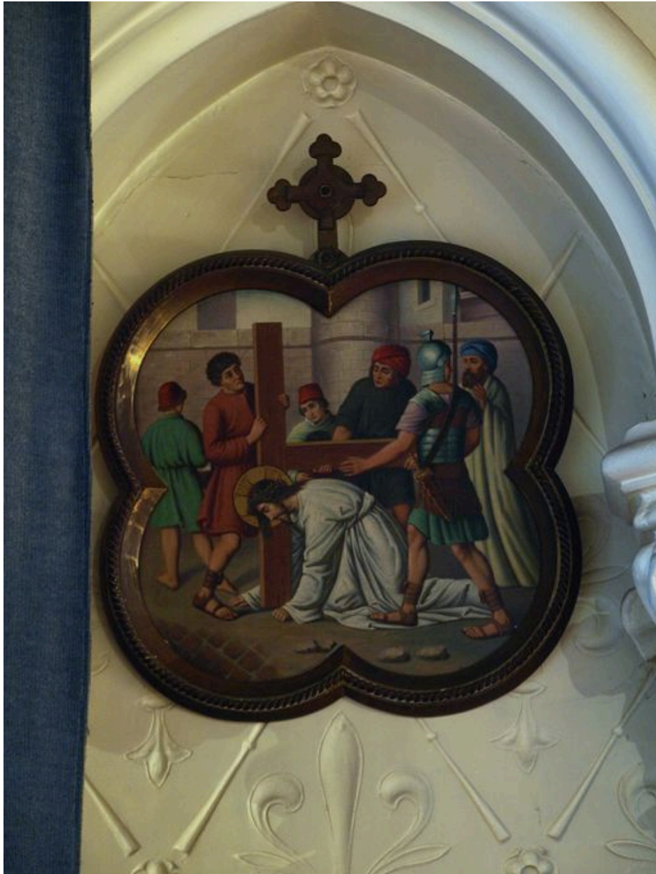
Vue générale d'une station