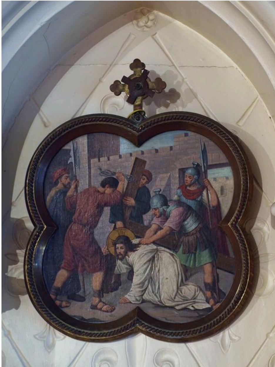
Vue générale d'une station