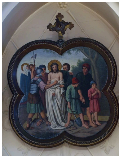
Vue générale d'une station IVR31_20106204782NUCA