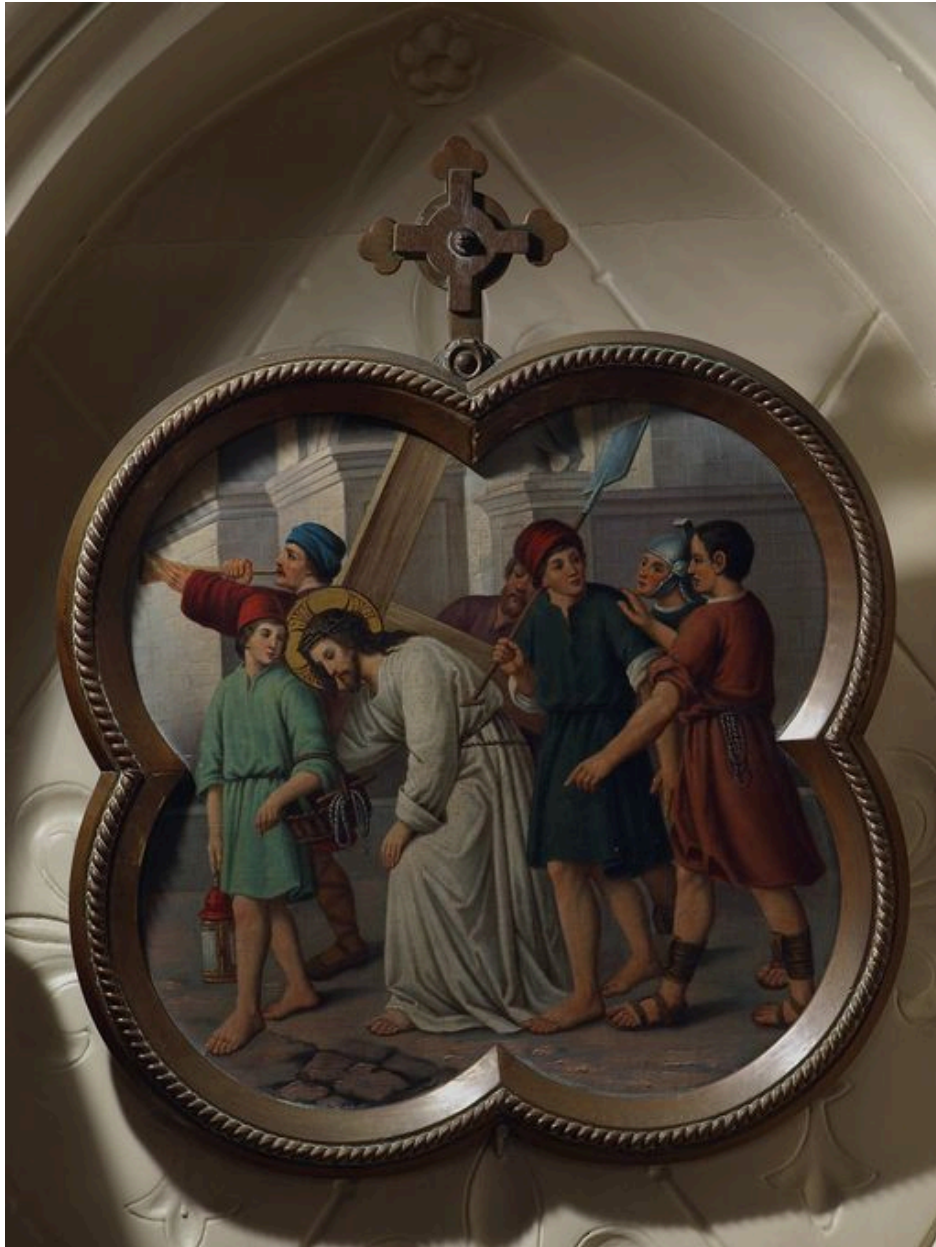
Vue générale d'une station