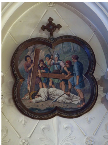
Vue générale d'une station IVR31_20106204793NUCA