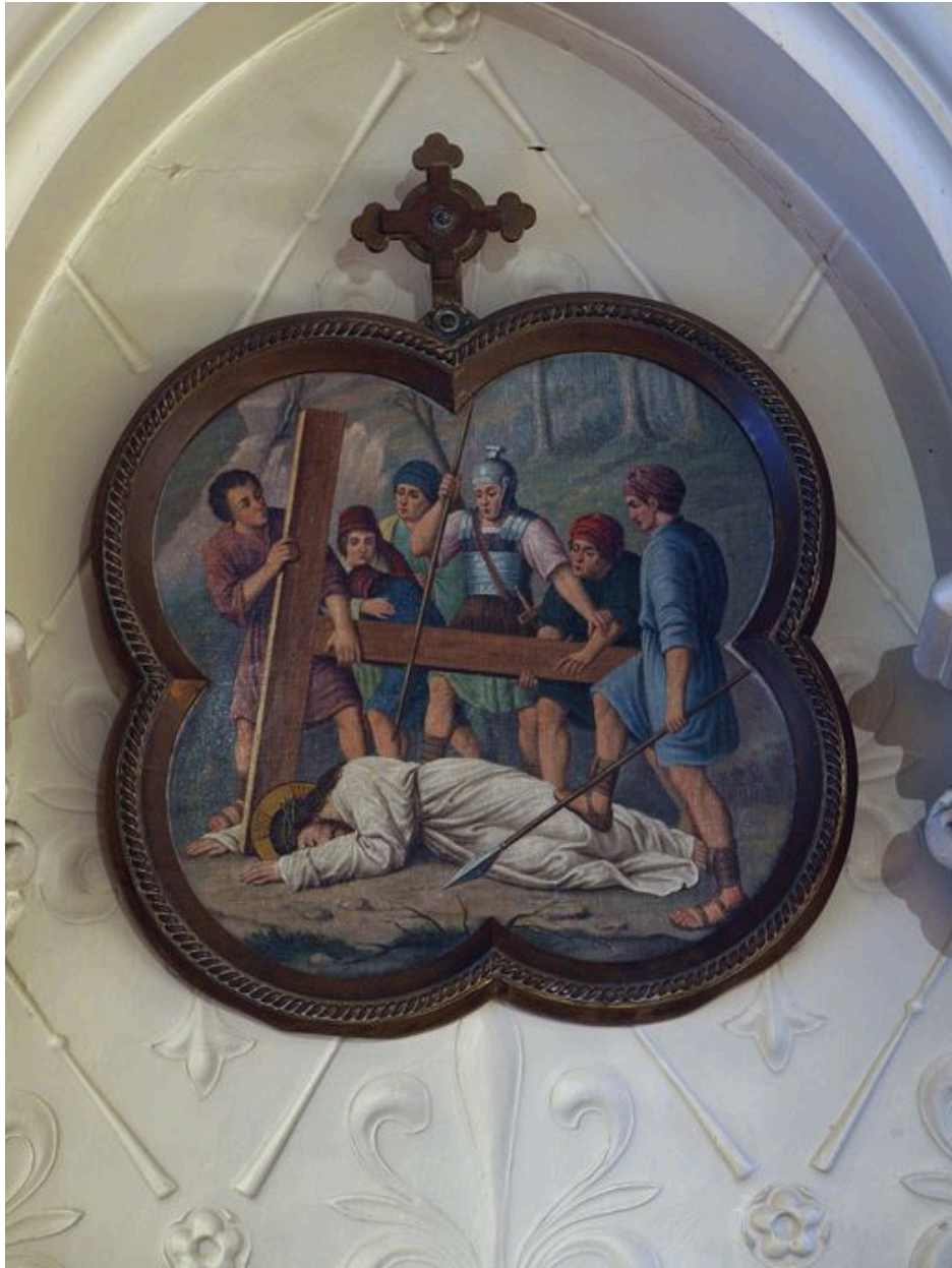
Vue générale d'une station