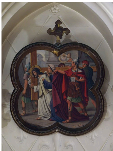
Vue générale d'une station IVR31_20106204791NUCA