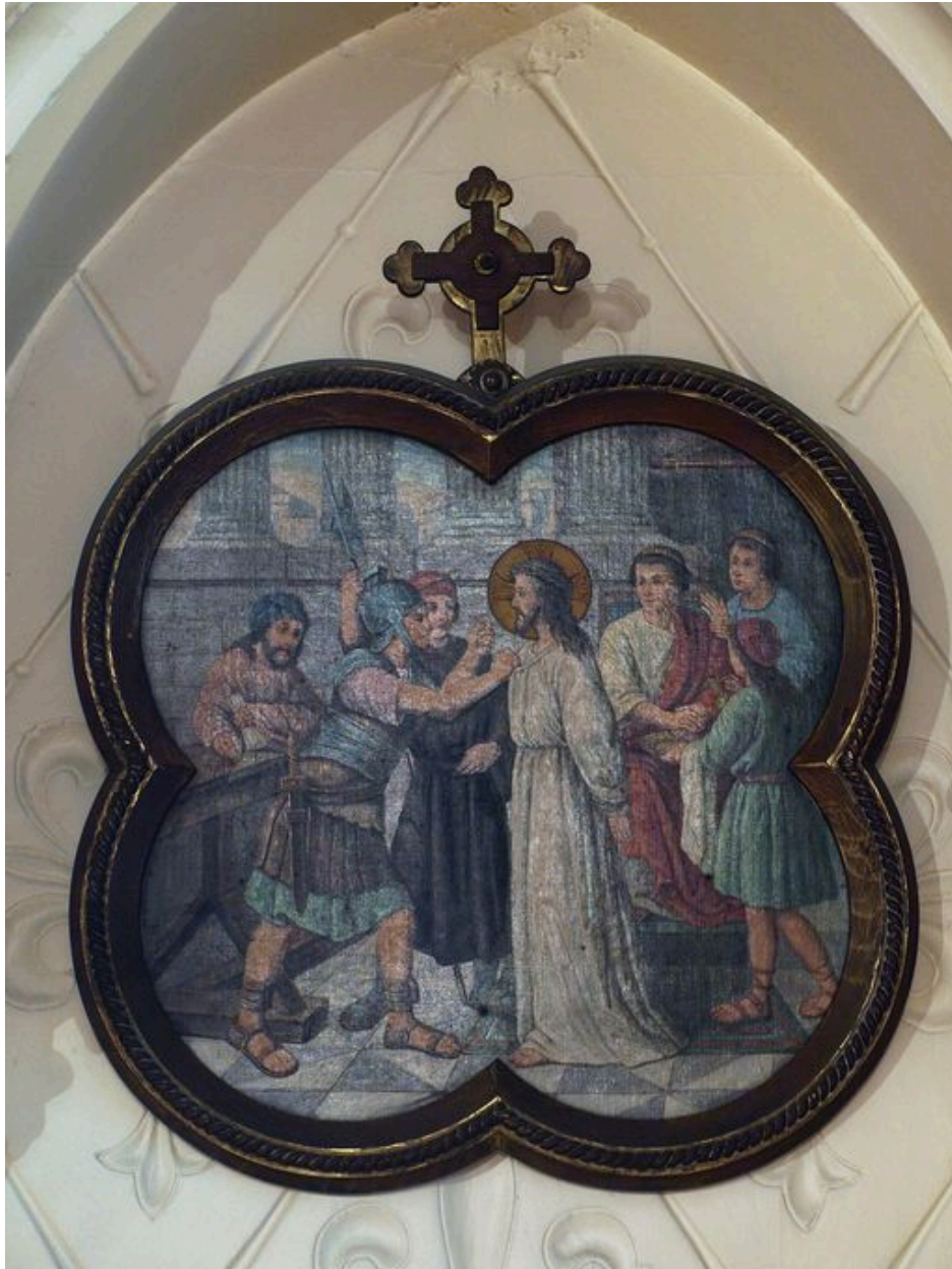
Vue générale d'une station