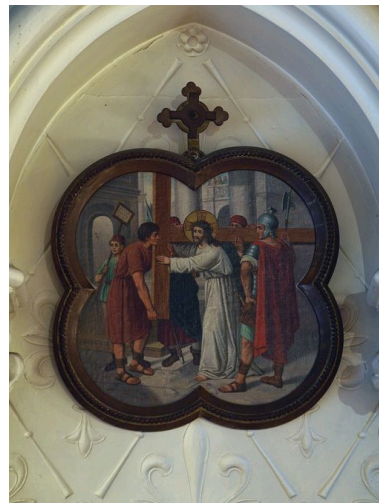
Vue générale d'une station IVR31_20106204792NUCA