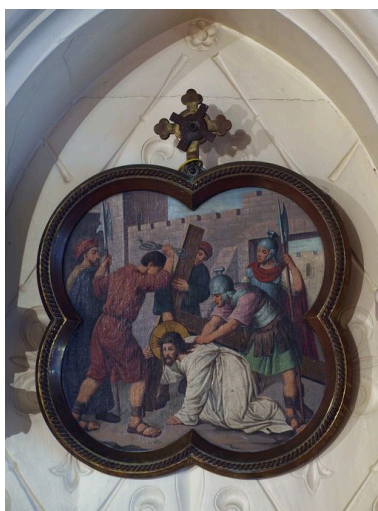
Vue générale d'une station