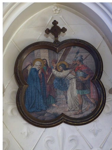
Vue générale d'une station IVR31_20106204794NUCA