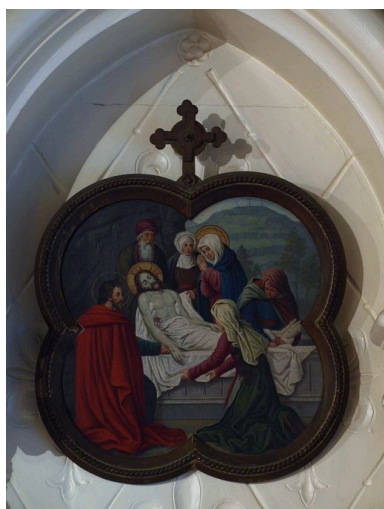
Vue générale d'une station