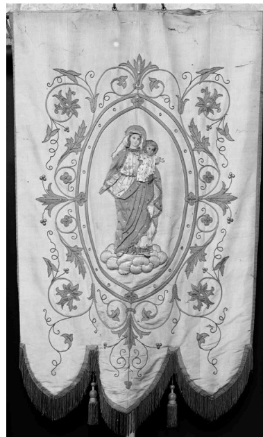
Bannière, 1922 : Vierge à l'Enfant. IVR22_19856000764X