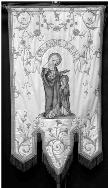
Bannière, 20e siècle : Education de la Vierge. IVR22_19856000763X