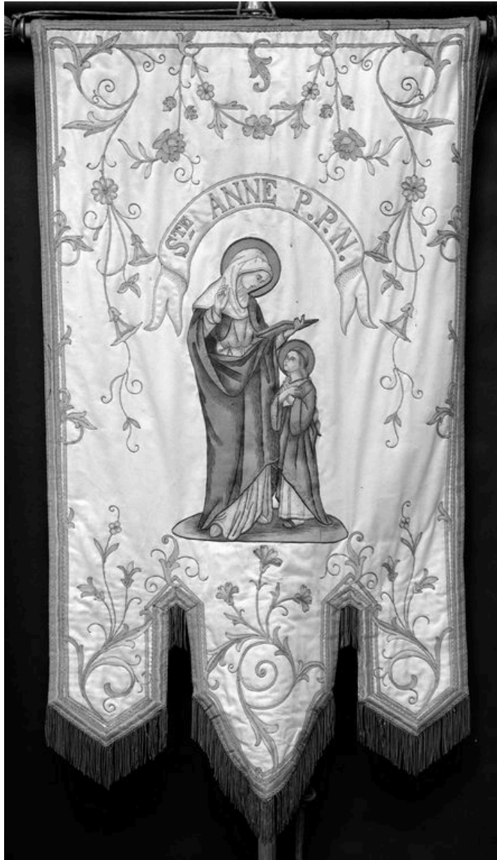
Bannière, 20e siècle : Education de la Vierge.