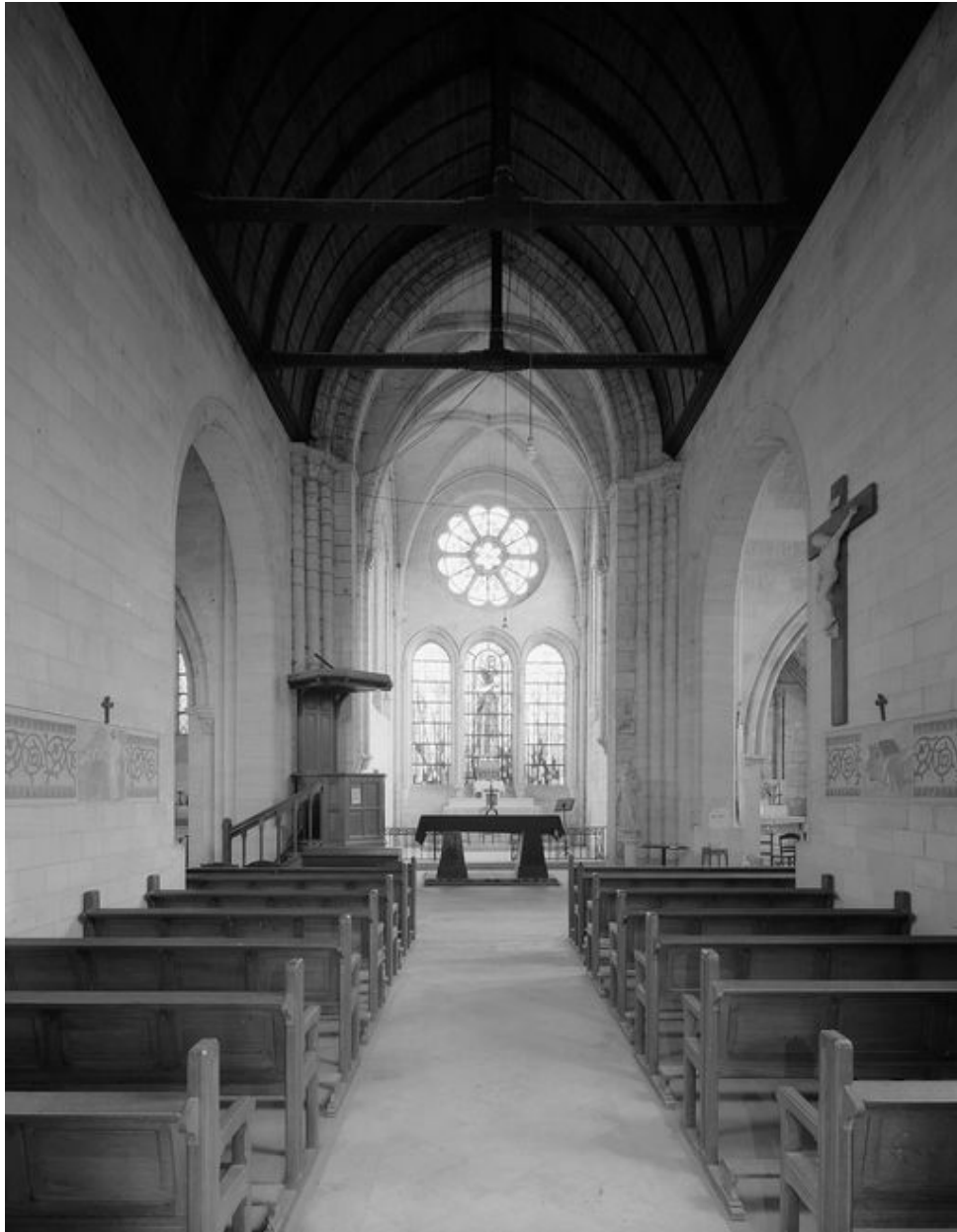
Vue intérieure vers le chœur.