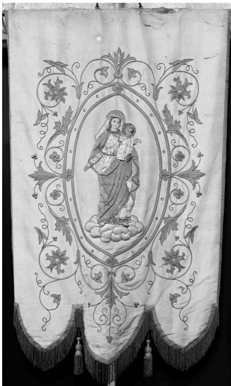
Bannière, 1922 : Vierge à l'Enfant.