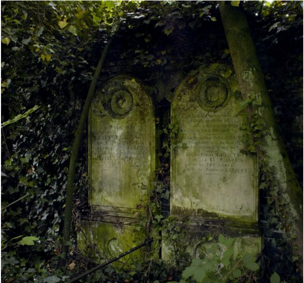
Vue de situation : tombeau à droite de l'image.