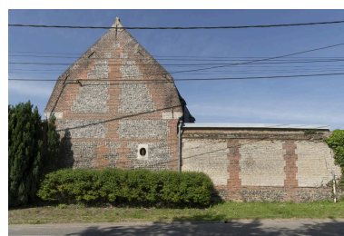
Pignon est du logis avec une partie du mur de clôture, vue de face depuis la rue Principale.