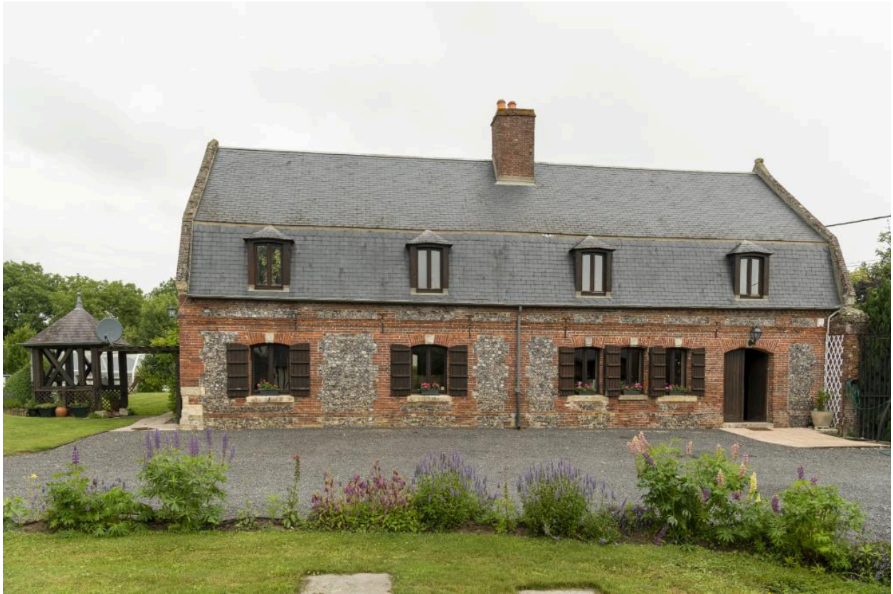
Vue du logis (ancienne maison du fermier ?) depuis la sud.