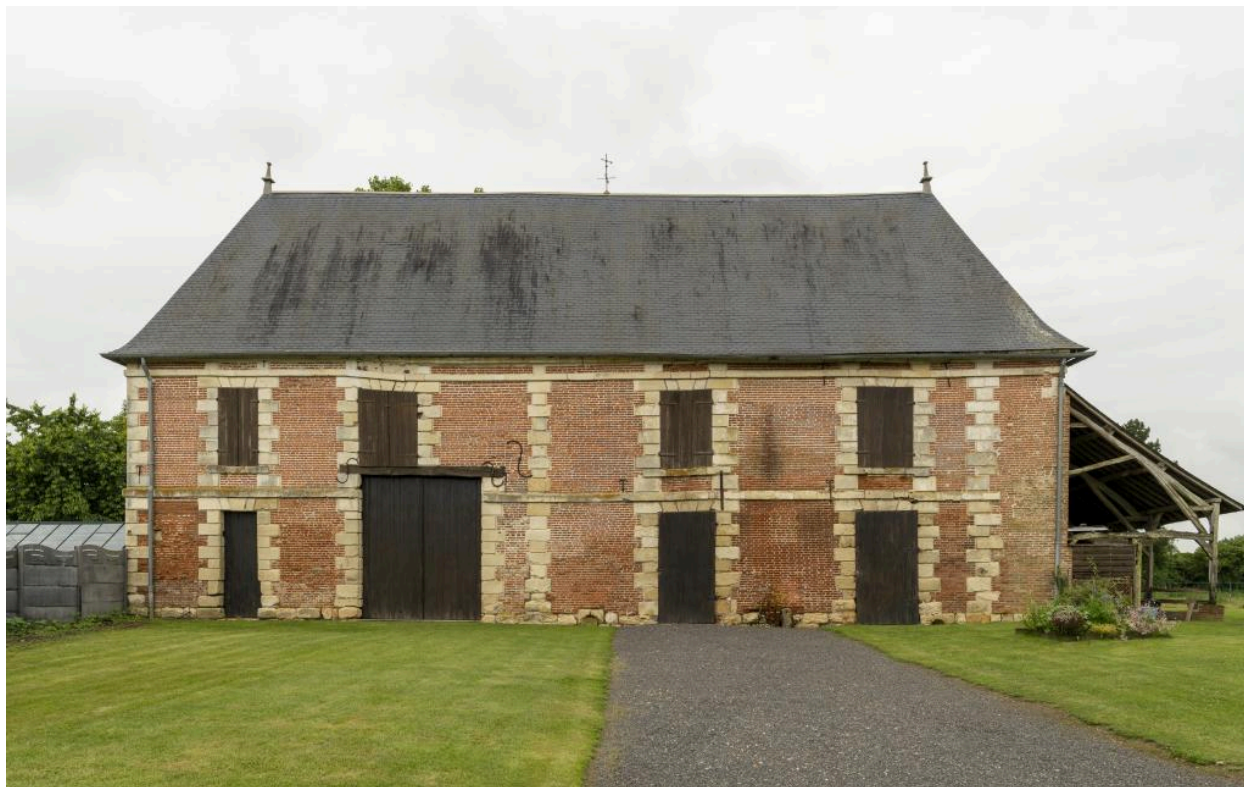
Façade est de l'ancien logis du manoir (1616).