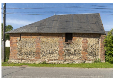
Façade sud d'un bâtiment agricole, vue depuis la rue Principale. IVR32_20216000549NUCA