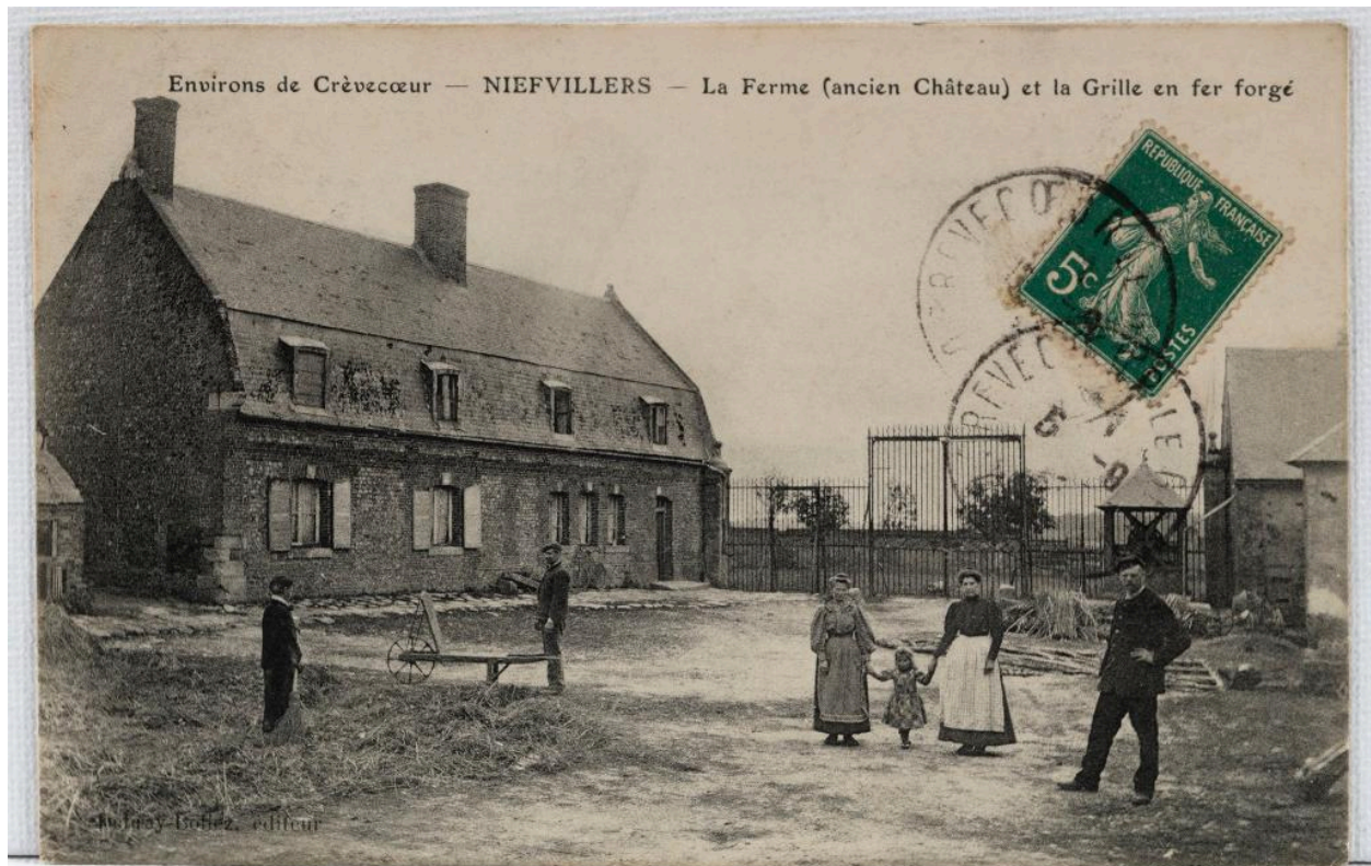
Viefvillers (Oise). La Ferme (ancien château de Viefvillers) et la grille en fer forgé, carte postale, Debray-Bollez, [vers 1910] (coll. part.).