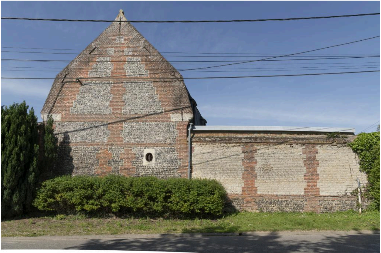
Pignon est du logis avec une partie du mur de clôture, vue de face depuis la rue Principale.