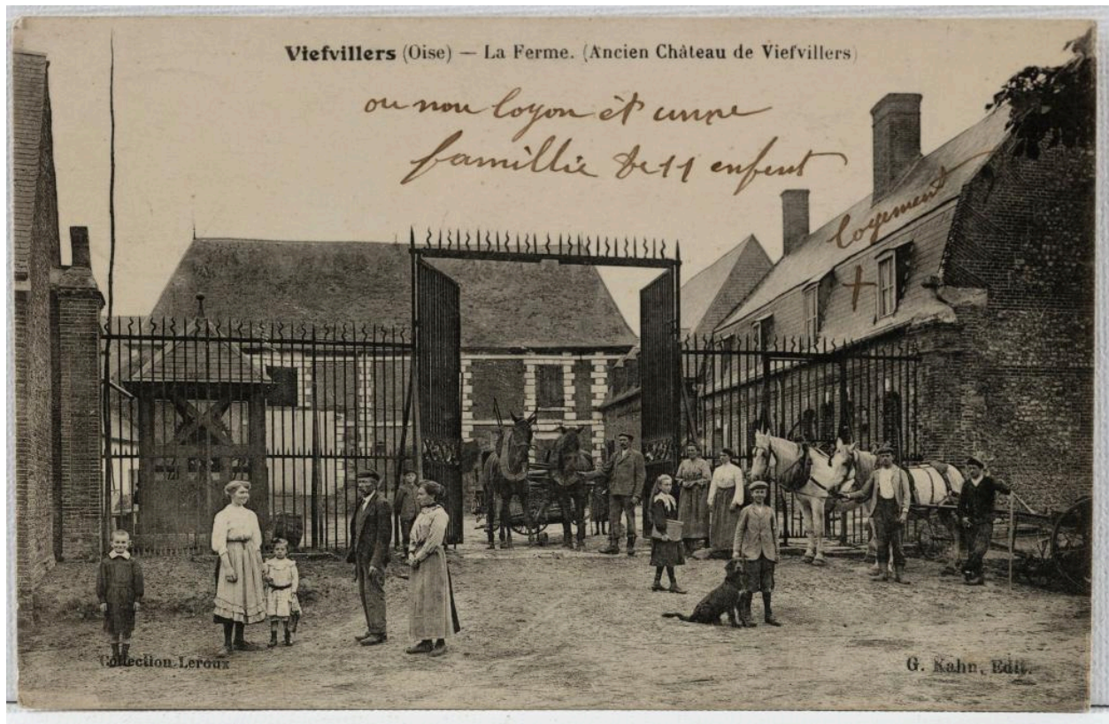
Viefvillers (Oise). La Ferme (ancien château de Viefvillers), carte postale, G. Kahn éd., [1er quart du 20e siècle] (coll. part.).