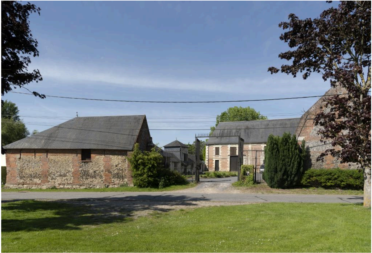
Vue générale de la ferme côté est depuis la place publique