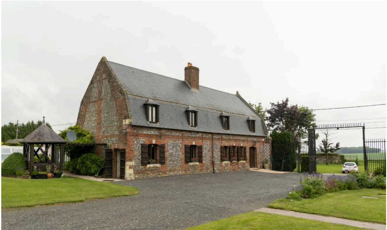
Vue générale du logis et du portail d'entrée.