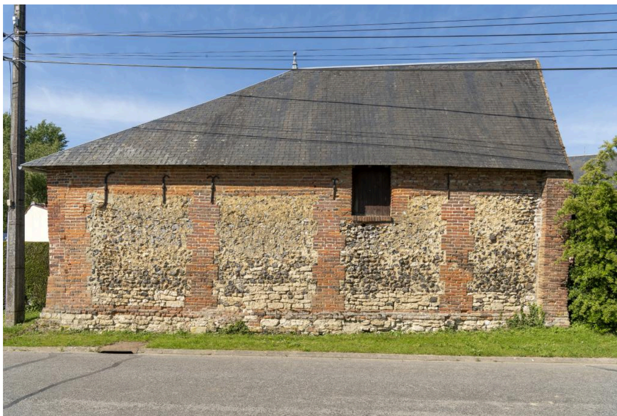
Façade sud d'un bâtiment agricole, vue depuis la rue Principale.