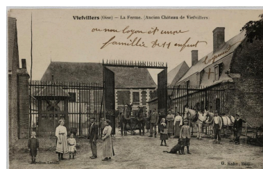
Vieffvillers (Oise). La Ferme (ancien château de Vieffvillers), carte postale, G. Kahn éd., [1er quart du 20e siècle] (coll. part.). IVR32_20226000093NUCA