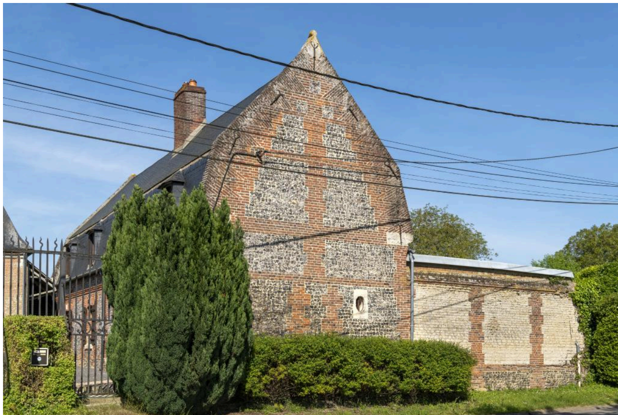
Pignon est et façade sud du logis, prolongé par le mur de clôture, vue de trois quarts depuis la rue Principale.