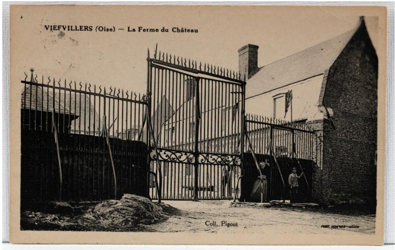
Viefvillers (Oise). La ferme du château, carte postale, coll. Pigout [1er quart du 20e siècle] (coll. part.).