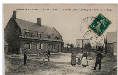
Vieffvillers (Oise). La Ferme (ancien château de Vieffvillers) et la grille en fer forgé, carte postale, Debray-Bollez, [vers 1910] (coll. part.). IVR32_20226000086NUCA