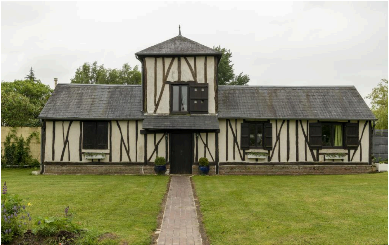
Ancien bâtiments agricoles (limite des 19e et 20e siècles ?).