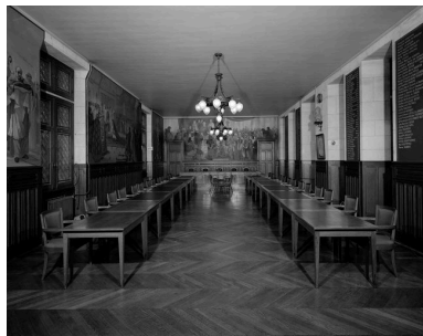
Vue générale de la salle du Conseil. IVR22_19866000027V