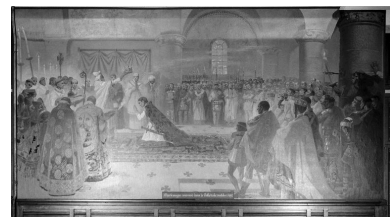
Mur est : Charlemagne couronné dans la cathédrale.