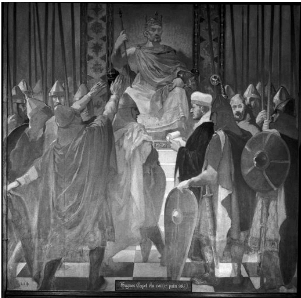
Mur est : Hugues Capet élu roi.