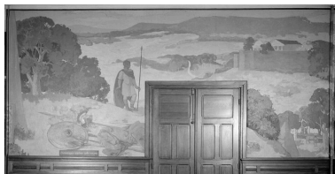
Mur ouest : Noviomagus oppidum gallo-romain.