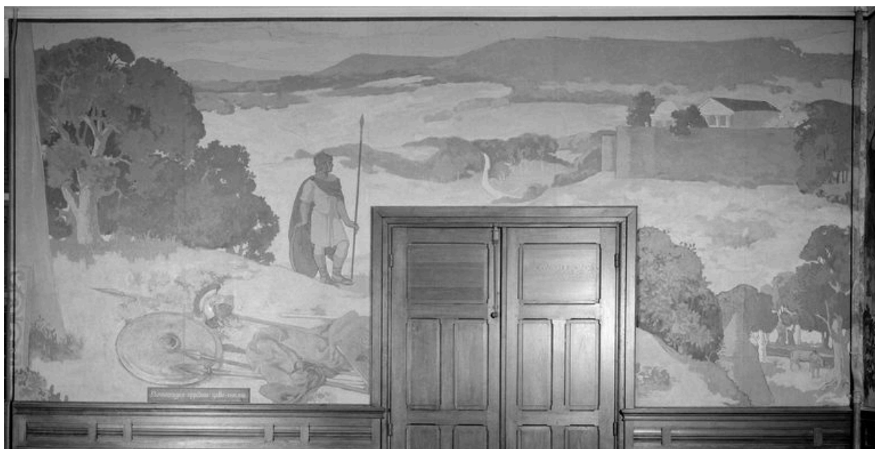
Mur ouest : Noviomagus oppidum gallo-romain.