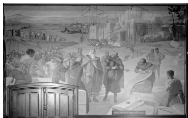
Mur est : Saint Eloi fonde un monastère. IVR22_19856001532X