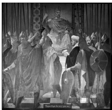
Mur est : Hugues Capet élu roi.