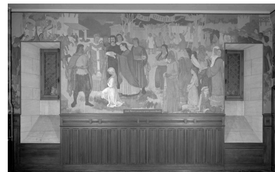
Mur nord : Saint Médard couronne la 1ère Rosière. IVR22_19856001521V