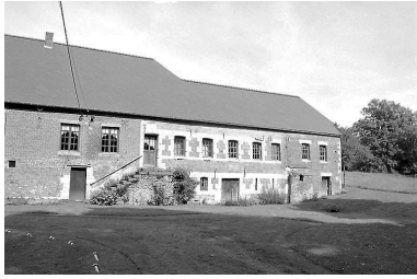
Vue du logis primitif et du moulin. IVR22_19980202382Z