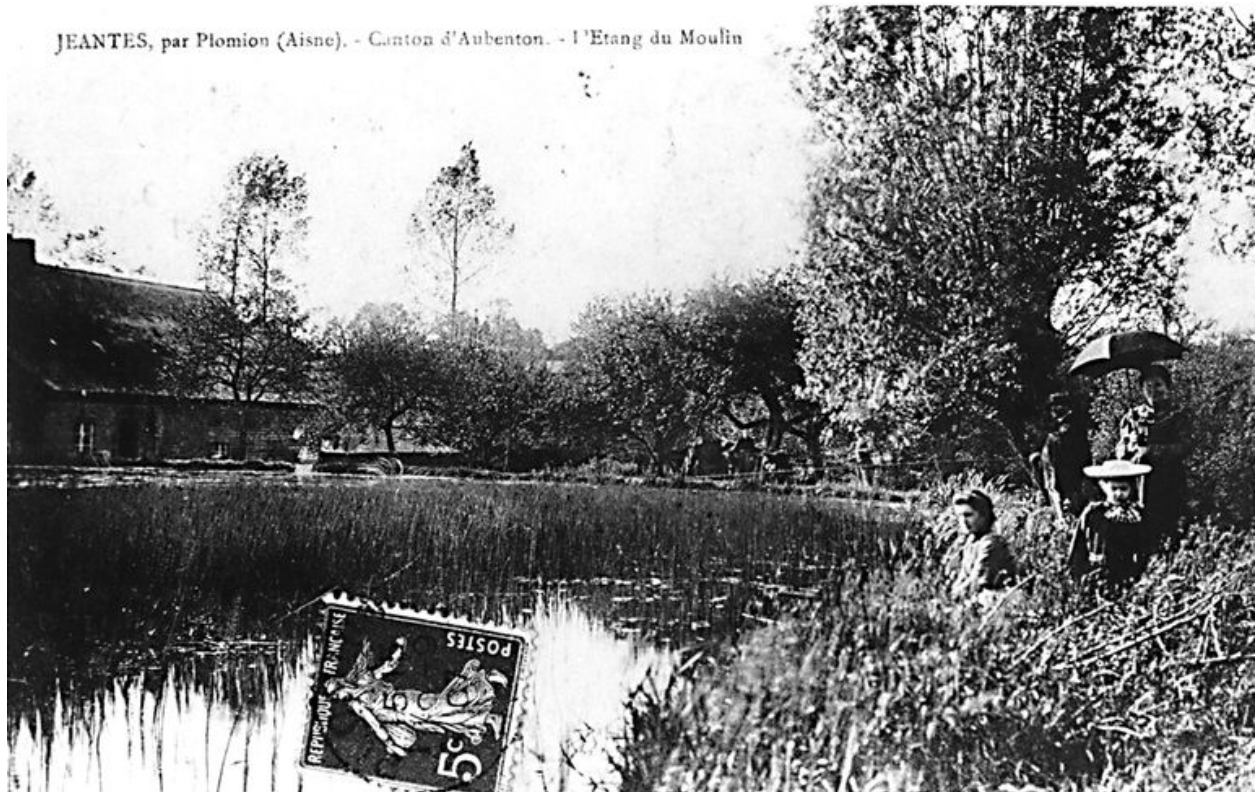
Vue ancienne du moulin avec au premier plan, l'étang de dérivation (AP).