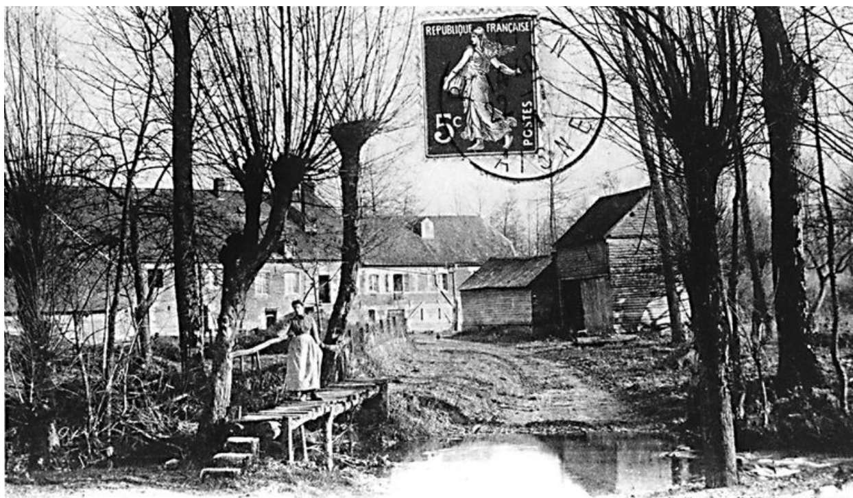
Canton d'Aubenton (Aisne) - JEANTES, par Plomton - Le Moulin