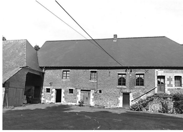
Vue du nouveau logis, des étables et de la grange.