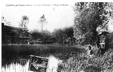
Vue ancienne du moulin avec au premier plan, l'étang de dérivation (AP).