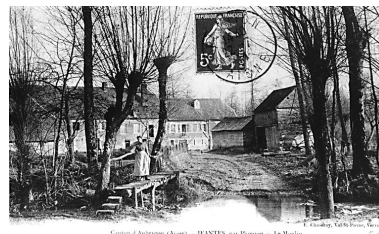
Vue ancienne des bâtiments du moulin, depuis l'ouest (AP).