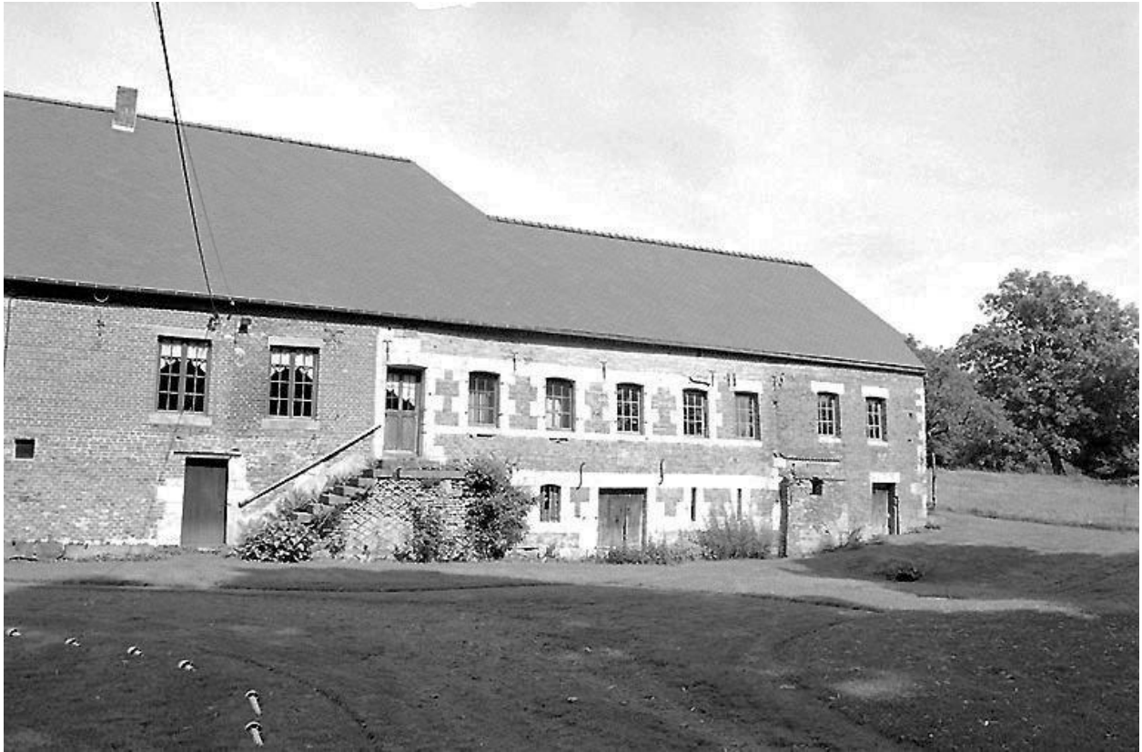
Vue du logis primitif et du moulin.