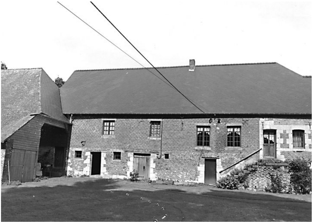
Vue du nouveau logis, des étables et de la grange.