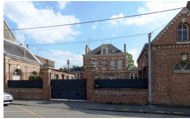
Vue générale. IVR32_20168005727NUCA