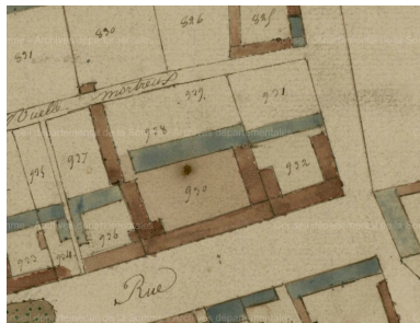
Extrait du cadastre napoléonien. Section E, 1836 (AD Somme ; 248_DP).