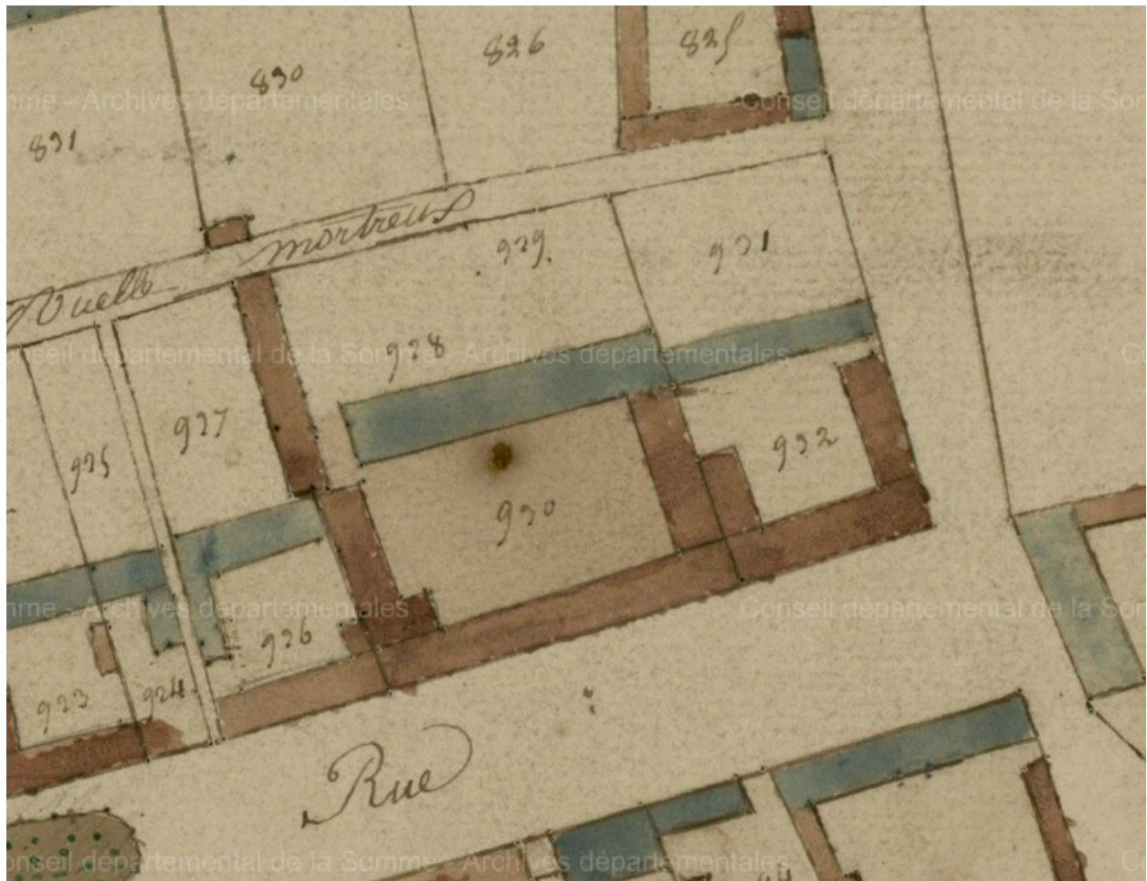
Extrait du cadastre napoléonien. Section E, 1836 (AD Somme ; 248_DP).