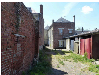
L'ancienne fabrique, vue depuis l'impasse au nord.