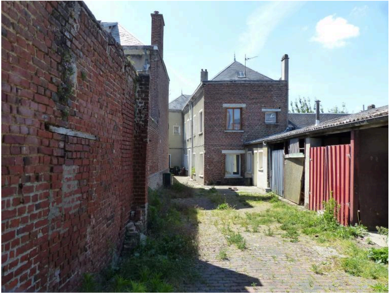
L'ancienne fabrique, vue depuis l'impasse au nord.