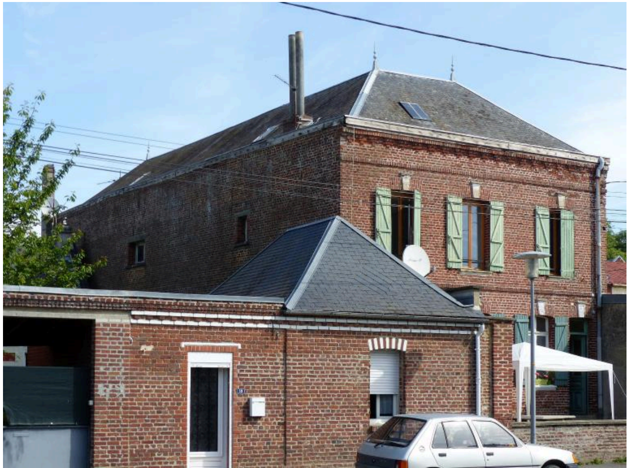
Vue de détail sur les anciens ateliers.