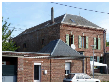
Vue de détail sur les anciens ateliers.

IVR32_20208005063NUCA