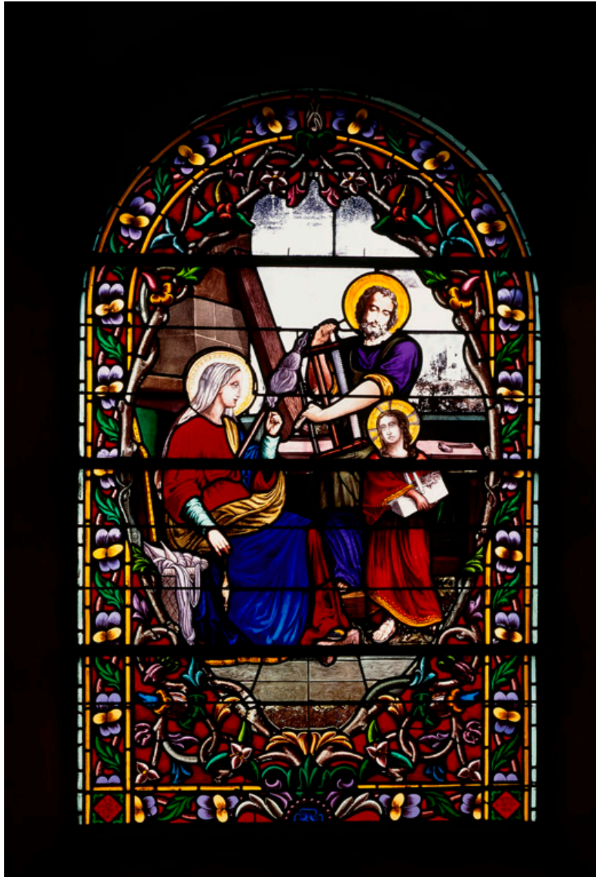
Baie 1 : La sainte Famille.