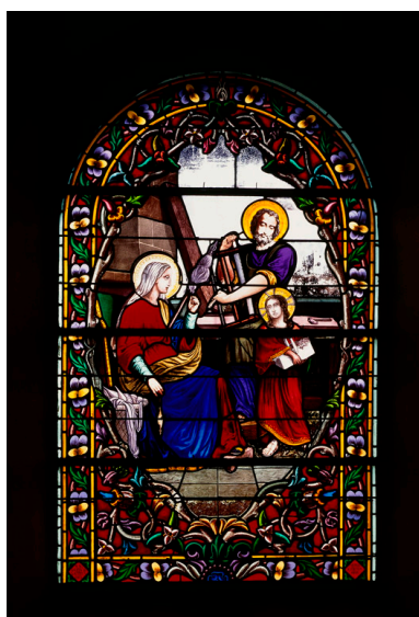
Baie 1 : La sainte Famille. IVR22_19988000621XA