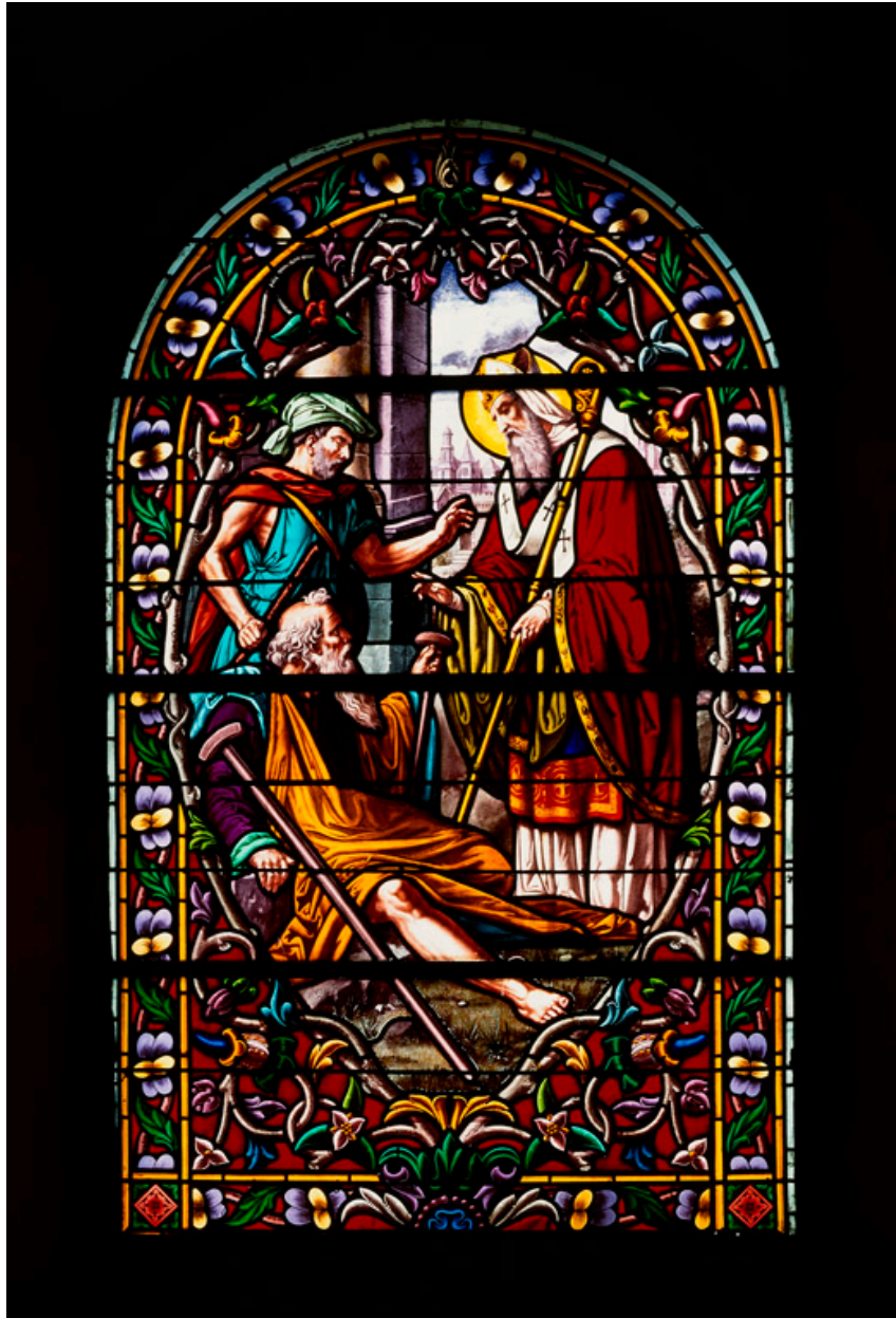
Baie 2 : Saint Vaast guérissant un boîteux.