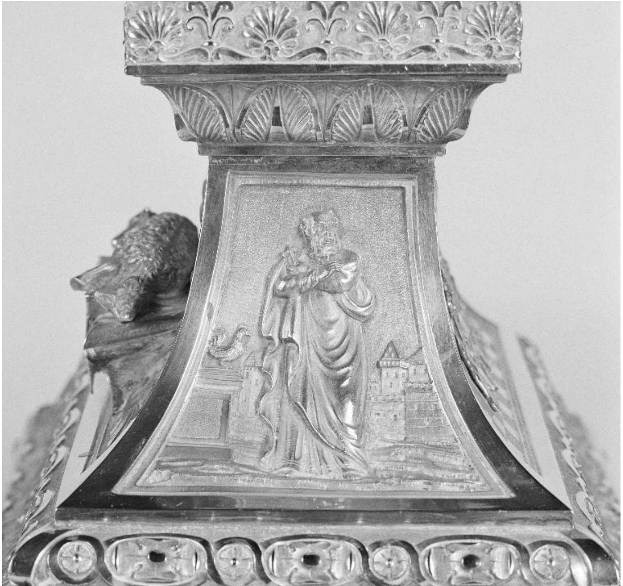
Détail du pied, face latérale gauche : saint Pierre.