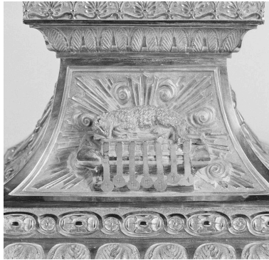
Détail du pied, face postérieure : Agneau mystique avec les Sept Sceaux.