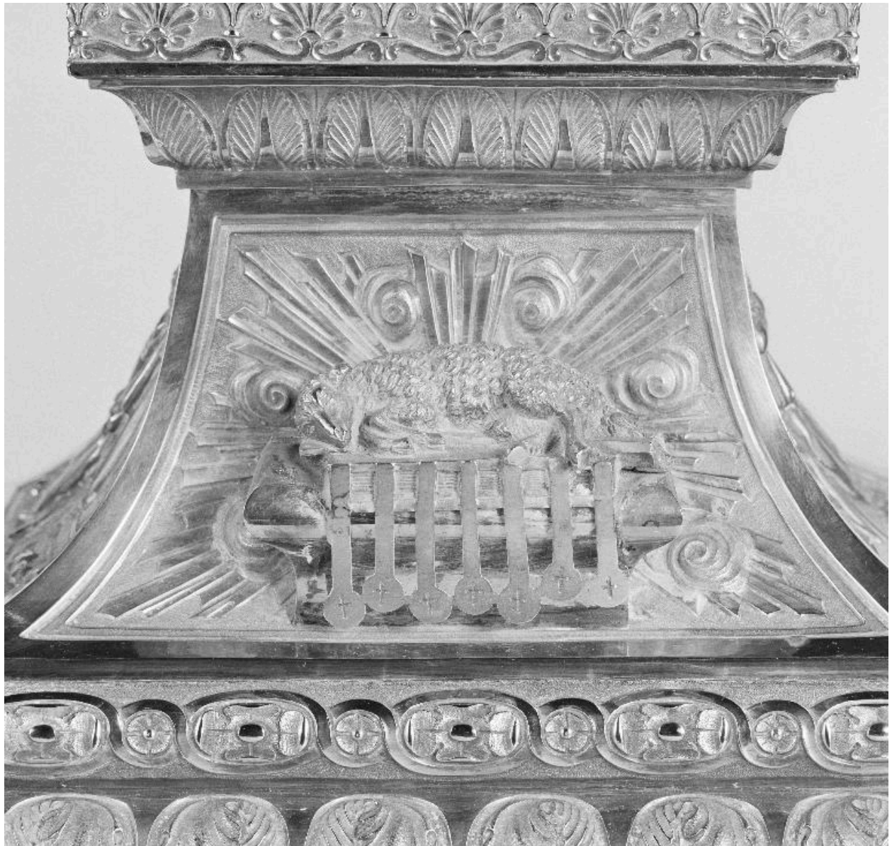
Détail du pied, face postérieure : Agneau mystique avec les Sept Sceaux.