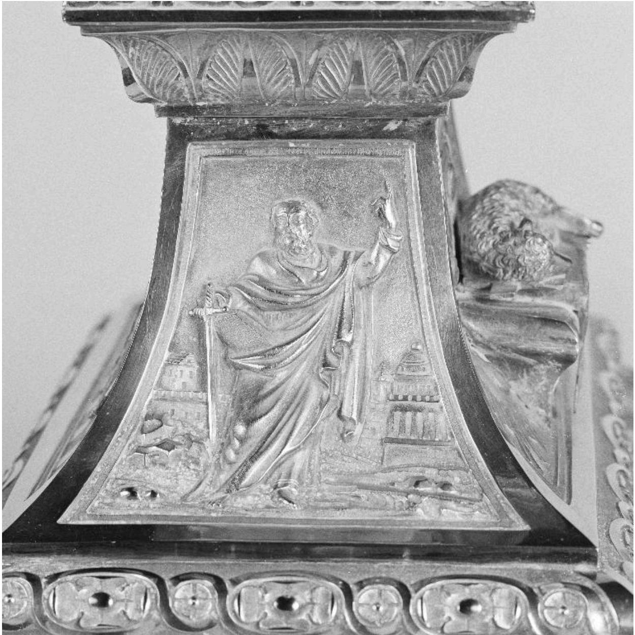
Détail du pied, face latérale droite : saint Paul.