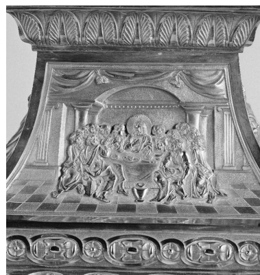
Détail du pied, face antérieure : la Cène.