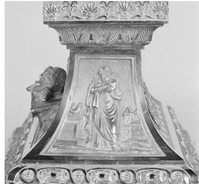
Détail du pied, face latérale gauche : saint Pierre.