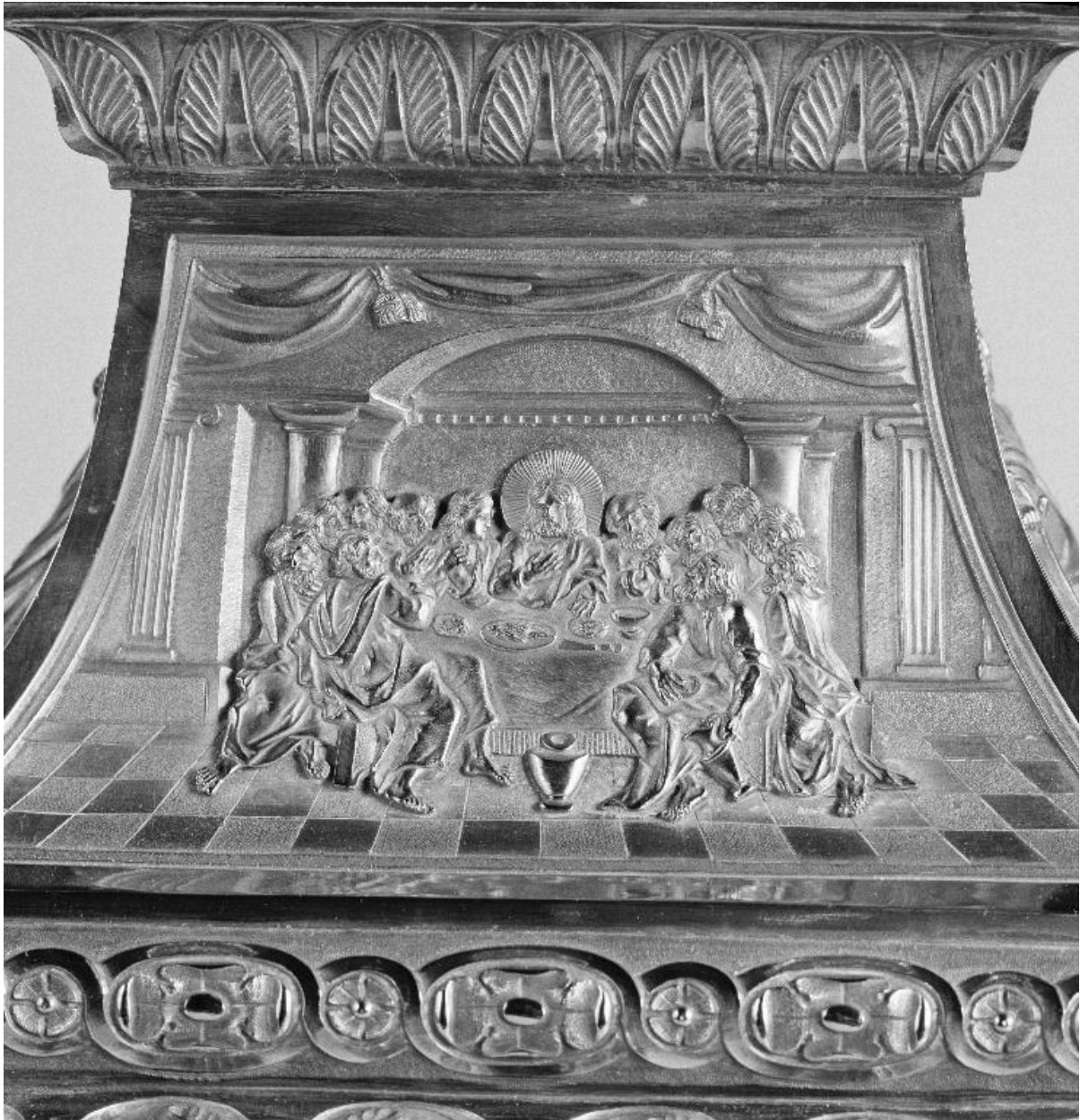
Détail du pied, face antérieure : la Cène.