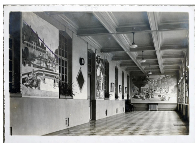
Vue du cloître avec les tableaux de Tellier. Photographie, vers 1938.