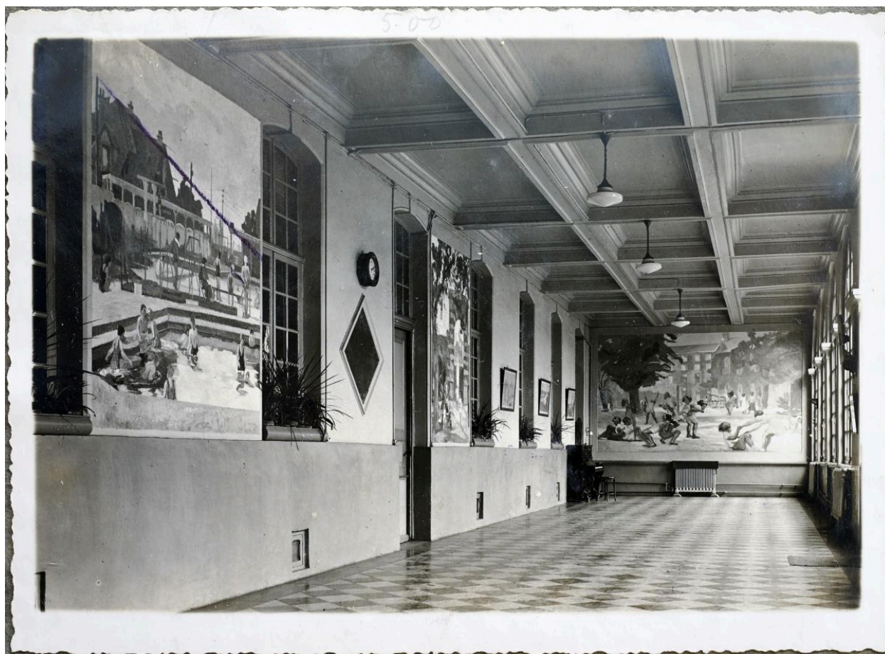
Vue du cloître avec les tableaux de Tellier. Photographie, vers 1938.