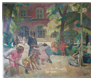
Scène de jeux dans la cour d'honneur du collège de jeunes filles, avec l'aile de l'horloge à l'arrière-plan. Signé et daté Raymond Tellier, 1933. (tableau 2)