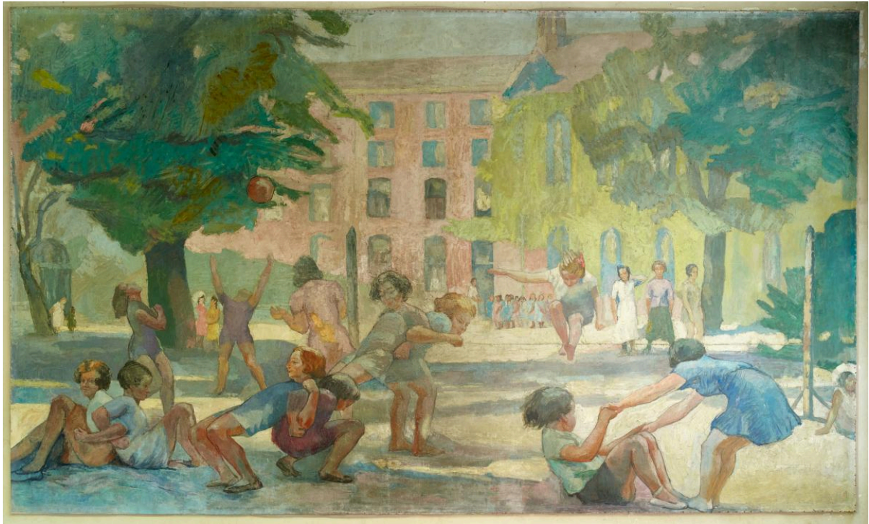
Scène de jeux dans la cour des élèves du collège de jeunes filles, avec la façade de l'aile de l'horloge et la chapelle à l'arrière plan. (tableau 1)