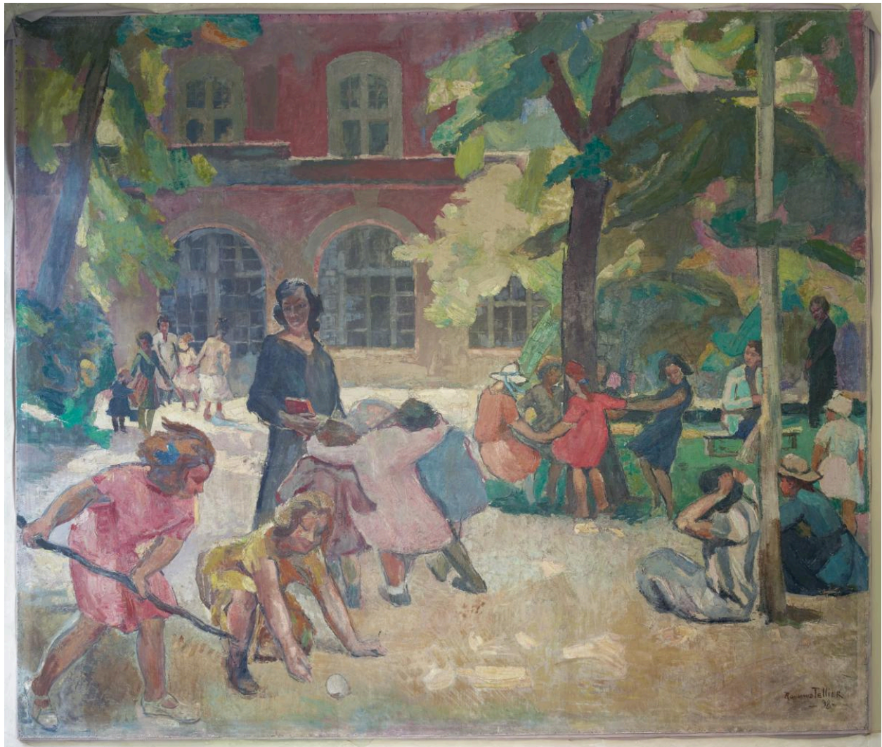
Scène de jeux dans la cour d'honneur du collège de jeunes filles, avec l'aile de l'horloge à l'arrière-plan. Signé et daté Raymond Tellier, 1933. (tableau 2)