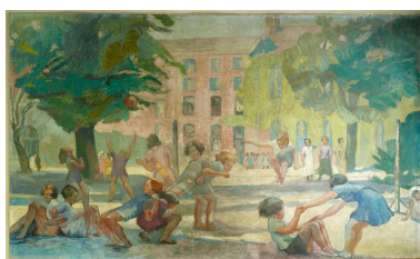
Scène de jeux dans la cour des élèves du collège de jeunes filles, avec la façade de l'aile de l'horloge et la chapelle à l'arrière plan. (tableau 1)