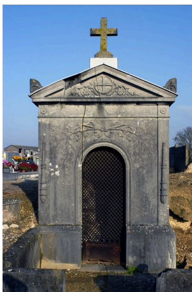
Vue de la face antérieure. IVR22_20058000073NUCA