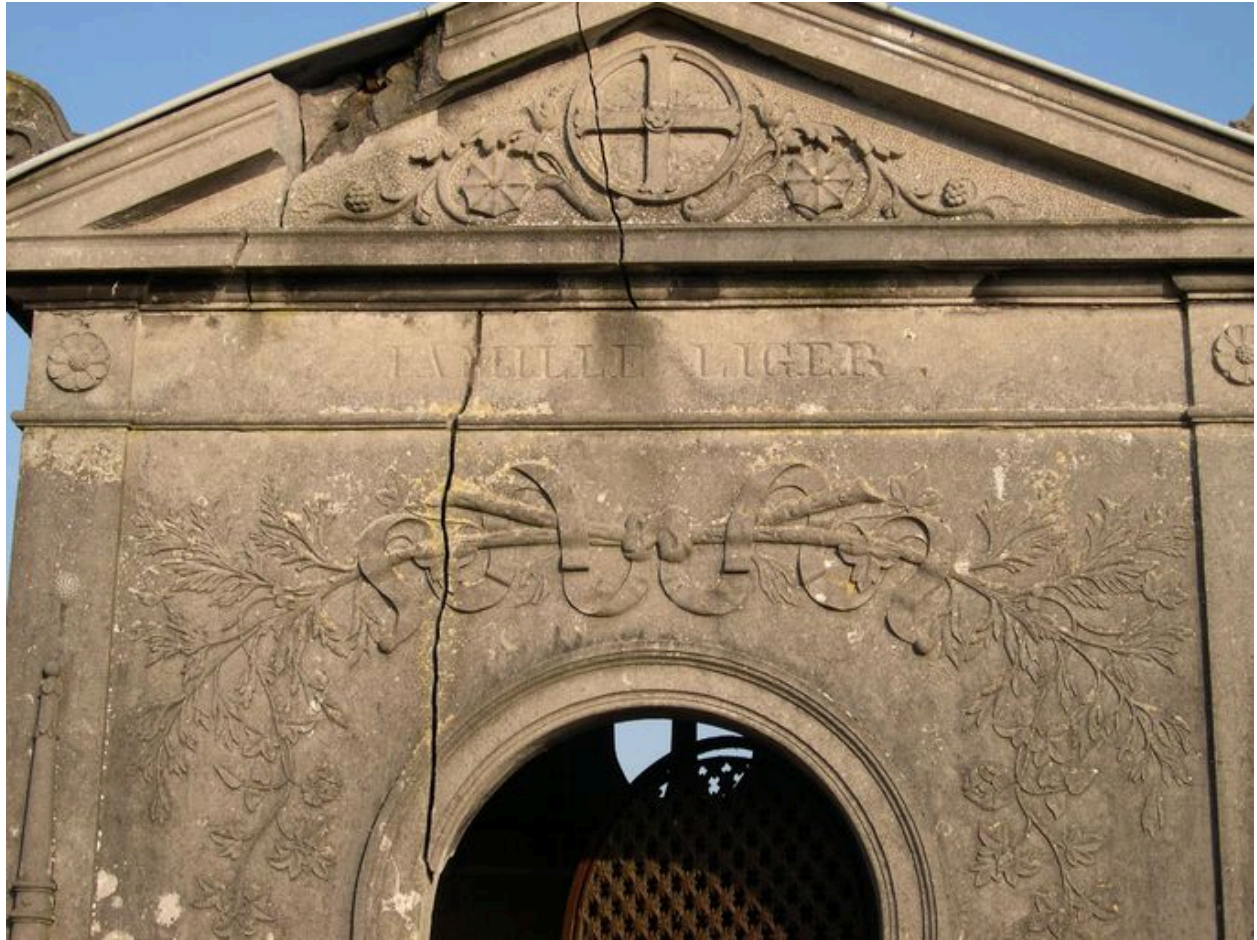
Vue de détail sur le fronton.