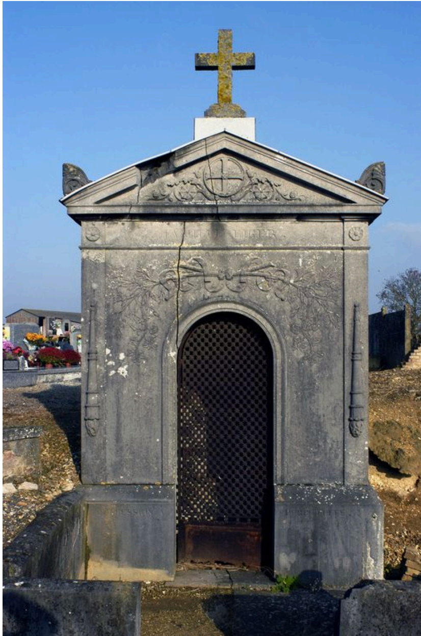
Vue de la face antérieure.