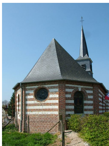
Chevet de l'église.