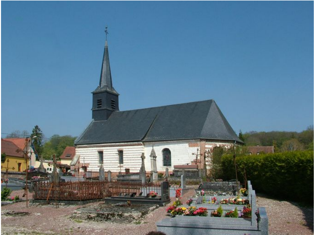
Flanc sud de l'église et cimetière.