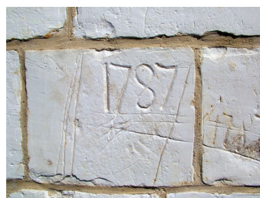
Date gravée sur le mur sud du chœur de l'église : 1787.