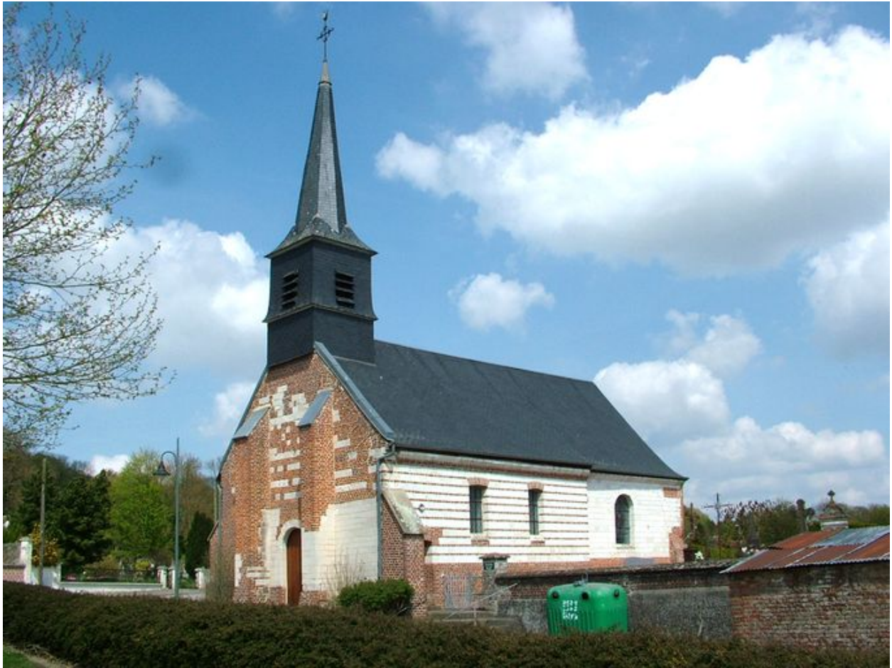
Façade occidentale et flanc sud de l'église.