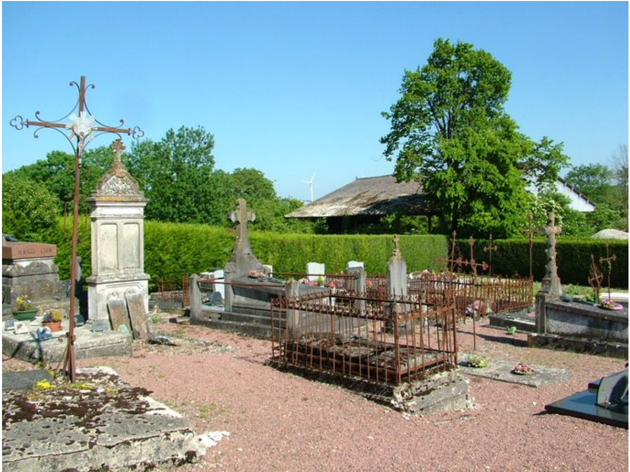
Vue générale du cimetière.