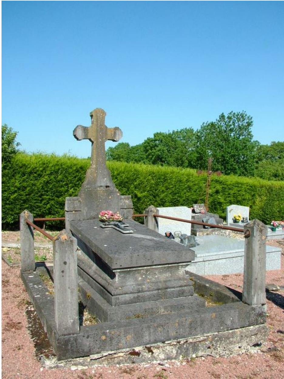
Tombeau de la famille Lion-Leroy, limite des 19e et 20e siècles.