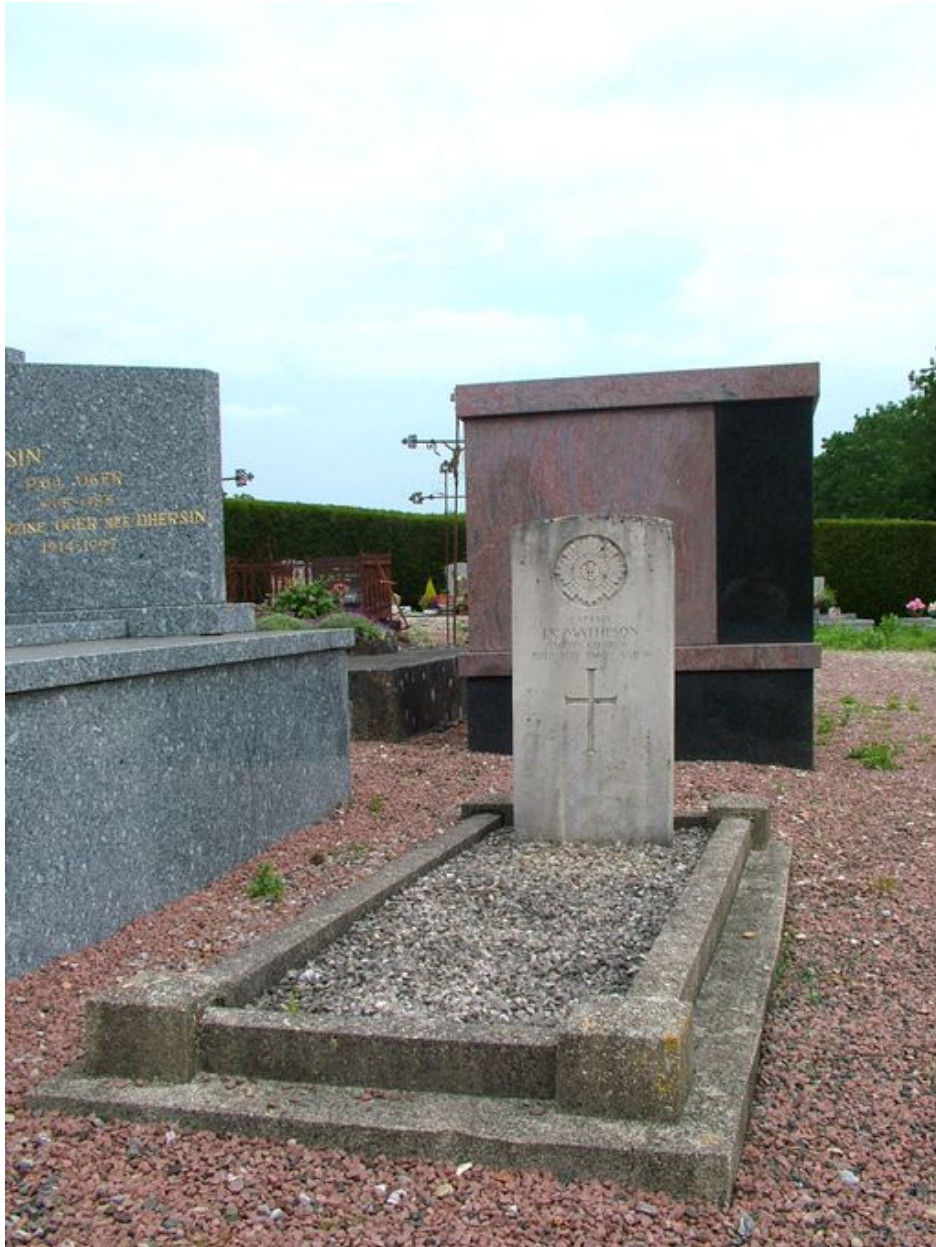
Tombeau (stèle funéraire) de soldat du Commonwealth mort durant la Première Guerre mondiale, 1er quart du 20e siècle.