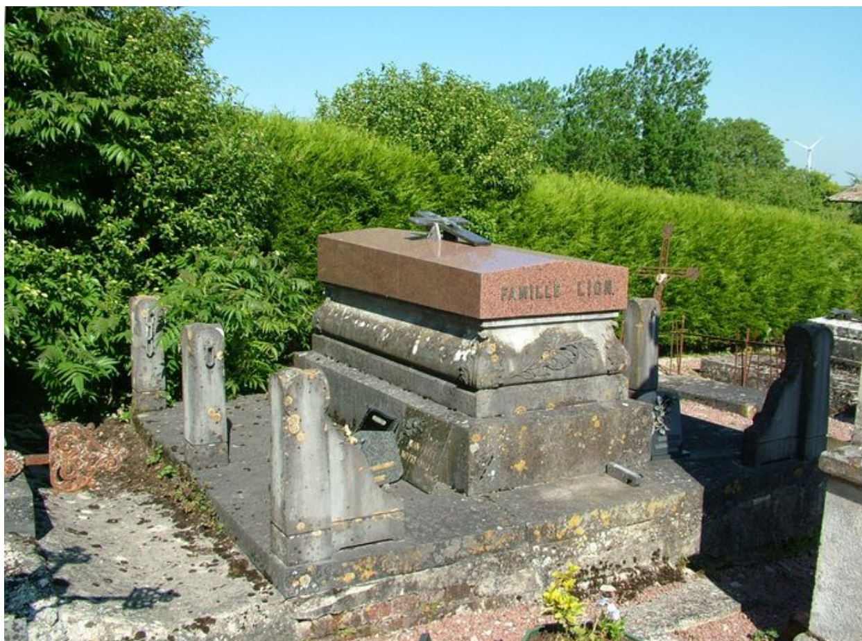
Tombeau de la famille Lion, limite des 19 e et 20 e siècles, signé GAUDIER-REMBAX/AULNOYE (NORD), avec dalle de granite rose moderne.