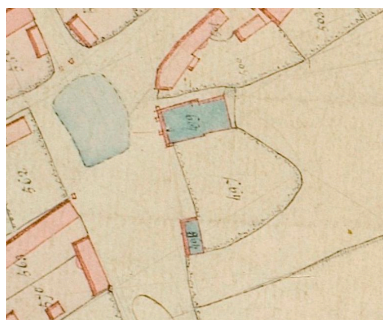
Plan cadastral, section A, 1832. Extrait (AD Somme). IVR22_20088015491NUCA