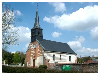
Façade occidentale et flanc sud de l'église.