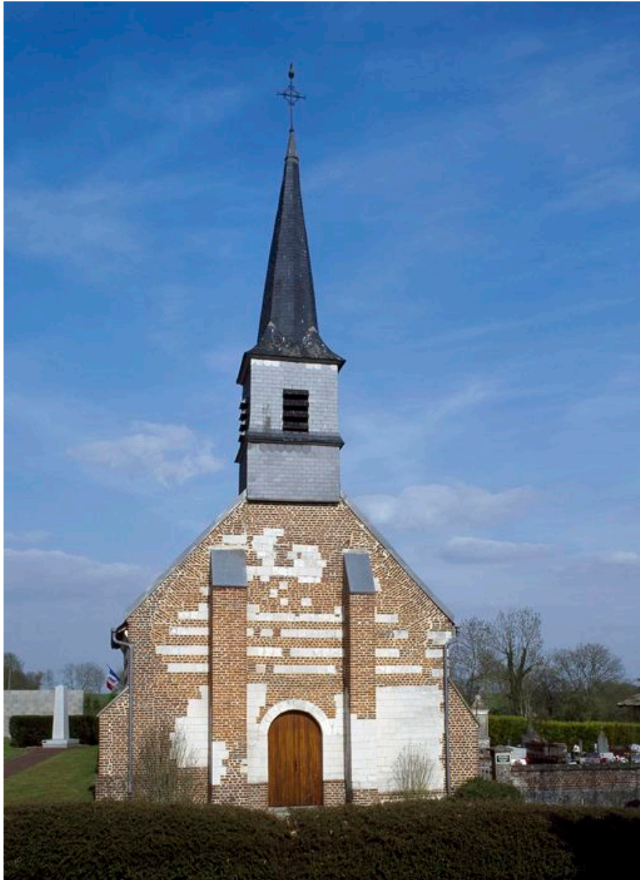
Façade occidentale de l'église.