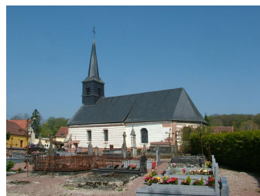
Flanc sud de l'église et cimetière.