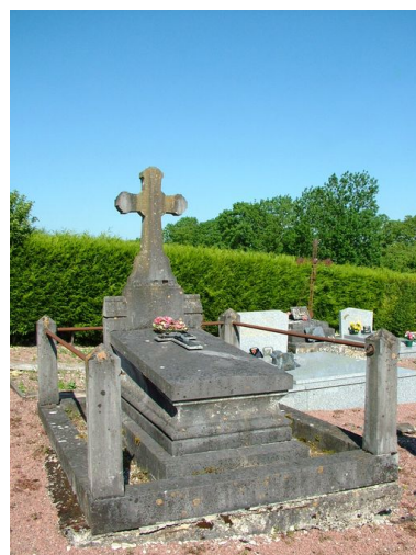
Tombeau de la famille Lion-Leroy, limite des 19e et 20e siècles.