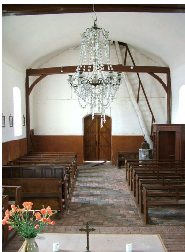
Vue intérieure de l'église : la nef depuis le chœur.