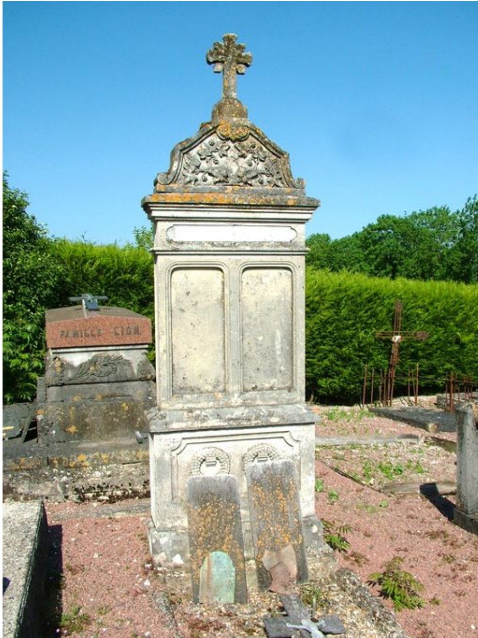
Tombeau (stèle funéraire) des familles Lion et Bassine, fin du 19e siècle, signé : CREPIN/A LONGPRE.