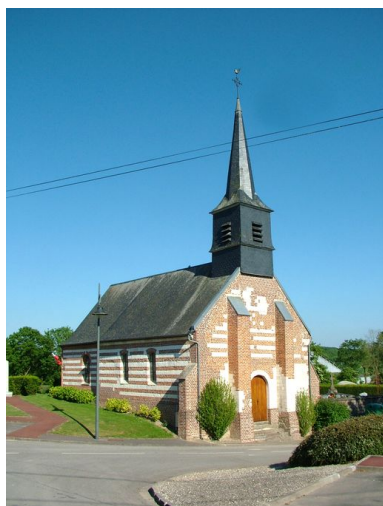
Façade occidentale et flanc nord de l'église. IVR22_20108001395NUCA