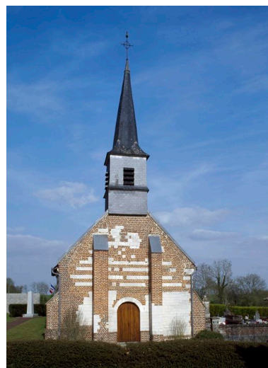
Façade occidentale de l'église. IVR22_20108000133XA