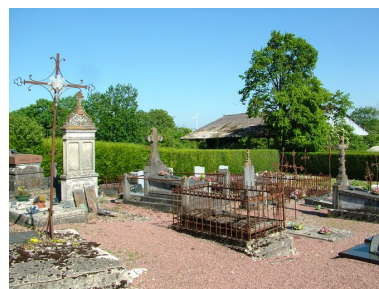
Vue générale du cimetière.