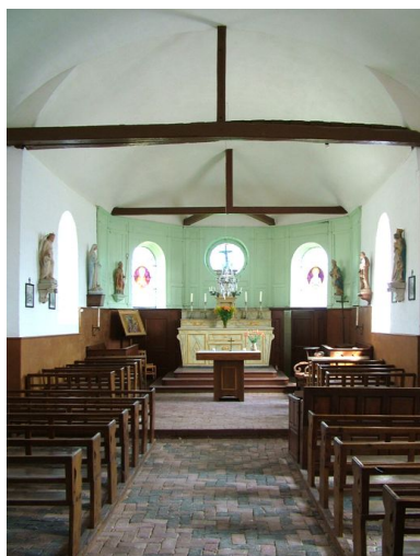
Vue intérieure de l'église : nef et chœur.