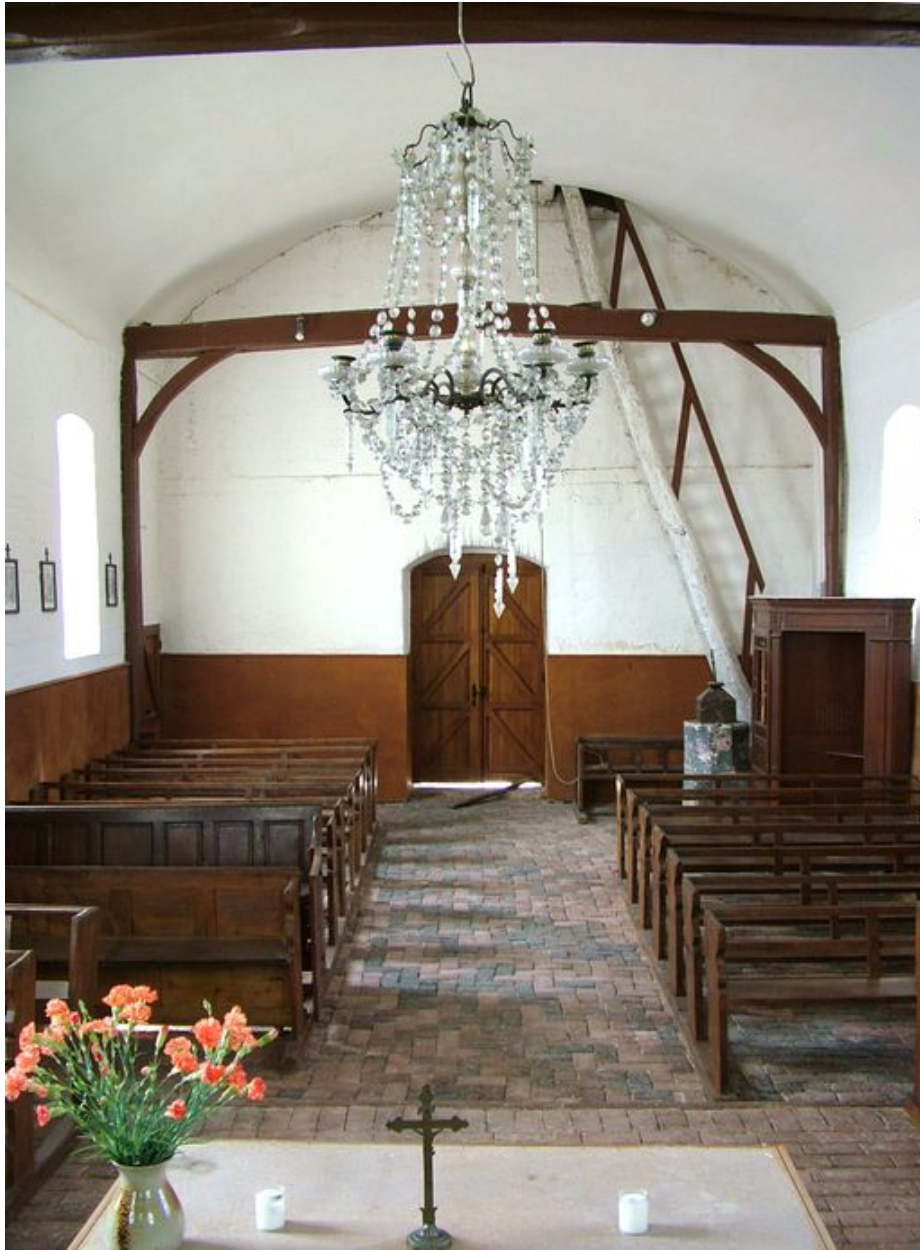
Vue intérieure de l'église : la nef depuis le chœur.