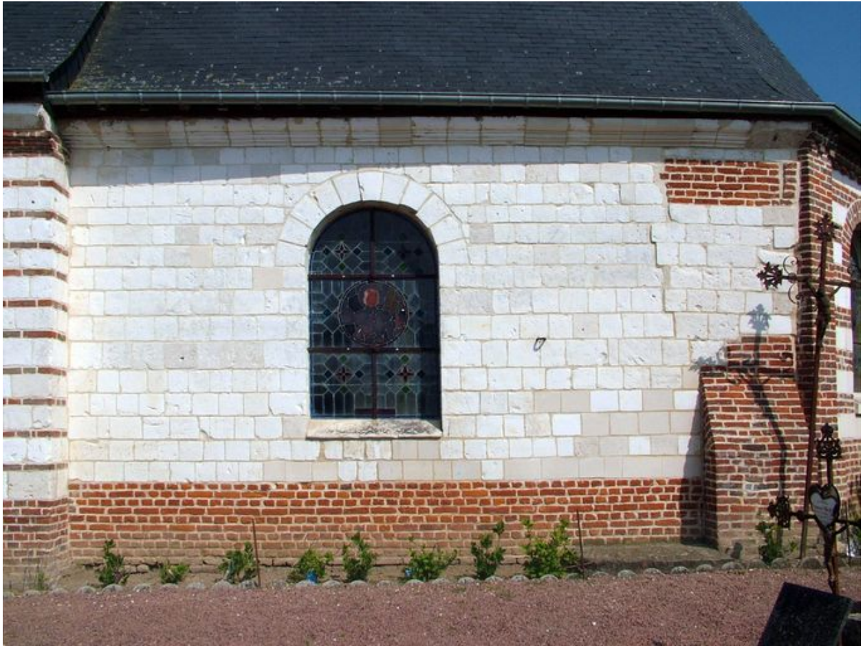
Flanc sud du choeur de l'église.