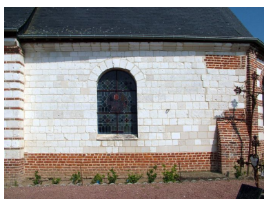
Flanc sud du chœur de l'église.