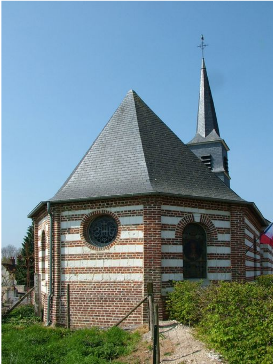
Chevet de l'église.