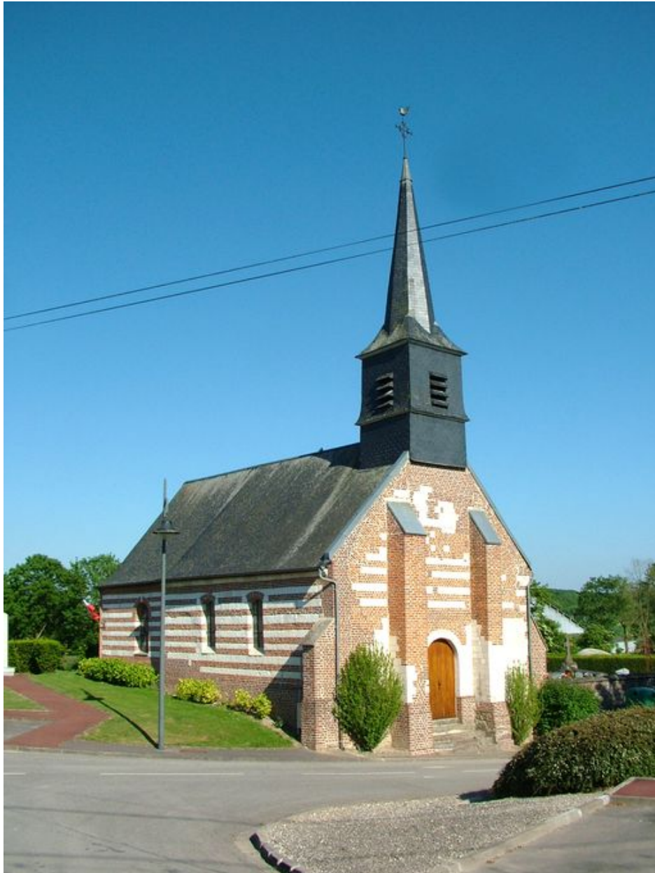
Façade occidentale et flanc nord de l'église.