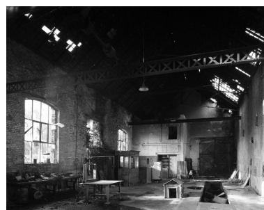
Atelier de réparation, vue intérieure. IVR31_19955900201V