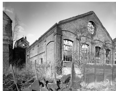
Sous-station électrique. Élévation sur la Sambre. À l'arrière-plan, à gauche, la conciergerie. IVR31_19955900195V