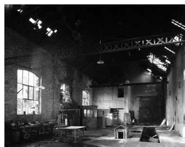
Atelier de réparation, vue intérieure. IVR31_19955900201V