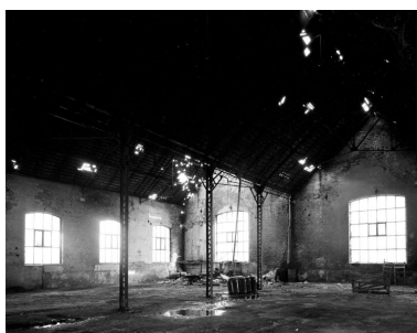
Remise ferroviaire, vue intérieure. IVR31_19955900200V