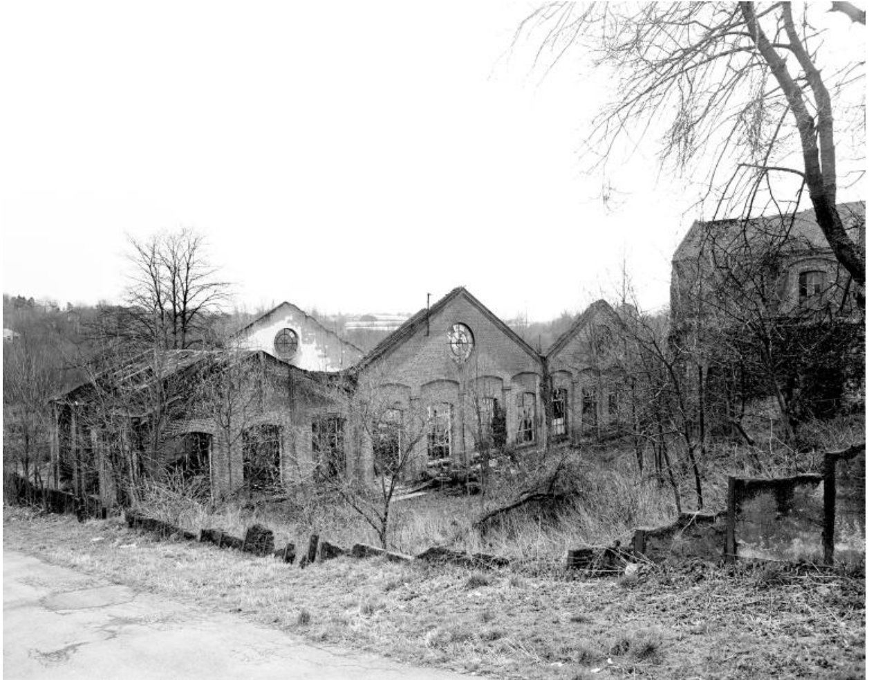
Vestiges de la sous-station électrique. Vue prise vers le sud.