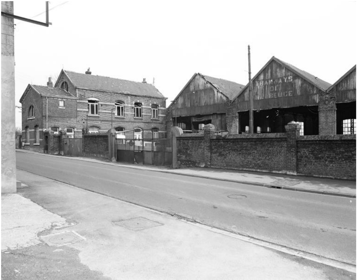
Vue générale depuis la rue, les bureaux et les hangars, prise vers l'est.