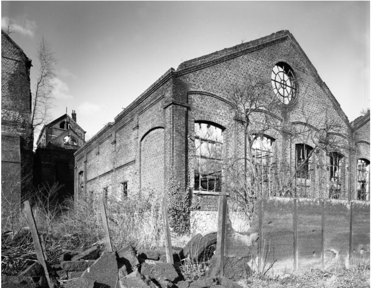
Sous-station électrique. Élévation sur la Sambre. À l'arrière-plan, à gauche, la conciergerie.