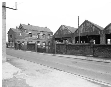
Vue générale depuis la rue, les bureaux et les hangars, prise vers l'est. IVR31_19955900204V