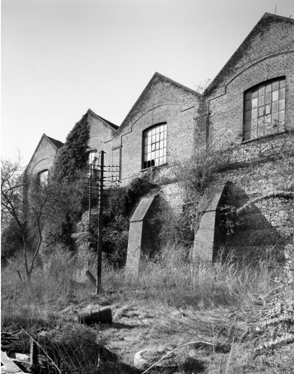
Remise ferroviaire et contreforts. Élévation postérieure, sur la Sambre.