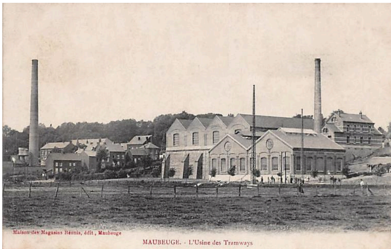
Vue générale depuis le la Sambre vers le nord-ouest. Carte postale, photographe inconnu, Maison des Magasins Réunis, [ca 1900] (coll. part.).