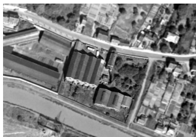
Extrait d'une photographie aérienne de 1952. IVR32_20205902474NUC