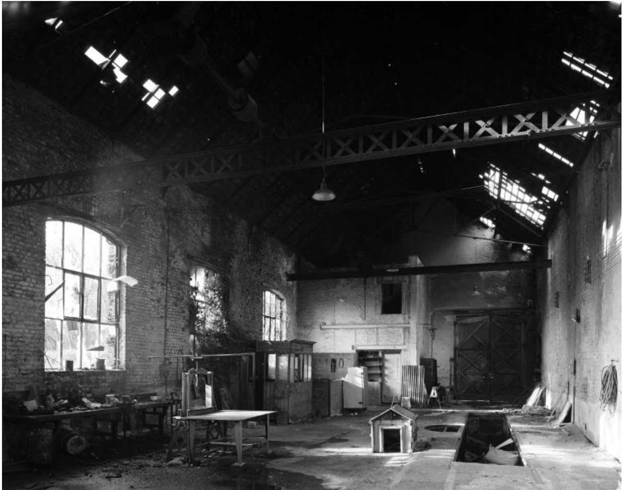
Atelier de réparation, vue intérieure.