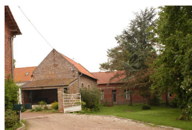
Maison, 14 rue du Petit-Cagny, construite en 1874. IVR22_20038000423NUCA