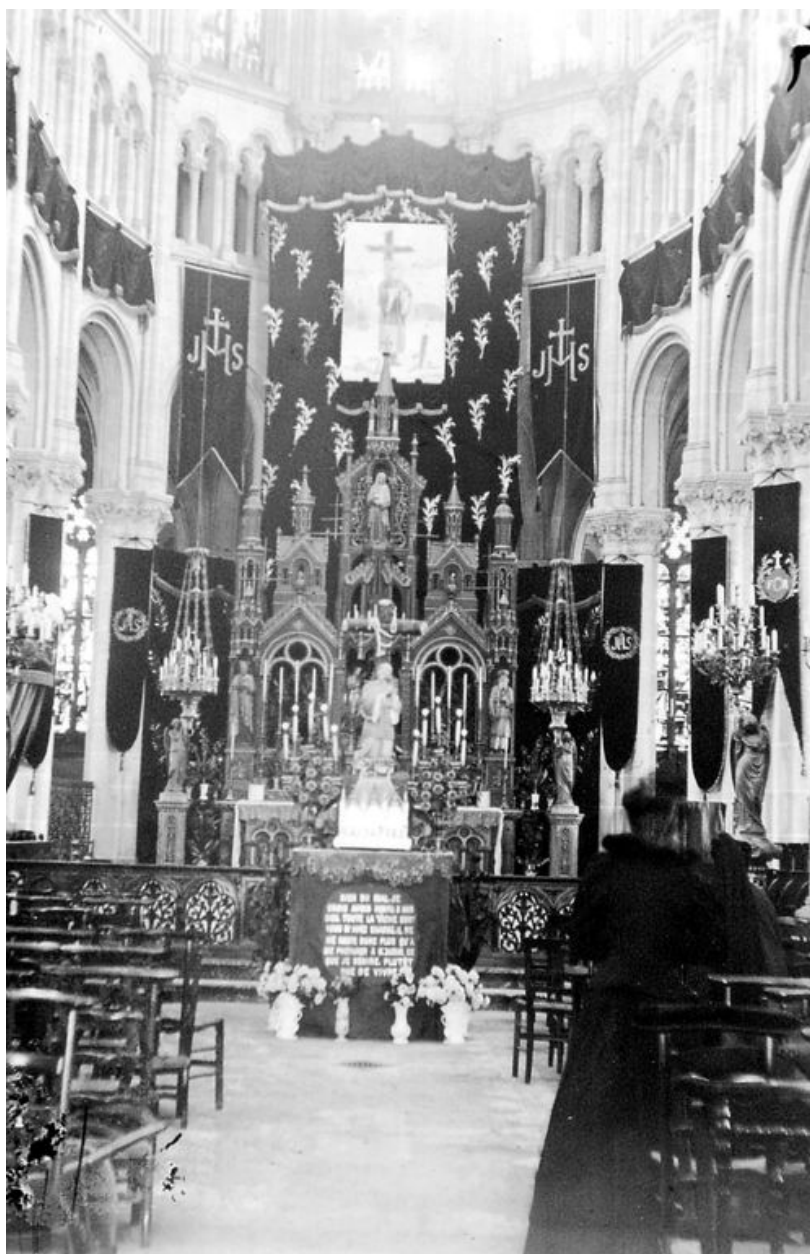
Vue du choeur au début du 20e siècle (AP Congrégation).