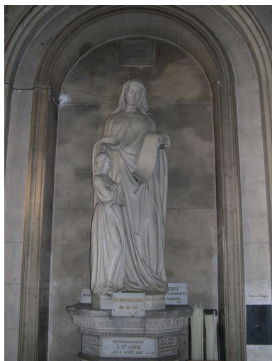
Groupe sculpté : sainte Anne et la Vierge.