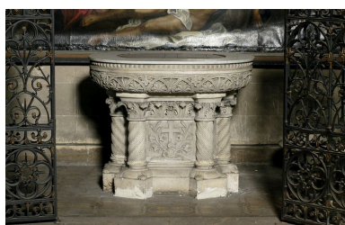
Fonts baptismaux (Hesse). IVR22_20058001911NUCA