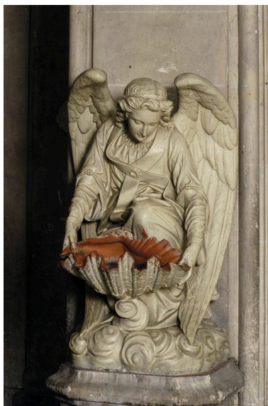
Bénitier, au bas de la nef. IVR22_20058001912NUCA