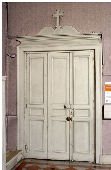
Sacristie : porte.

Phot. Thierry Lefébure IVR22_20058001966NUCA