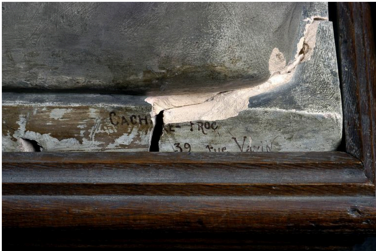
Statue : Christ mort, détail inscription.