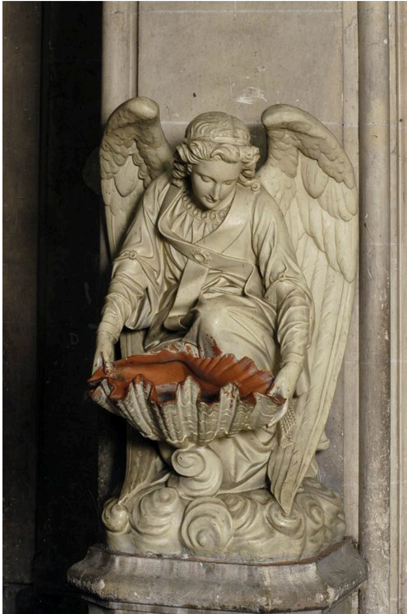
Bénitier, au bas de la nef.