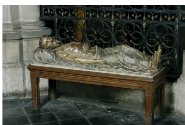
Statue : Christ mort. IVR22_20058001891NUCA