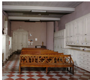
Sacristie.