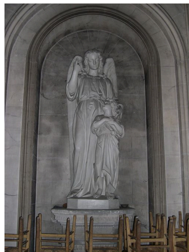
Groupe sculpté : l'Ange Gardien.