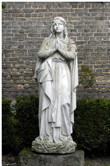
Statue (Immaculée Conception) dans le jardin du presbytère.