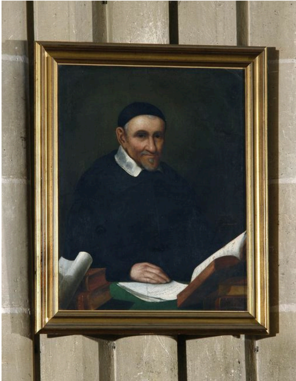
Tableau : saint Vincent de Paul.