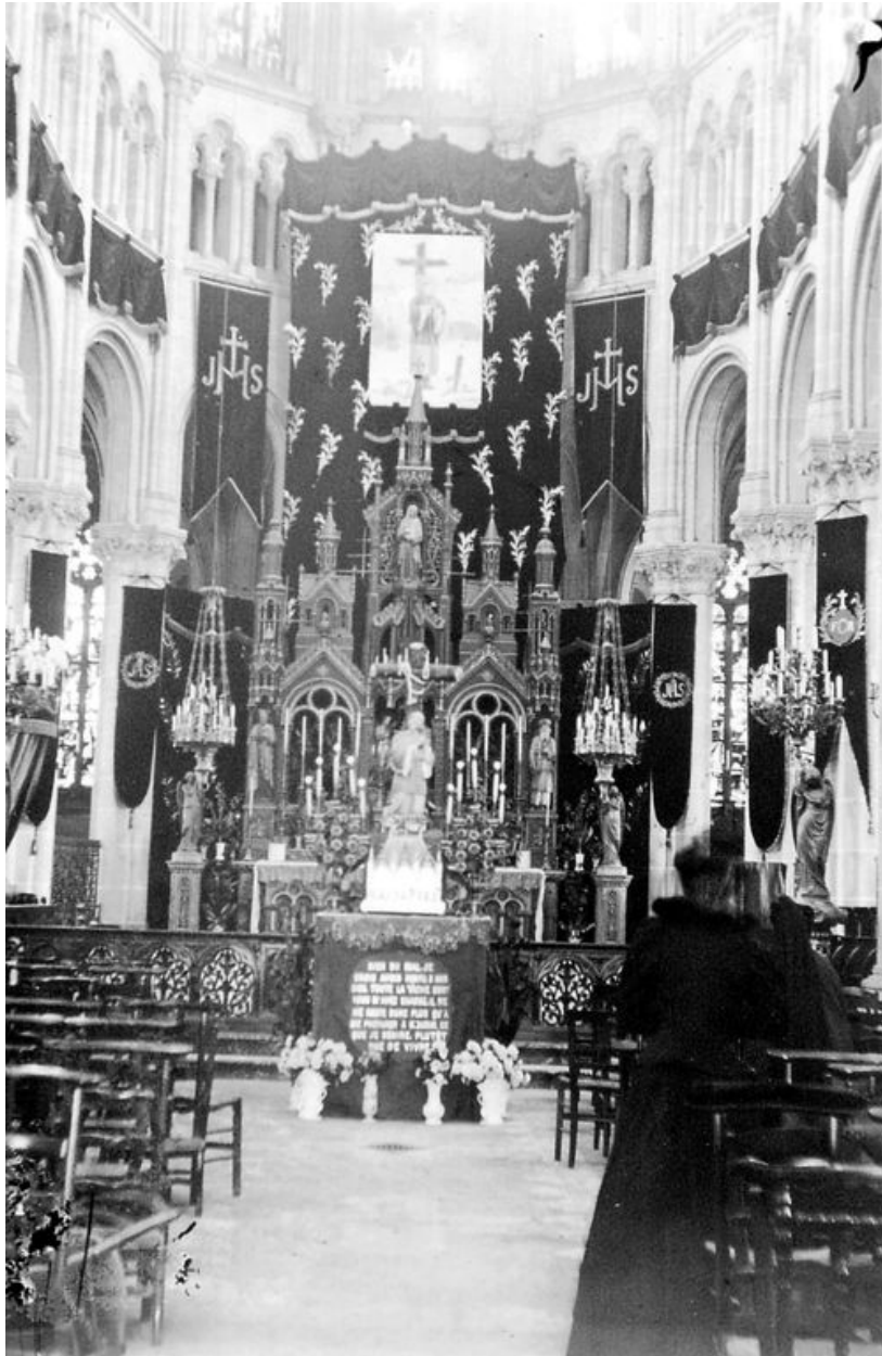
Vue du chœur au début du 20e siècle.