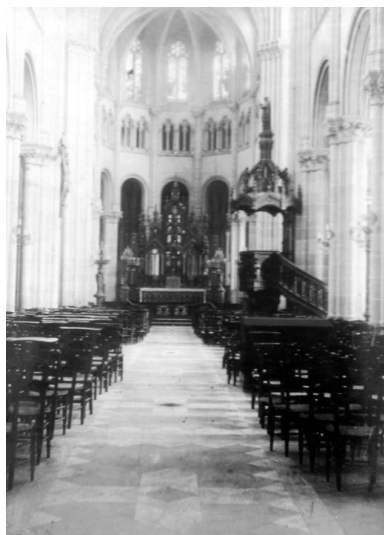
Vue intérieure de la nef, à droite la chaire à prêcher.