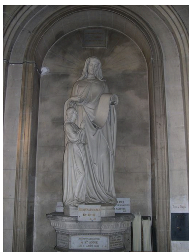
Groupe sculpté : sainte Anne et la Vierge.