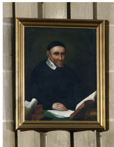
Tableau : saint Vincent de Paul.