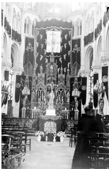
Vue du choeur au début du 20e siècle (AP Congrégation). IVR22_20058099990NUCA