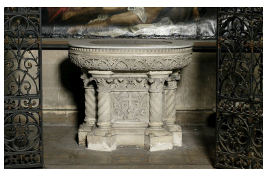
Fonts baptismaux (Hesse).