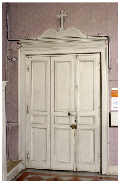
Sacristie : porte. IVR22_20058001967NUCA