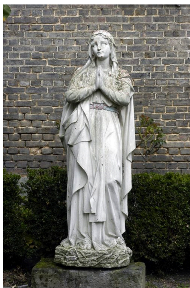
Statue (Immaculée Conception) dans le jardin du presbytère.

IVR22_20058001968NUCA