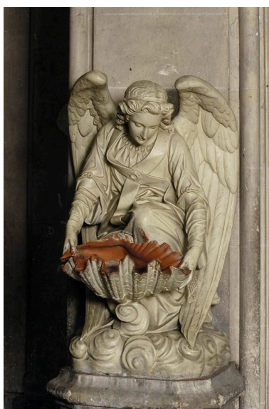
Bénitier, au bas de la nef.