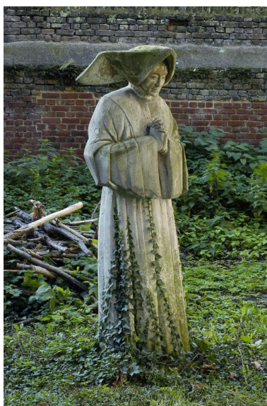
Statue (Fille de la Charité) dans le jardin du presbytère.

IVR22_20058001968NUCA