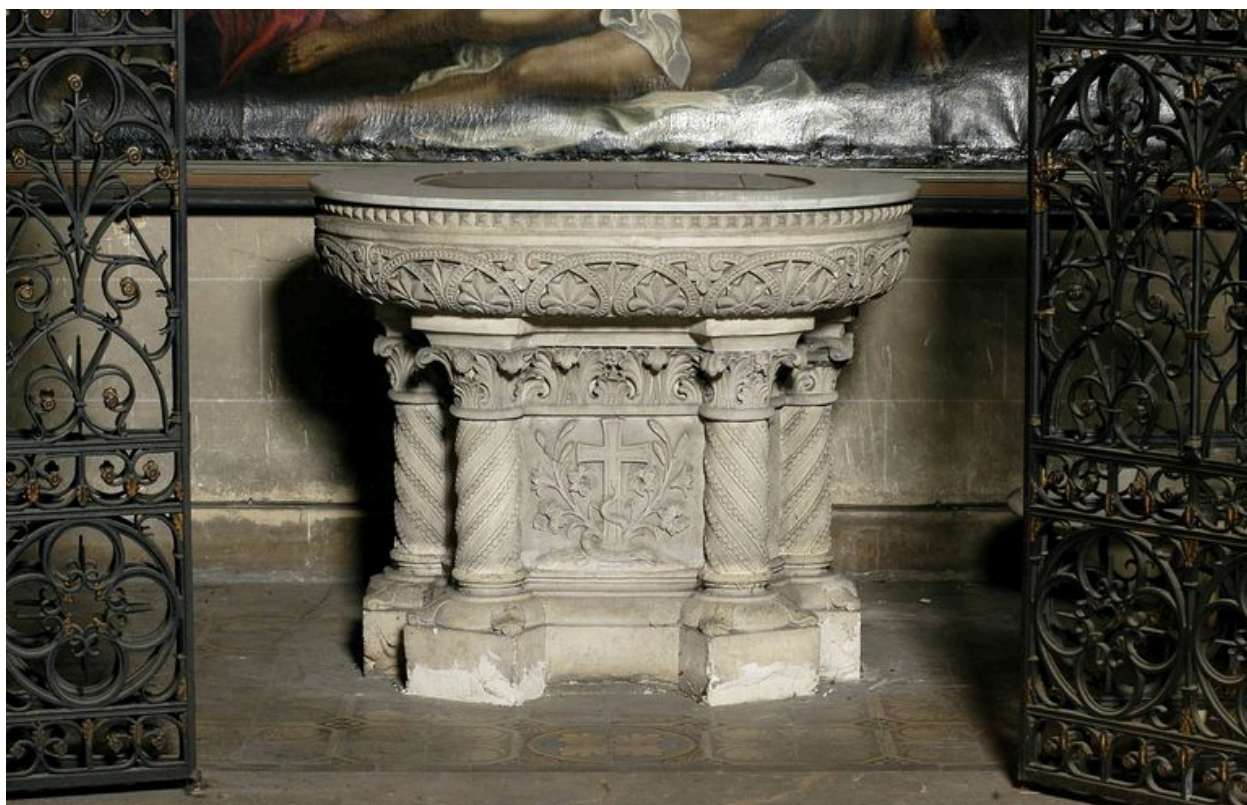
Fonts baptismaux (Hesse).