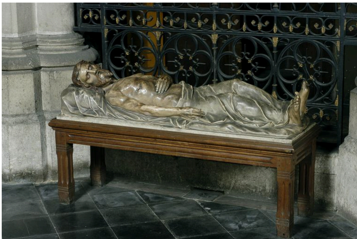
Statue : Christ mort.