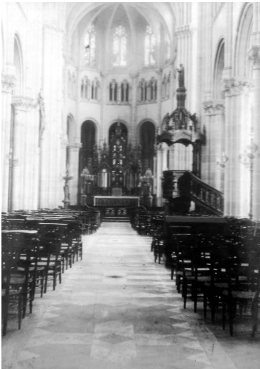
Vue intérieure de la nef, à droite la chaire à prêcher.