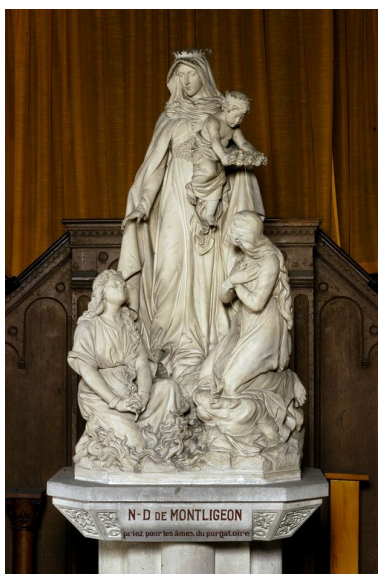
Groupe sculpté : Notre-Dame de Montligeon, d'après Giulio Tadolini (1849-1918).