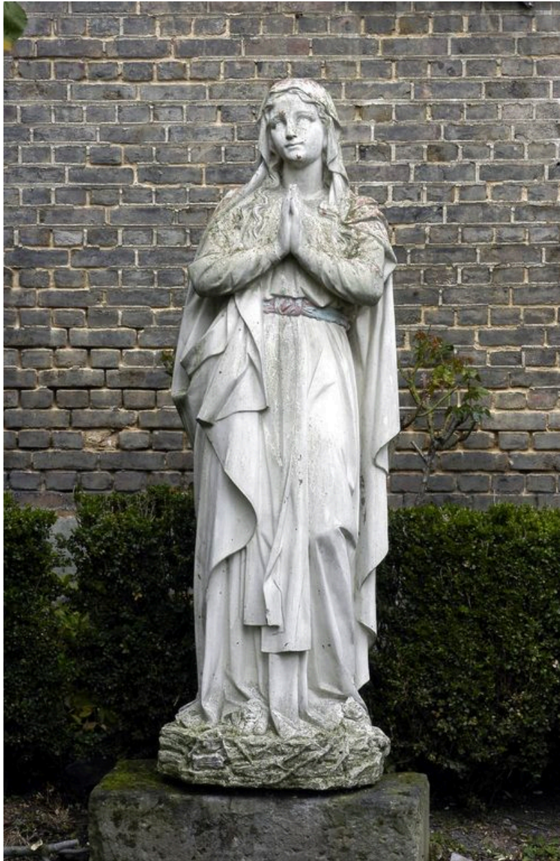
Statue (Immaculée Conception) dans le jardin du presbytère.