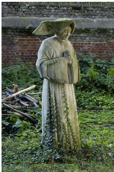
Statue (Fille de la Charité) dans le jardin du presbytère.