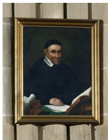
Tableau : saint Vincent de Paul. IVR22_20058001884NUCA