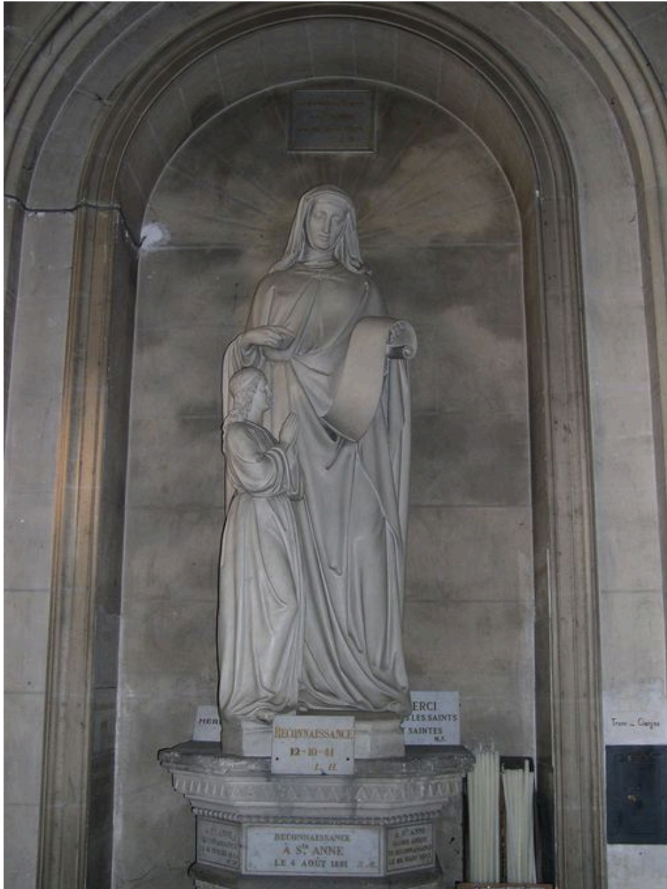
Groupe sculpté : sainte Anne et la Vierge.