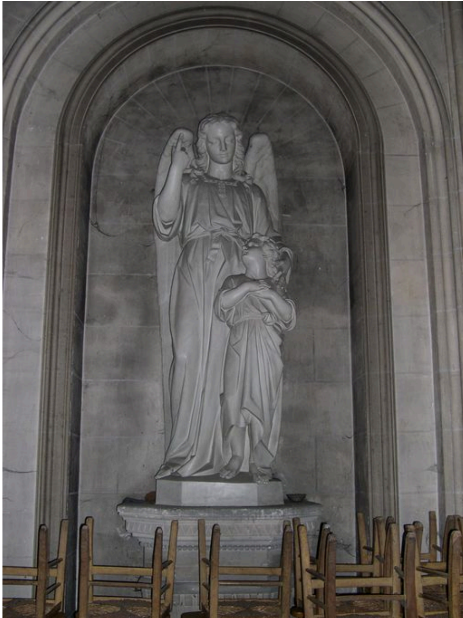
Groupe sculpté : l'Ange Gardien.