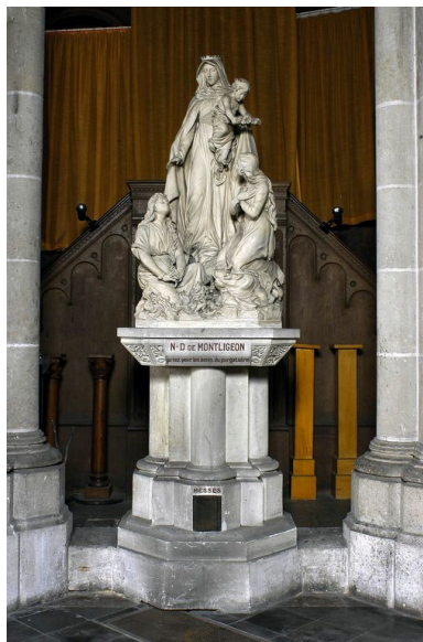
Groupe sculpté : Notre-Dame de Montligeon, d'après Giulio Tadolini (1849-1918).