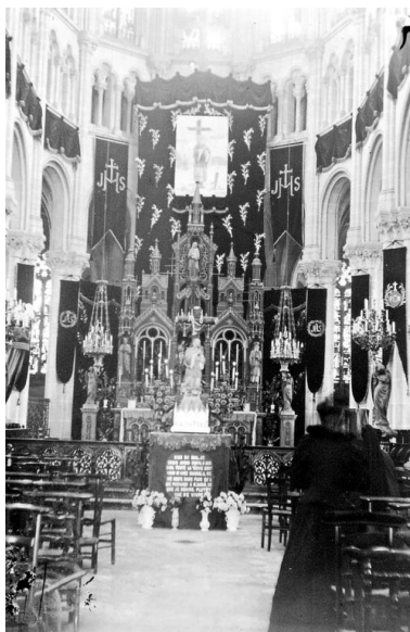
Vue du chœur au début du 20e siècle.