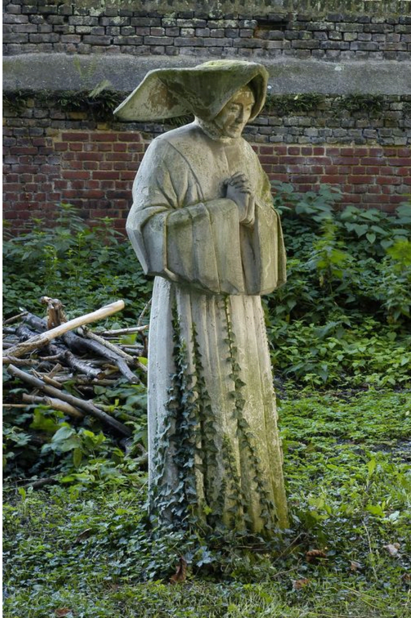
Statue (Fille de la Charité) dans le jardin du presbytère.