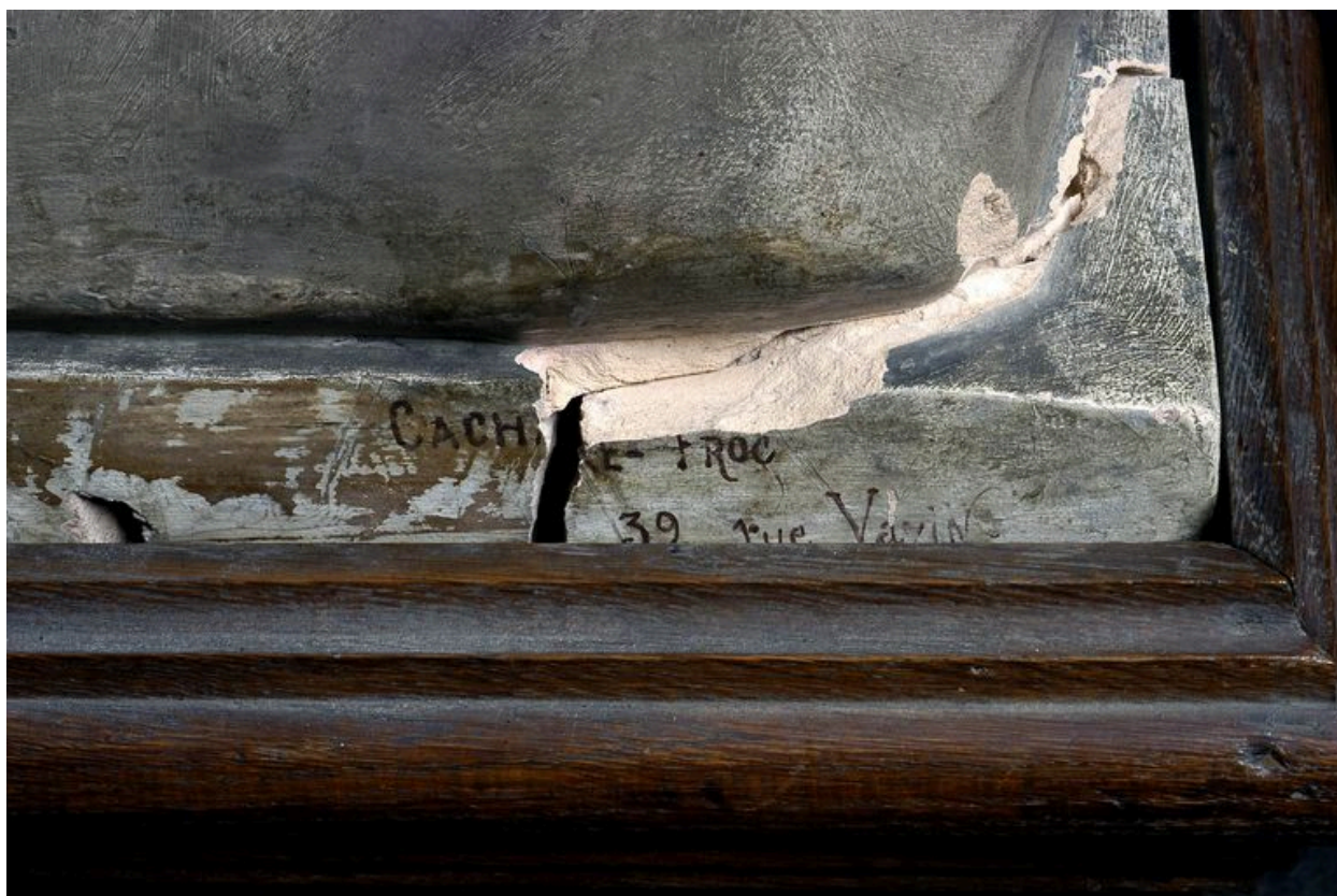
Statue : Christ mort, détail inscription.