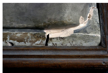
Statue : Christ mort, détail inscription.