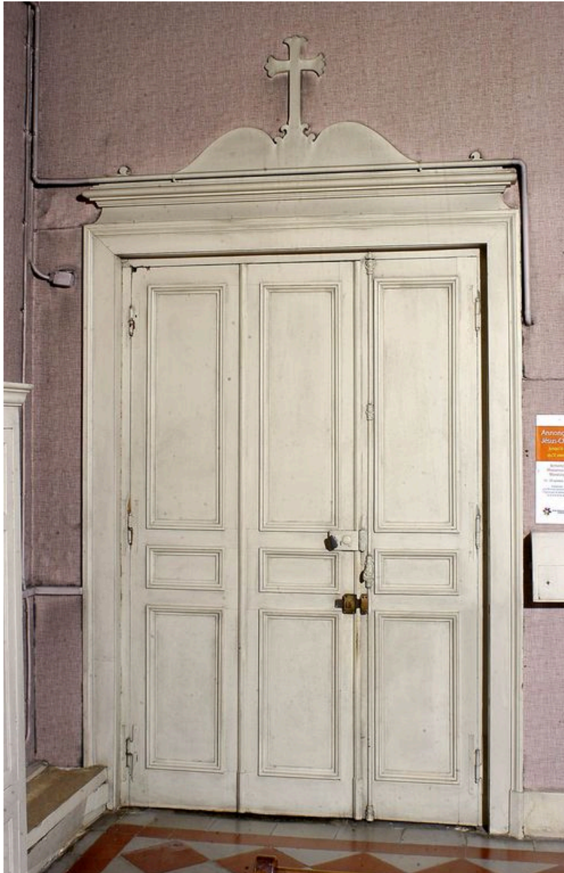
Sacristie : porte.