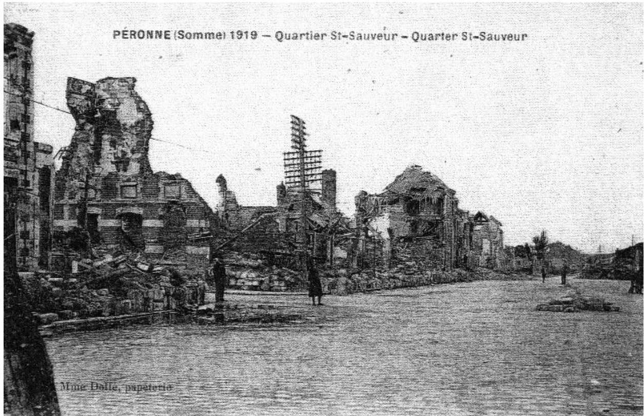
Quartier Saint Sauveur, 1919 (Historial de la Grande Guerre, Péronne ; fonds Van Treeck).