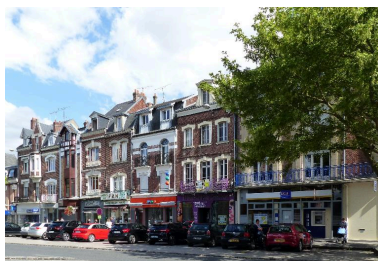
Maisons de commerce, 8 à 20 rue Saint-Sauveur.

IVR32_20218005215NUCA