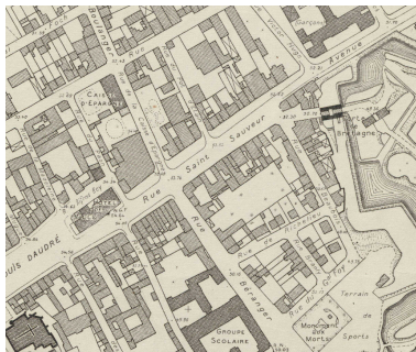
La rue Saint-Sauveur sur le plan du ministère de la Reconstruction, 1942 (AD Somme ; 70W_CP_80/11).

Phot. Archives départementales de la Somme IVR32_20218005213NUCA