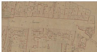
La rue Saint-Sauveur sur le cadastre napoléonien, vers 1839 (AD Somme ; 3P2065/4).

IVR32_20218005213NUCA