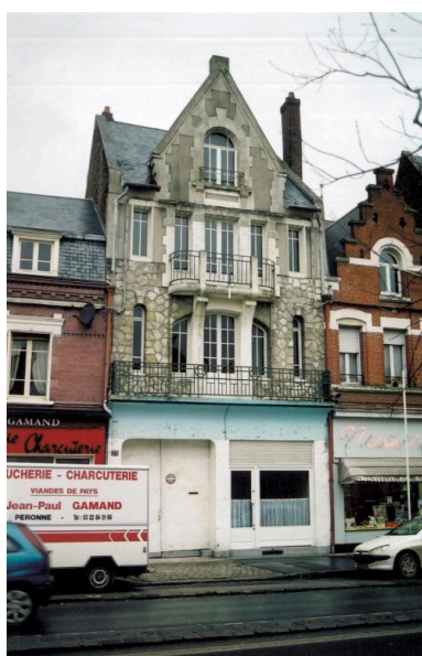
Maison, 23 rue Saint-Sauveur (B 339), reconstruite vers 1925.