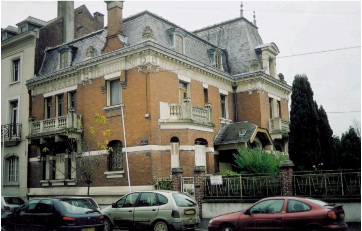
Maison, 51 rue Saint-Sauveur, reconstruite vers 1925 pour Georges Decaux, vétérinaire, et agrandie d'un garage et d'une écurie, vers 1929.