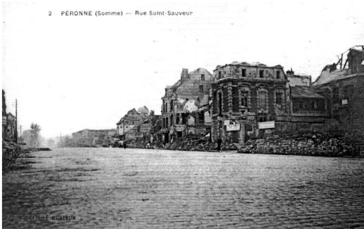
Rue Saint-Sauveur, [s.d.] (AD Somme ; 8 Fi 3381).