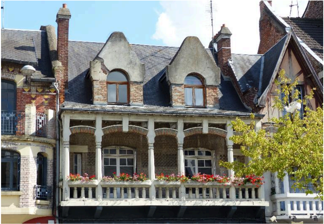
Etages supérieurs de la maison à boutique, 38 rue Saint-Sauveur (B 422-423), reconstruite vers 1923.