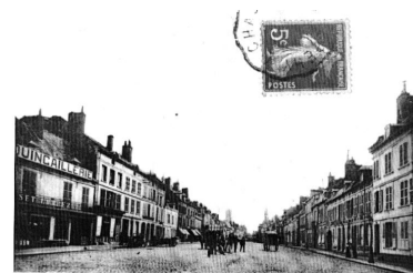
7 Péronne - Quartier Saint-Sauveur

IVR32_20218005214NUCA