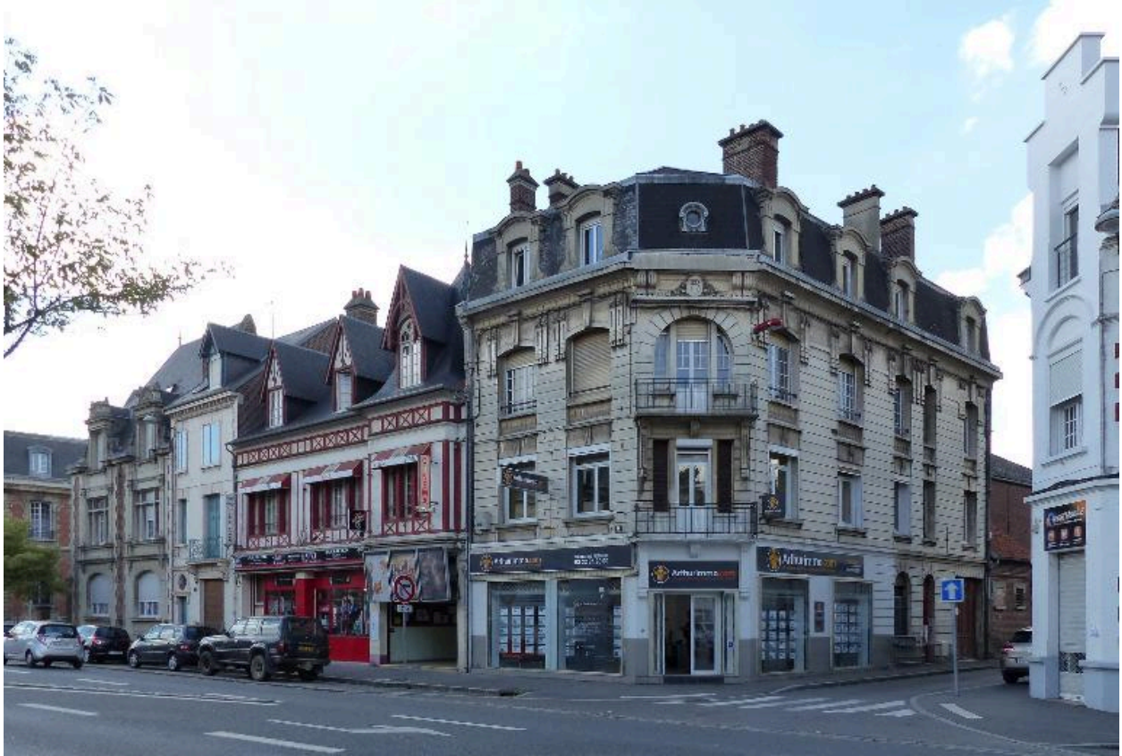
Maisons, rive nord de la rue Saint-Sauveur. A l'angle (B 327), immeuble de rapport reconstruit vers 1927.