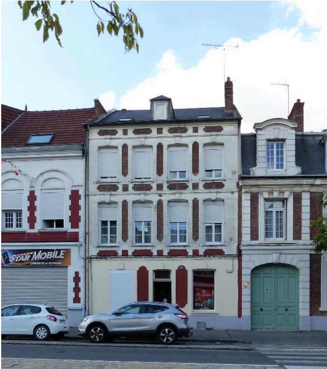
Maison, 15 rue Saint-Sauveur (B 333), reconstruite vers 1921.