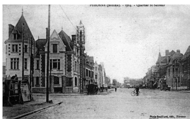
Le quartier Saint-Sauveur, 1924 (coll. part.).

Phot. Gilles-Henri Bailly (reproduction) IVR22_20158005826NUCA