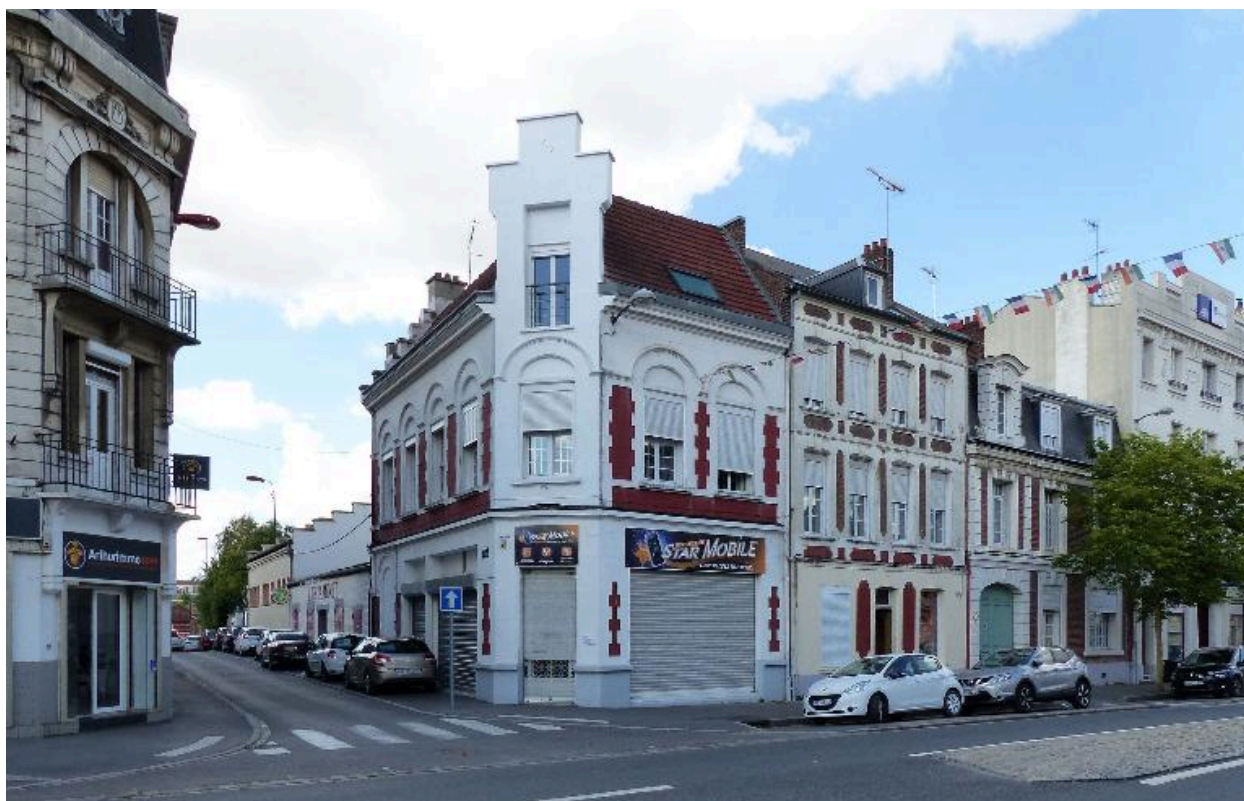
Ancien Crédit du Nord, 15 rue Saint-Sauveur (B 328), et maison, 17 rue Saint-Sauveur (B 333), imposés comme construction neuve en 1924.