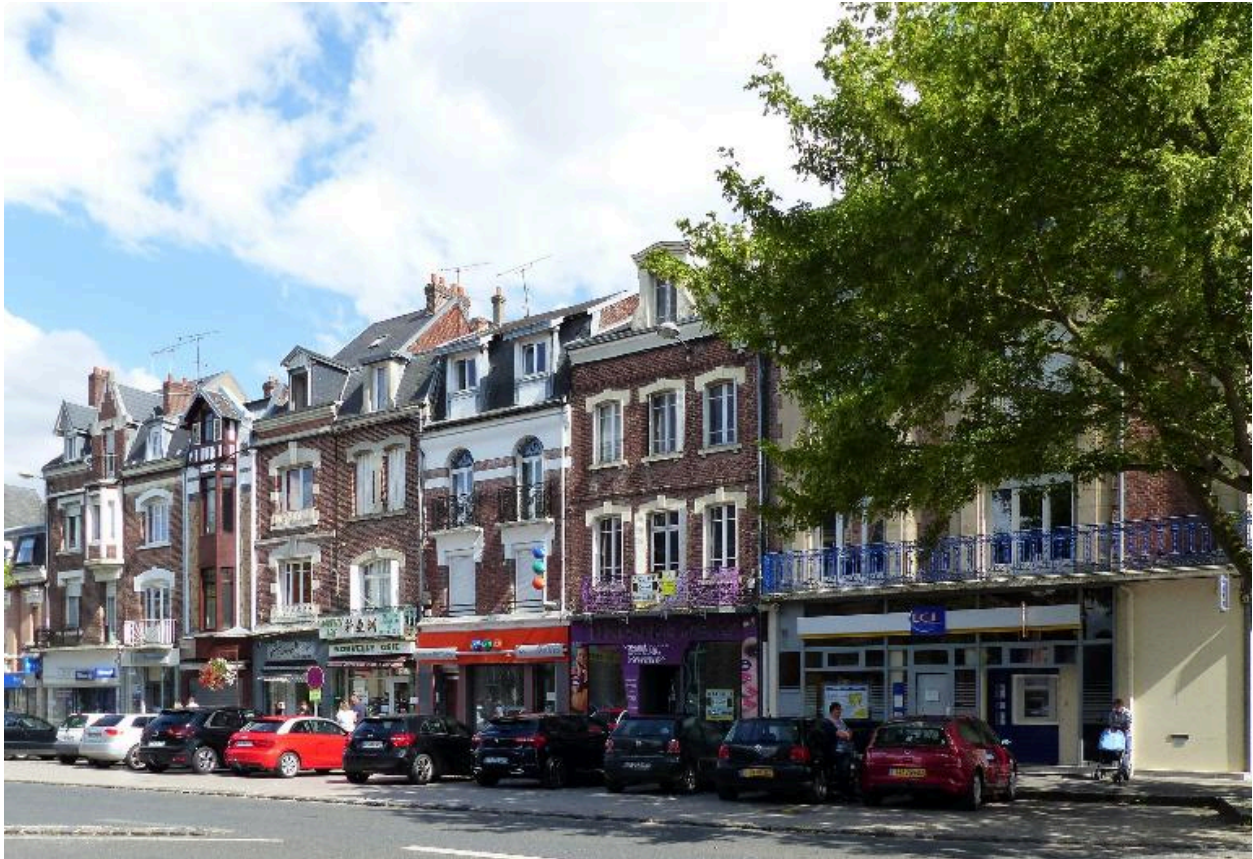
Maisons de commerce, 8 à 20 rue Saint-Sauveur.