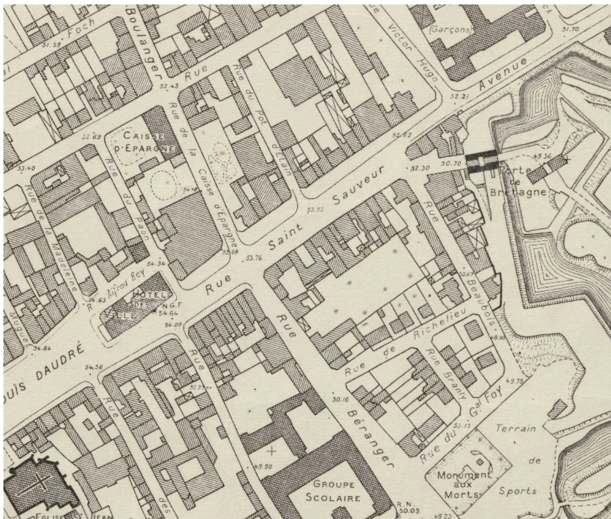
La rue Saint-Sauveur sur le plan du ministère de la Reconstruction, 1942.