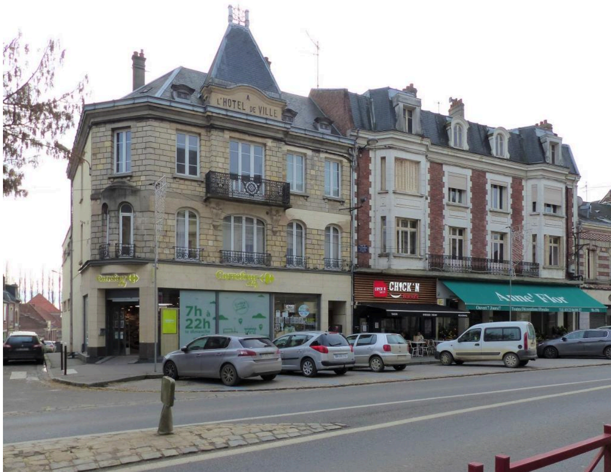
Ancien café "A l'Hôtel de ville", 2 rue Saint-Sauveur.