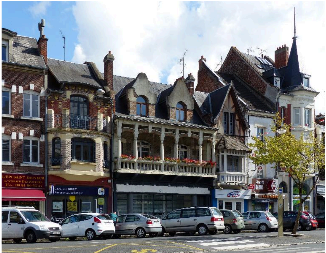
Maisons à boutique, rive sud de la rue Saint-Sauveur n° 40 à 32.