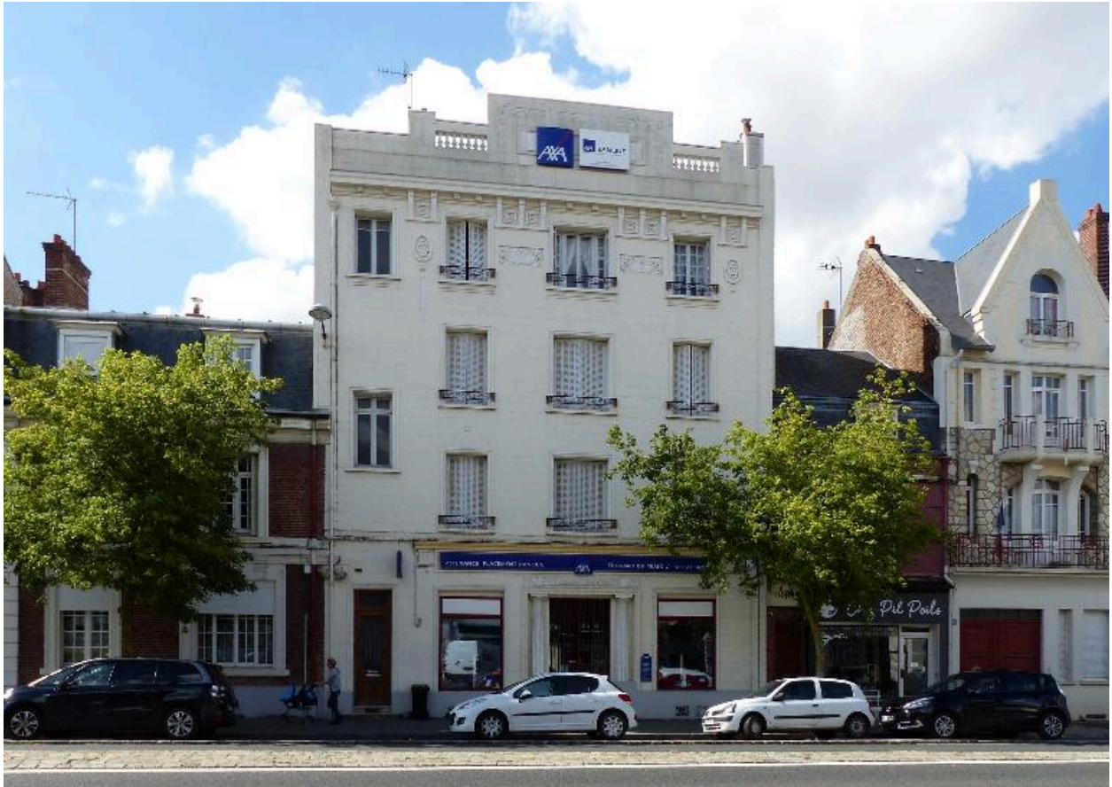
Ancienne banque de la Société générale, 37 rue Saint-Sauveur.