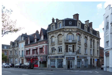
Maisons, rive nord de la rue Saint-Sauveur. A l'angle (B 327), immeuble de rapport reconstruit vers 1927. IVR32_20178005266NUCA