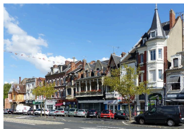
Maisons de la rive sud de la rue Saint-Sauveur. Au premier plan, maison (B 325) reconstruite en 1920.

Phot. Isabelle Barbedor IVR32_20178005212NUCA