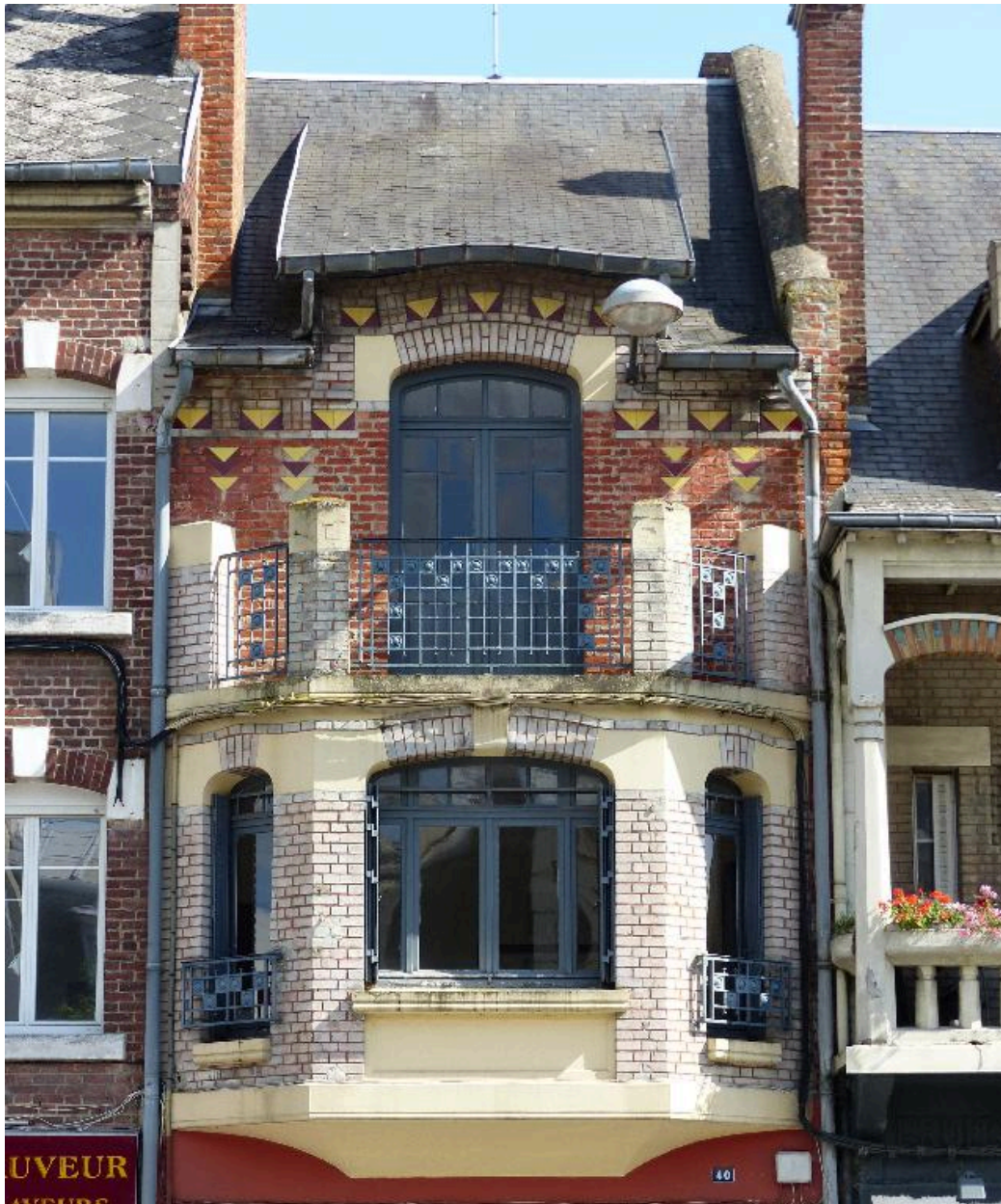
Etages supérieurs de la maison à boutique, 40 rue Saint-Sauveur (B 419), reconstruite vers 1923.