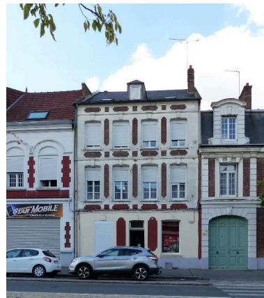
Maison, 15 rue Saint-Sauveur (B 333), reconstruite vers 1921.