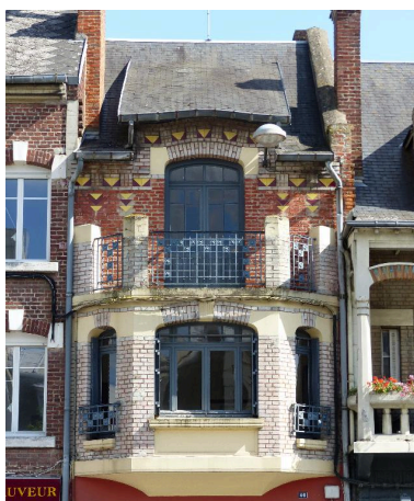
Etages supérieurs de la maison à boutique, 40 rue Saint-Sauveur (B 419), reconstruite vers 1923.