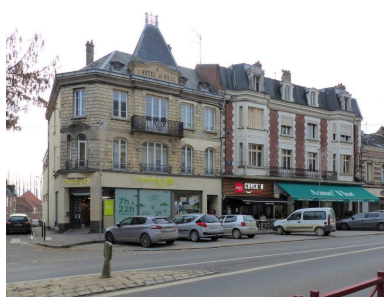
Ancien café "A l'Hôtel de ville", 2 rue Saint-Sauveur.

IVR22_20158005825NUCA