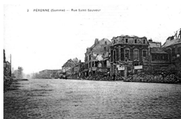
Rue Saint-Sauveur, [s.d.] (AD Somme ; 8 Fi 3381).

Phot. Gilles-Henri Bailly (reproduction) IVR22_20158005823NUCA