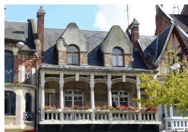
Etages supérieurs de la maison à boutique, 38 rue Saint-Sauveur (B 422-423), reconstruite vers 1923.