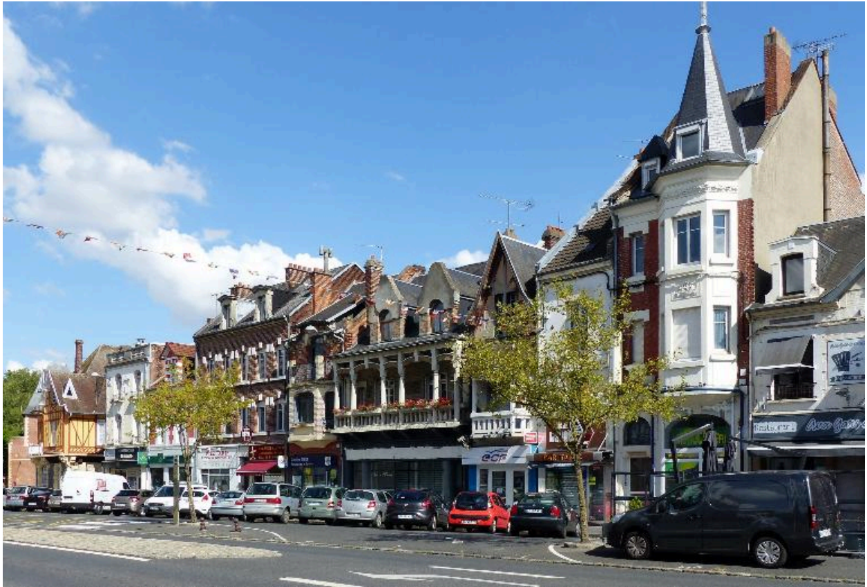
Maisons de la rive sud de la rue Saint-Sauveur. Au premier plan, maison (B 325) reconstruite en 1920.