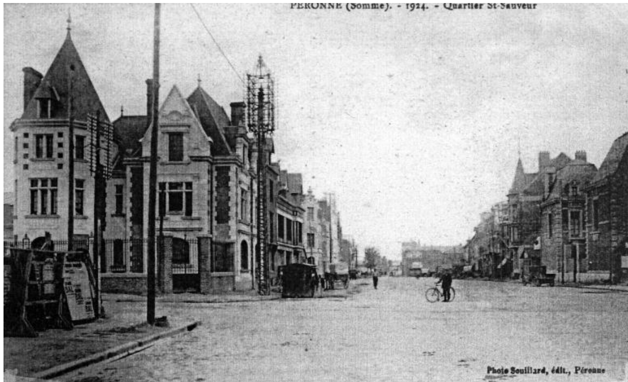
Le quartier Saint-Sauveur, 1924 (coll. part.).