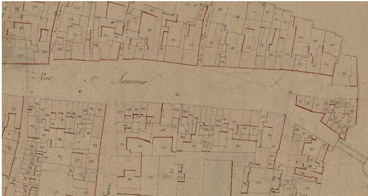
La rue Saint-Sauveur sur le cadastre napoléonien, vers 1839 (AD Somme ; 3P2065/4).