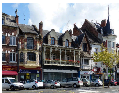
Maisons à boutique, rive sud de la rue Saint-Sauveur n° 40 à 32.