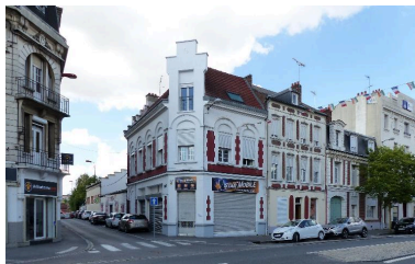
Ancien Crédit du Nord, 15 rue Saint-Sauveur (B 328), et maison, 17 rue Saint-Sauveur (B 333), imposés comme construction neuve en 1924.