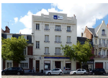
Ancienne banque de la Société générale, 37 rue Saint-Sauveur. IVR32_20178005264NUCA