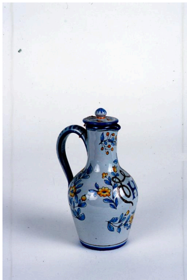
Vue générale d'une des 5 bouteilles de pharmacie, cet exemplaire étant orné du monogramme H. IVR21_20045900282ZA