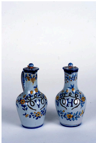
Vue d'ensemble de 2 des 5 bouteilles de pharmacie, ces exemplaires étant respectivement ornés des monogrammes H et V.