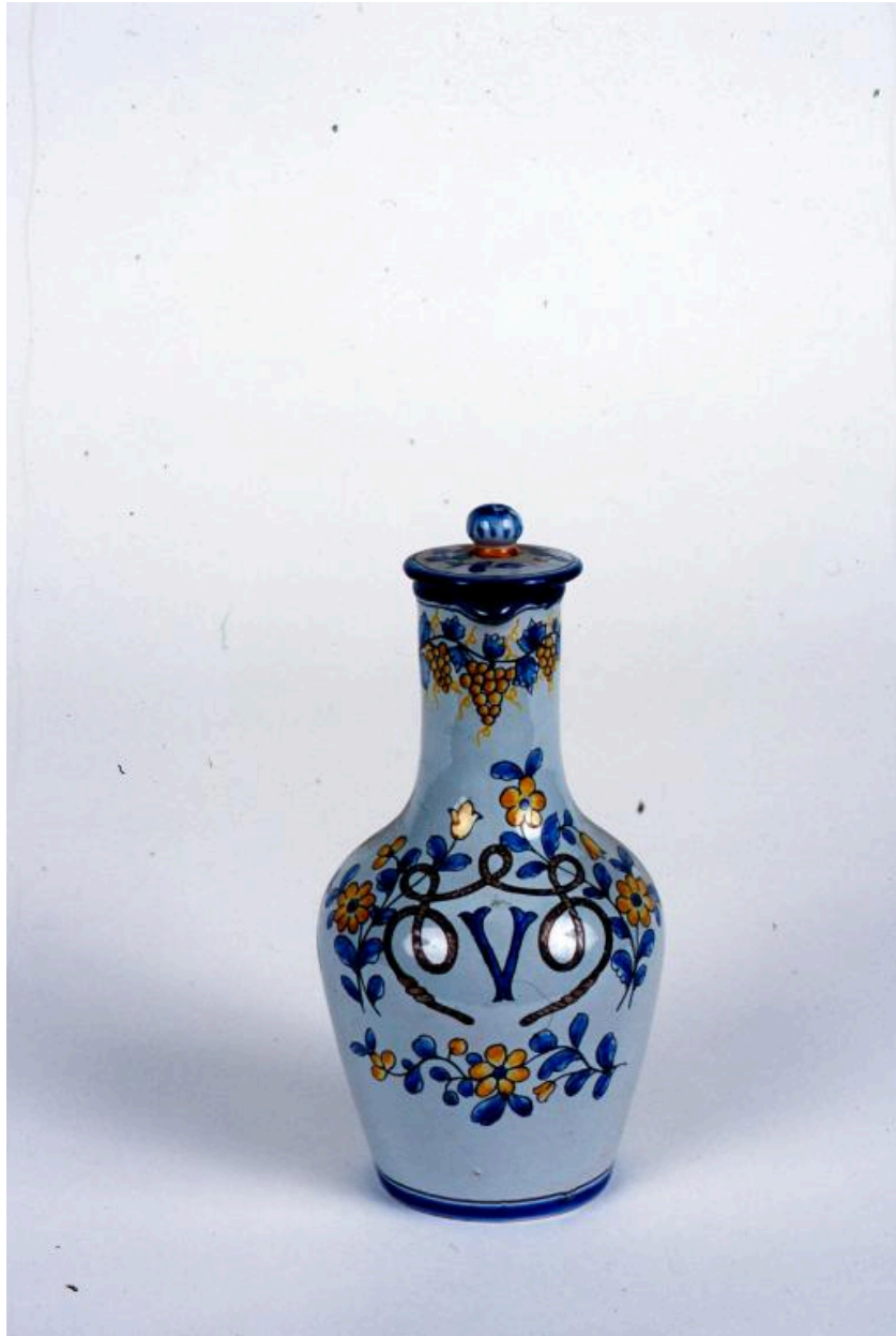
Vue générale d'une des 5 bouteilles de pharmacie, cet exemplaire étant orné du monogramme V.