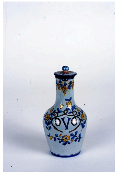
Vue générale d'une des 5 bouteilles de pharmacie, cet exemplaire étant orné du monogramme V. IVR21_20045900286ZA