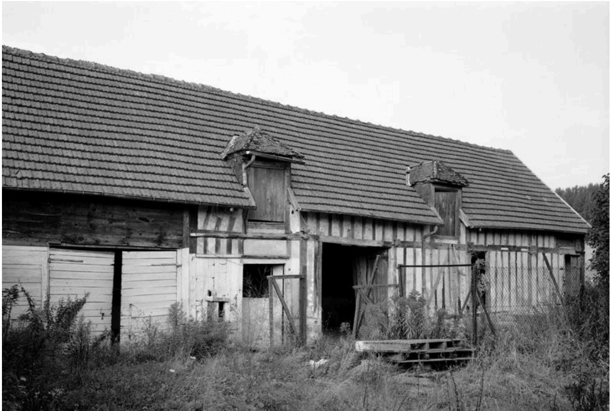
Etables et remises.