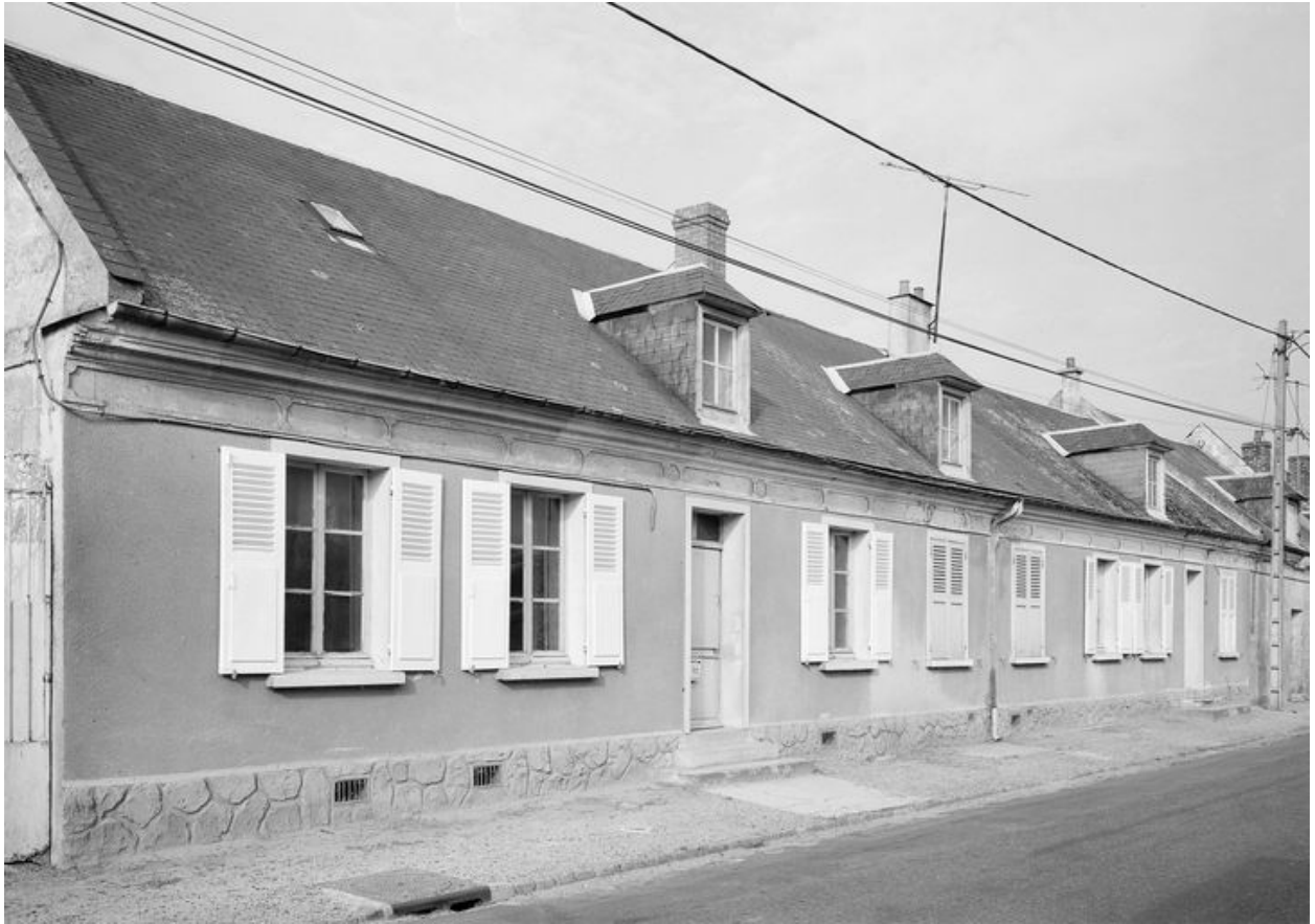
Elévation sur rue.