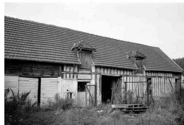
Etables et remises. IVR22_19846001148X