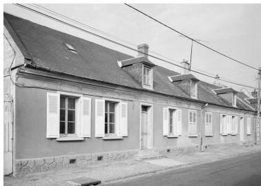
Élévation sur rue. IVR22_19846001147X