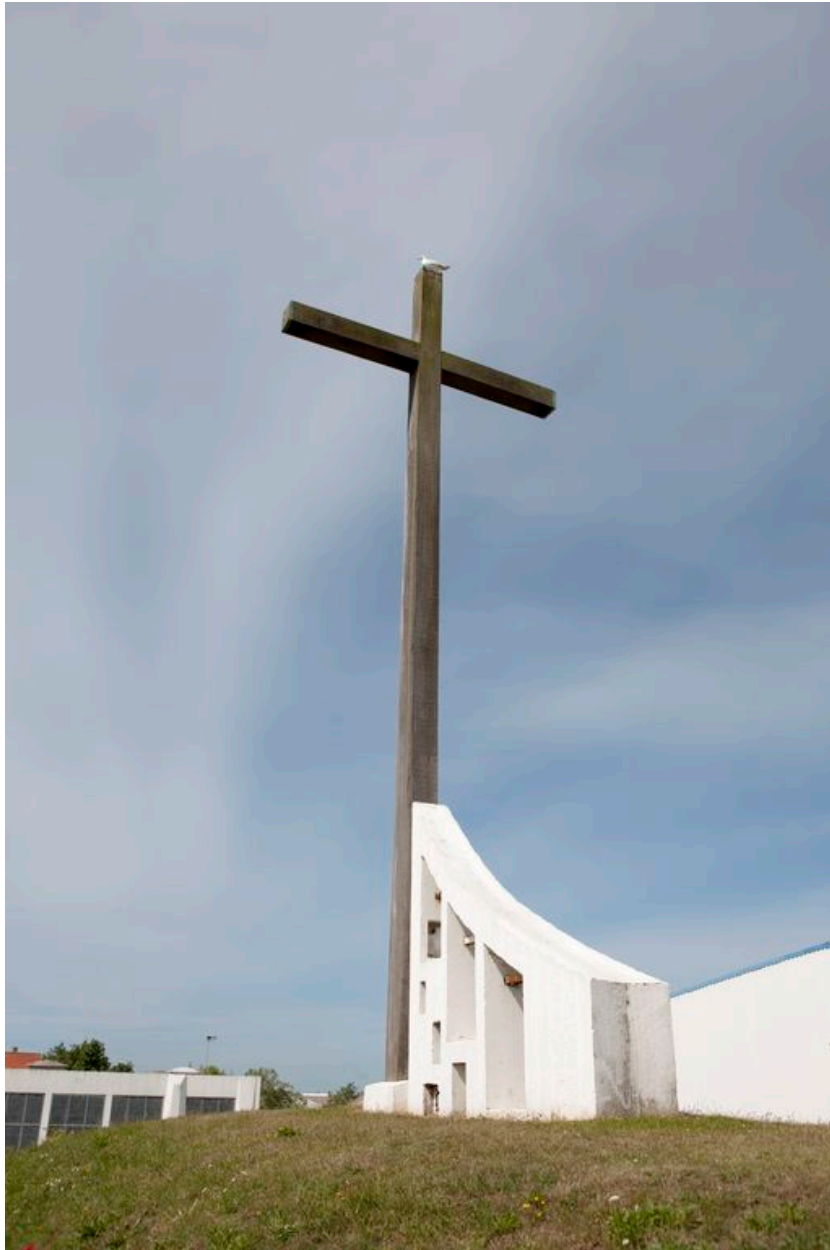
Détail du campanile.