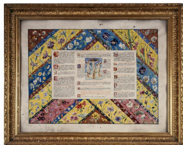
Vue du canon central.