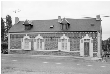
Vue générale. IVR22_19856001002X

Plan de situation. Extrait du plan cadastral de 1982, section AC 106. IVR22_20096000130NUCA