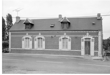
Vue générale. IVR22_19856001002X

Plan de situation. Extrait du plan cadastral de 1982, section AC 106. IVR22_20096000130NUCA