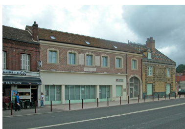
Vue d'ensemble sur rue.

Dess. J.-M. Fémolant IVR22_20076000324NUDA