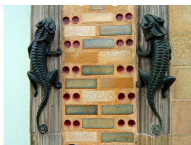
Détails des salamandres ornant la façade sur rue. IVR22_20066090077NUCA