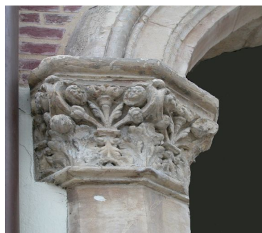
Détail du chapiteau du portail d'entrée sur rue. IVR22_20076000179NUCA