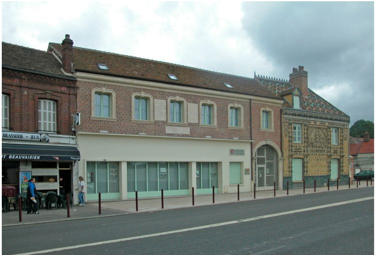
Vue d'ensemble sur rue.