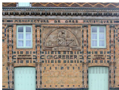
Détail de la partie centrale de la façade sur rue.

Façade sur rue de la Manufacture Gréber.