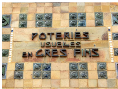
Détails de la façade de la Manufacture Gréber.