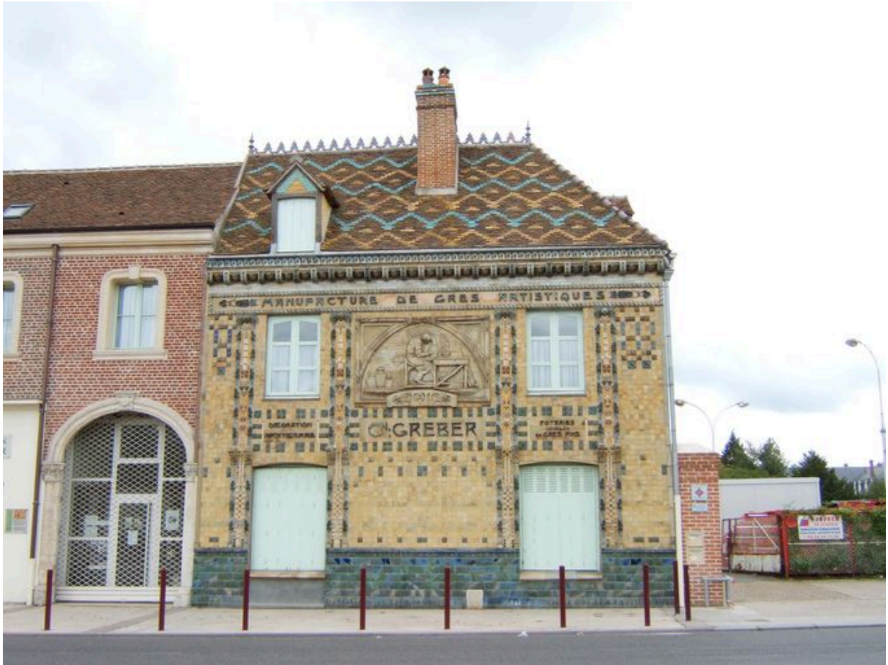
Façade sur rue de la Manufacture Gréber.