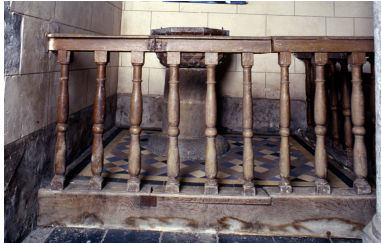
Vue générale de la chapelle des fonts baptismaux avec la clôture.