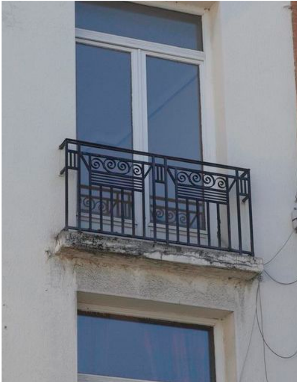
Ferronnerie Art déco.