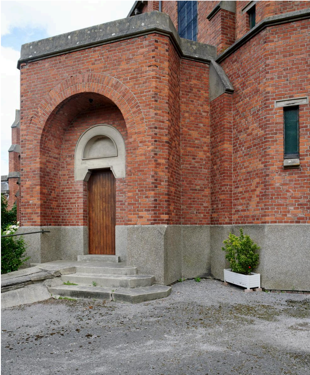
Portail d'entrée latéral sud de l'église.