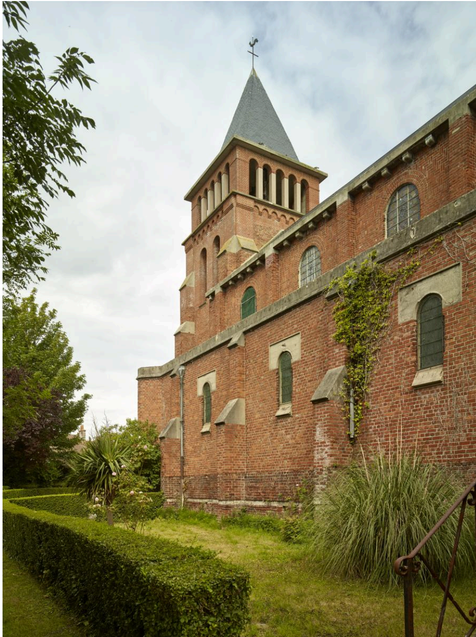
Le clocher depuis le sud-est.