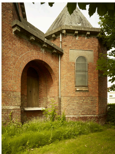
Vue extérieure de la chapelle des fonts baptismaux. IVR32_20226200183NUCA

IVR32_20226200184NUCA