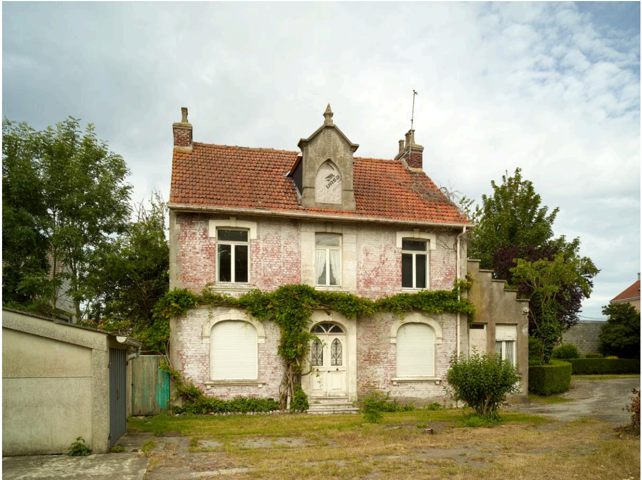
Façade est du presbytère.