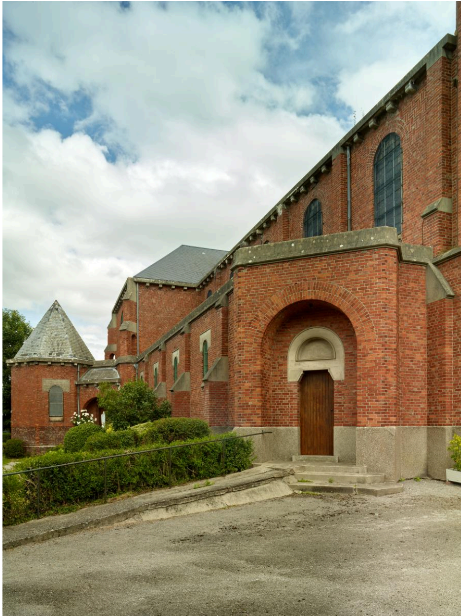
Portail latéral nord.