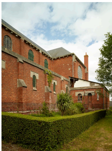
Vue extérieure de la nef depuis le nord-est. IVR32_20226200191NUCA