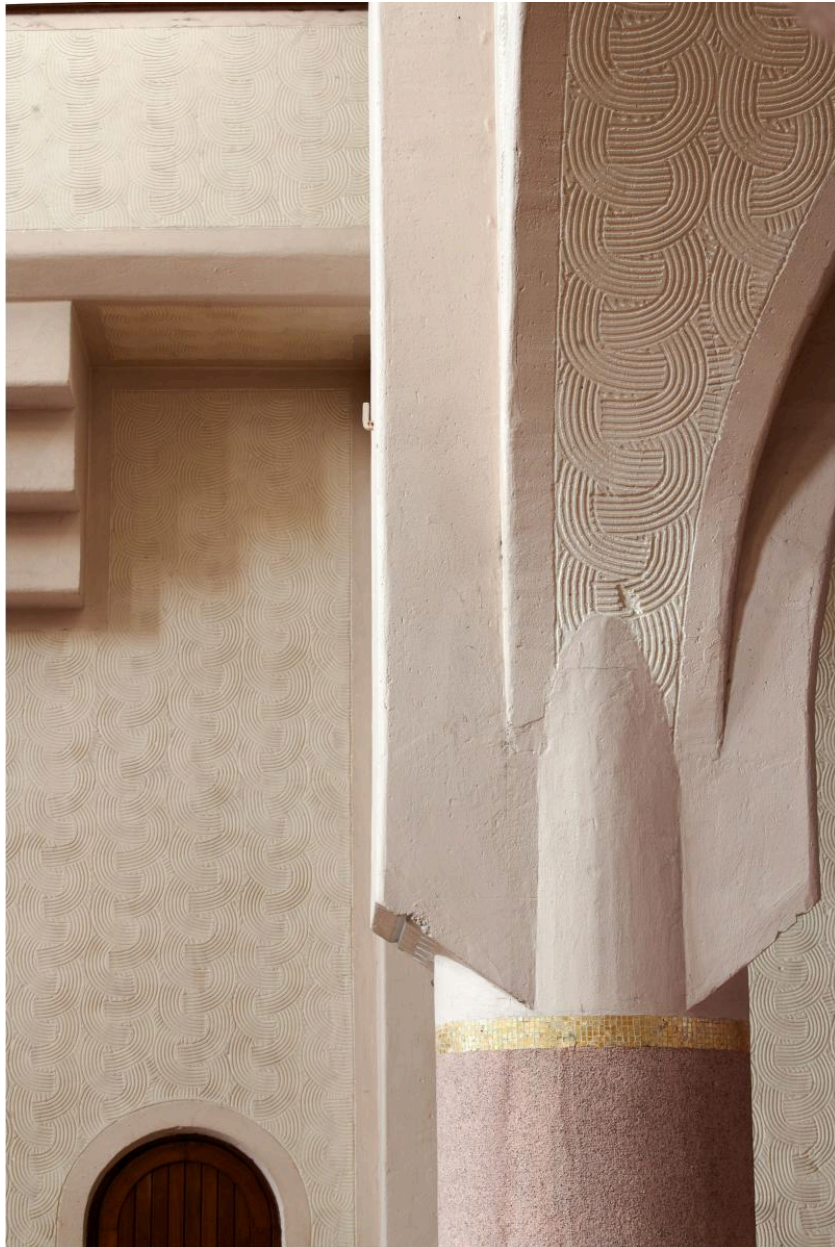
Détail de la liaison entre une colonne de la nef et une nervure des grandes arcades.