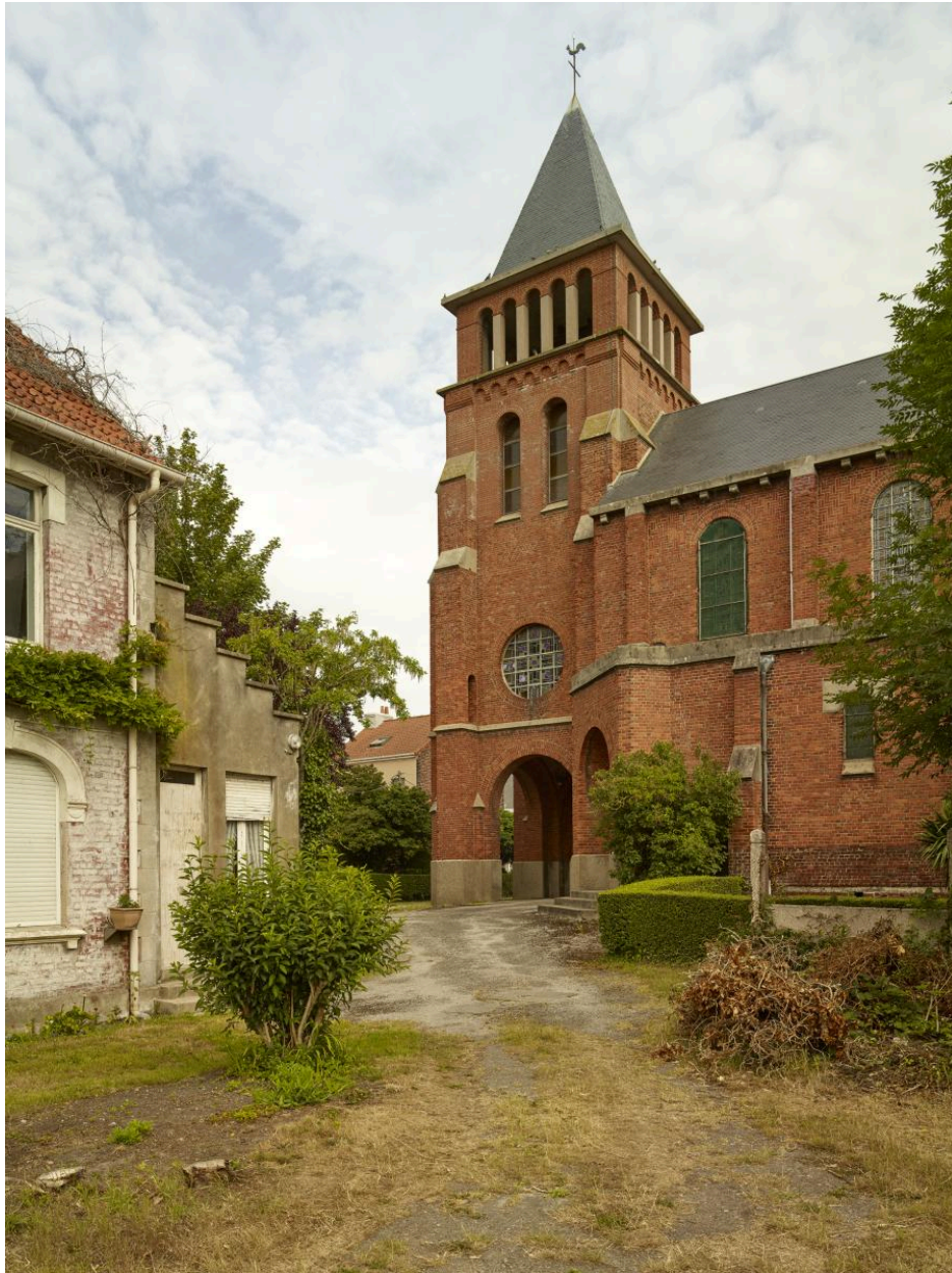
Le clocher-porche, vu depuis le sud-ouest, avec une partie du presbytère à gauche.