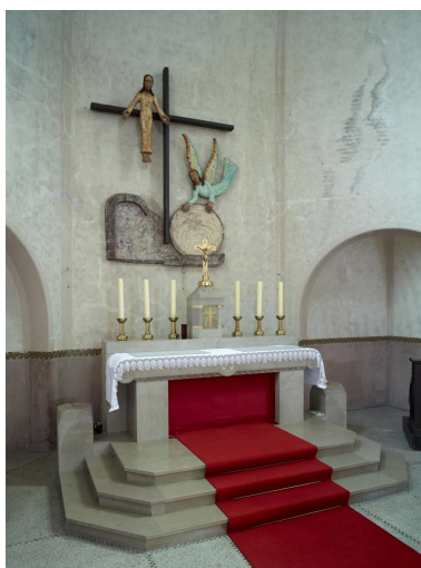
Maître-autel dans le chœur de l'église.