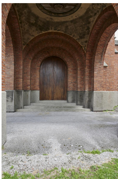
Entrée sous porche. IVR32_20226200251NUCA