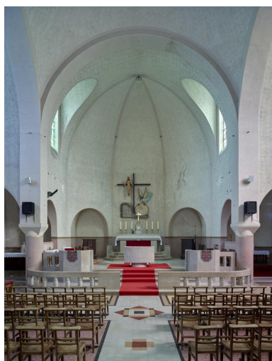
Vue du chœur. IVR32_20226200187NUCA