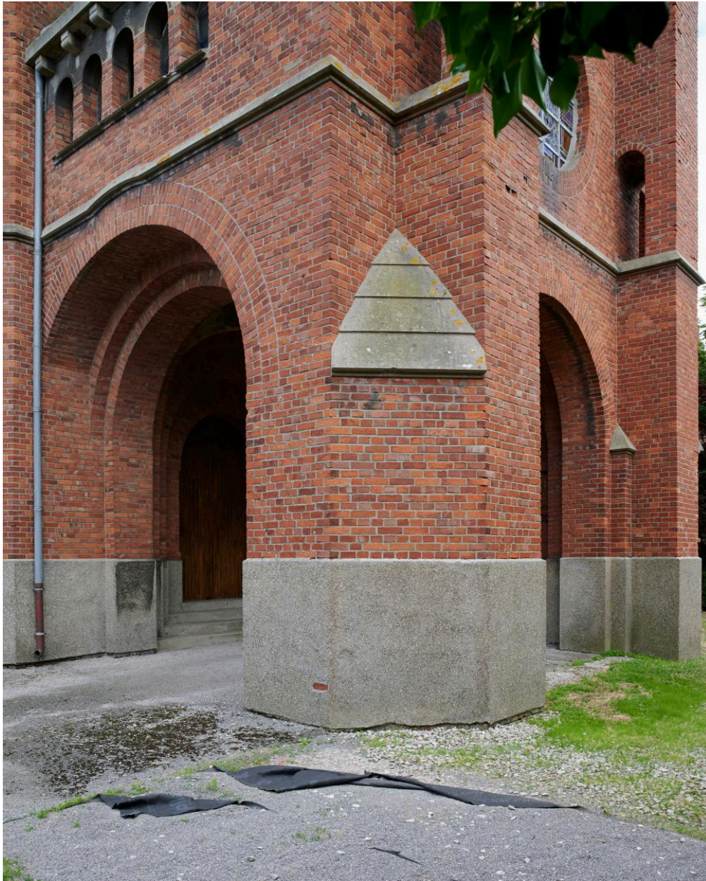
Clocher-porche. Vue depuis le nord-ouest.