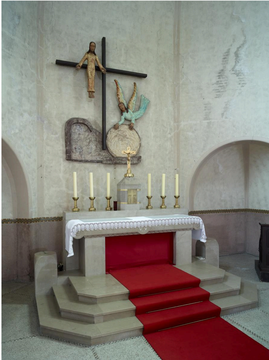
Maître-autel dans le chœur de l'église.