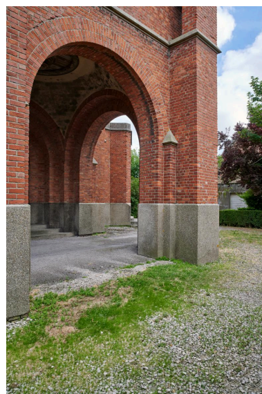
Le porche sous le clocher, face nord.