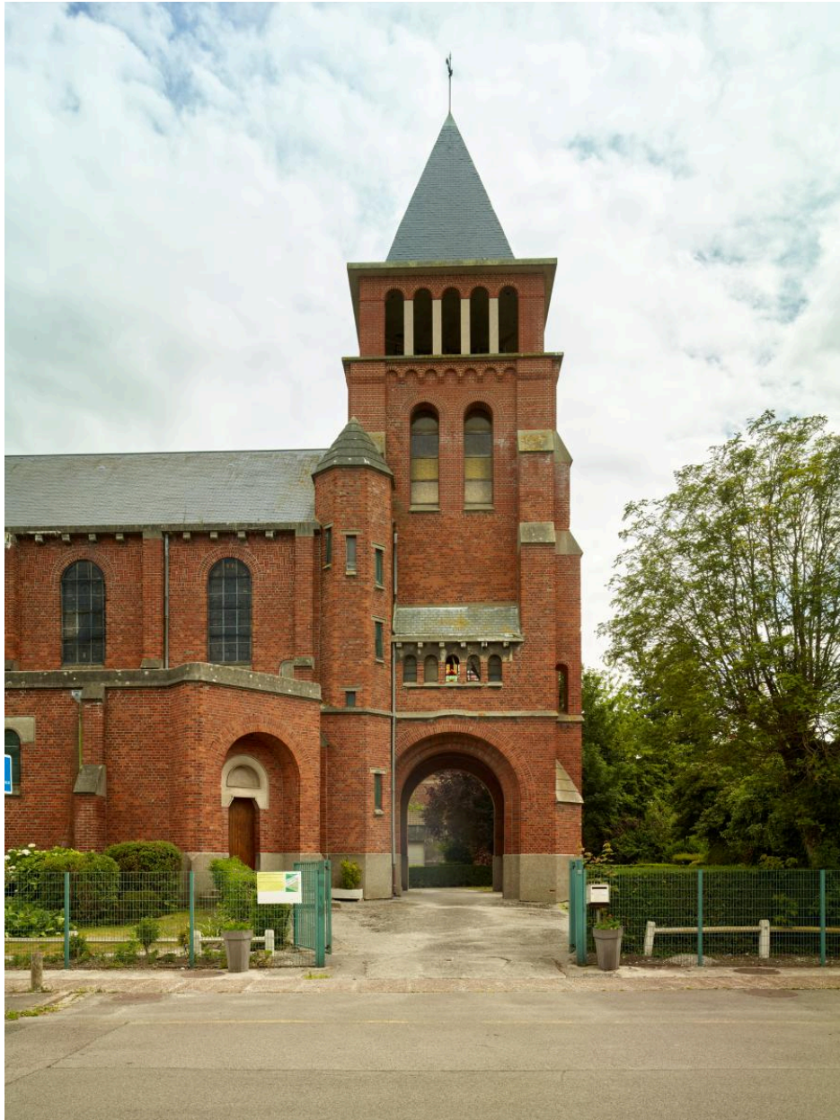
Clocher-porche à l'ouest de l'église.