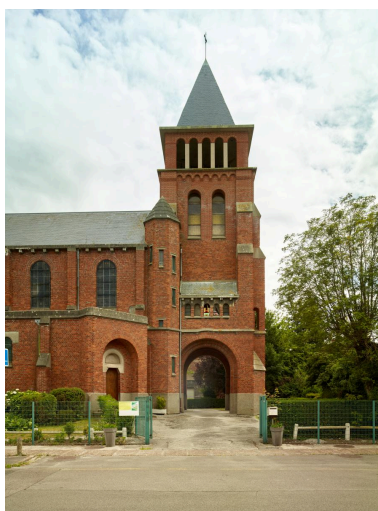
Clocher-porche à l'ouest de l'église. IVR32_20226200192NUCA