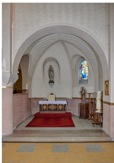
Vue intérieure de la chapelle absidiale sud.