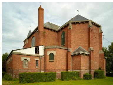
Chevet de l'église.