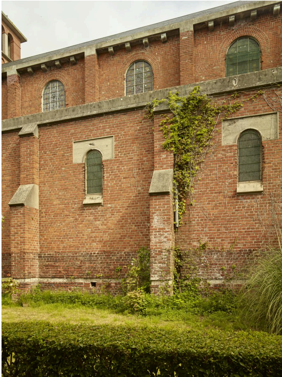
Vue de deux travées de la nef, côté sud.