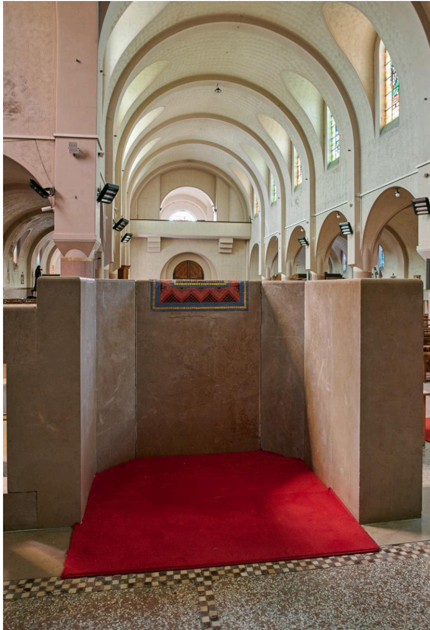
Ambon de chœur.