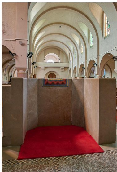
Ambon de chœur.