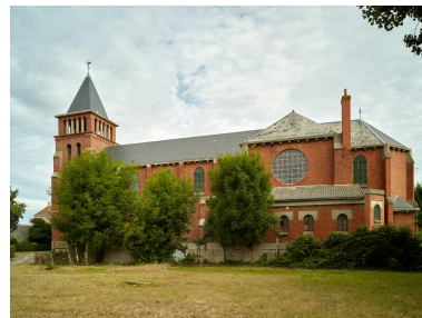
Vue générale sud-est. IVR32_20226200179NUCA