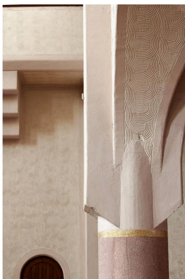
Détail de la liaison entre une colonne de la nef et une nervure des grandes arcades. IVR32_20226200231NUCA