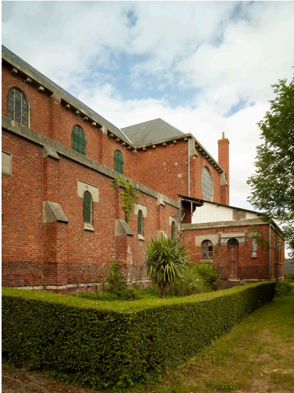
Vue extérieure de la nef depuis le nord-est.