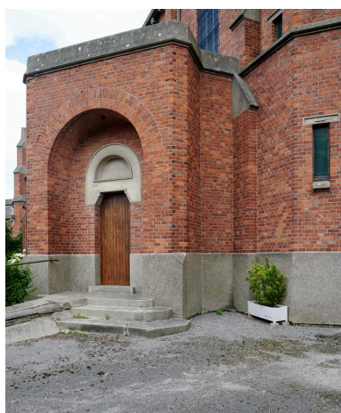
Portail d'entrée latéral sud de l'église.