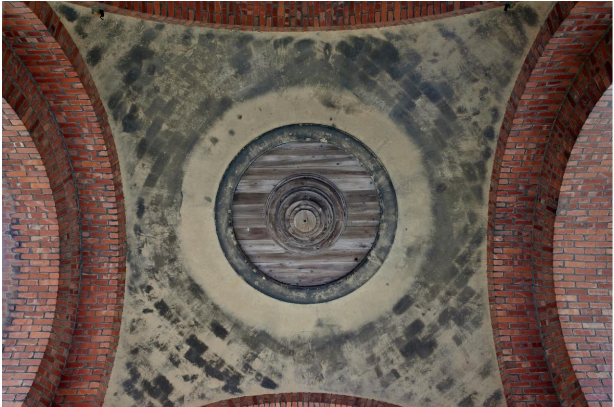
Voûte du porche.