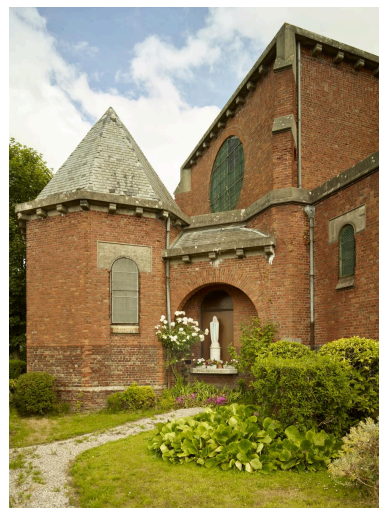
Vue extérieure de la chapelle des fonts baptismaux depuis le nord-ouest et de la chapelle de la Vierge attenante.