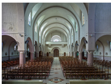
Vue intérieure de la nef vers l'ouest. IVR32_20226200176NUCA