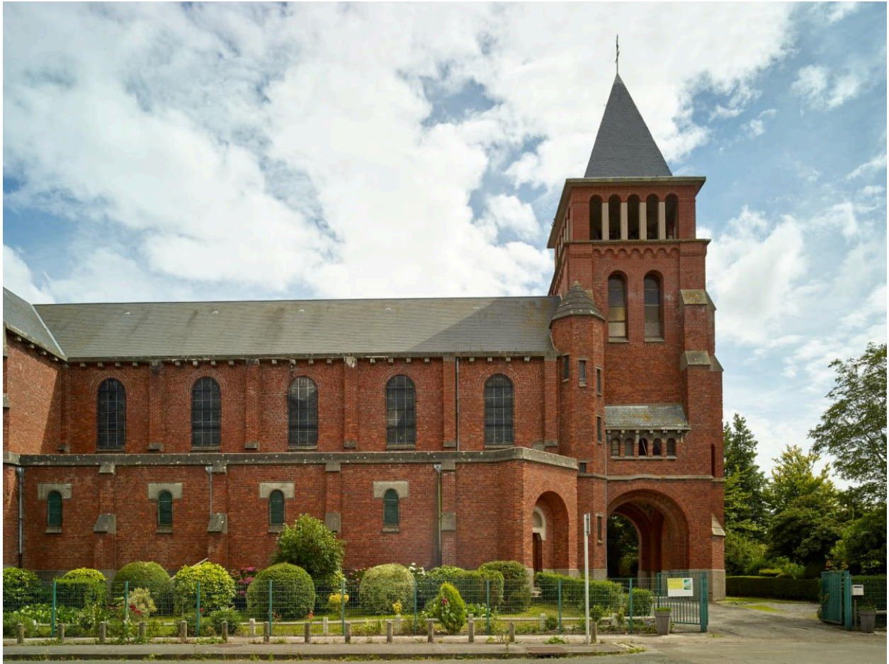
Vue générale depuis le nord.