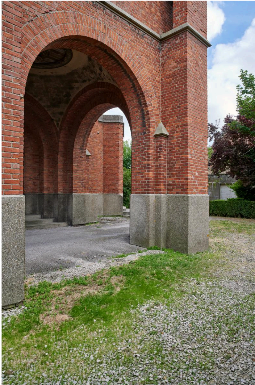
Le porche sous le clocher, face nord.