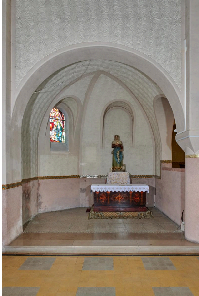
Vue intérieure de la chapelle absidiale nord.