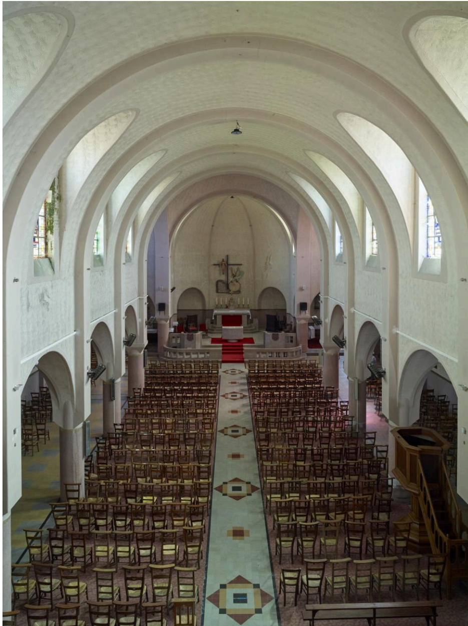
Vue d'ensemble intérieur vers le chœur.