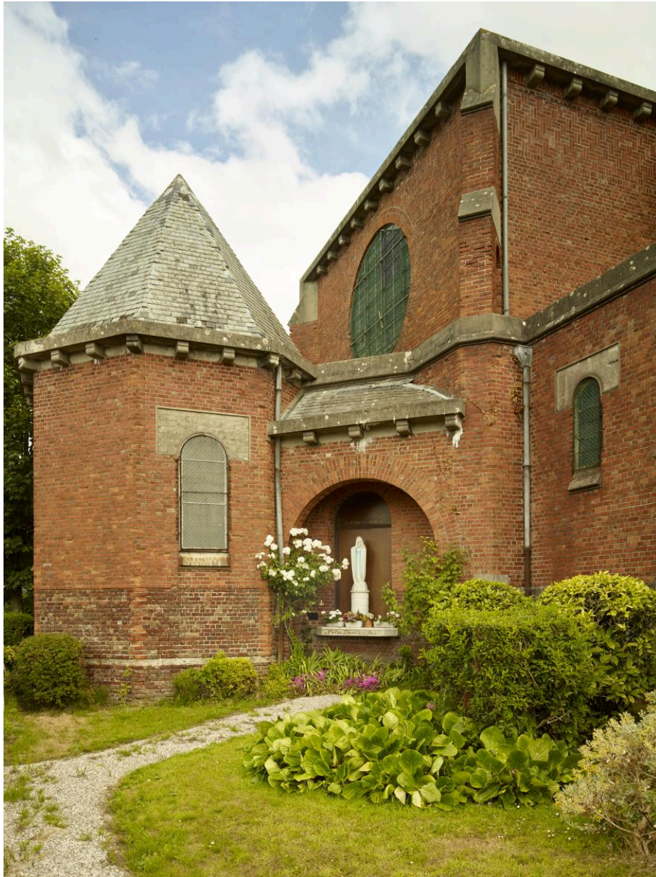
Vue extérieure de la chapelle des fonts baptismaux depuis le nord-ouest et de la chapelle de la Vierge attenante.