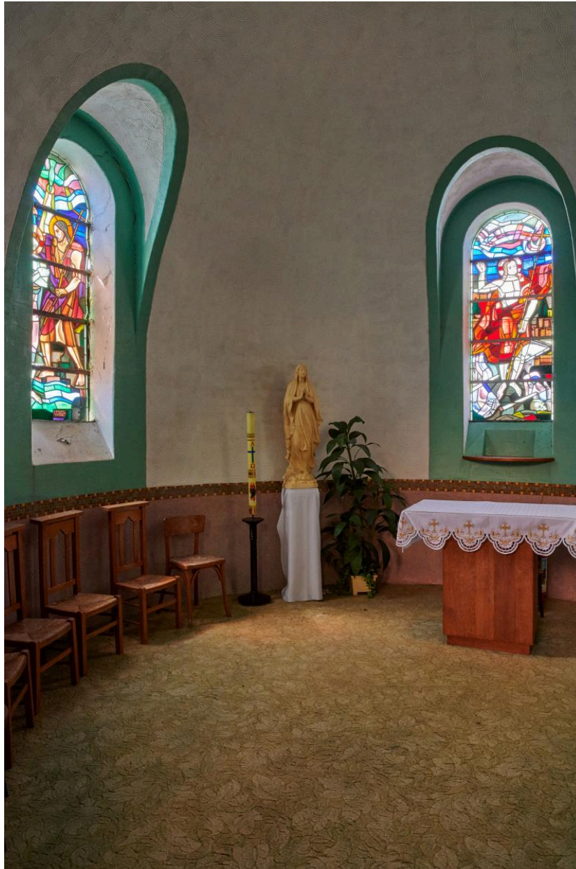
Vue intérieure de l'ancienne chapelle des fonts baptismaux.