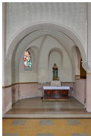
Vue intérieure de la chapelle absidiale nord. IVR32_20226200243NUCA