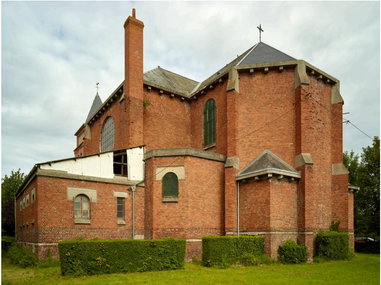
Chevet de l'église.