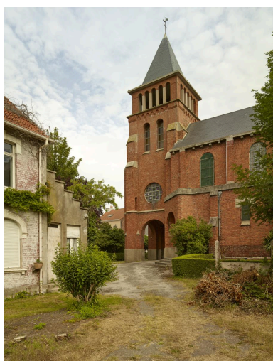
Le clocher-porche, vu depuis le sud-ouest, avec une partie du presbytère à gauche.