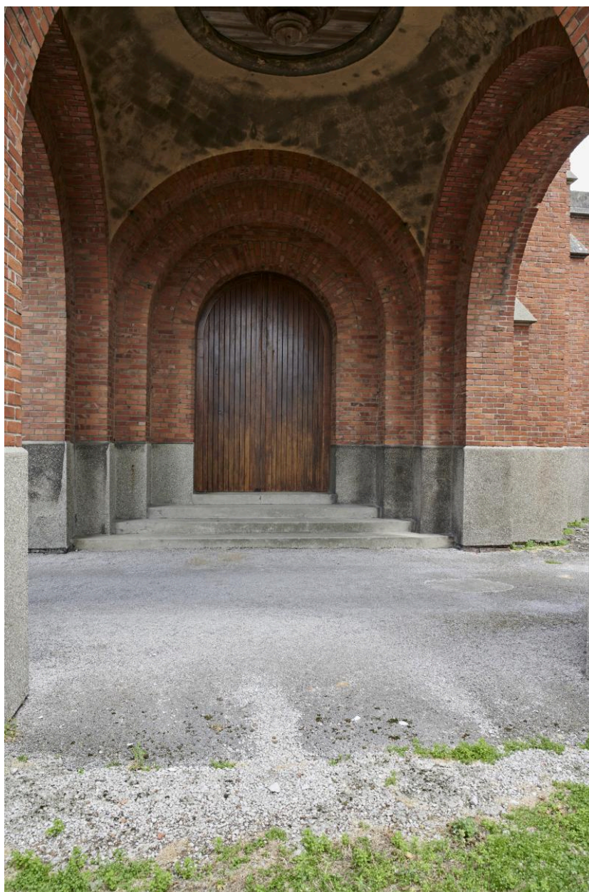
Entrée sous porche.