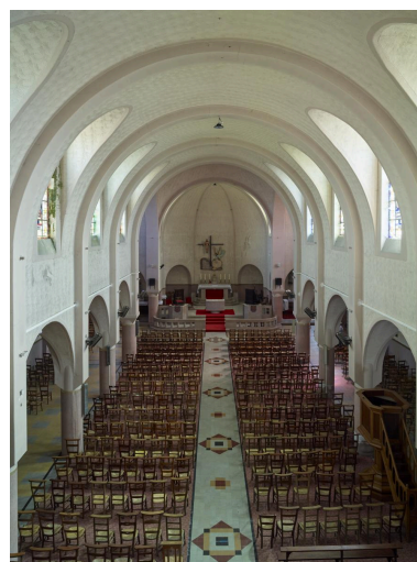
Vue d'ensemble intérieur vers le chœur.