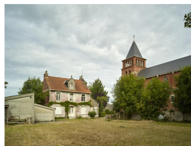
Vue générale de l'église et de son presbytère.

Vue de deux travées de la nef, côté sud.