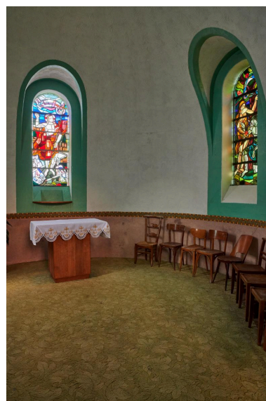
Vue intérieure de l'ancienne chapelle des fonts baptismaux.