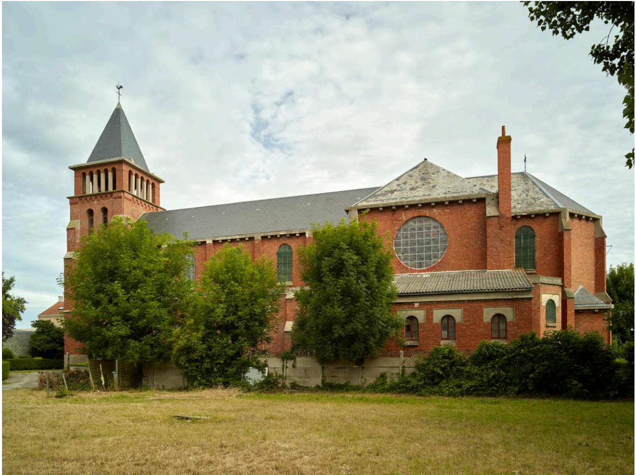
Vue générale sud-est.