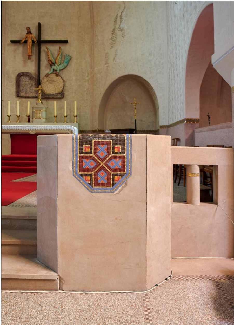
Clôture de chœur, table de communion et ambon.