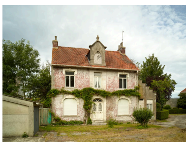
Façade est du presbytère.