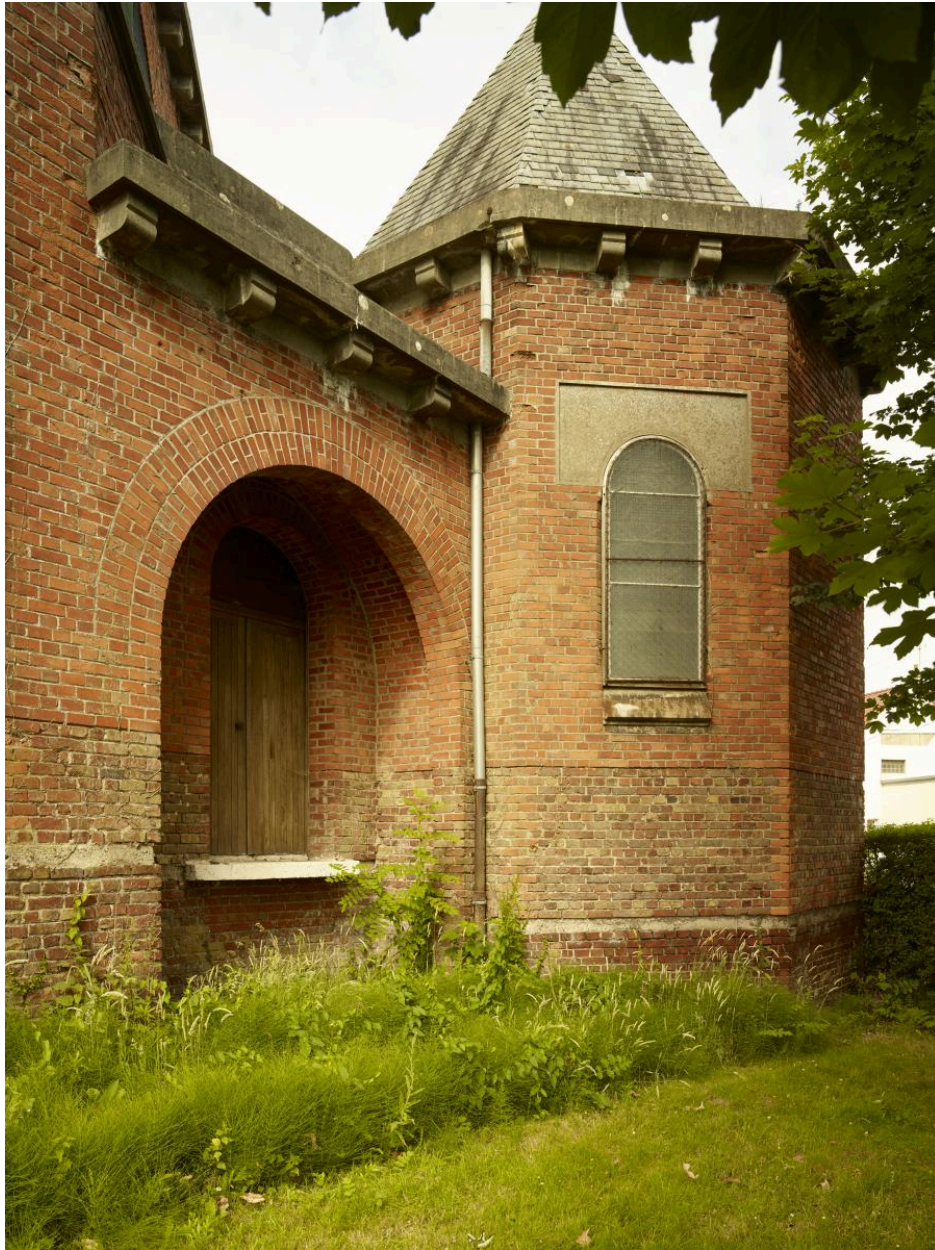
Vue extérieure de la chapelle des fonts baptismaux.