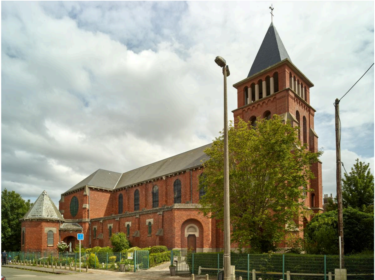
Vue générale nord-ouest.