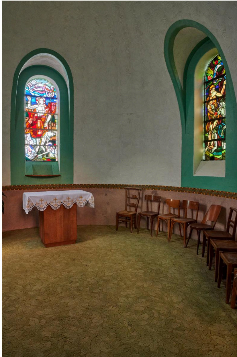
Vue intérieure de l'ancienne chapelle des fonts baptismaux.