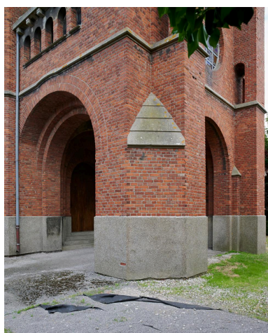
Clocher-porche. Vue depuis le nord-ouest. IVR32_20226200253NUCA