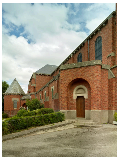
Portail latéral nord. IVR32_20226200190NUCA