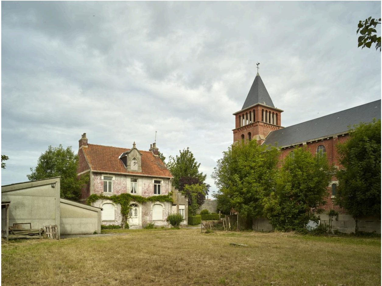
Vue générale de l'église et de son presbytère.