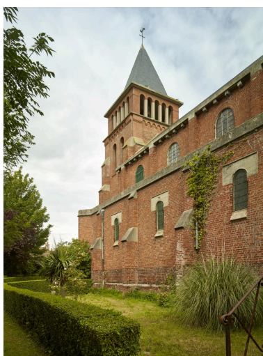
Le clocher depuis le sud-est.