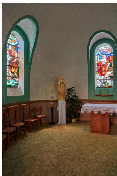
Vue intérieure de l'ancienne chapelle des fonts baptismaux. IVR32_20226200247NUCA