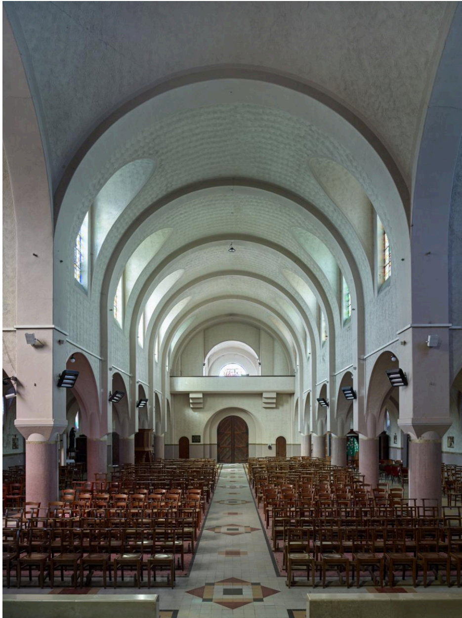
Vue intérieure de la nef vers l'ouest.