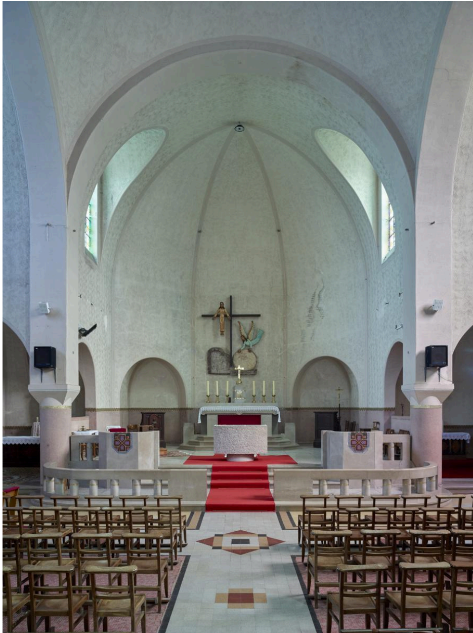
Vue du chœur.