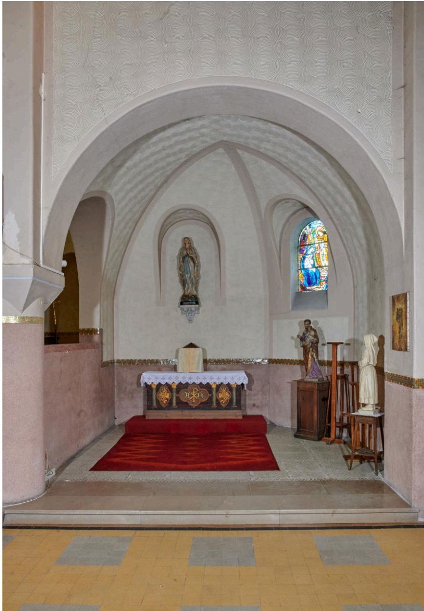
Vue intérieure de la chapelle absidiale sud.