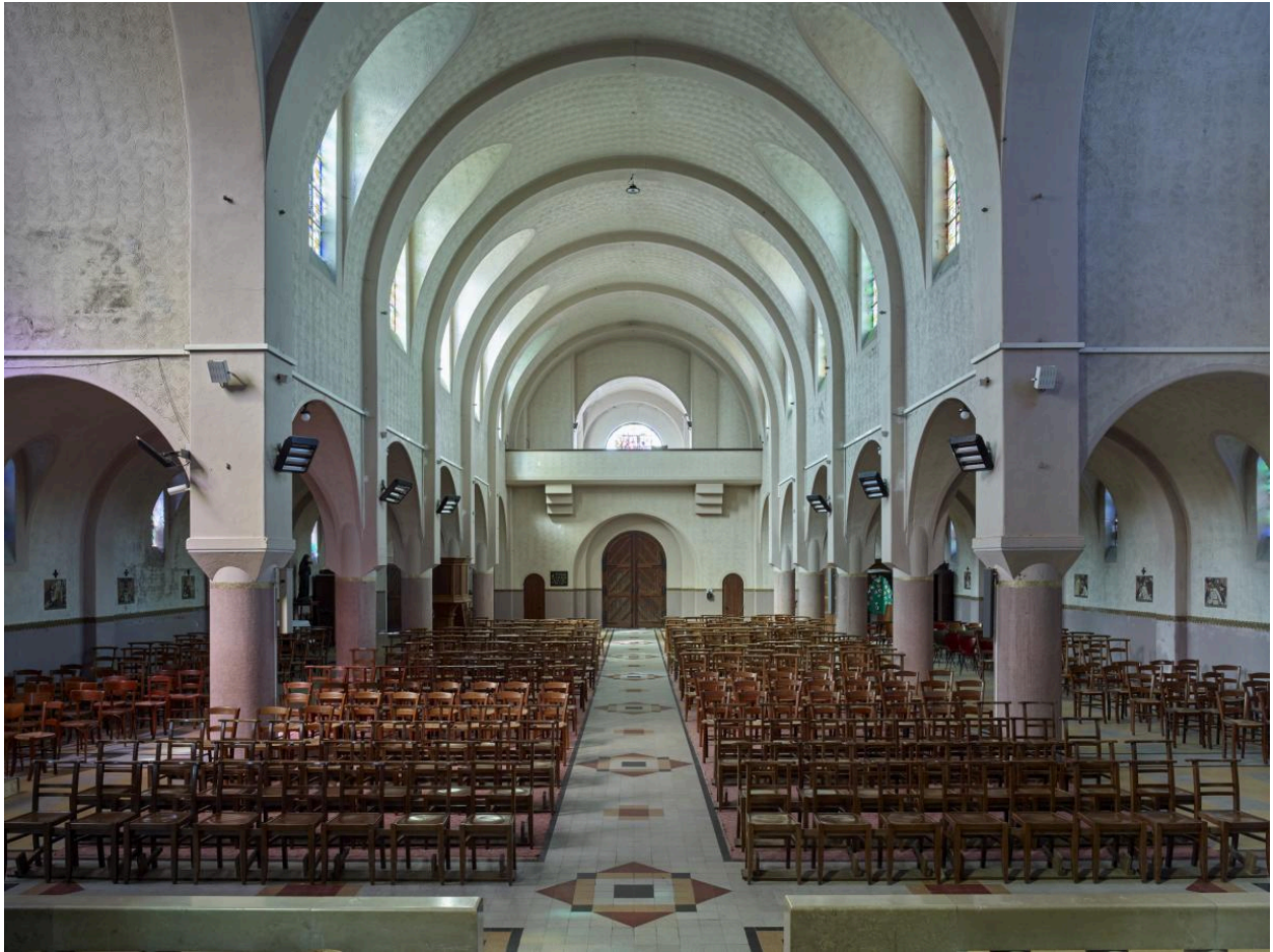
Vue intérieure de la nef vers l'ouest.