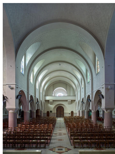
Vue intérieure de la nef vers l'ouest.