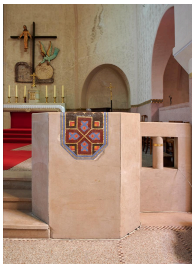
Clôture de chœur, table de communion et ambon.