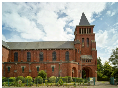
Vue générale depuis le nord.