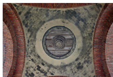
Voûte du porche.