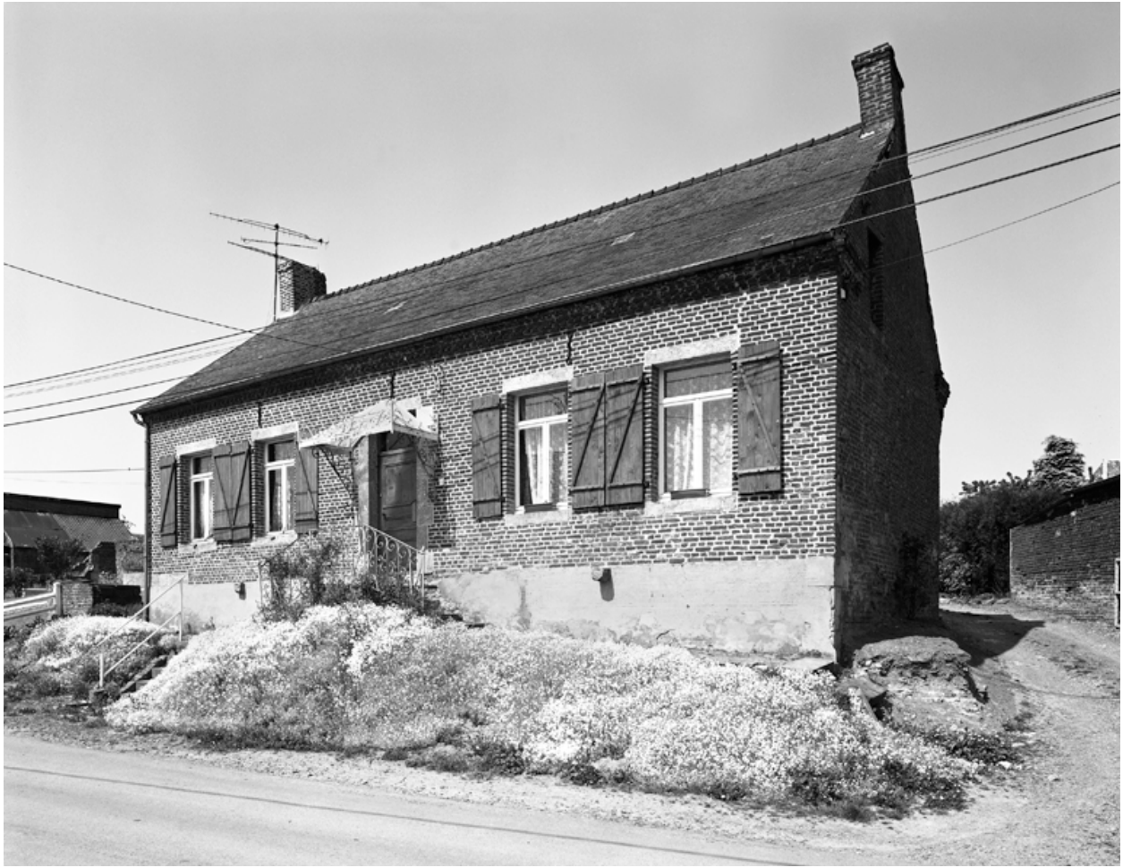
Fesmy-le-Sart, maison (étudiée), 7 rue de la Laiterie.