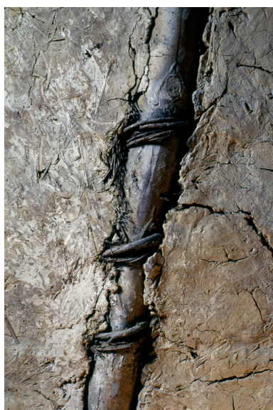
Barzy-en-Thiérache, ferme (repérée), 30 rue Neuve : détail d'une cloison en torchis dans le comble du logis. IVR22_19930201049ZA