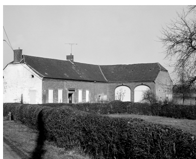
Le Nouvion-en-Thiérache. Ferme (étudiée), 49 chemin de Beaucamp à la Fontaine des Pauvres. IVR22_19960201059X