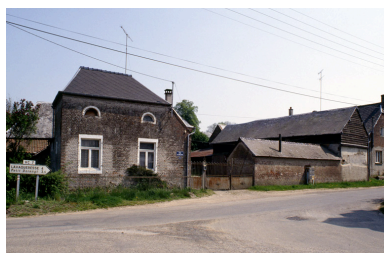
Dorengt, ferme (étudiée), 1 rue à Cailloux. IVR22_19930201162ZA