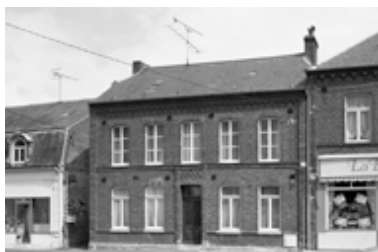
Boué, maison (étudiée), 4 rue des Vannois. IVR22_19960200563X