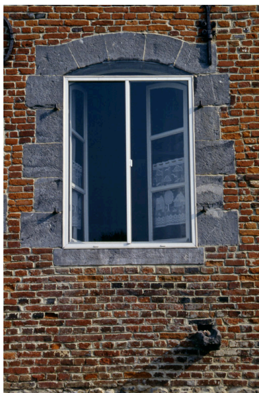
Barzy-en-Thiérache, maison (repérée), 57 Grande-Rue : détail d'une fenêtre avec encadrement en pierre bleue. IVR22_19930201083ZA