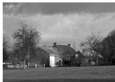
Esquéhéries, ferme, 6 rue du 8-Mai. IVR22_19960200924X