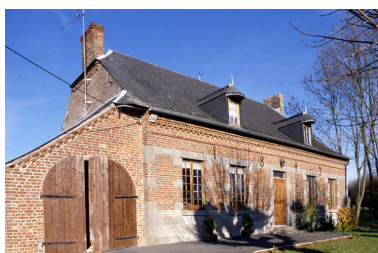
Dorengt, ferme (étudiée), Le Petit Dorengt, 4 rue du Moulin-Lavaqueresse.