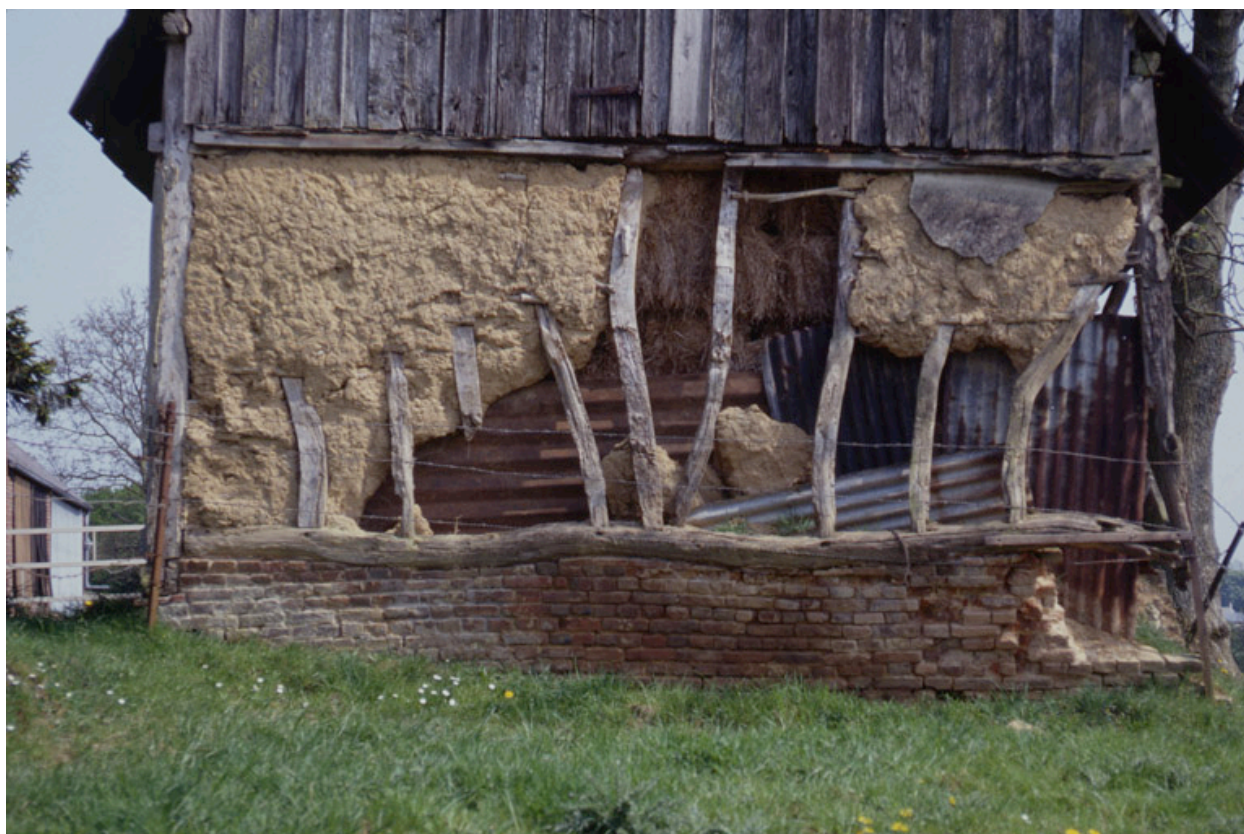
Dorengt, ferme (repérée), ruelle des Près : structure du pignon ouest de la grange en pan de bois et torchis sur solin de brique.