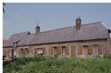
Barzy-en-Thiérache, ferme (repérée), 30 rue Neuve : logis et grange attenante. IVR22_19930201047ZA