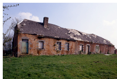
Barzy-en-Thiérache, ferme (repérée), 38 Grande-Rue : logis et étable attenante.