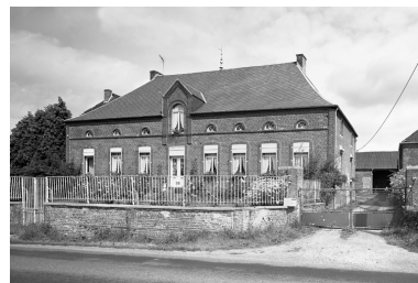
Boué, ferme (étudiée), la Folie, 1 route du Nouvion. IVR22_19960200578V