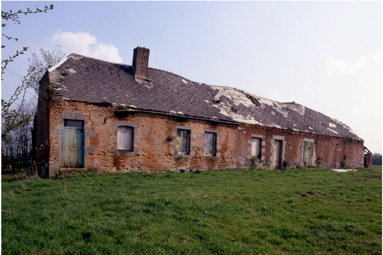
Barzy-en-Thiérache, ferme (repérée), 38 Grande-Rue : logis et étable attenante.