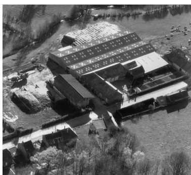
Esquéhéries, ferme (étudiée), la Petite Rue, 28 rue dite de la Petite-Rue. IVR32_20170200408NUC2A