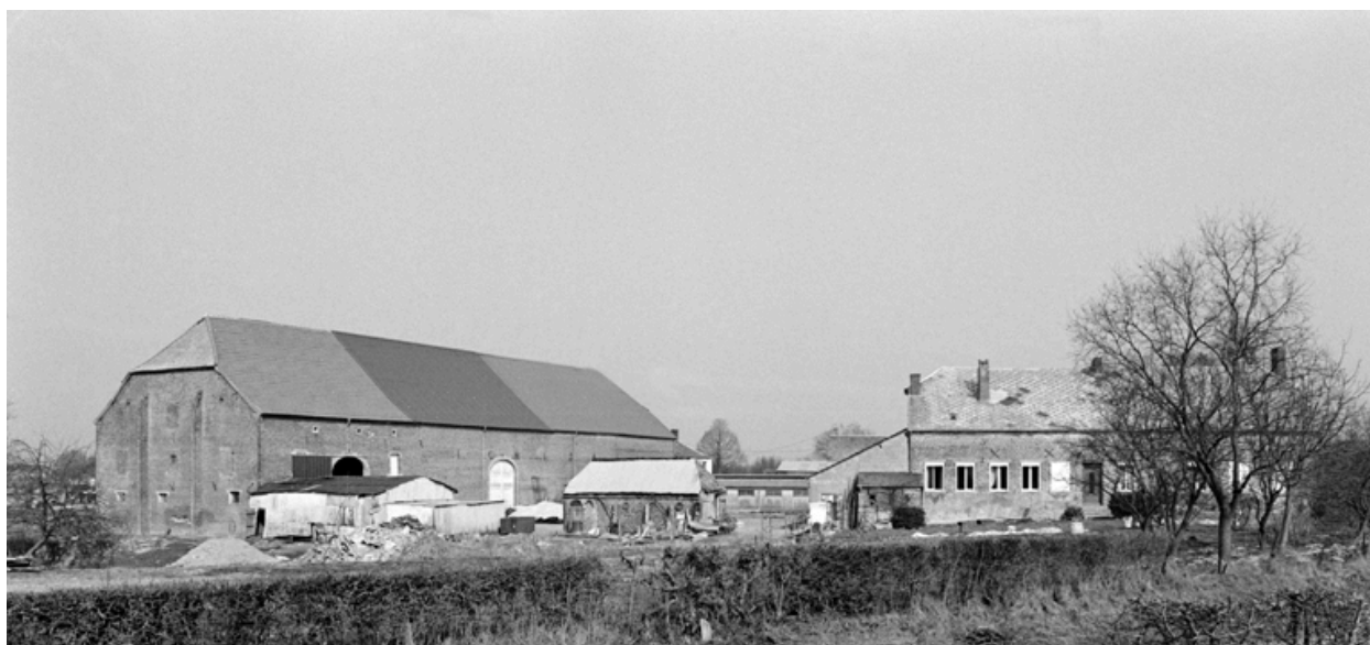
Esquéhéries, ferme (étudiée), le Burcq, 2-4 route de Lavaqueresse.