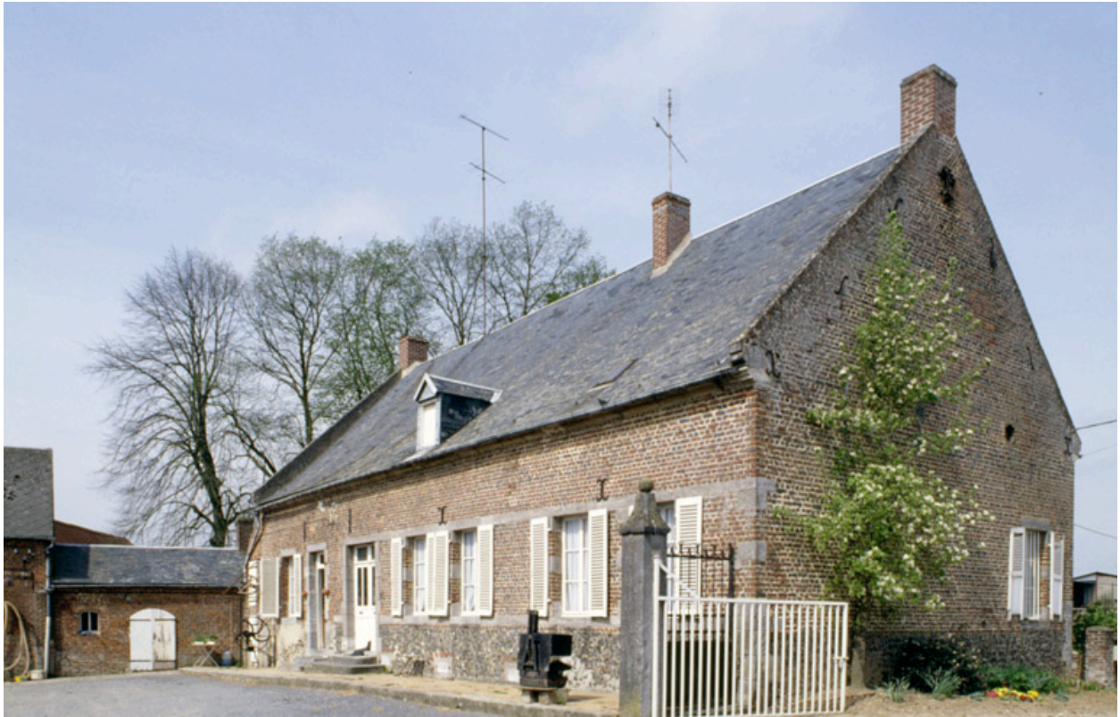
Dorengt, ferme (repérée), 14 ruelle Champagne : logis daté de 1837 et parties agricoles.