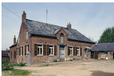
Dorengt, ferme (repérée), 13 ruelle Champagne : logis.