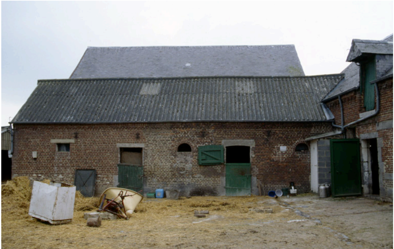
Fesmy-le-Sart, ferme (repérée), le Sart, Chemin de la Vallée-Briolet : élévation est sur cour de la ferme datée 1824.