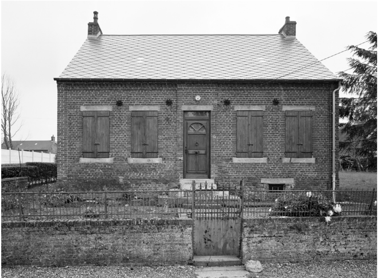
Barzy-en-Thiérache, maison (étudiée), 14 Grande-Rue.