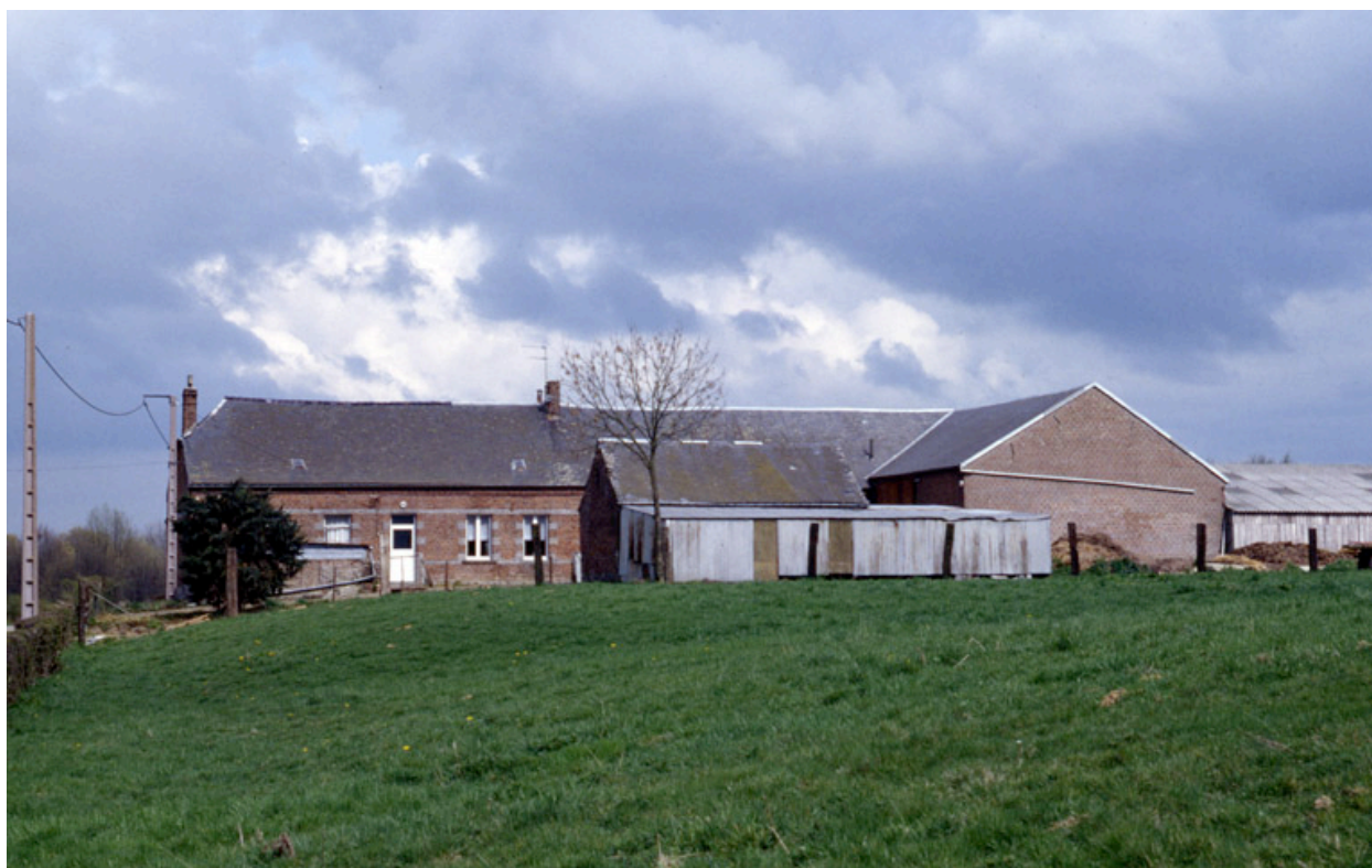
Fesmy-le-Sart, ferme (repérée), le Sart, rue de Saint-Pierre : vue générale depuis l'ouest.