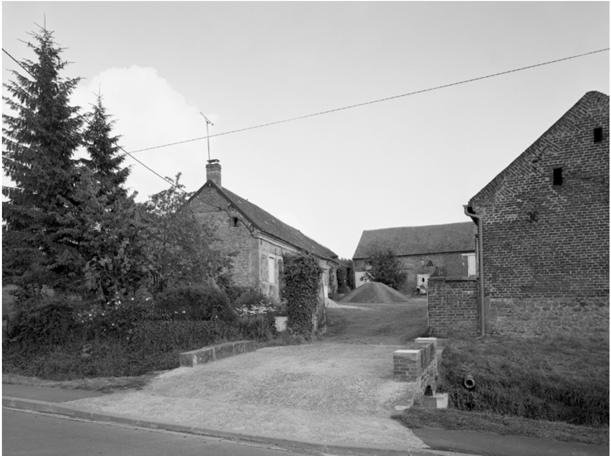
Boué, ferme (étudiée), 26 rue des Vannois.