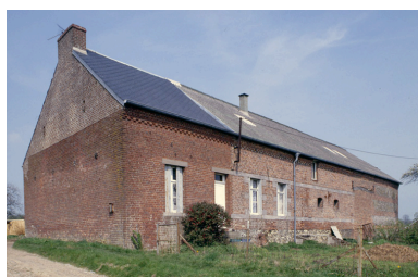
Fesmy-le-Sart, ferme (repérée), la Carrière-Etreux, 15 rue Carrière-Etreux : logis avec étable attenante. IVR22_19930201344ZA