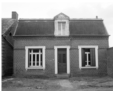
Esquéhéries, maison (étudiée), 20 rue de Verdun. IVR22_19960200886X