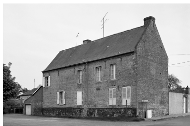
Esquéhéries, ancienne ferme (étudiée), 1 route du Chenot.