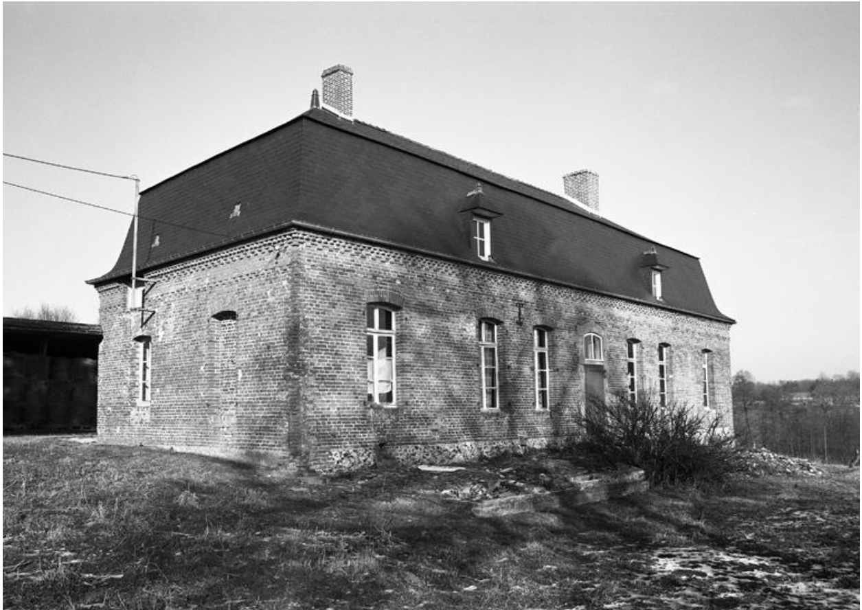
Leschelle. Ferme (étudiée), ruelle du Moulin de Leval.