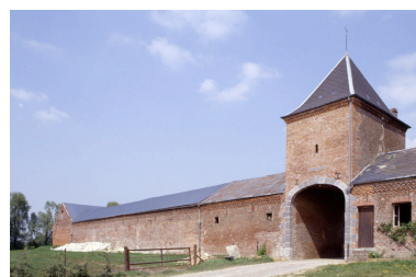
Dorengt, ferme de Ribeaufontaine (étudiée), chemin rural de Dorengt au Chenot. IVR22_19930201182ZA