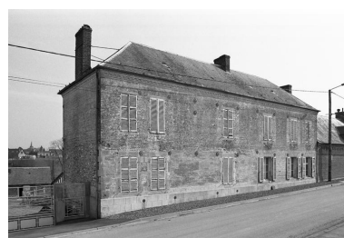
La Neuville-lès-Dorengt. Ferme (étudiée), 5 rue du Fort. IVR22_19960200368Z