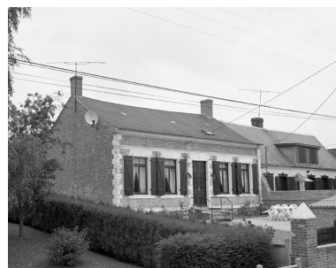
Boué, maison (étudiée), 14 rue d'Oisy. IVR22_19960200564X