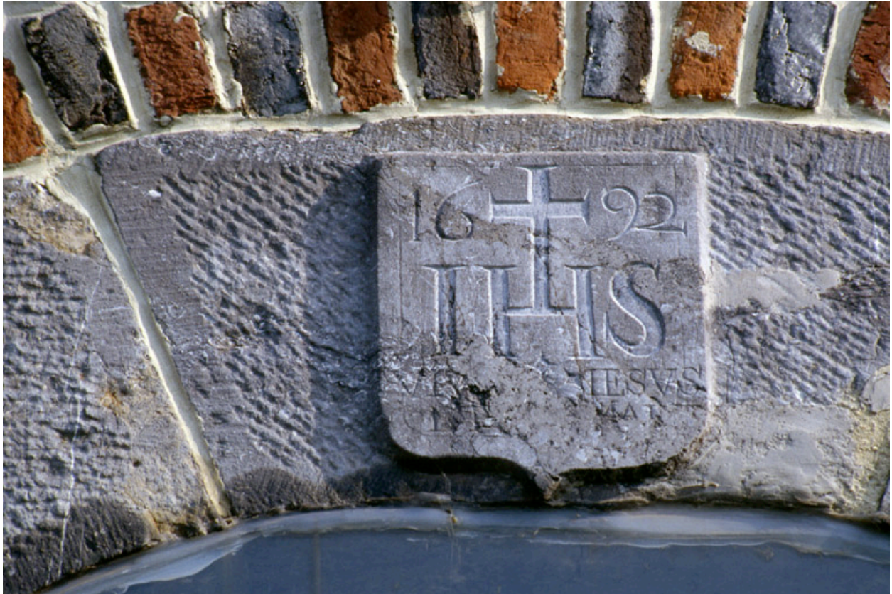
Barzy-en-Thiérache, maison (repérée), 57 Grande-Rue : linteau de la porte portant la date 1692.