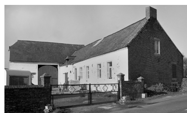
Esquéhéries, ancienne ferme (étudiée), le Grand-Wez, 7 route du Grand-Wez. IVR22_19960200868X