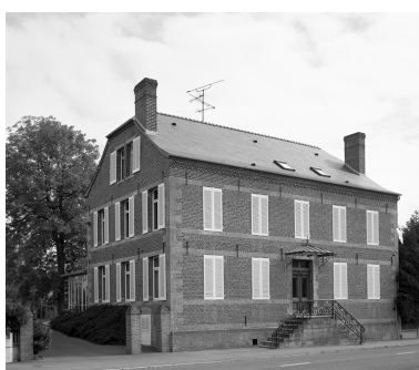
Boué, maison (étudiée) de l'ancien moulin à farine, 9 rue de la Gare.