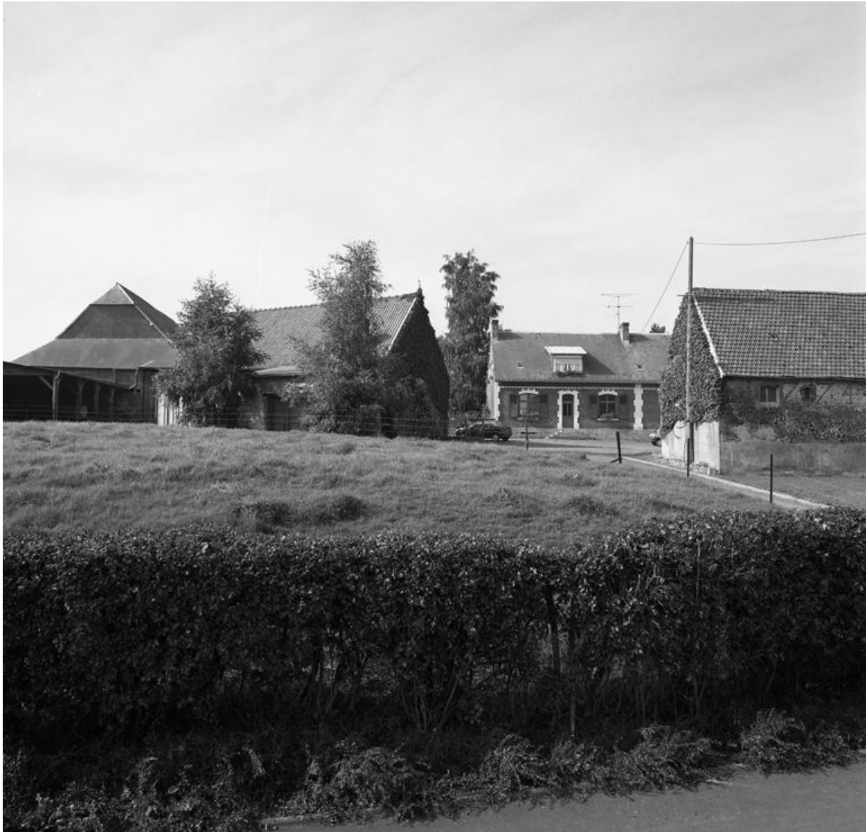
La Neuville-lès-Dorengt. Ferme (étudiée), 6 rue d'Etreux.