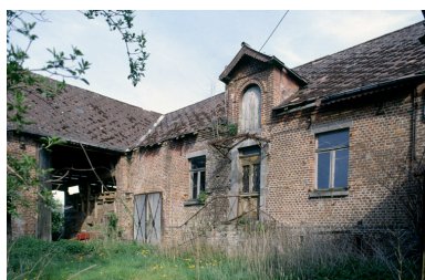
Dorengt, ferme (repérée), Le Petit-Dorengt, 2 rue du Moulin-Lavaqueresse : logis daté de 1892.