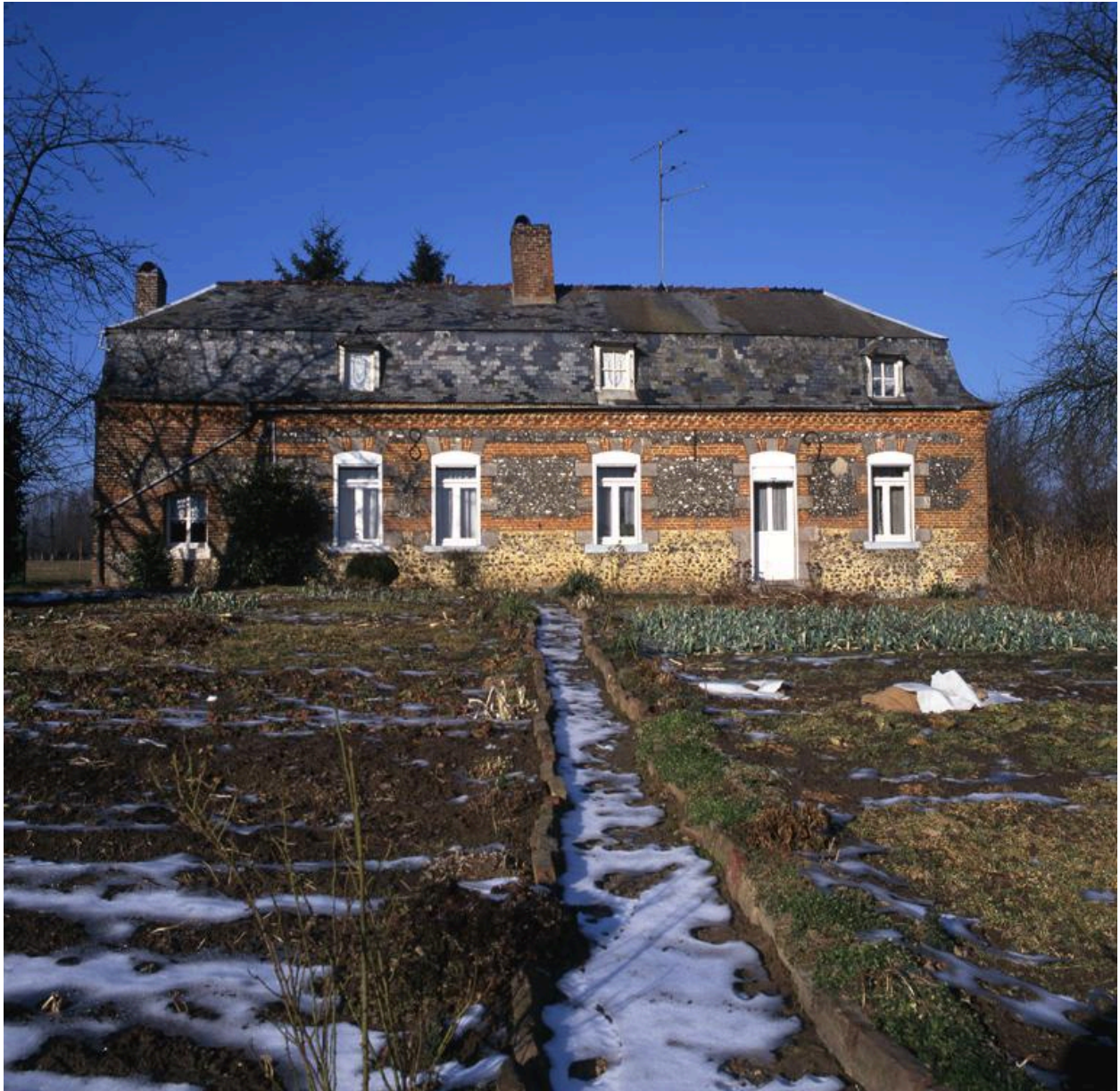
Leschelle. Ferme (étudiée), 8 ruelle du Moulin de Leval.