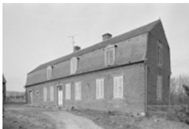
Boué, ferme (étudiée), 51 rue des Vannois. IVR22_19960200913Z