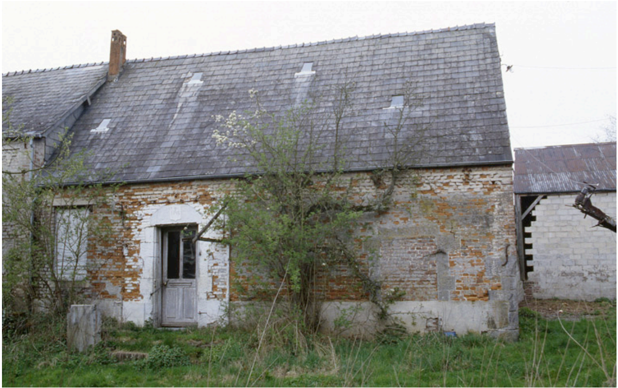
Barzy-en-Thiérache, ferme (repérée), 4 bis rue du Sart : logis.