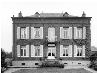
Barzy-en-Thiérache, ferme (étudiée), 13 Grande-Rue. IVR22_19930200597V