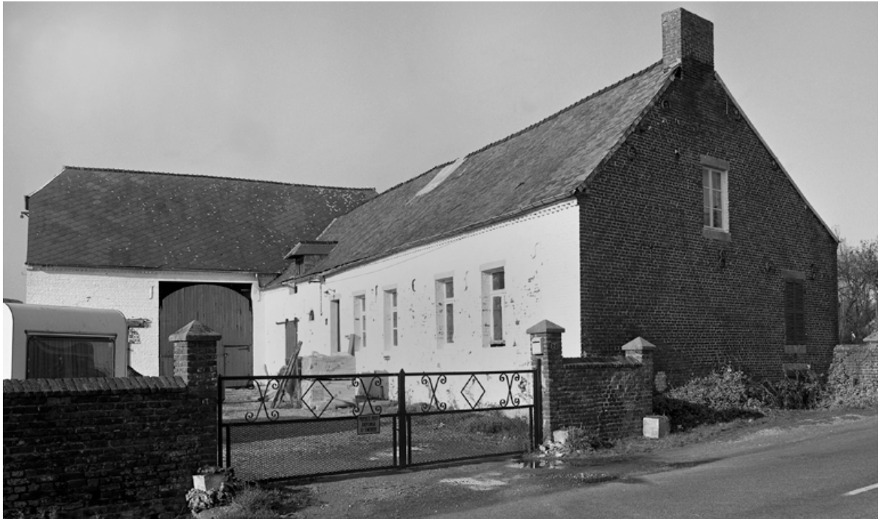
Esquéhéries, ancienne ferme (étudiée), le Grand-Wez, 7 route du Grand-Wez.