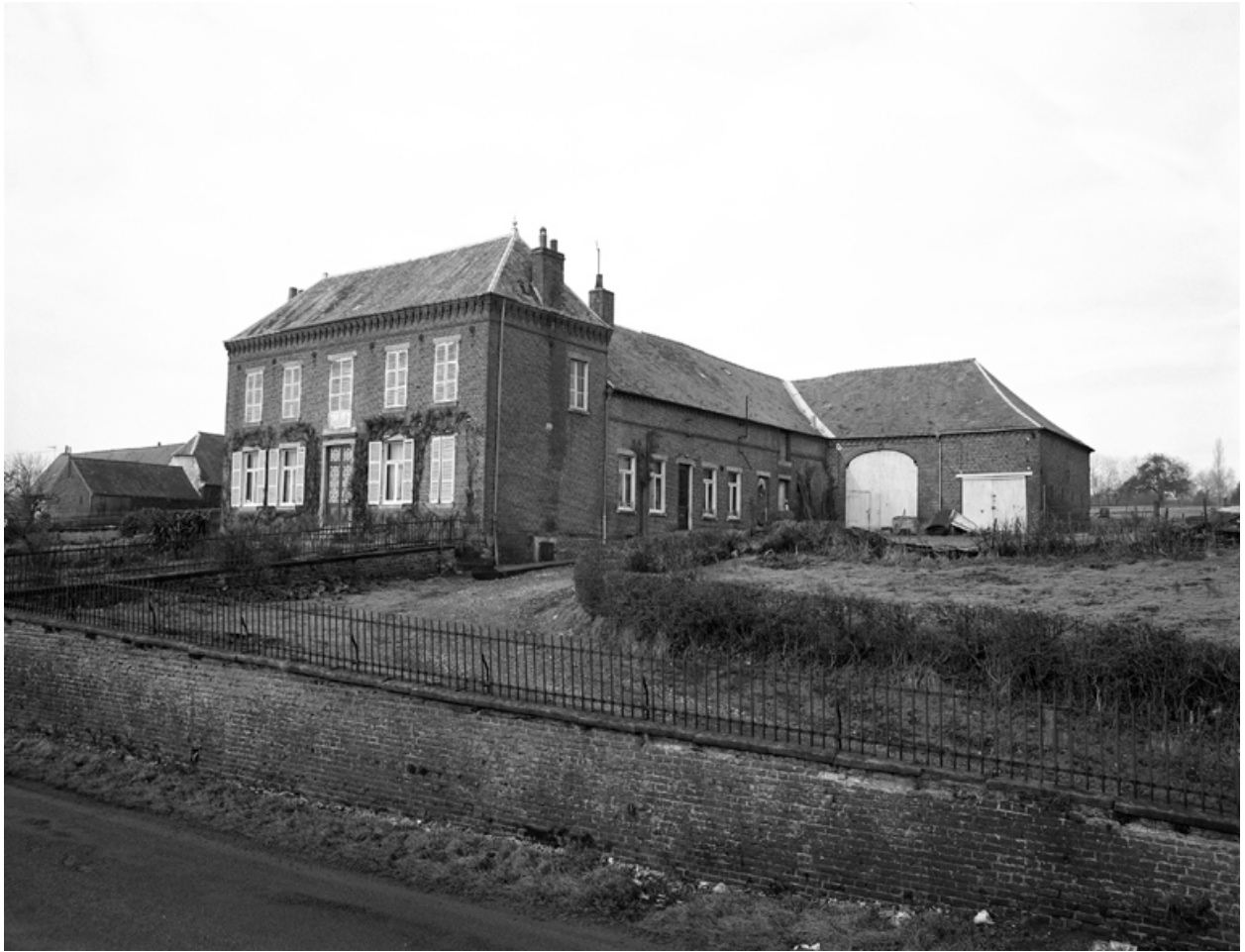
Le Nouvion-en-Thiérache. Ferme (étudiée), 4 rue de Boué.