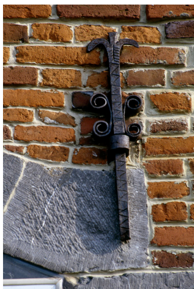
Barzy-en-Thiérache, maison (repérée), 57 Grande-Rue : fer d'ancrage de la façade (chiffre 1). IVR22_19930201081ZA