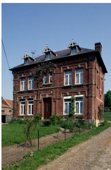
Barzy-en-Thiérache, ferme (repérée), 4 rue du Sart : logis construit en 1894.