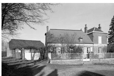
Dorengt, ferme (étudiée), 6 rue du Marais.