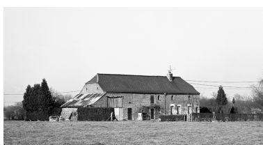
Le Nouvion-en-Thiérache. Ferme (étudiée), 38 chemin de Beaucamp à la Fontaine des Pauvres. IVR22_19960201063X