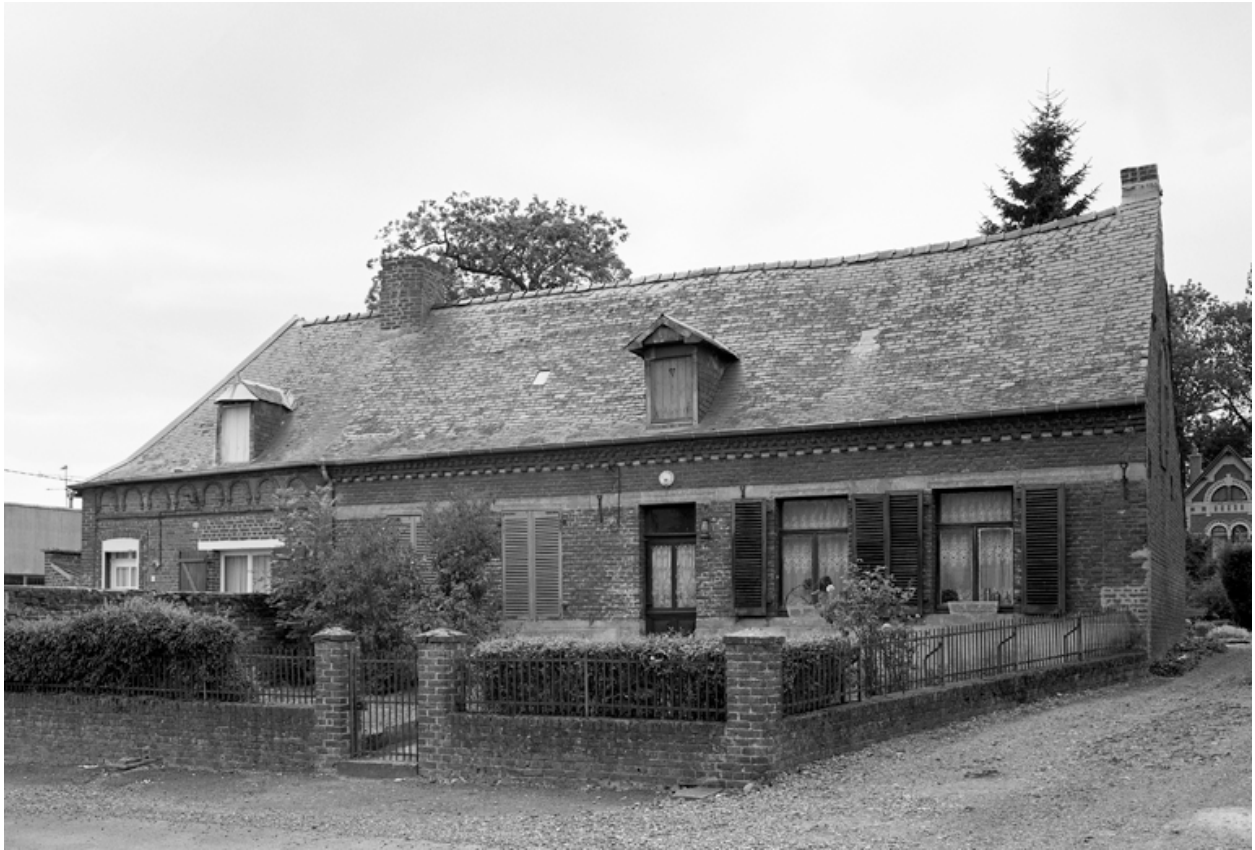
Boué, maison (étudiée), 13 rue des Marchands.