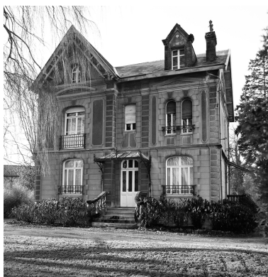
Boué, maison de médecin (étudiée), 1 rue d'Oisy.