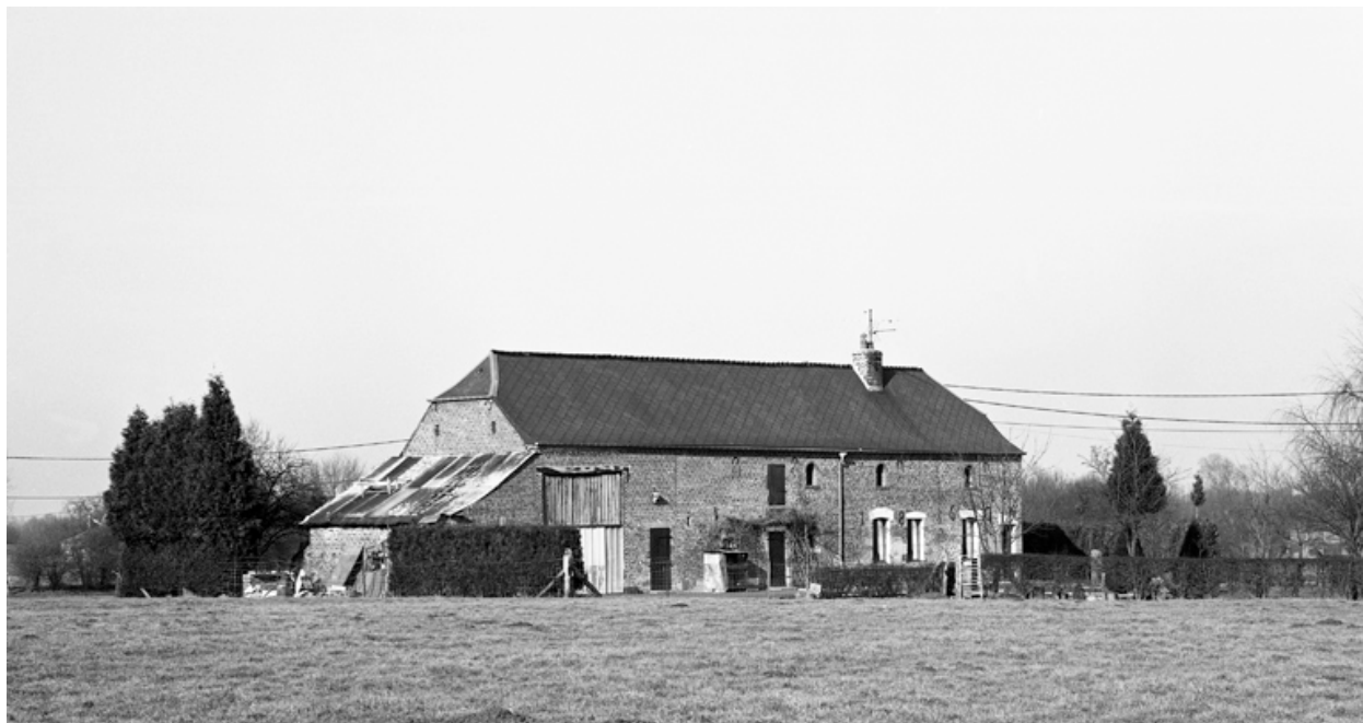
Le Nouvion-en-Thiérache. Ferme (étudiée), 38 chemin de Beaucamp à la Fontaine des Pauvres.