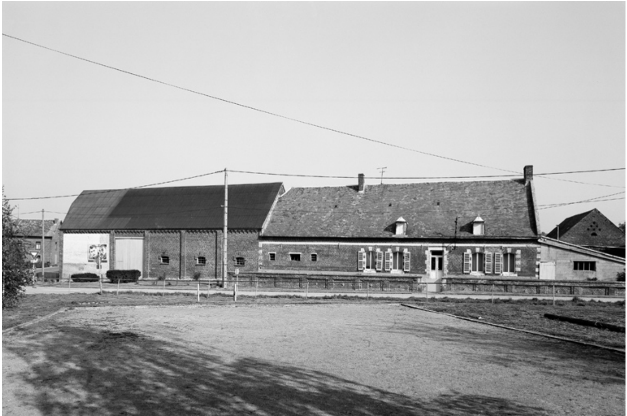
Bergues-sur-Sambre, ferme (étudiée), 9 place de l'Eglise.