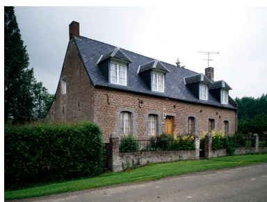
Barzy-en-Thiérache, ferme (étudiée), 15 Grande-Rue.