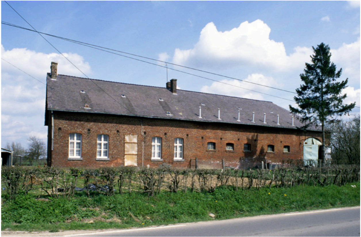
Le Nouvion-en-Thiérache. Fermes (étudiées), au Mont-Châtillon.