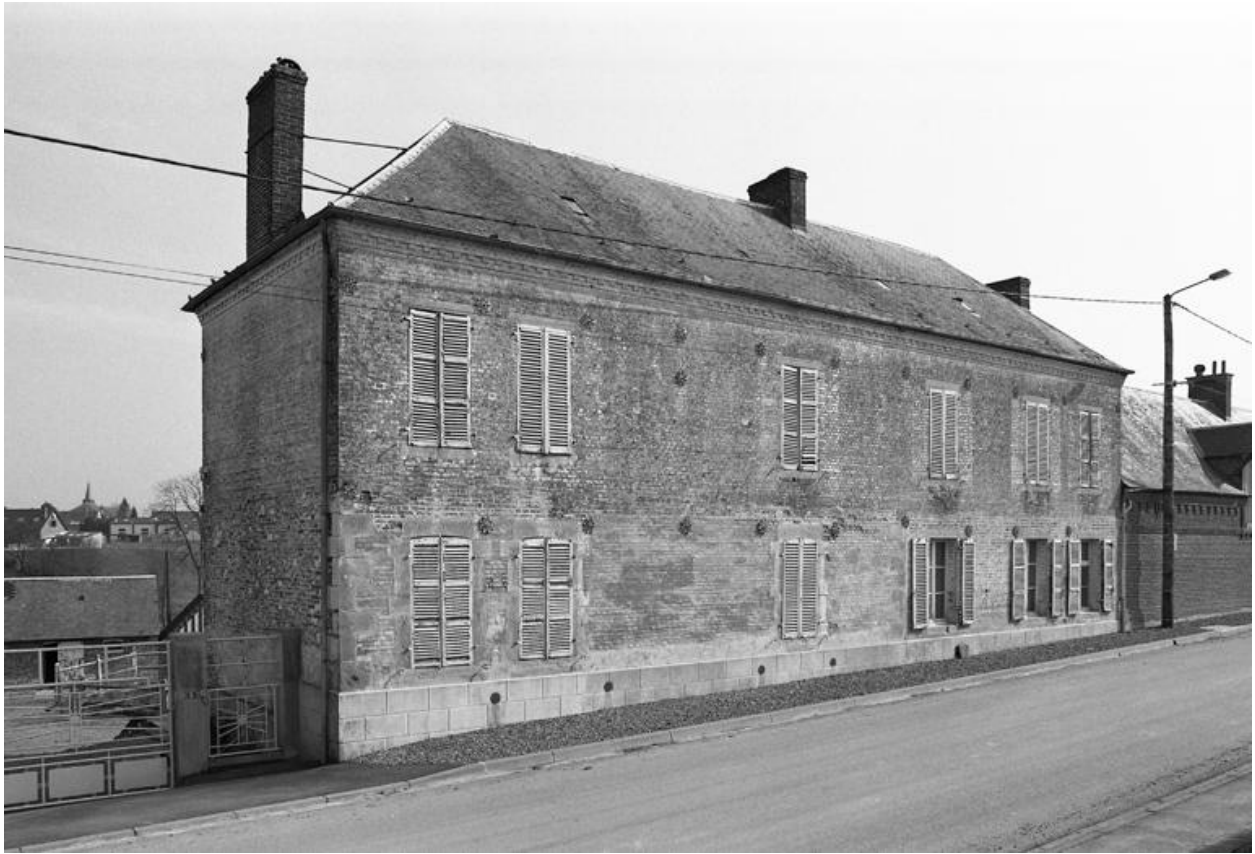
La Neuville-lès-Dorengt. Ferme (étudiée), 5 rue du Fort.