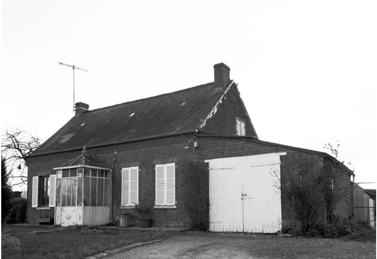
Esquéhéries, maison (étudiée), la Rue-des-Pires, 2 rue des Pires.