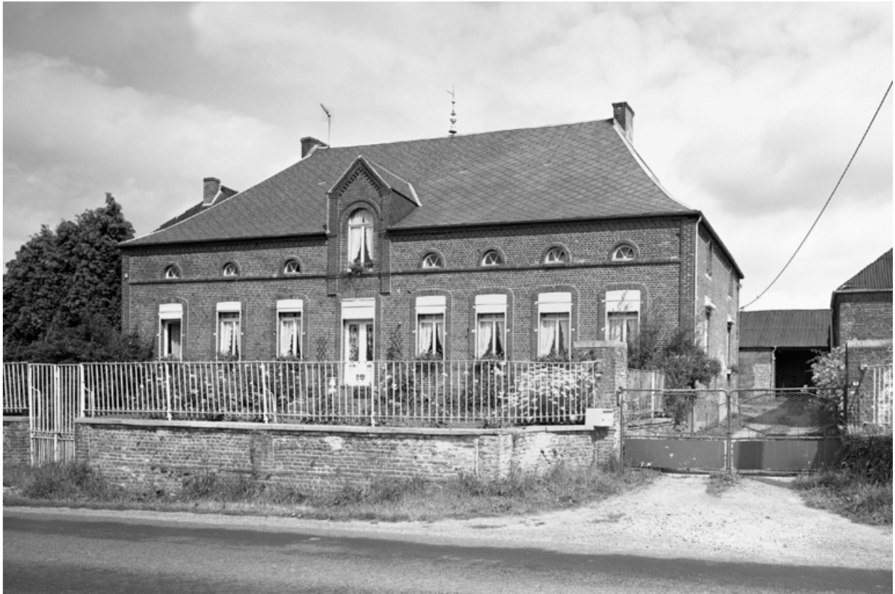
Boué, ferme (étudiée), la Folie, 1 route du Nouvion.