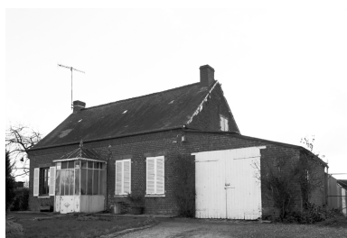
Esquéhéries, maison (étudiée), la Rue-des-Pires, 2 rue des Pires. IVR22_19960200884X