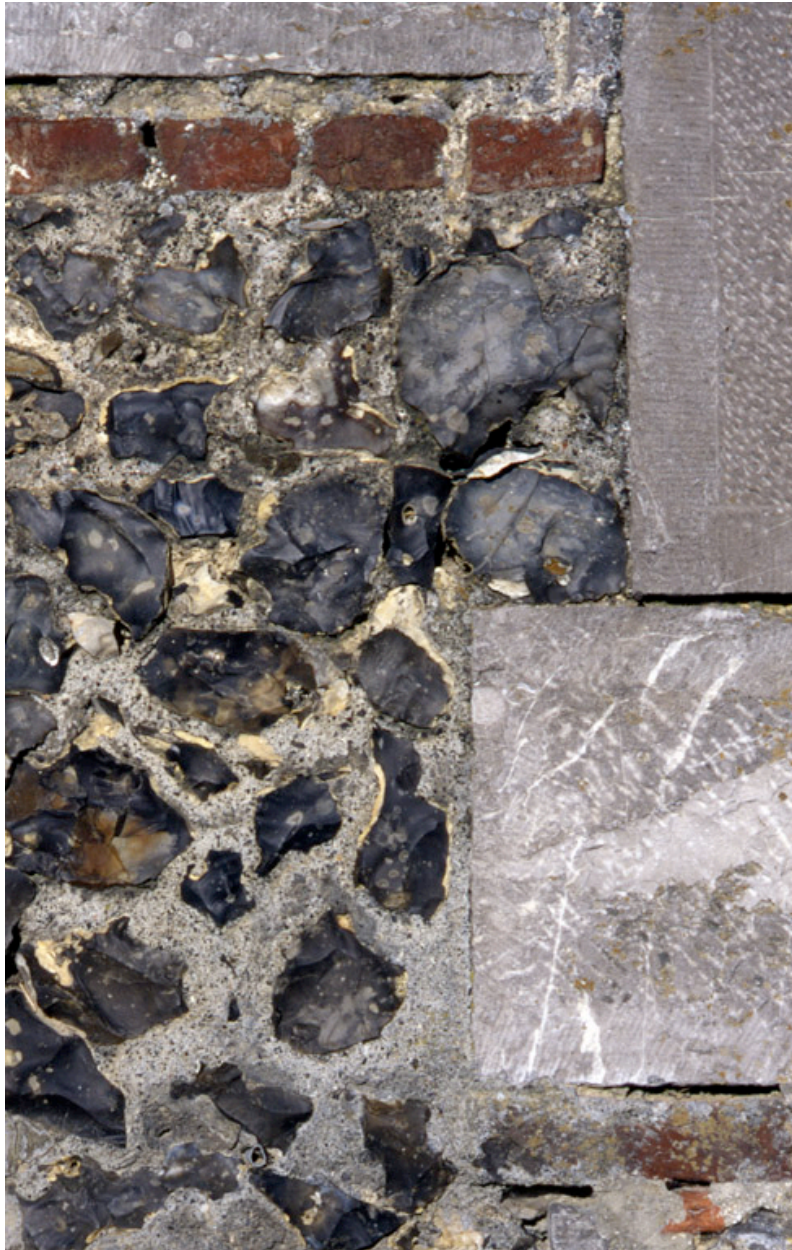
Dorengt, ferme (repérée), 14 ruelle Champagne : détail de la façade du logis montrant la mise en oeuvre des principaux matériaux.