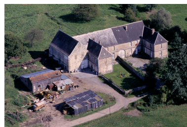
Fesmy-le-Sart, ancienne abbaye bénédictine Saint-Etienne puis ferme (étudiée), l'Abbaye, 23 rue de l'Abbaye. IVR22_20010200317XA