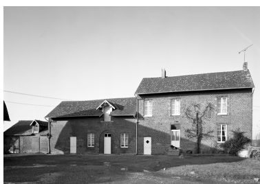
Le Nouvion-en-Thiérache. Ferme (étudiée), dite ferme des Potasse.