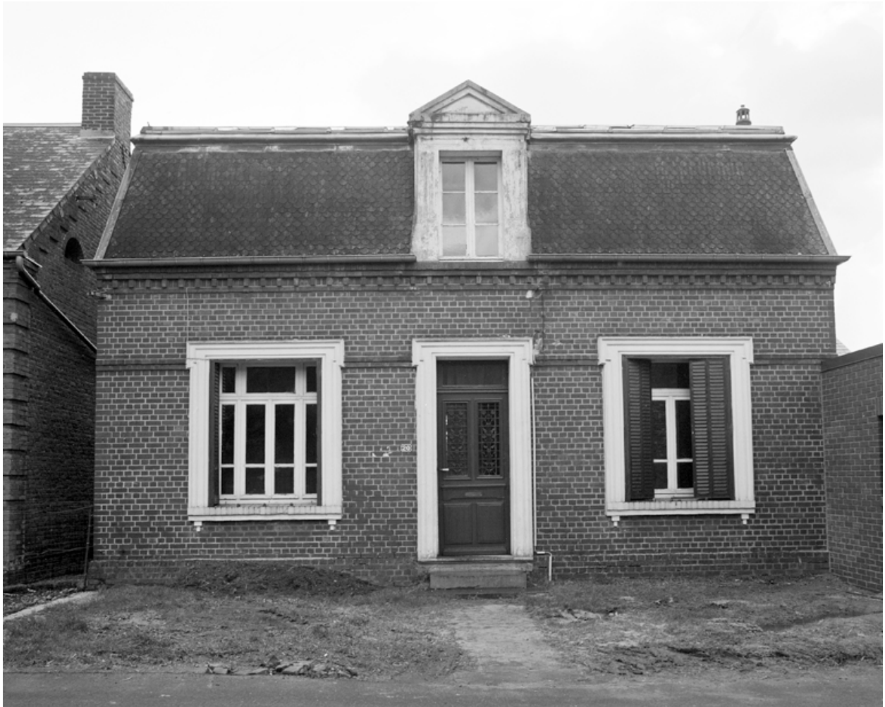
Esquéhéries, maison (étudiée), 20 rue de Verdun.