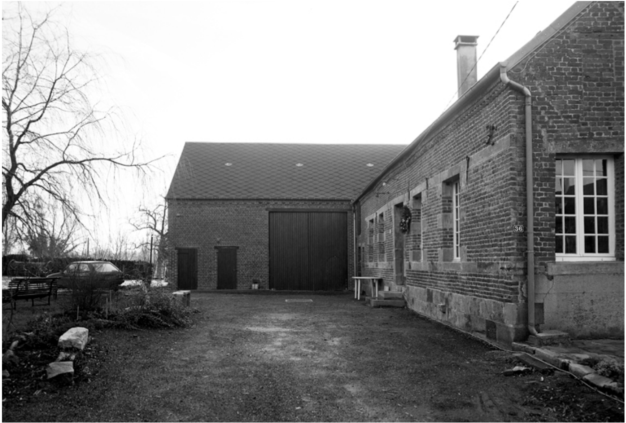
Fesmy-le-Sart, ancienne ferme (étudiée), le Sart, 36 Grande-Rue.