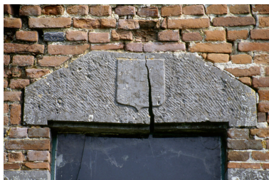
Barzy-en-Thiérache, ferme (repérée), 38 Grande-Rue : linteau de la porte du logis portant la date 1686.