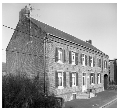
Esquéhéries, ancienne maison de notable (étudiée), 13 rue du 8-Mai.