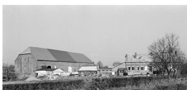
Esquéhéries, ferme (étudiée), le Burcq, 2-4 route de Lavaqueresse.