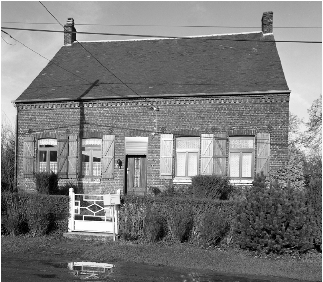
Fesmy-le-Sart, maison (étudiée), le Sart, 5 Grande-Rue.