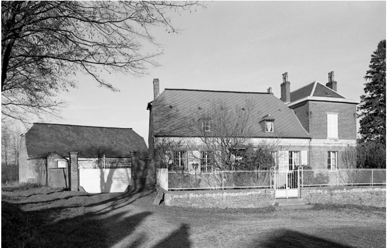
Dorengt, ferme (étudiée), 6 rue du Marais.