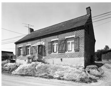
Fesmy-le-Sart, maison (étudiée), 7 rue de la Laiterie. IVR22_19930200456V