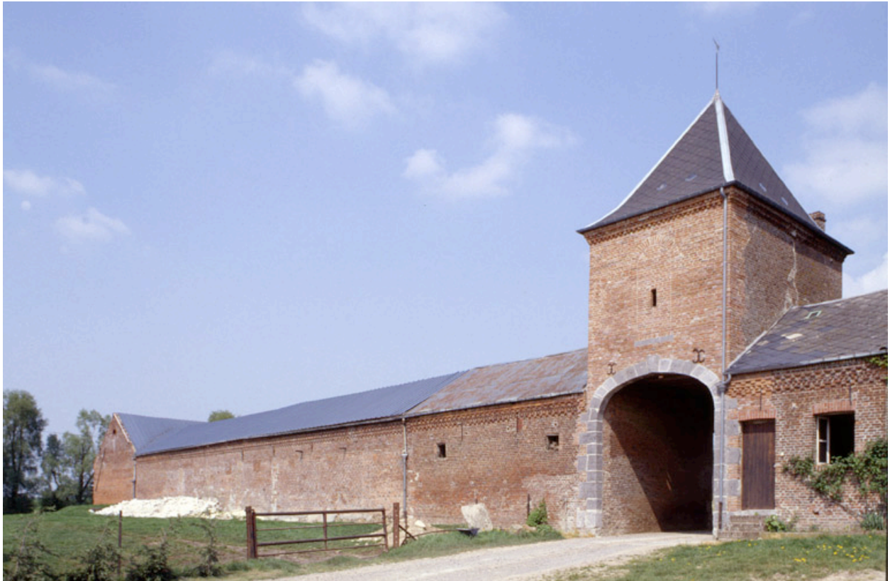
Dorengt, ferme de Ribeaufontaine (étudiée), chemin rural de Dorengt au Chenot.