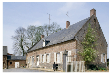
Dorengt, ferme (repérée), 14 ruelle Champagne : logis daté de 1837 et parties agricoles.