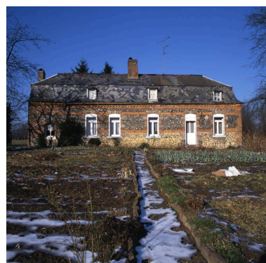
Leschelle. Ferme (étudiée), 8 ruelle du Moulin de Leval.