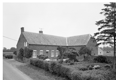
Barzy-en-Thiérache, ferme (étudiée), La Justice, 4 CD 26.