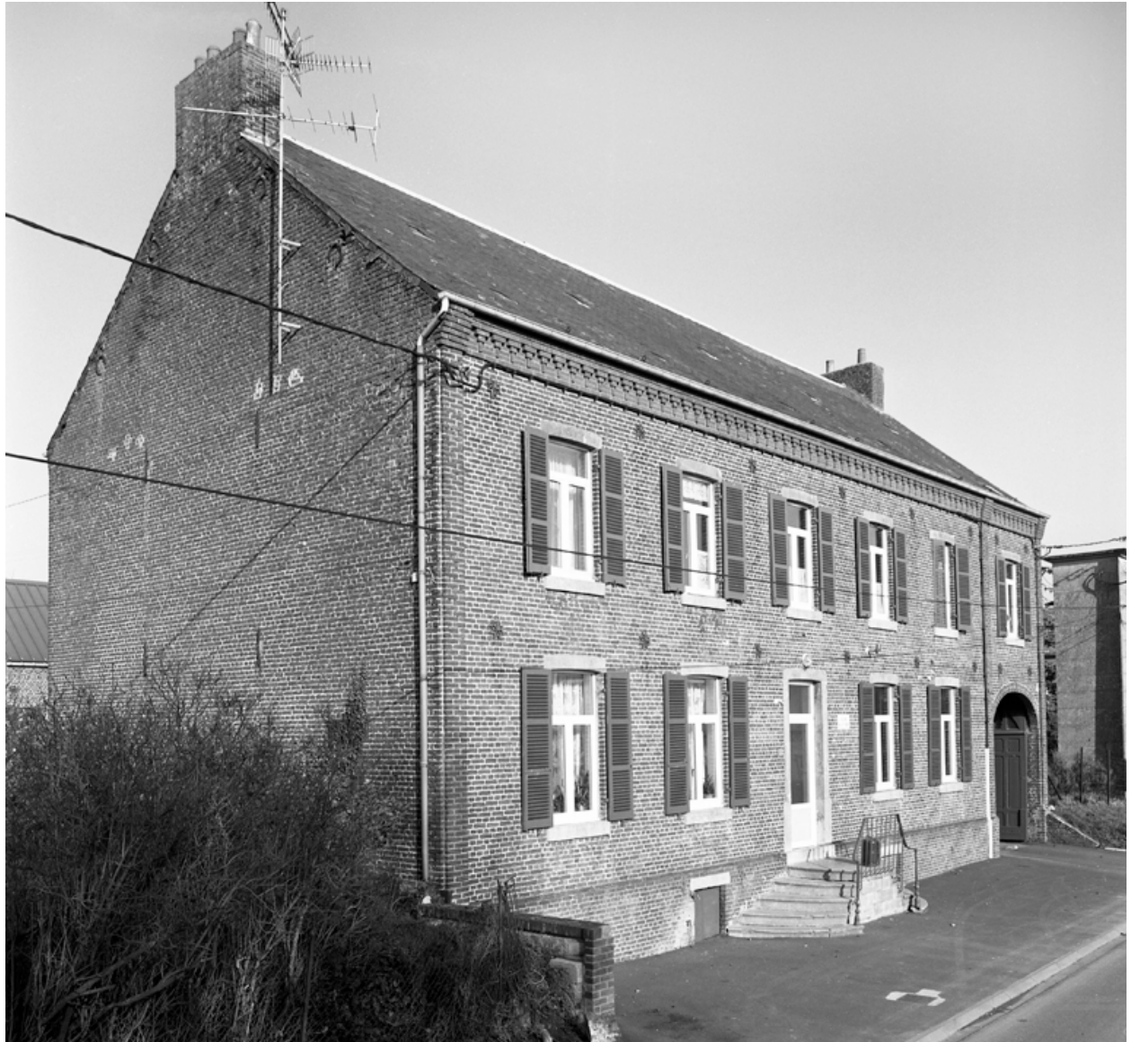
Esquéhéries, ancienne maison de notable (étudiée), 13 rue du 8-Mai.