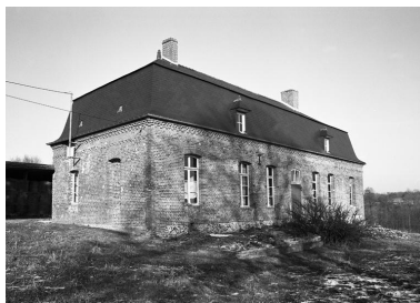
Leschelle. Ferme (étudiée), ruelle du Moulin de Leval. IVR22_19960200978X