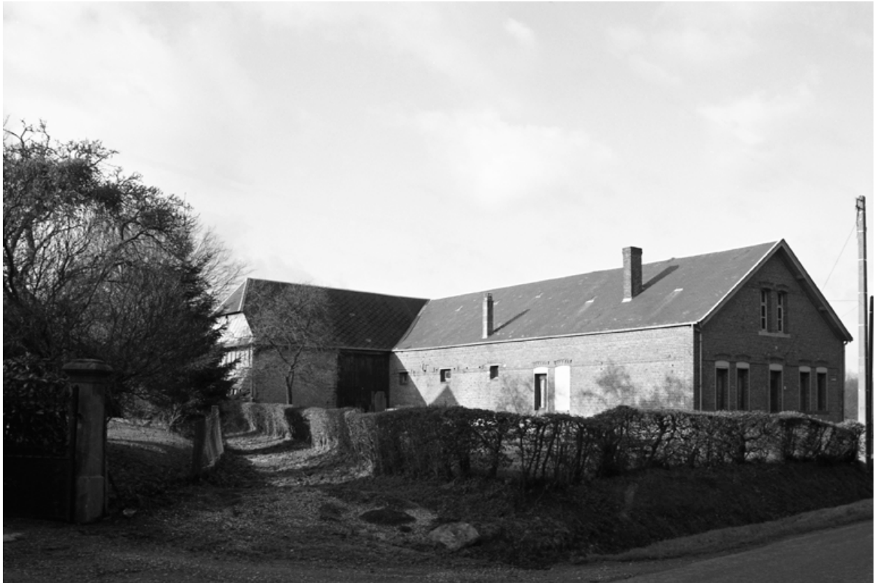
Esquéhéries, ancienne ferme (étudiée), le Sarrois, 47 route du Grand-Wez.