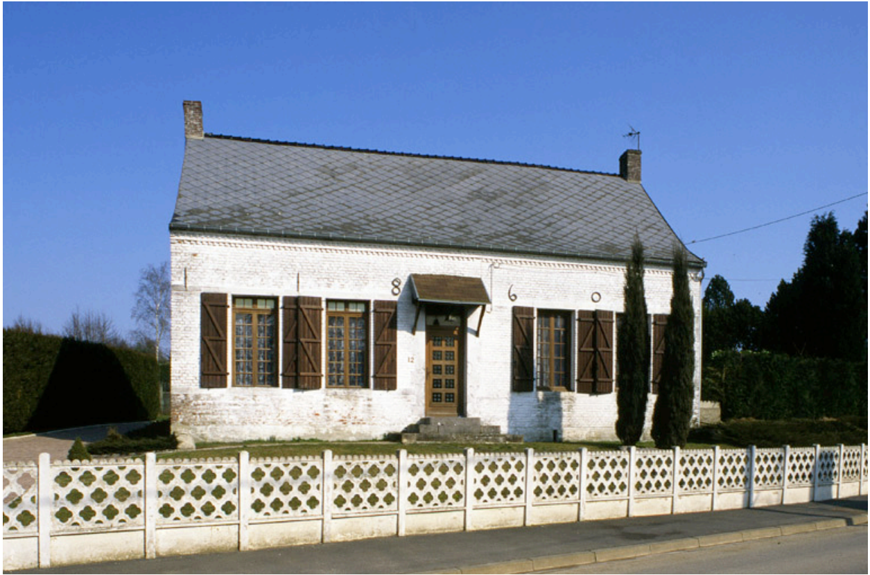
La Neuville-lès-Dorengt. Maison (étudiée) 12 rue de Verdun.