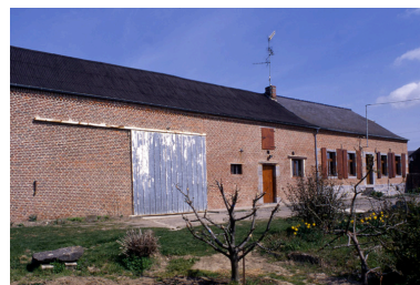
Fesmy-le-Sart, ancienne ferme (étudiée), la Carrière-Etreux, 13 rue Carrière-Etreux.