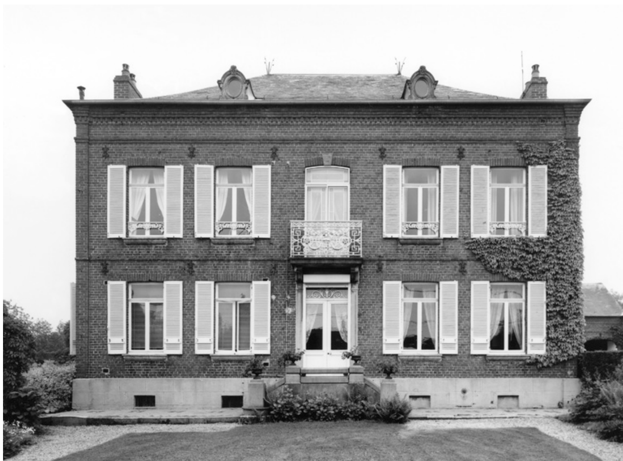
Barzy-en-Thiérache, ferme (étudiée), 13 Grande-Rue.