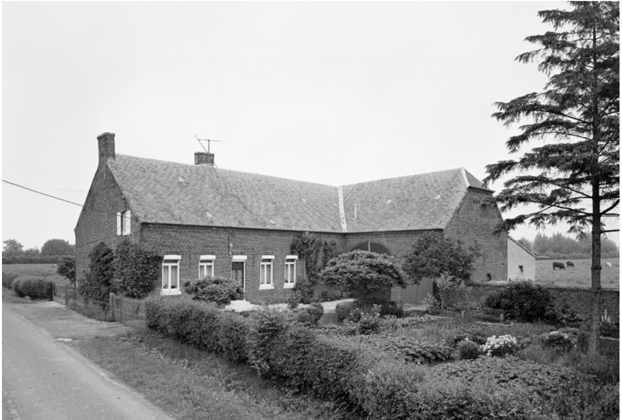
Barzy-en-Thiérache, ferme (étudiée), La Justice, 4 CD 26.