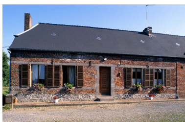
Barzy-en-Thiérache, ferme (repérée), 15 rue Neuve : logis.