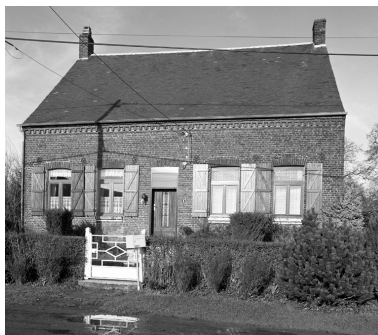
Fesmy-le-Sart, maison (étudiée), le Sart, 5 Grande-Rue.