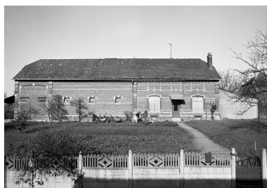
Esquéhéries, ferme (étudiée), 13 rue de Verdun. IVR22_19960200860X