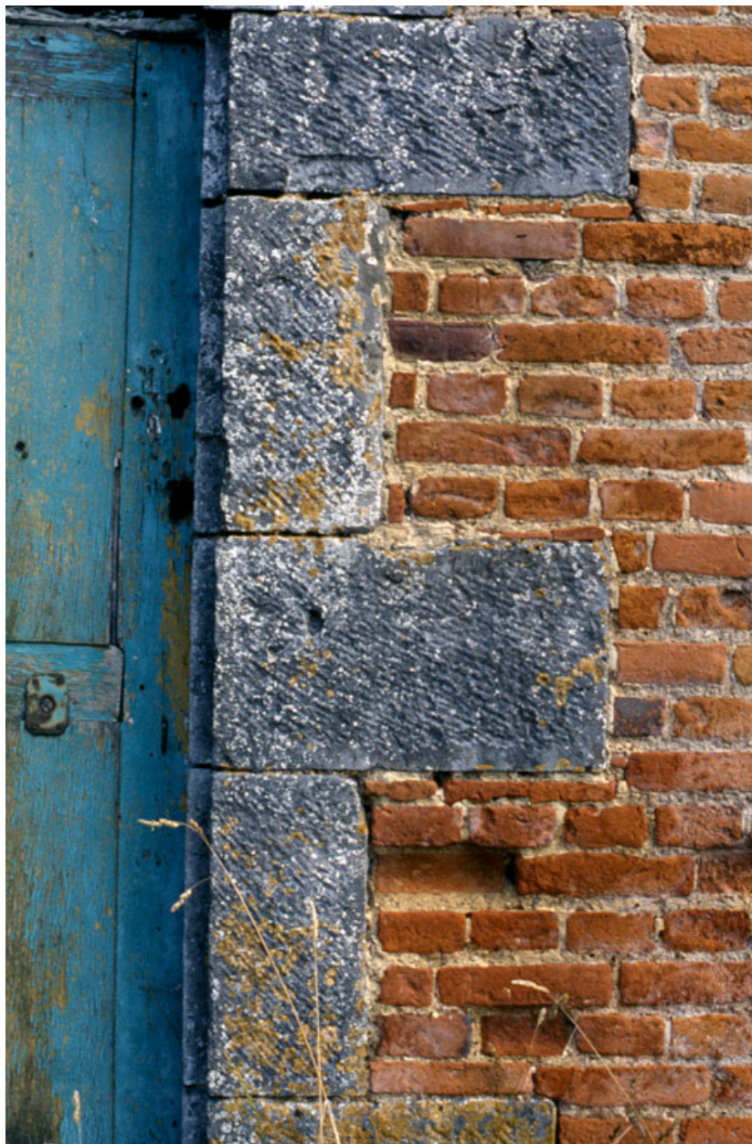
Barzy-en-Thiérache, ferme (repérée), 38 Grande-Rue : détail des matériaux de gros-oeuvre du logis, près de la porte datée 1686.