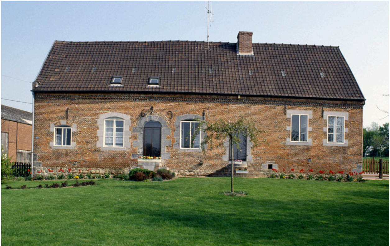
Barzy-en-Thiérache, maison (repérée), 57 Grande-Rue.