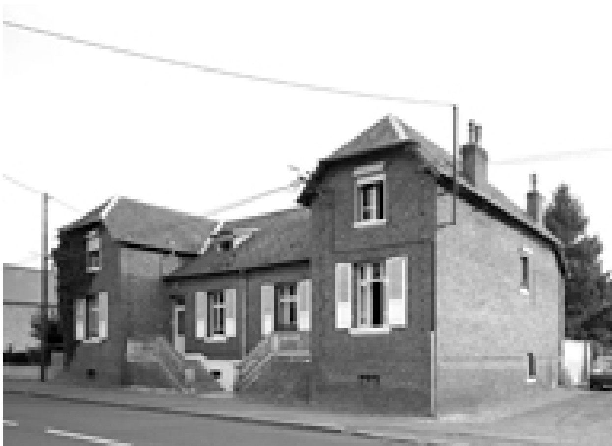
Boué, maison jumelée (étudiée), 26 rue du Nouvion.