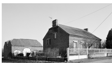
Bergues-sur-Sambre, ferme (étudiée), 2 rue Jumeau.