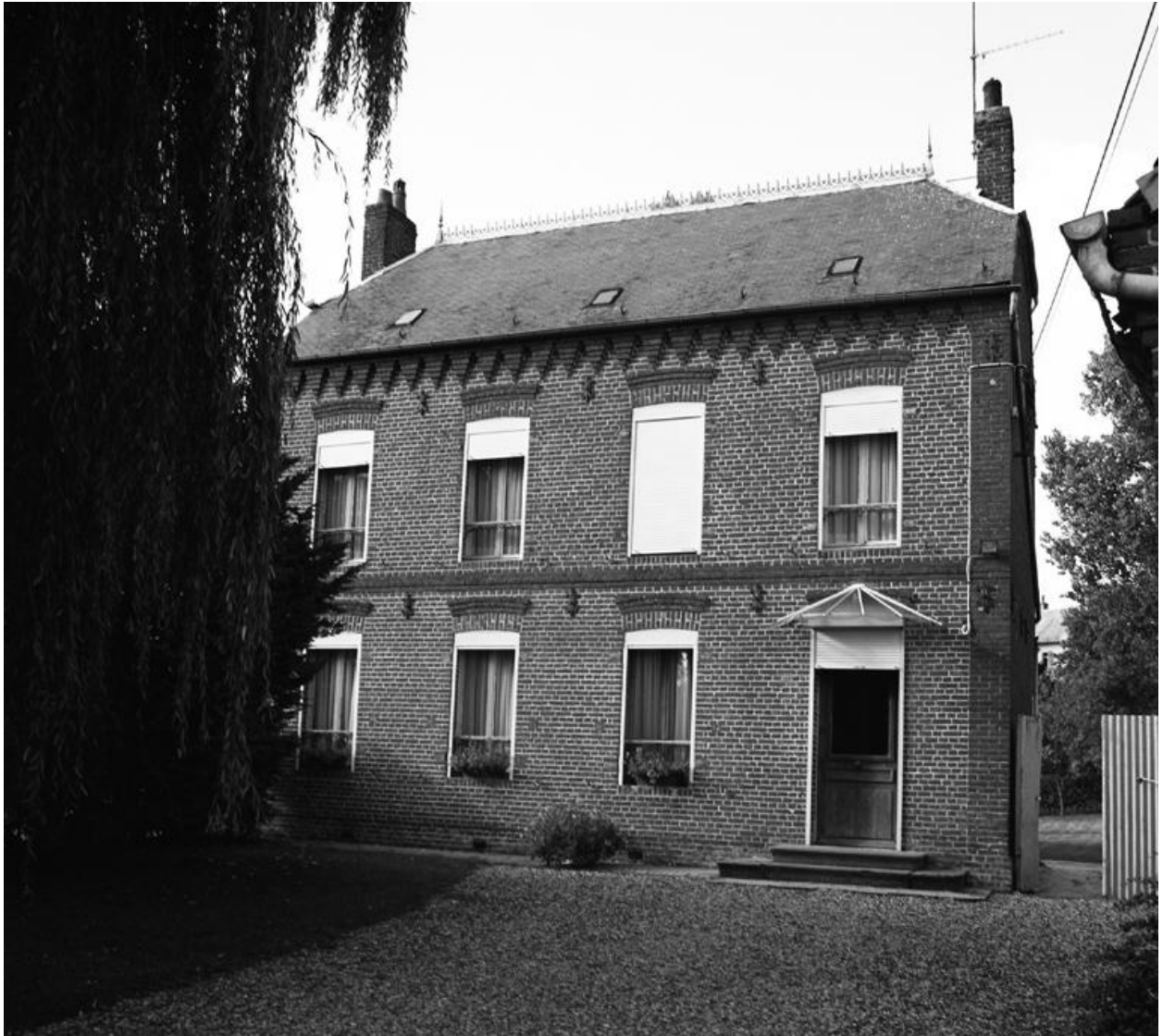
La Neuville-lès-Dorengt. Maison (étudiée), 2 rue de la Fontaine à Pommiers.