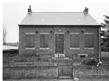
Barzy-en-Thiérache, maison (étudiée), 14 Grande-Rue. IVR22_19930200605V