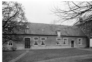
Fesmy-le-Sart, ancienne ferme puis brasserie (étudiée), le Sart, 23 Grande-Rue. IVR22_19960200358Z