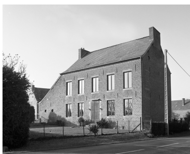
Esquéhéries, ancienne ferme (étudiée), le Sarrois, 45 route du Grand-Wez.