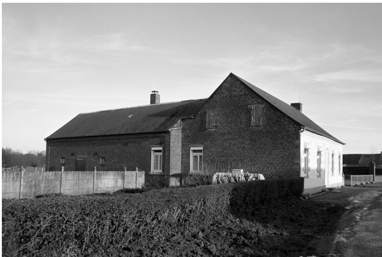
Fesmy-le-Sart, ancienne ferme (étudiée), 16 rue de l'Abbaye.