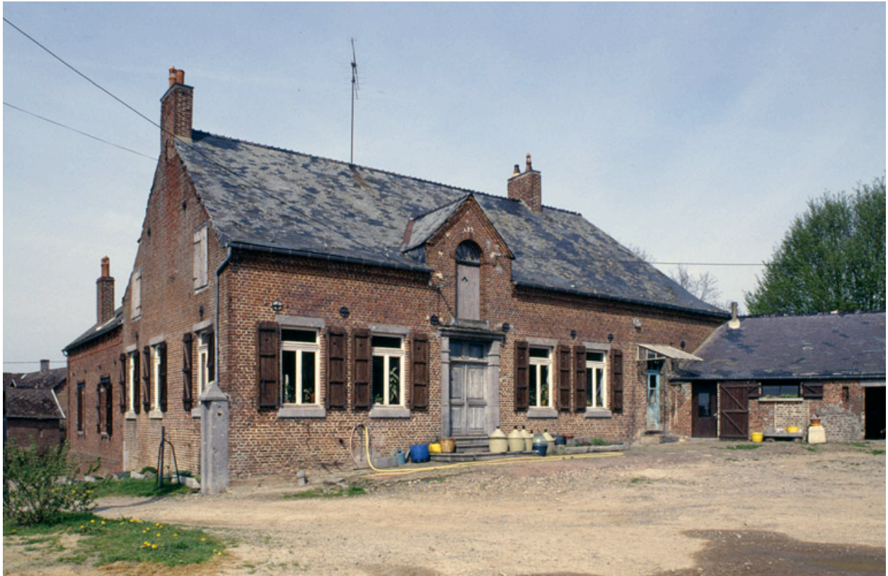
Dorengt, ferme (repérée), 13 ruelle Champagne : logis.