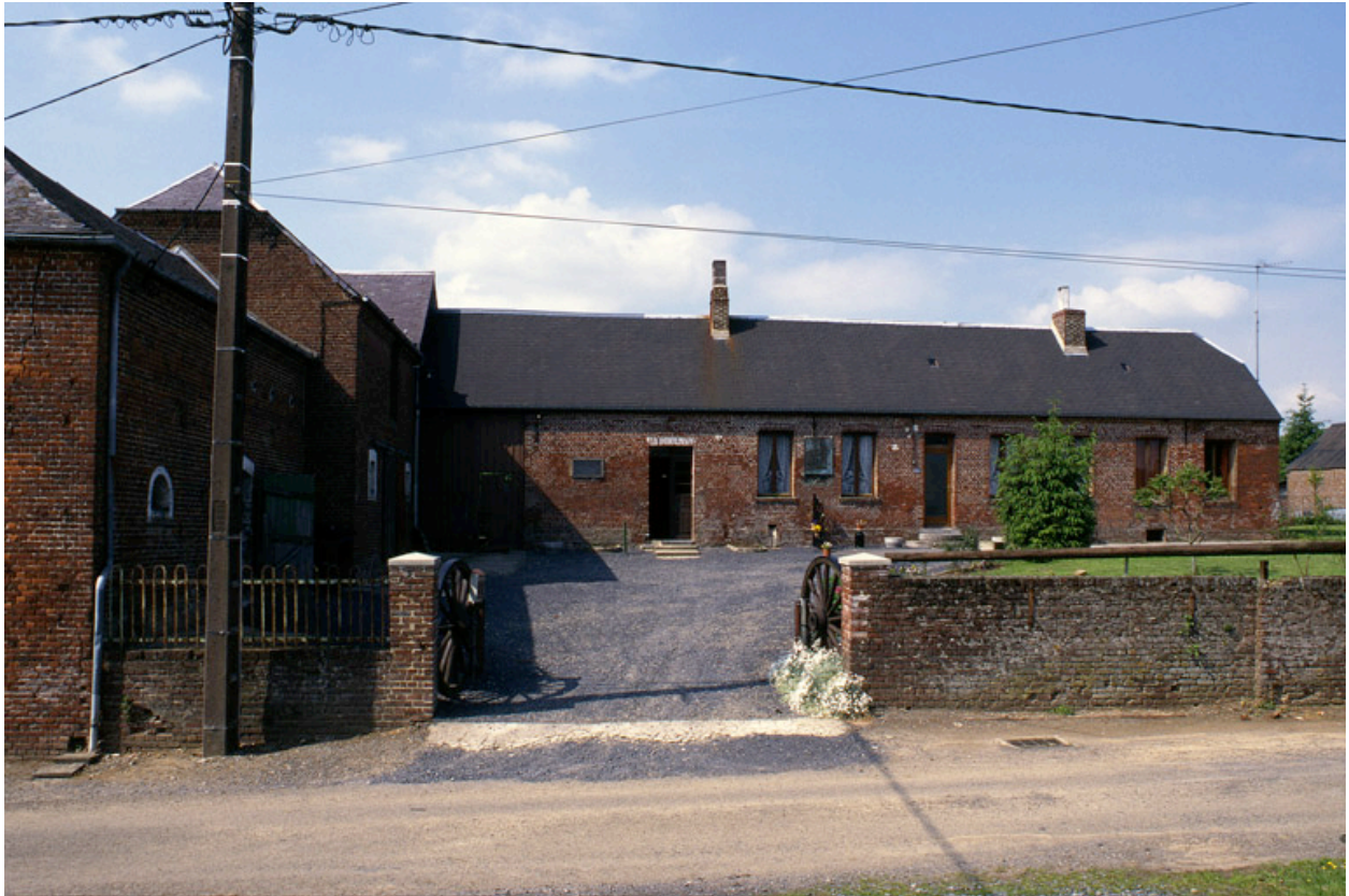
Esquéhéries, ferme (étudiée), 23 rue Neuve.