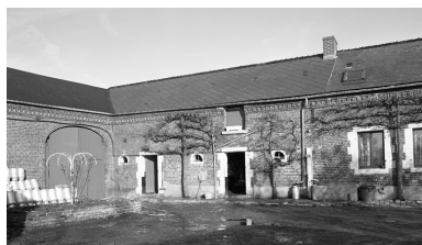
Fesmy-le-Sart, ferme (étudiée), le Bas-de-Saint-Pierre, 11 rue de Saint-Pierre.