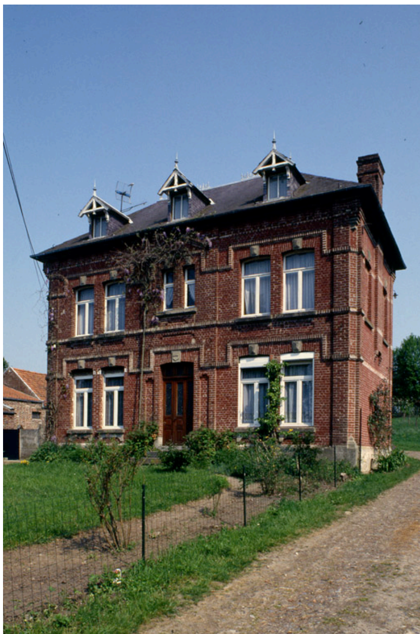
Barzy-en-Thiérache, ferme (repérée), 4 rue du Sart : logis construit en 1894.