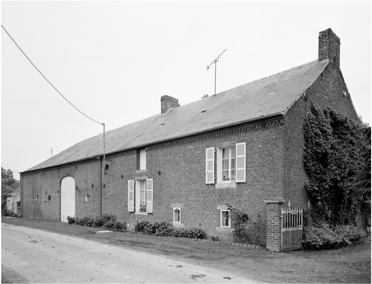
Barzy-en-Thiérache, ferme (étudiée), 6 rue du Sart.