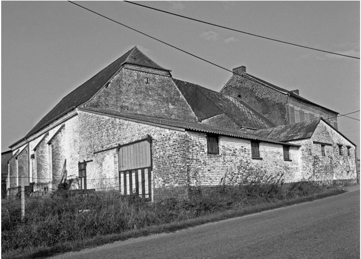
La Neuville-lès-Dorengt. Ferme au Bosquet-Carré (étudiée), 3 route d' Esquéhéries.