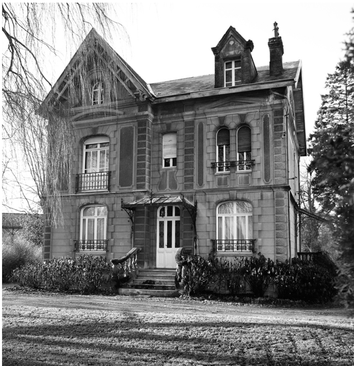
Boué, maison de médecin (étudiée), 1 rue d'Oisy.