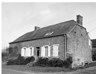
Esquéhéries, ferme (étudiée), le Grand-Wez, 16 route du Grand-Wez.