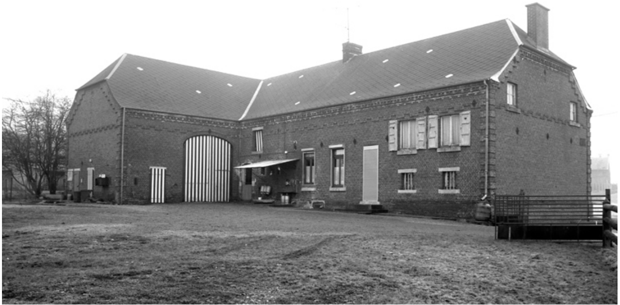
Le Nouvion-en-Thiérache. Ferme (étudiée), 45 chemin de Beaucamp à la Fontaine des Pauvres.