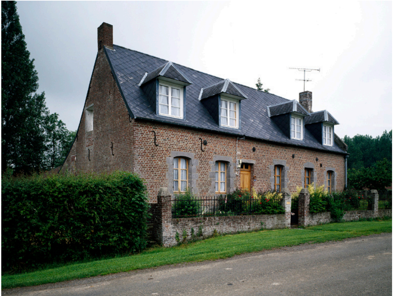
Barzy-en-Thiérache, ferme (étudiée), 15 Grande-Rue.