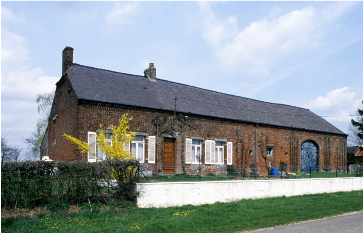
Le Nouvion-en-Thiérache. Ferme (étudiée) au Moulin à Vent.