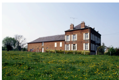
Barzy-en-Thiérache, ferme (étudiée), 6 Grande-Rue. IVR22_19930201063ZA