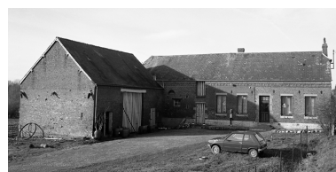
Fesmy-le-Sart, ancienne ferme (étudiée), la Fontaine-au-Pain, 9 RN 43. IVR22_19960200938X