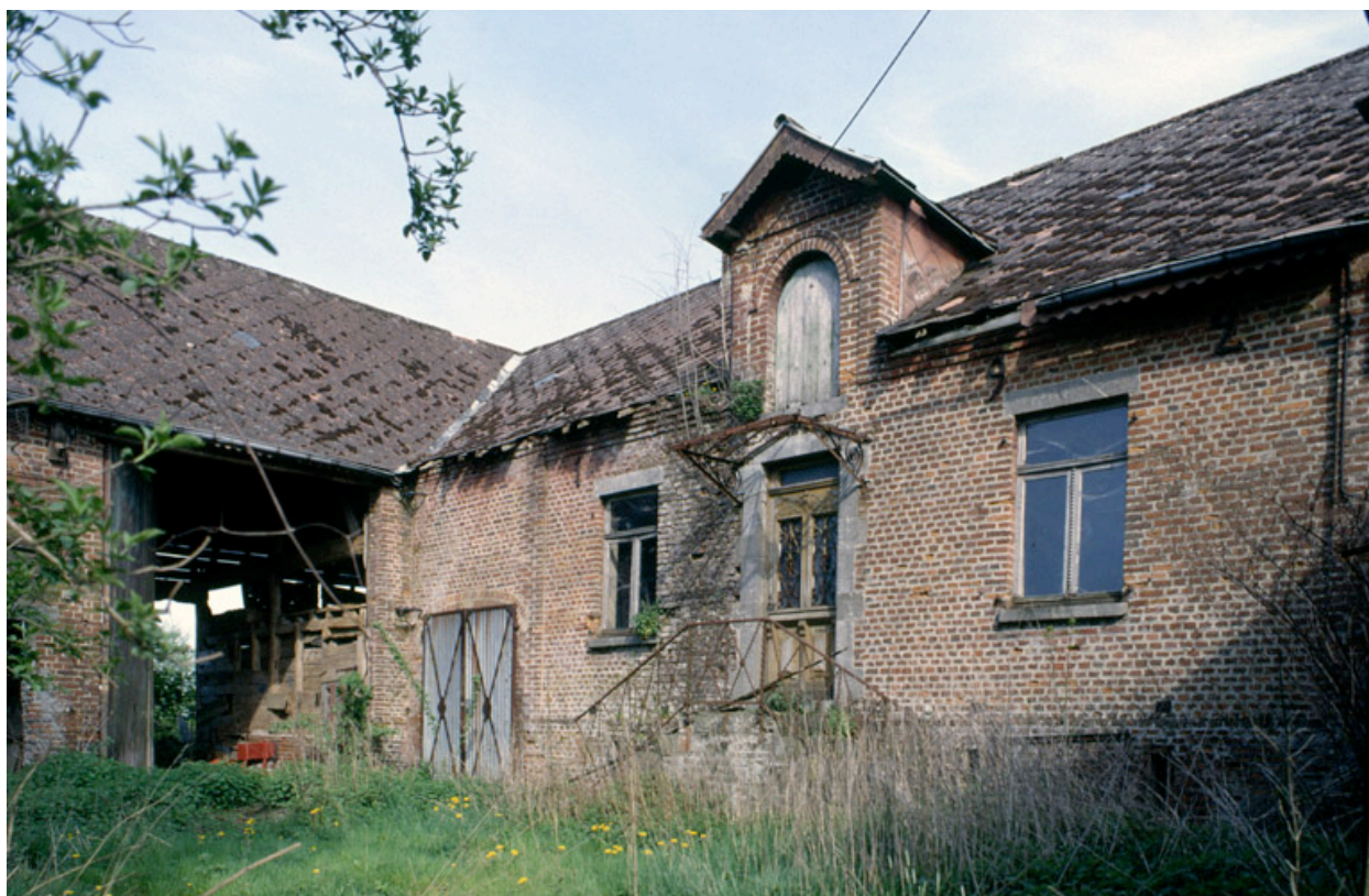
Dorengt, ferme (repérée), Le Petit-Dorengt, 2 rue du Moulin-Lavaqueresse : logis daté de 1892.