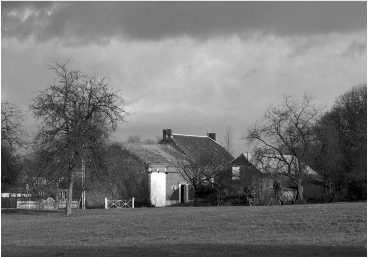
Esquéhéries, ferme, 6 rue du 8-Mai.