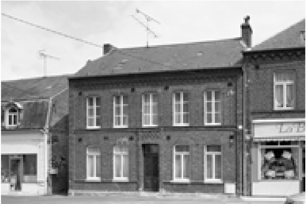
Boué, maison (étudiée), 4 rue des Vannois.