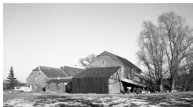
Fesmy-le-Sart, ferme (étudiée), Saint-Pierre, 14 rue de Saint-Pierre. IVR22_19960200963X