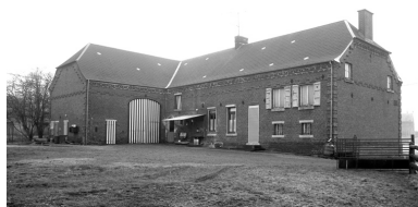
Le Nouvion-en-Thiérache. Ferme (étudiée), 45 chemin de Beaucamp à la Fontaine des Pauvres. IVR22_19960201024X