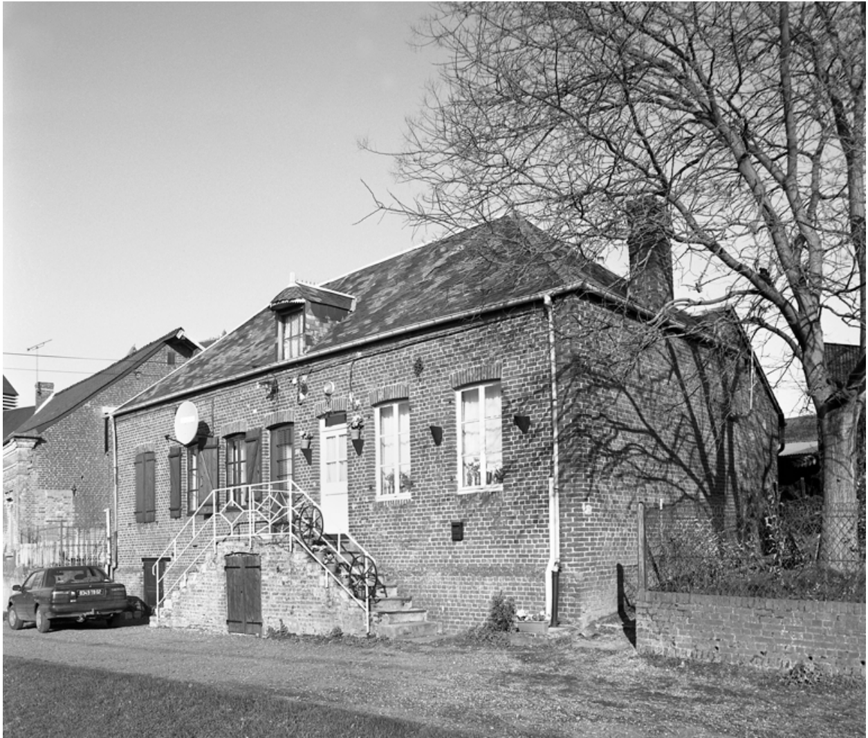
Esquéhéries, maison (étudiée), 18-20 rue du Général-de-Gaulle.