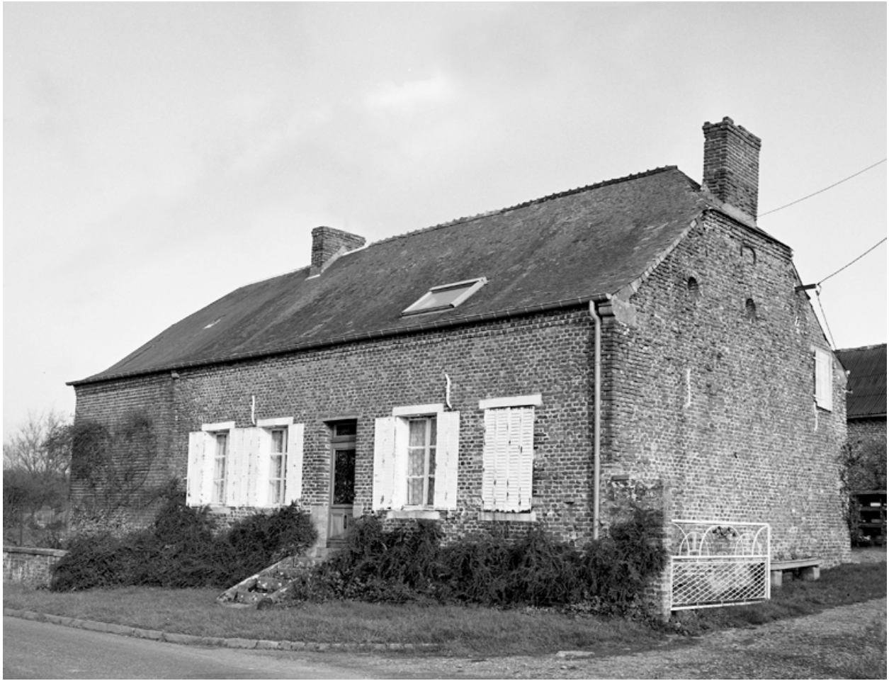
Esquéhéries, ferme (étudiée), le Grand-Wez, 16 route du Grand-Wez.