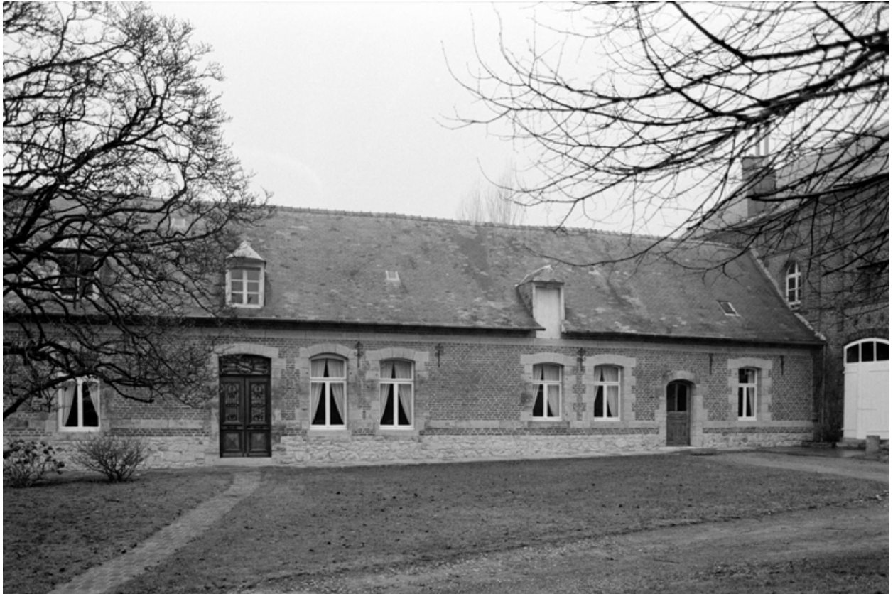
Fesmy-le-Sart, ancienne ferme puis brasserie (étudiée), le Sart, 23 Grande-Rue.