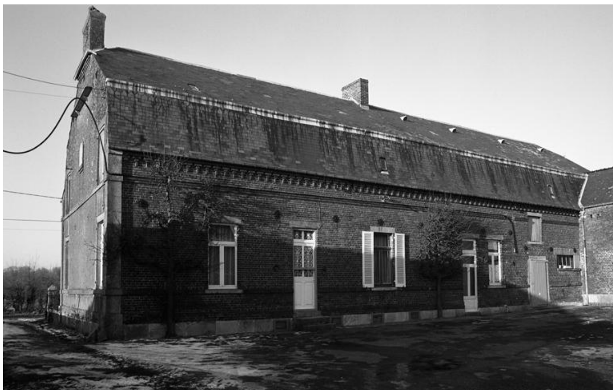
Leschelle. Ferme (étudiée), à Hennepieux.