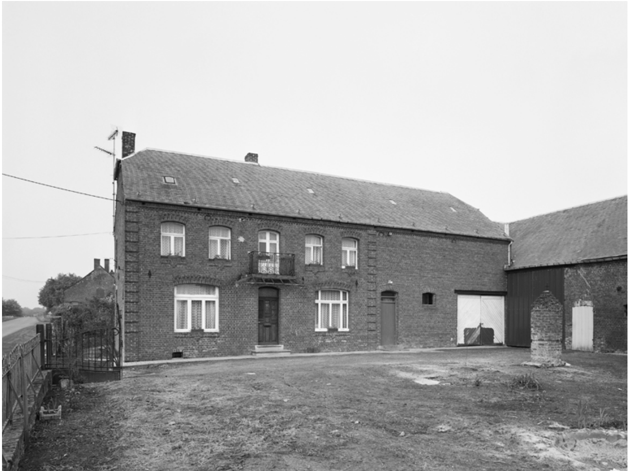
Fesmy-le-Sart, ancienne ferme (étudiée), la Culbute.