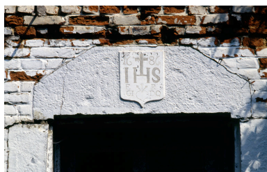
Barzy-en-Thiérache, ferme (repérée), 4 bis rue du Sart : linteau de la porte du logis portant la date 1686. IVR22_19930201069ZA