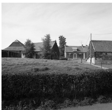
La Neuville-lès-Dorengt. Ferme (étudiée), 6 rue d'Etreux. IVR22_19960200645X