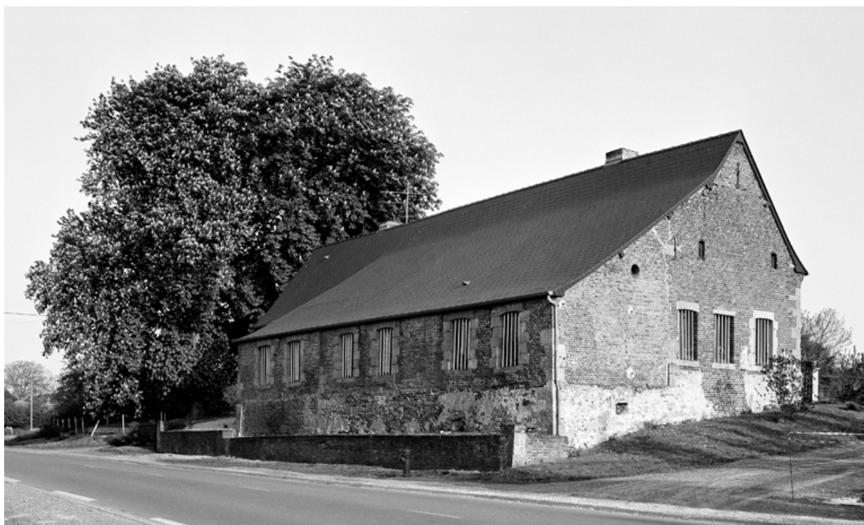
Bergues-sur-Sambre, ferme (étudiée), 27 rue du Général-de-Gaulle.