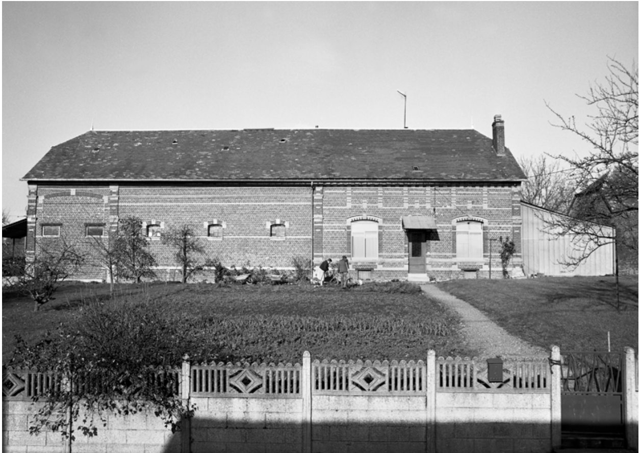
Esquéhéries, ferme (étudiée), 13 rue de Verdun.