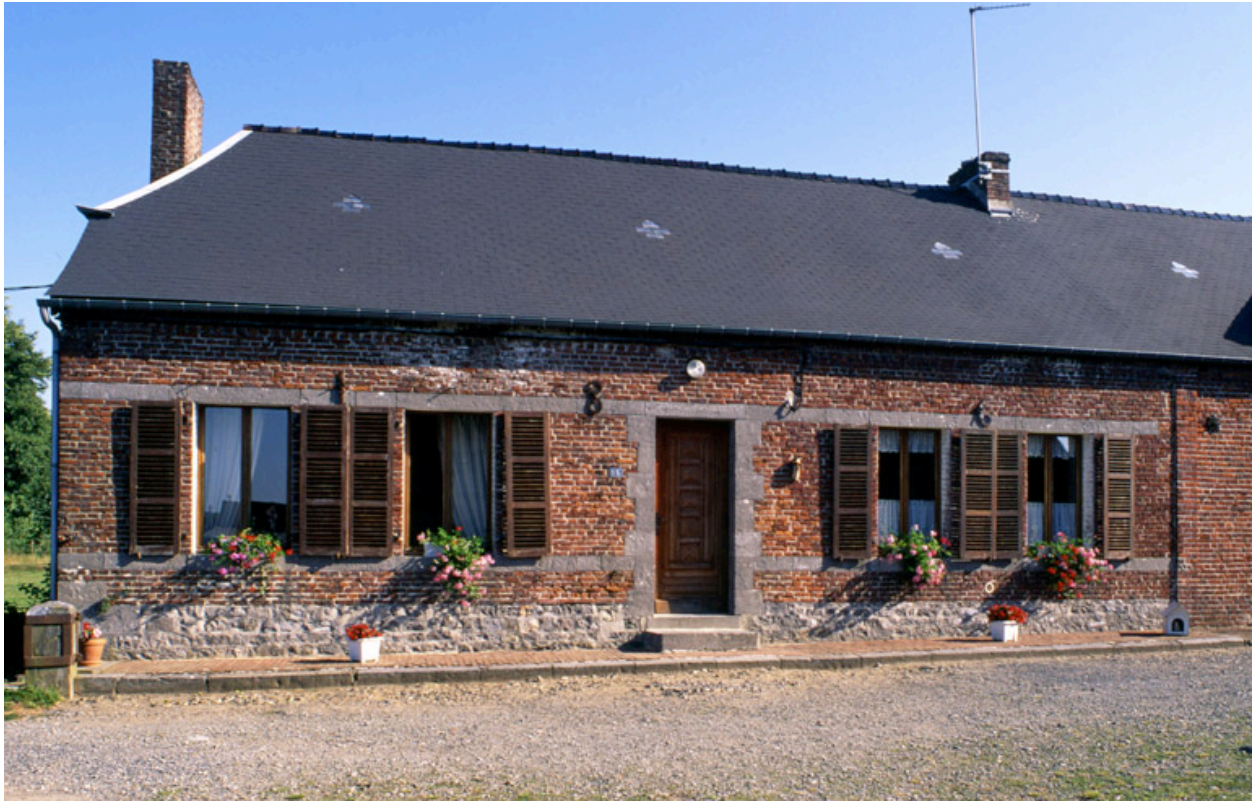
Barzy-en-Thiérache, ferme (repérée), 15 rue Neuve : logis.