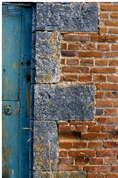
Barzy-en-Thiérache, ferme (repérée), 38 Grande-Rue : détail des matériaux de gros-oeuvre du logis, près de la porte datée 1686. IVR22_19950203088ZA