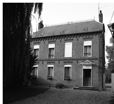
La Neuville-lès-Dorengt. Maison (étudiée), 2 rue de la Fontaine à Pommiers.