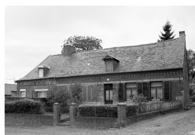
Boué, maison (étudiée), 13 rue des Marchands.