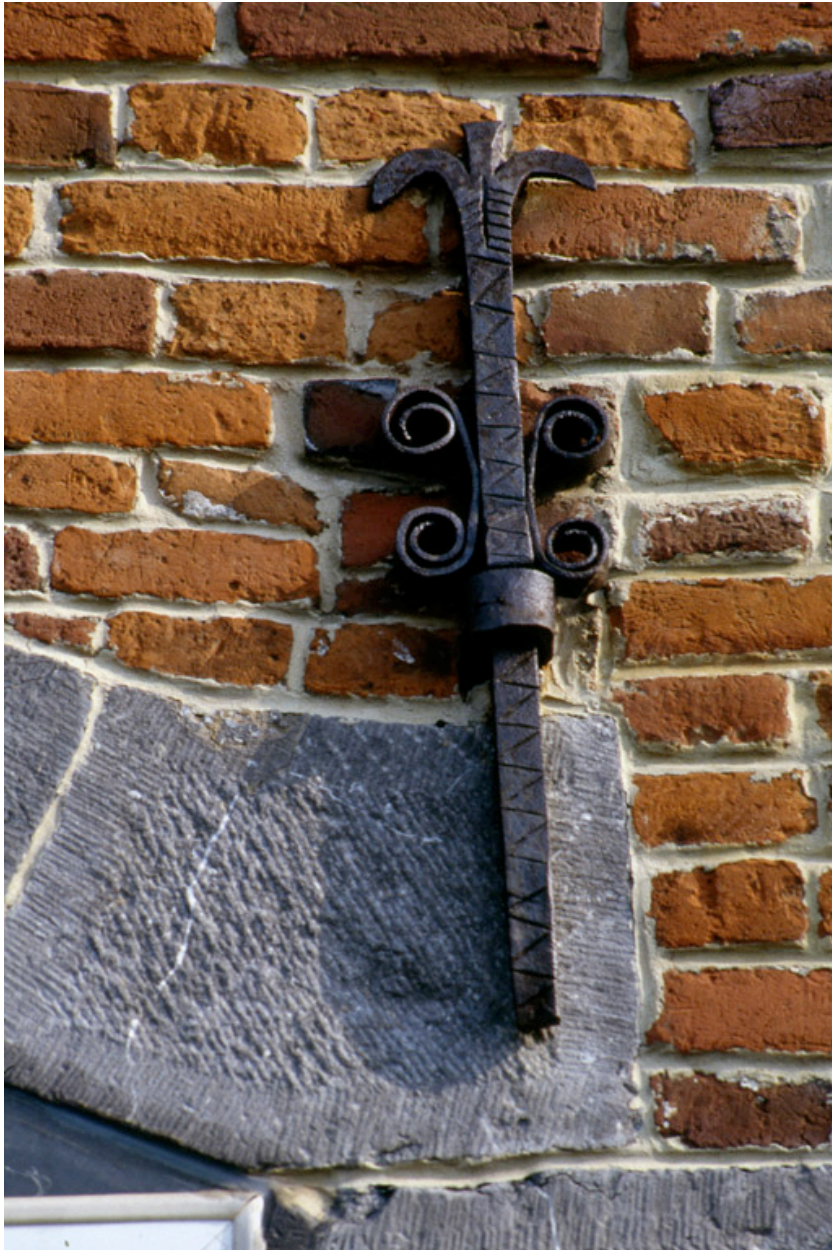
Barzy-en-Thiérache, maison (repérée), 57 Grande-Rue : fer d'ancrage de la façade (chiffre 1).