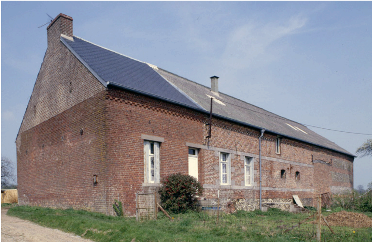
Fesmy-le-Sart, ferme (repérée), la Carrière-Etreux, 15 rue Carrière-Etreux : logis avec étable attenante.