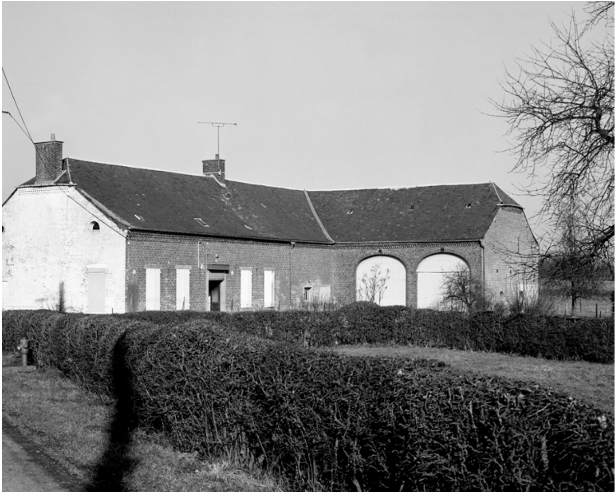
Le Nouvion-en-Thiérache. Ferme (étudiée), 49 chemin de Beaucamp à la Fontaine des Pauvres.