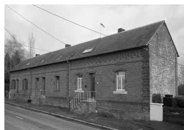
Esquéhéries, maison d'ouvriers (étudiée), la Petite-Rue, 14 à 18 rue dite de la Petite-Rue. IVR22_19960200872X