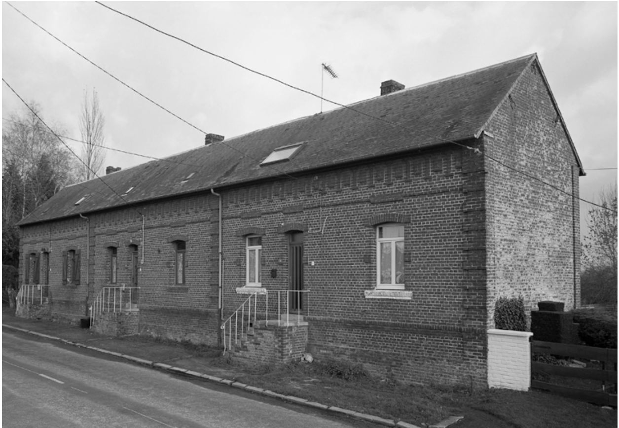
Esquéhéries, maison d'ouvriers (étudiée), la Petite-Rue, 14 à 18 rue dite de la Petite-Rue.