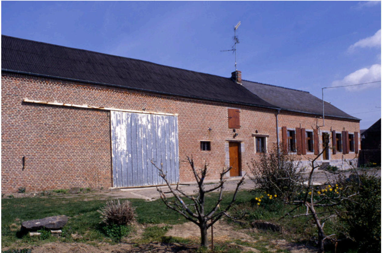
Fesmy-le-Sart, ancienne ferme (étudiée), la Carrière-Etreux, 13 rue Carrière-Etreux.