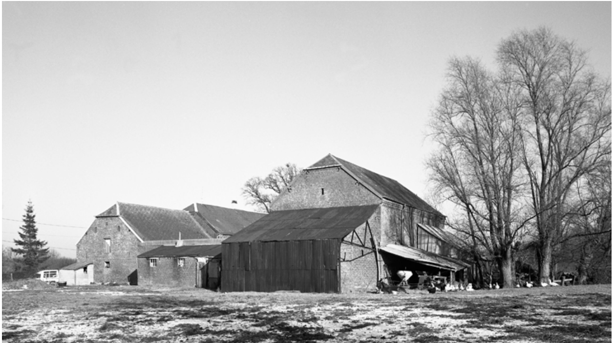
Fesmy-le-Sart, ferme (étudiée), Saint-Pierre, 14 rue de Saint-Pierre.