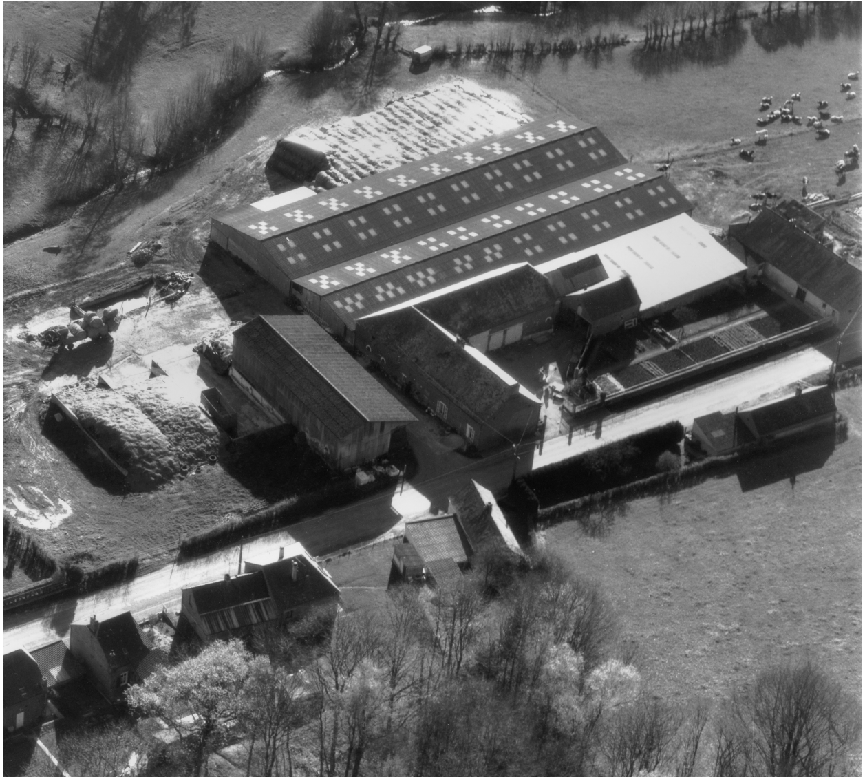
Esquéhéries, ferme (étudiée), la Petite Rue, 28 rue dite de la Petite-Rue.