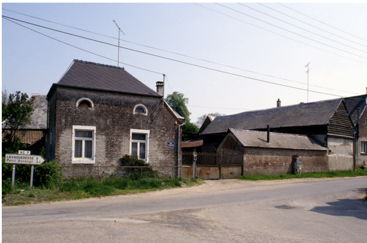
Dorengt, ferme (étudiée), 1 rue à Cailloux.