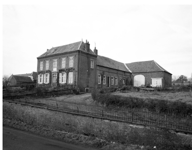
Le Nouvion-en-Thiérache. Ferme (étudiée), 4 rue de Boué. IVR22_19960201017X