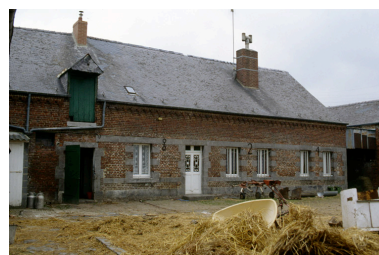
Fesmy-le-Sart, ferme (repérée), le Sart, Chemin de la Vallée-Briole : façade de la ferme datée 1824. IVR22_19930201323ZA