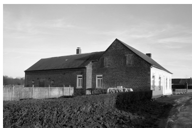
Fesmy-le-Sart, ancienne ferme (étudiée), 16 rue de l'Abbaye. IVR22_19960200926X