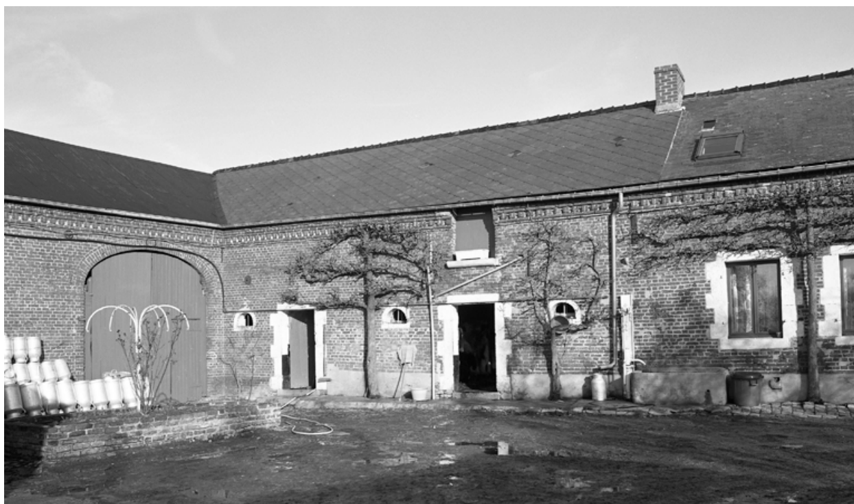
Fesmy-le-Sart, ferme (étudiée), le Bas-de-Saint-Pierre, 11 rue de Saint-Pierre.