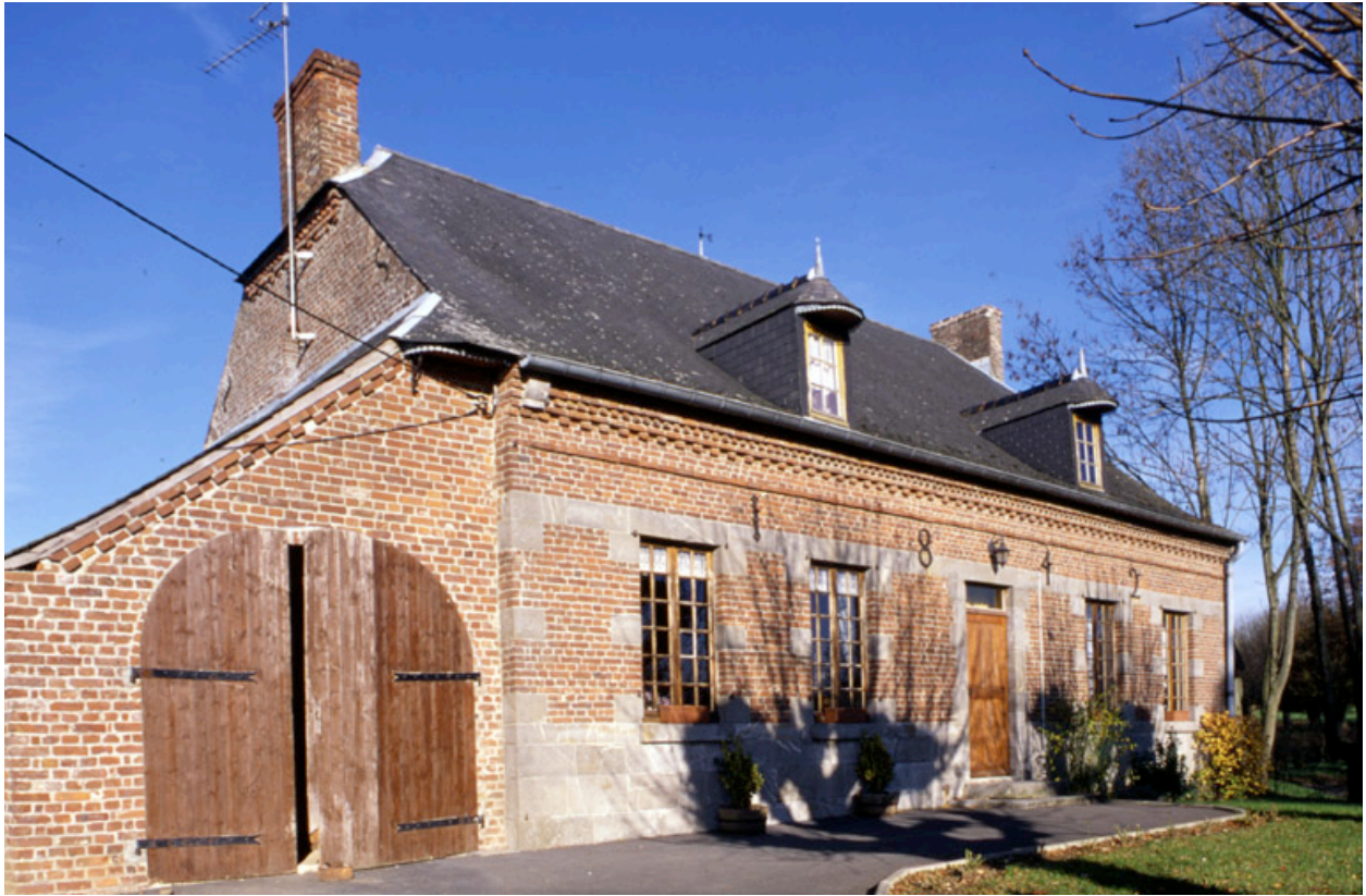
Dorengt, ferme (étudiée), Le Petit Dorengt, 4 rue du Moulin-Lavaqueresse.