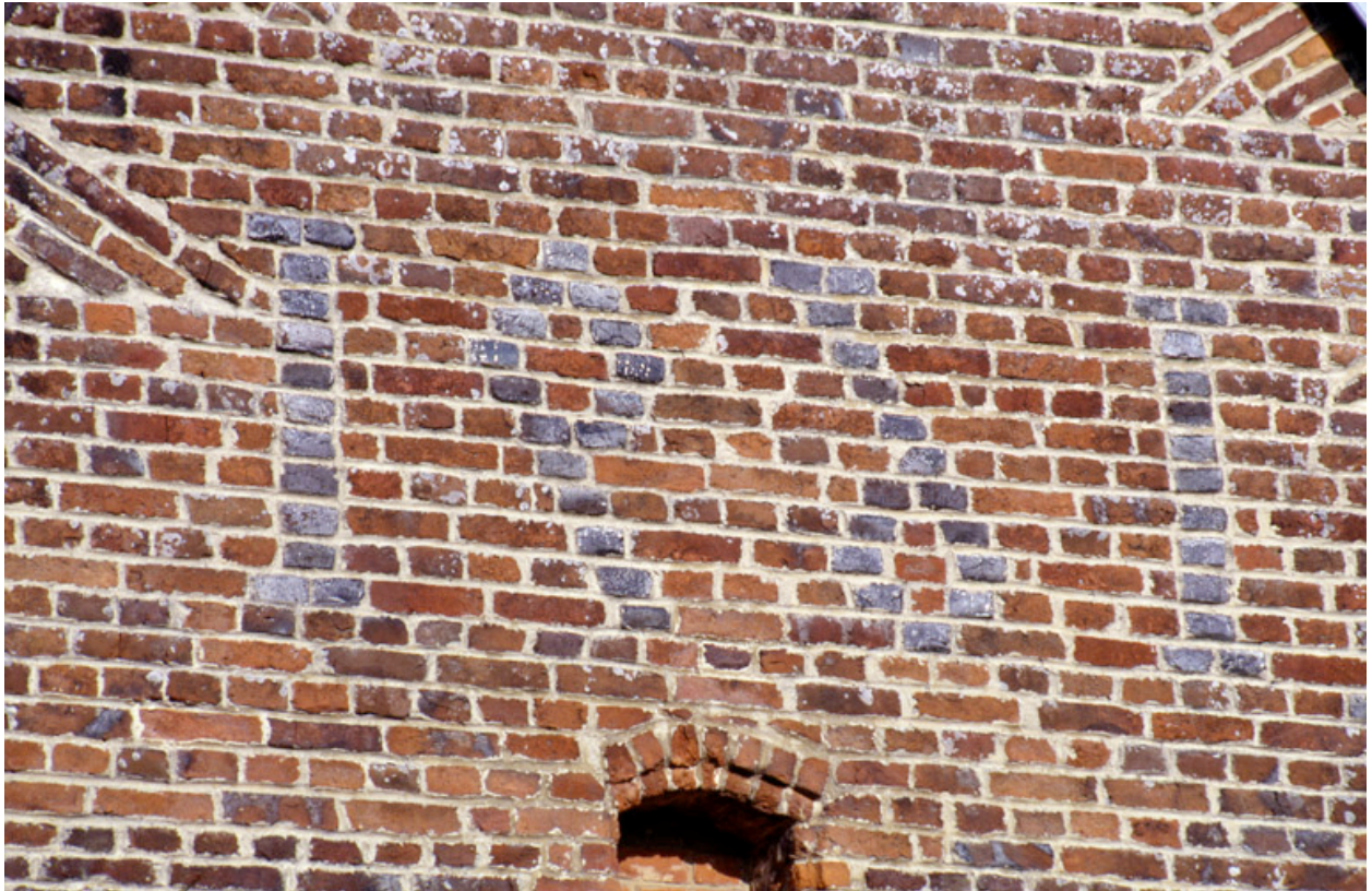
Barzy-en-Thiérache, maison (repérée), 57 Grande-Rue : date 1691 inscrite à l'envers (mur pignon ouest).