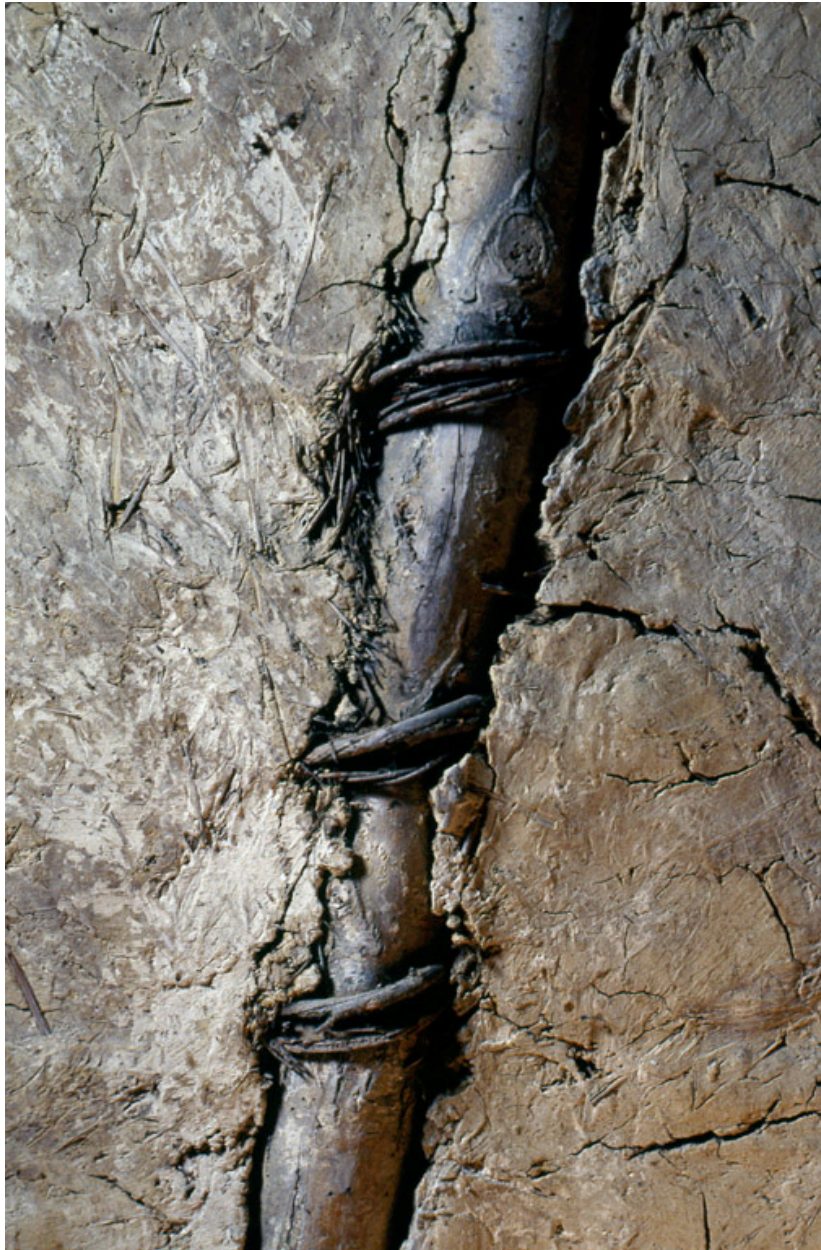
Barzy-en-Thiérache, ferme (repérée), 30 rue Neuve : détail d'une cloison en torchis dans le comble du logis.