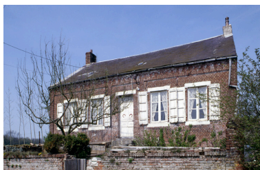
Fesmy-le-Sart, ferme (repérée), la Carrière-Etreux, 9 rue Carrière-Etreux : logis daté 1871. IVR22_19930201343ZA