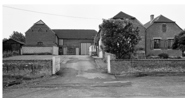
Barzy-en-Thiérache, ferme (étudiée), 26 Grande-Rue. IVR22_19930200606V