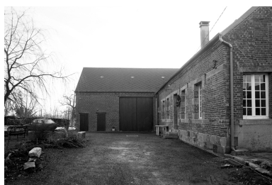
Fesmy-le-Sart, ancienne ferme (étudiée), le Sart, 36 Grande-Rue.