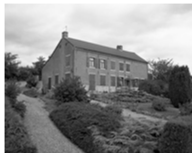
Boué, maison (étudiée), 5,7 rue des Vannois.