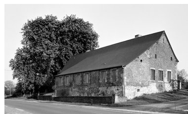
Bergues-sur-Sambre, ferme (étudiée), 27 rue du Général-de-Gaulle. IVR22_19930200611X