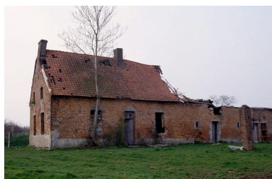
Barzy-en-Thiérache, ferme (repérée), CD 262 : logis (daté 1681 sur linteau de porte) et étable attenante.