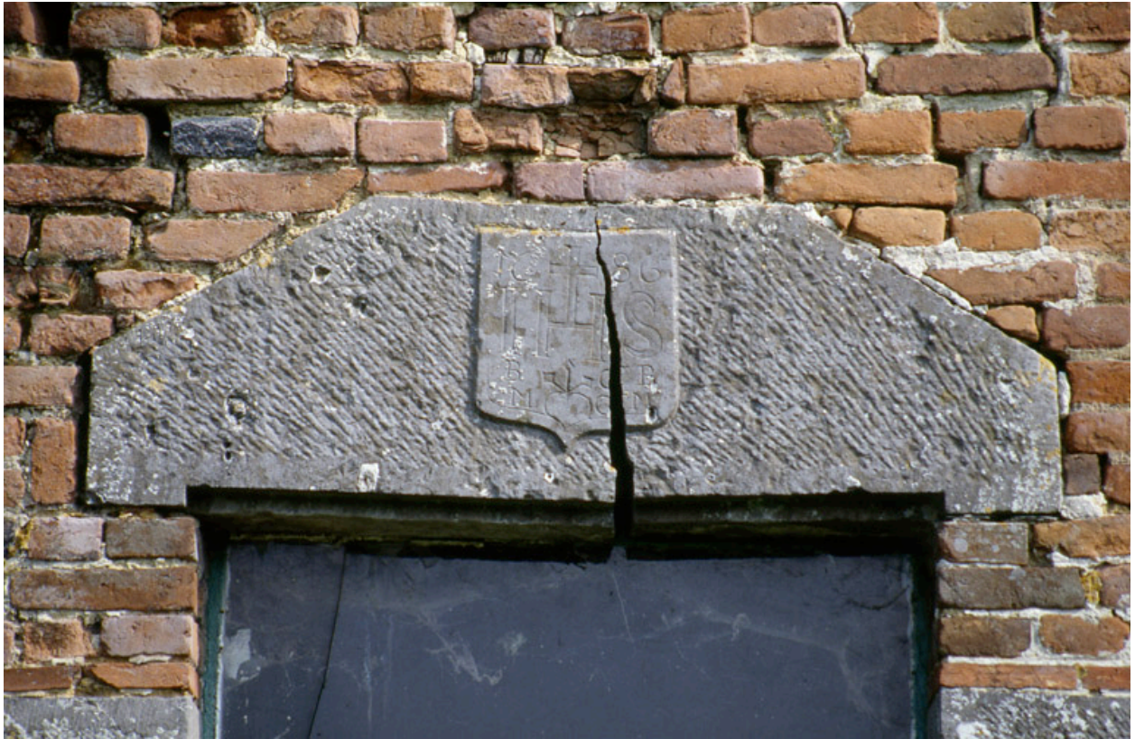
Barzy-en-Thiérache, ferme (repérée), 38 Grande-Rue : linteau de la porte du logis portant la date 1686.