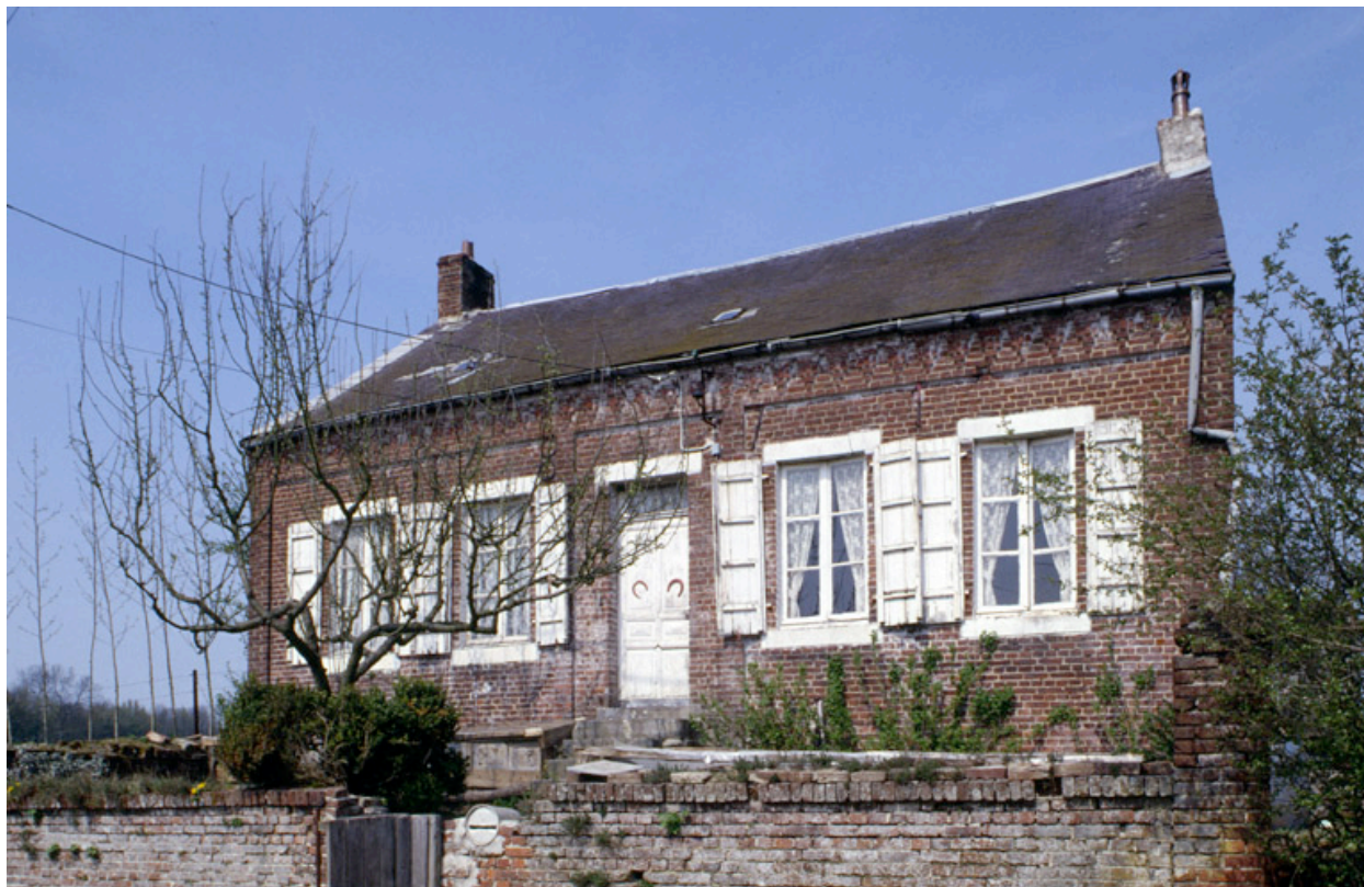
Fesmy-le-Sart, ferme (repérée), la Carrière-Etreux, 9 rue Carrière-Etreux : logis daté 1871.