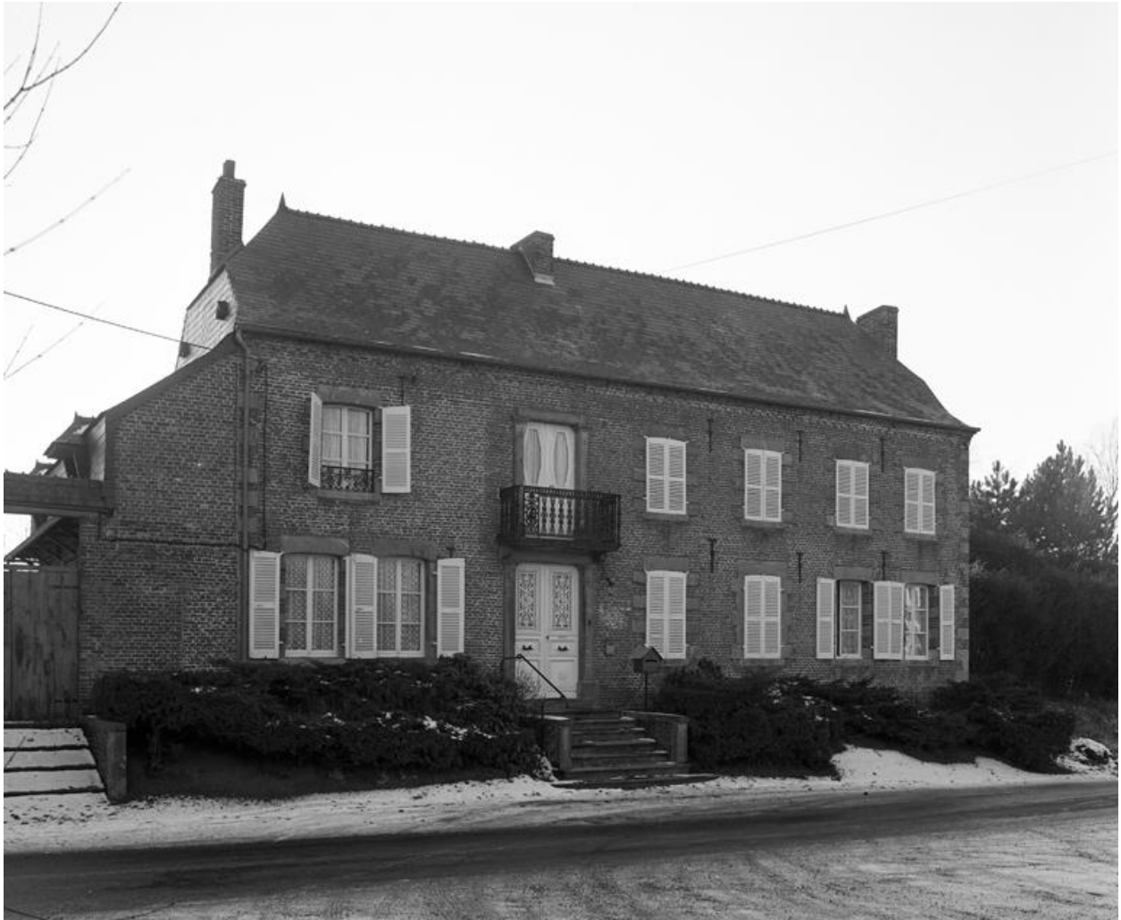
Leschelle. Ferme (étudiée), 12 rue de Verdun.