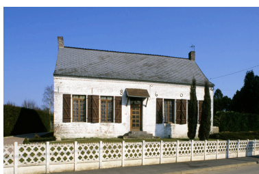
La Neuville-lès-Dorengt. Maison (étudiée) 12 rue de Verdun.