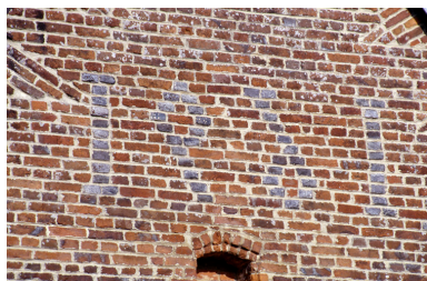
Barzy-en-Thiérache, maison (repérée), 57 Grande-Rue : date 1691 inscrite à l'envers (mur pignon ouest).