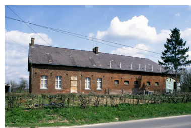
Le Nouvion-en-Thiérache. Fermes (étudiées), au Mont-Châtillon. IVR22_19960200476ZA