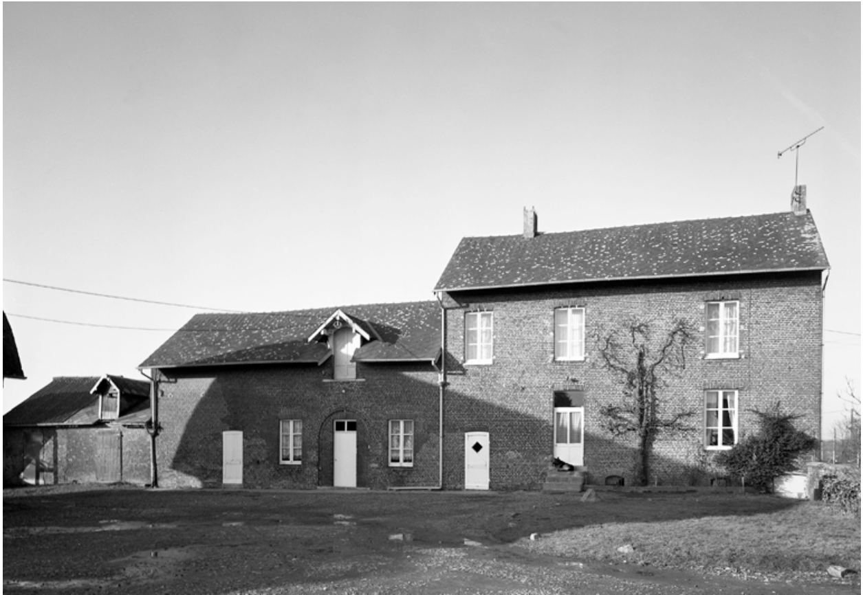
Le Nouvion-en-Thiérache. Ferme (étudiée), dite ferme des Potasse.