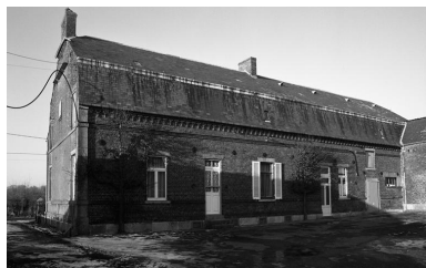
Leschelle. Ferme (étudiée), à Hennepieux. IVR22_19960200992X