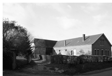
Esquéhéries, ancienne ferme (étudiée), le Sarrois, 47 route du Grand-Wez. IVR22_19960200890X