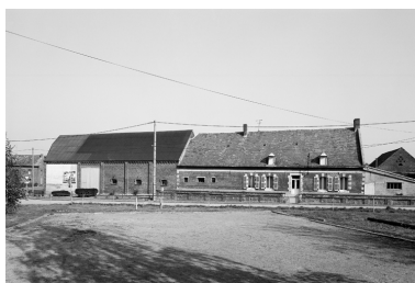
Bergues-sur-Sambre, ferme (étudiée), 9 place de l'Eglise. IVR22_19930200442V