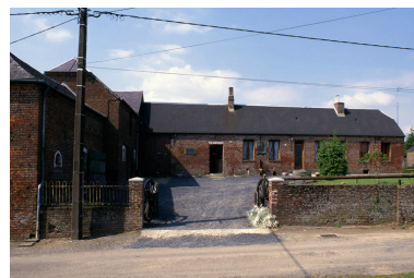
Esquéhéries, ferme (étudiée), 23 rue Neuve. IVR22_19970200347ZA