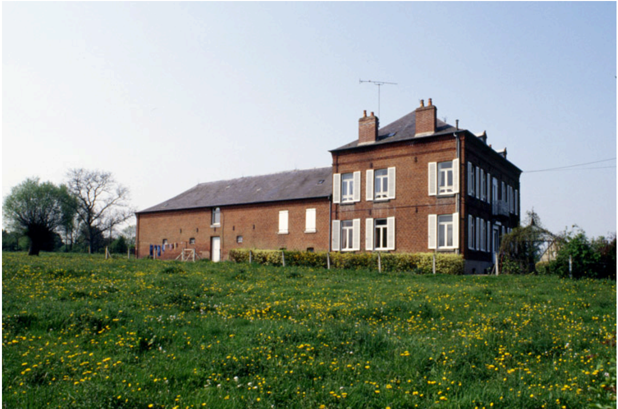
Barzy-en-Thiérache, ferme (étudiée), 6 Grande-Rue.