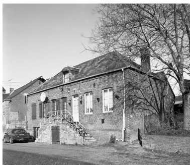
Esquéhéries, maison (étudiée), 18-20 rue du Général-de-Gaulle. IVR22_19960200850X