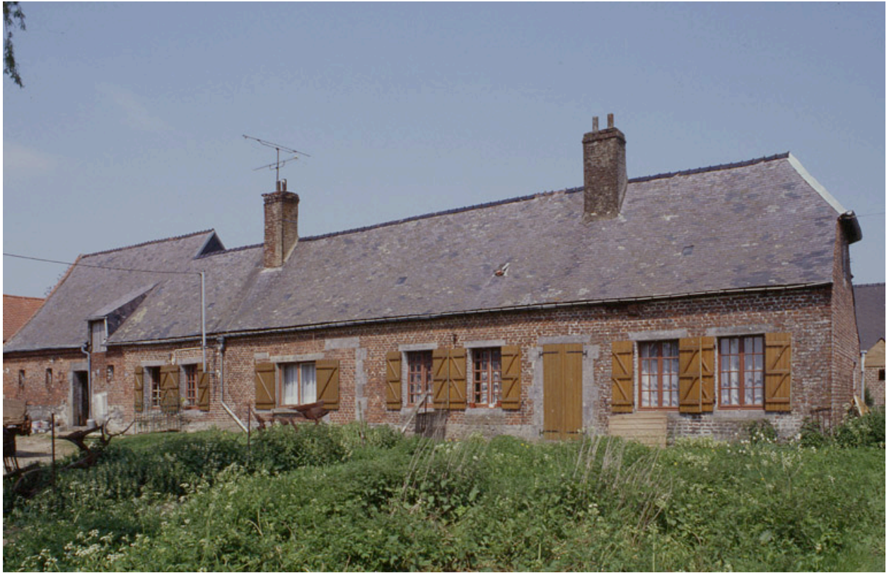
Barzy-en-Thiérache, ferme (repérée), 30 rue Neuve : logis et grange attenante.