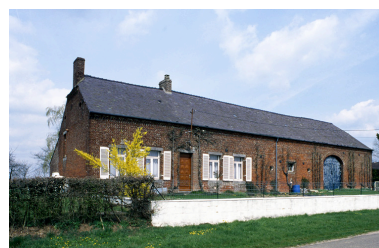
Le Nouvion-en-Thiérache. Ferme (étudiée) au Moulin à Vent.