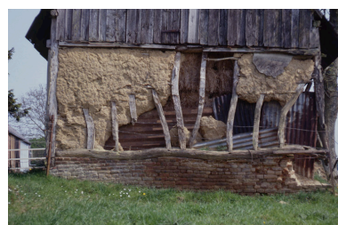
Dorengt, ferme (repérée), ruelle des Près : structure du pignon ouest de la grange en pan de bois et torchis sur solin de brique.