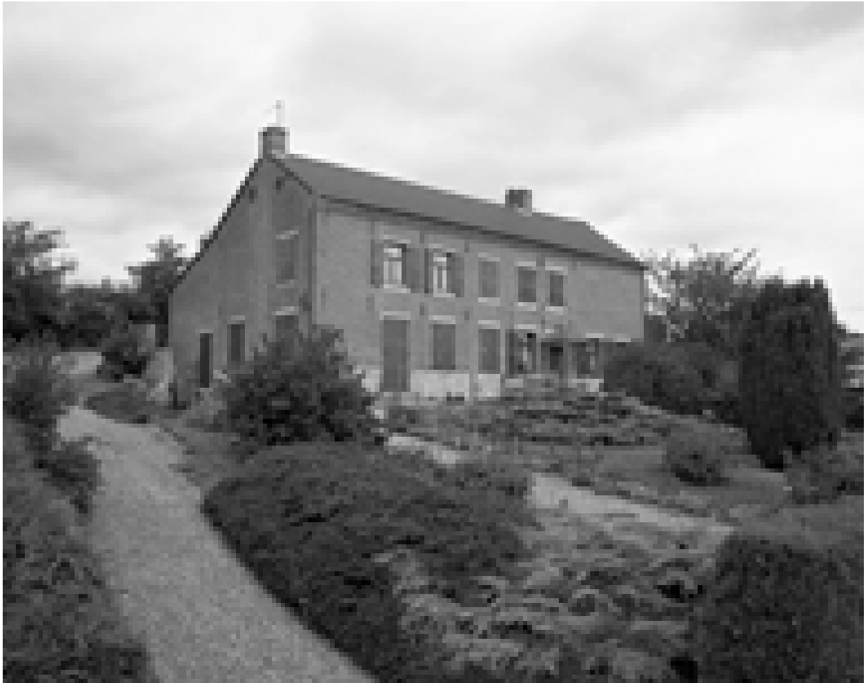
Boué, maison (étudiée), 5,7 rue des Vannois.