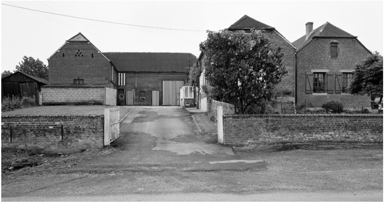
Barzy-en-Thiérache, ferme (étudiée), 26 Grande-Rue.