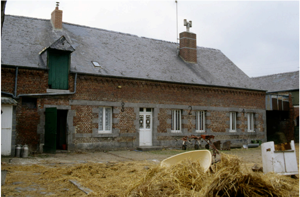
Fesmy-le-Sart, ferme (repérée), le Sart, Chemin de la Vallée-Briolet : façade de la ferme datée 1824.