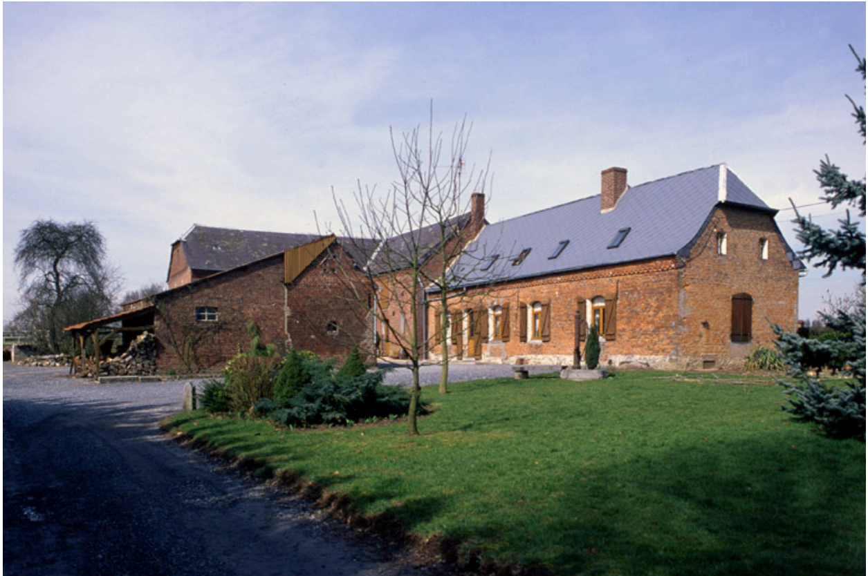
Le Nouvion-en-Thiérache. Ferme (étudiée), 17 rue Jacques-Brel.