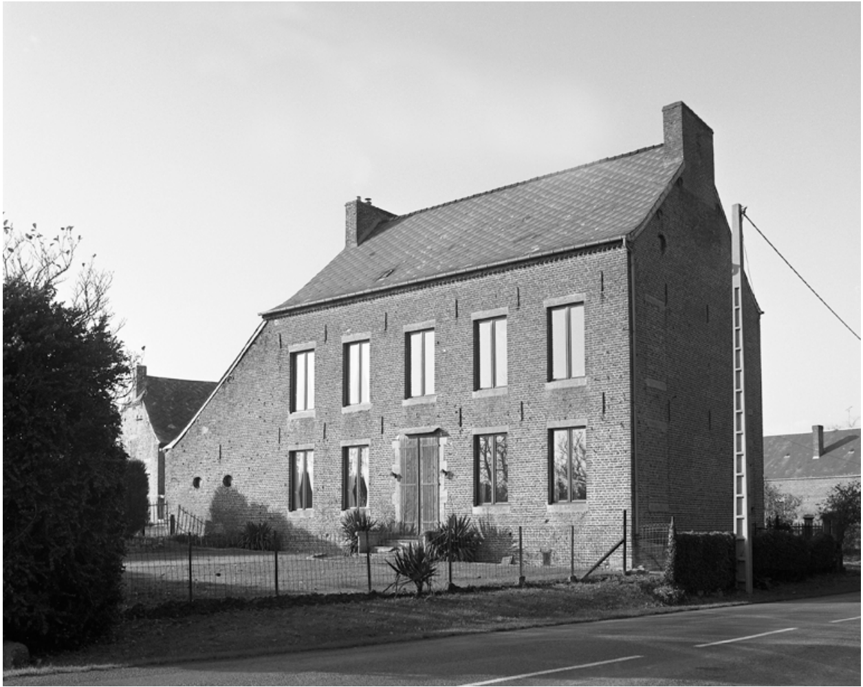
Esquéhéries, ancienne ferme (étudiée), le Sarrois, 45 route du Grand-Wez.