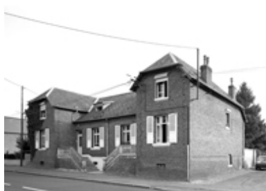
Boué, maison jumelée (étudiée), 26 rue du Nouvion. IVR22_19960200583V