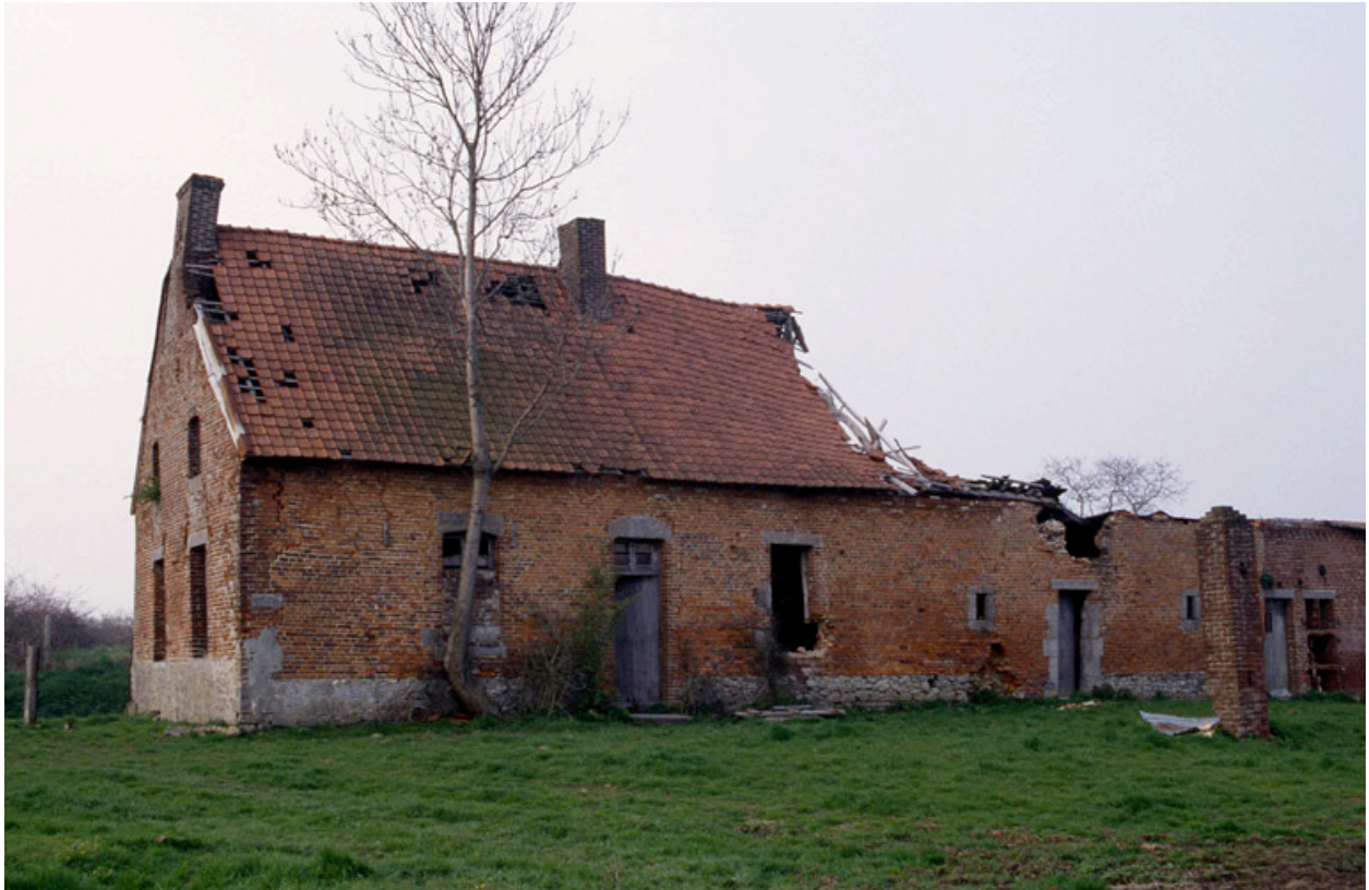
Barzy-en-Thiérache, ferme (repérée), CD 262 : logis (daté 1681 sur linteau de porte) et étable attenante.