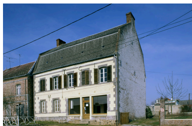
Boué, ferme (étudiée), 18 rue du Rejet.