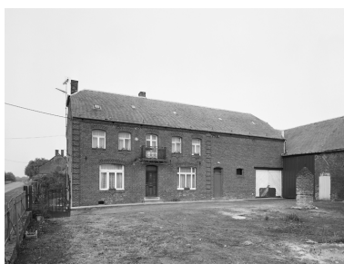
Fesmy-le-Sart, ancienne ferme (étudiée), la Culbute.