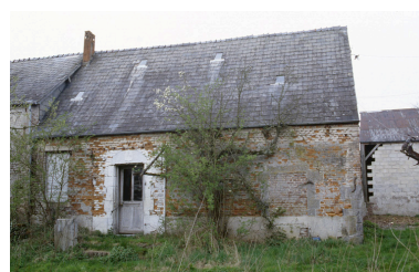
Barzy-en-Thiérache, ferme (repérée), 4 bis rue du Sart : logis.