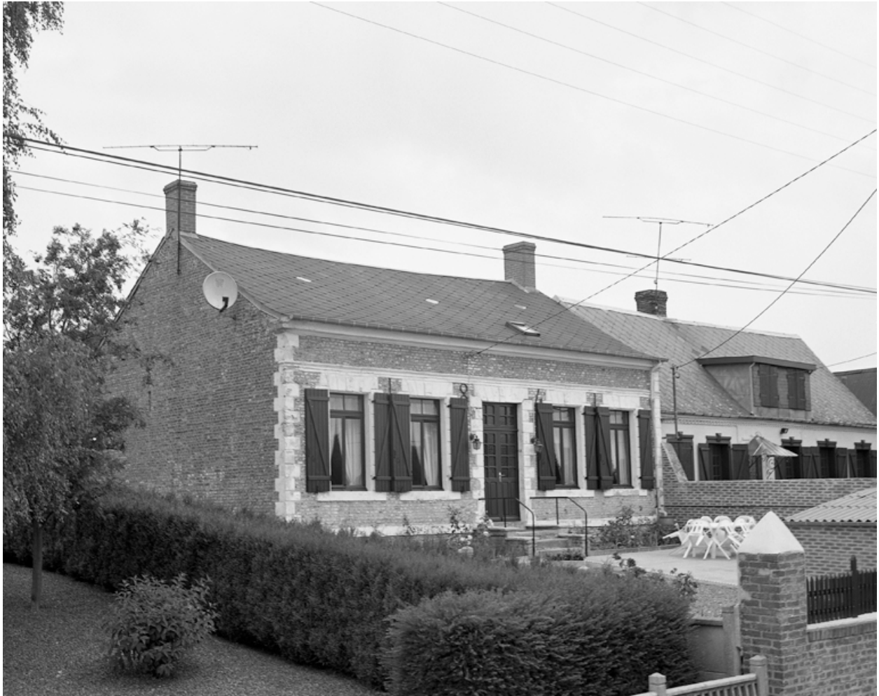
Boué, maison (étudiée), 14 rue d'Oisy.