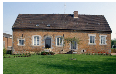
Barzy-en-Thiérache, maison (repérée), 57 Grande-Rue. IVR22_19930201076ZA