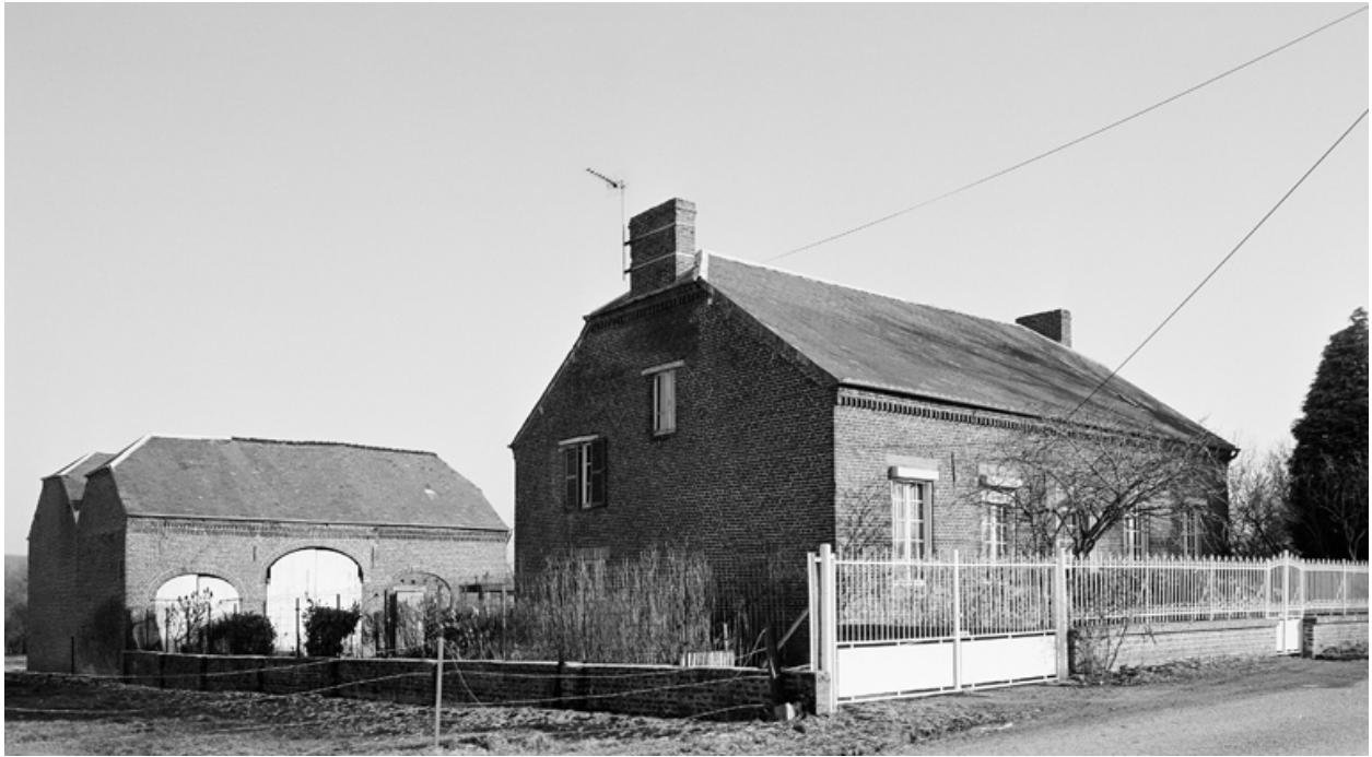
Bergues-sur-Sambre, ferme (étudiée), 2 rue Jumeau.