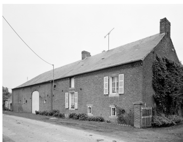
Barzy-en-Thiérache, ferme (étudiée), 6 rue du Sart.