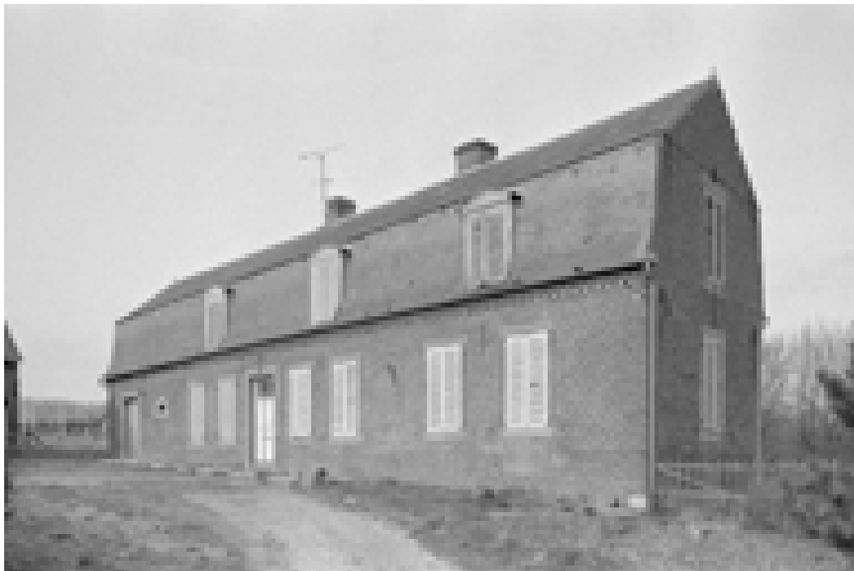
Boué, ferme (étudiée), 51 rue des Vannois.