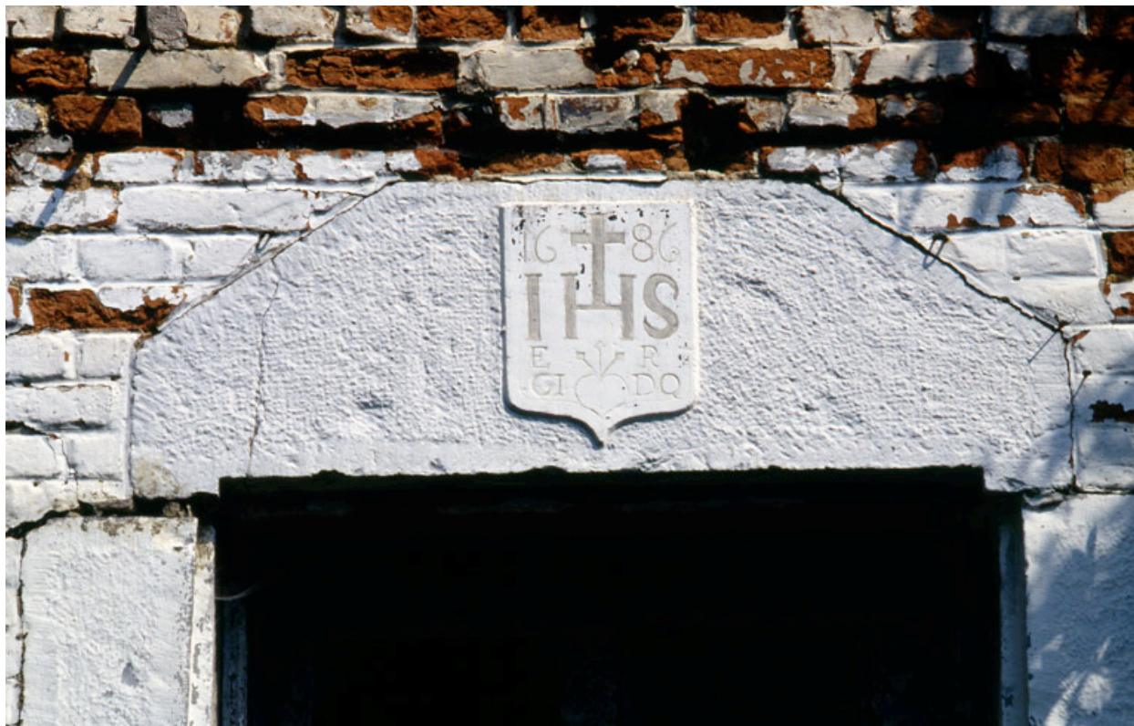
Barzy-en-Thiérache, ferme (repérée), 4 bis rue du Sart : linteau de la porte du logis portant la date 1686.