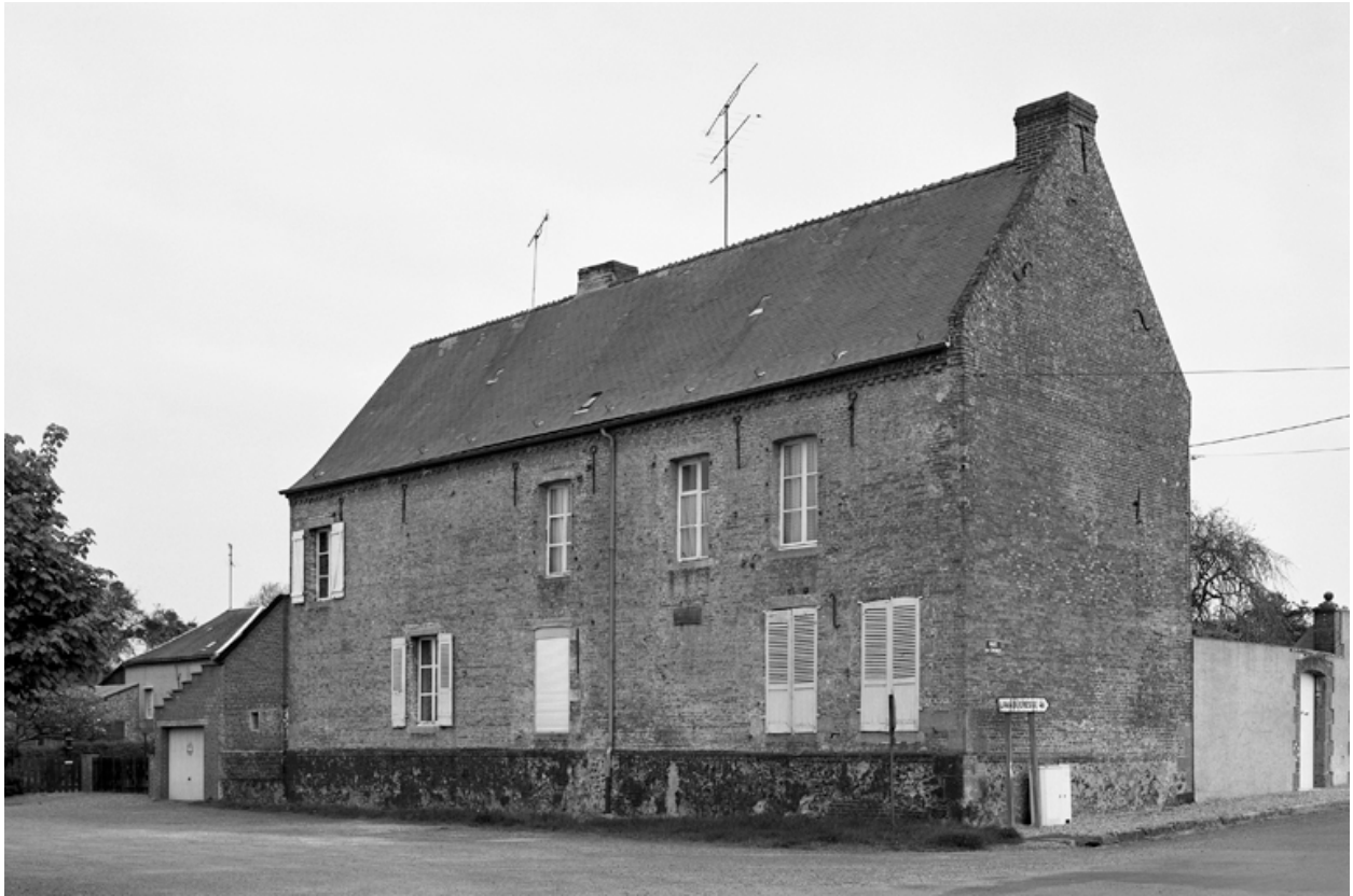
Esquéhéries, ancienne ferme (étudiée), 1 route du Chénot.