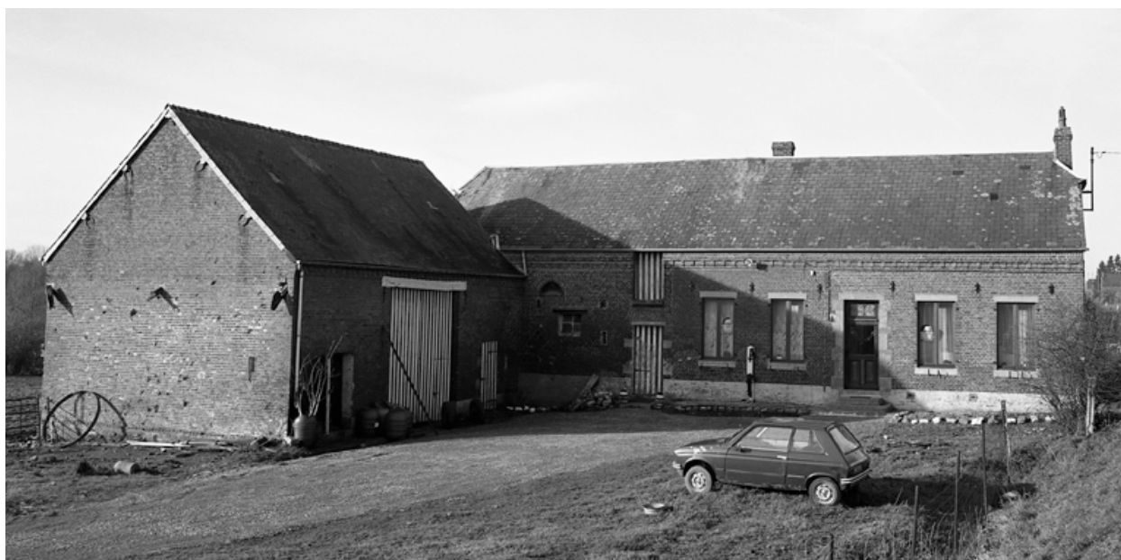
Fesmy-le-Sart, ancienne ferme (étudiée), la Fontaine-au-Pain, 9 RN 43.