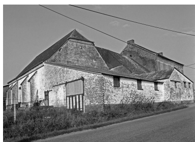
La Neuville-lès-Dorengt. Ferme au Bosquet-Carré (étudiée), 3 route d' Esquéhéries.