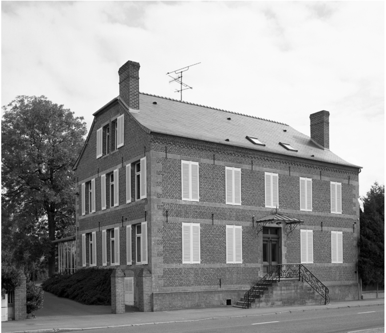
Boué, maison (étudiée) de l'ancien moulin à farine, 9 rue de la Gare.