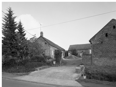
Boué, ferme (étudiée), 26 rue des Vannois. IVR22_19960200571V