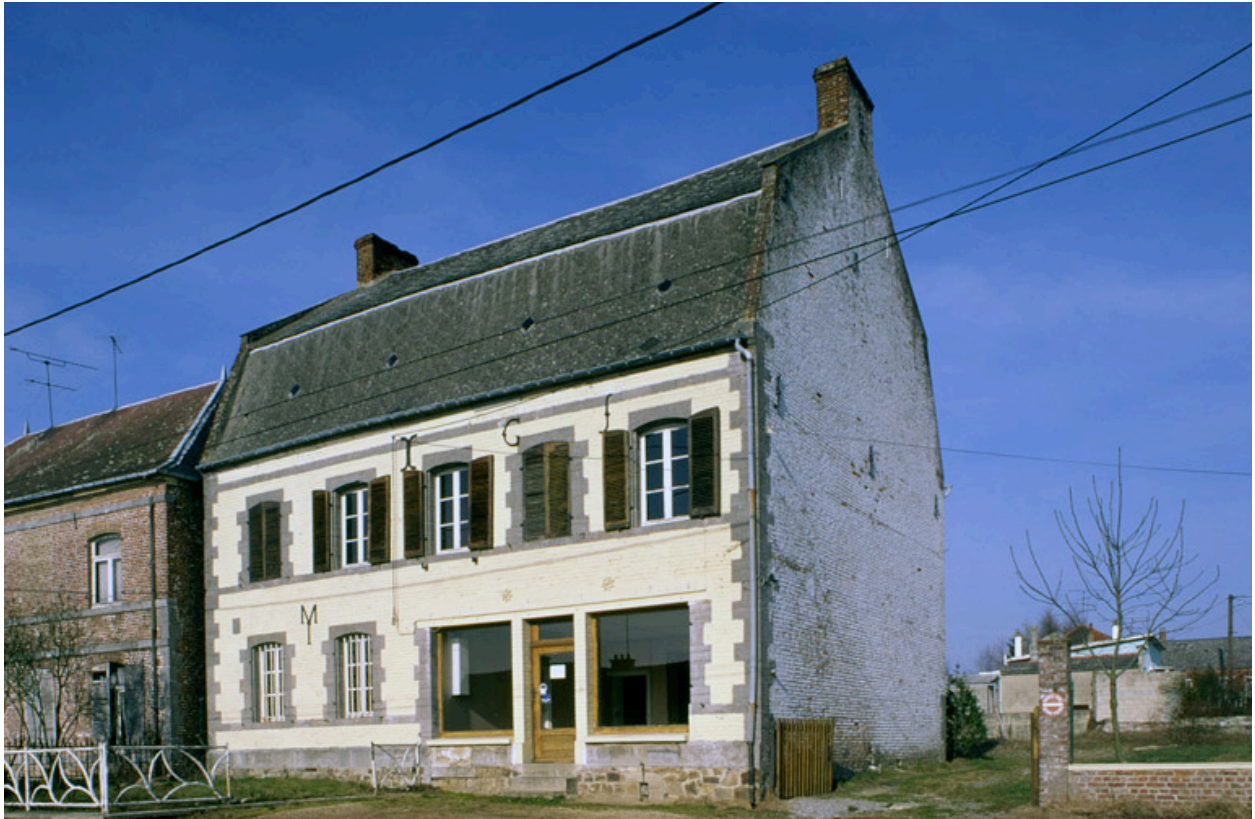
Boué, ferme (étudiée), 18 rue du Rejet.