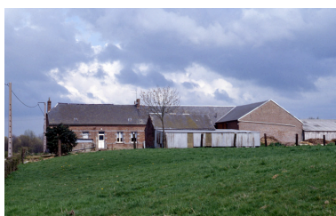
Fesmy-le-Sart, ferme (repérée), le Sart, rue de Saint-Pierre : vue générale depuis l'ouest.