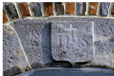
Barzy-en-Thiérache, maison (repérée), 57 Grande-Rue : linteau de la porte portant la date 1692.