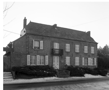
Leschelle. Ferme (étudiée), 12 rue de Verdun. IVR22_19960200967X