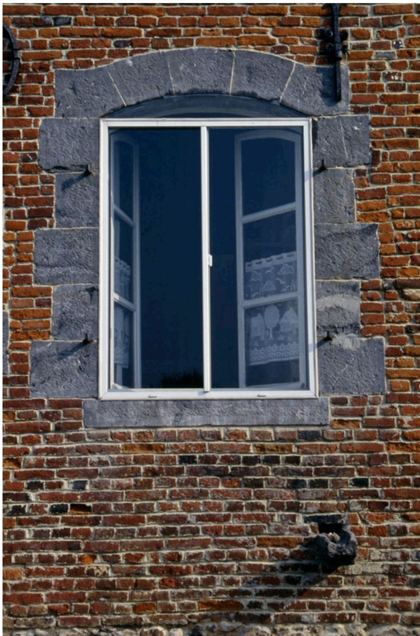
Barzy-en-Thiérache, maison (repérée), 57 Grande-Rue : détail d'une fenêtre avec encadrement en pierre bleue.