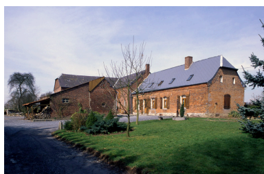
Le Nouvion-en-Thiérache. Ferme (étudiée), 17 rue Jacques-Brel. IVR22_19960200218ZA