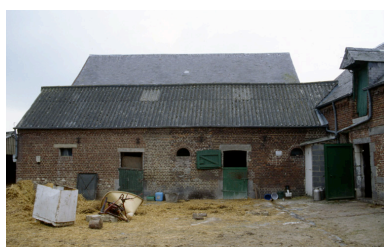
Fesmy-le-Sart, ferme (repérée), le Sart, Chemin de la Vallée-Briole : élévation est sur cour de la ferme datée 1824.