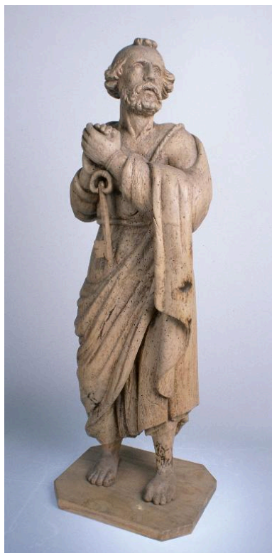
Vue d'ensemble. IVR22_19966000762ZA