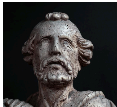
Détail du visage du saint. IVR22_19956000394XA