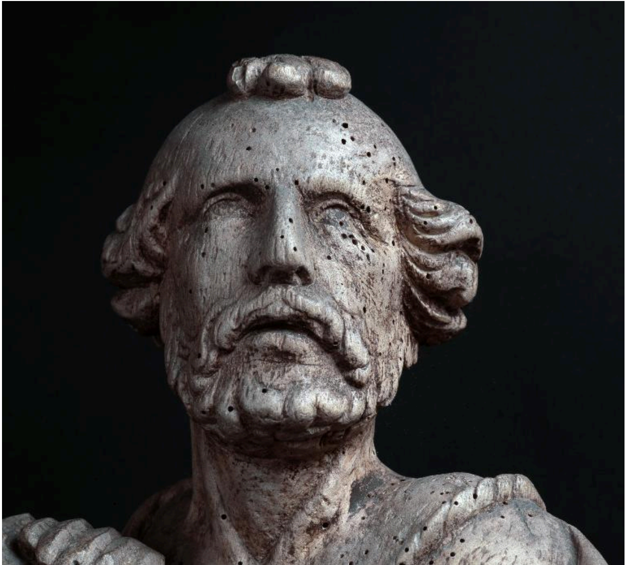
Détail du visage du saint.