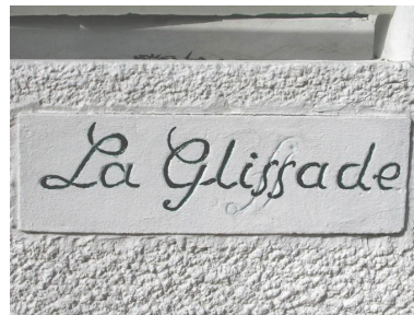
Détail d'une appellation gravée en creux dans le ciment. IVR22_20048001511NUCA