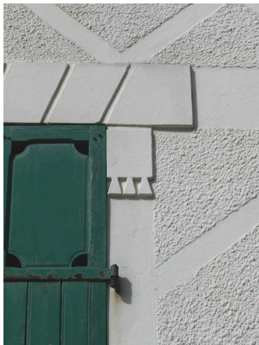
Détail du décor de ciment situé autour des baies.