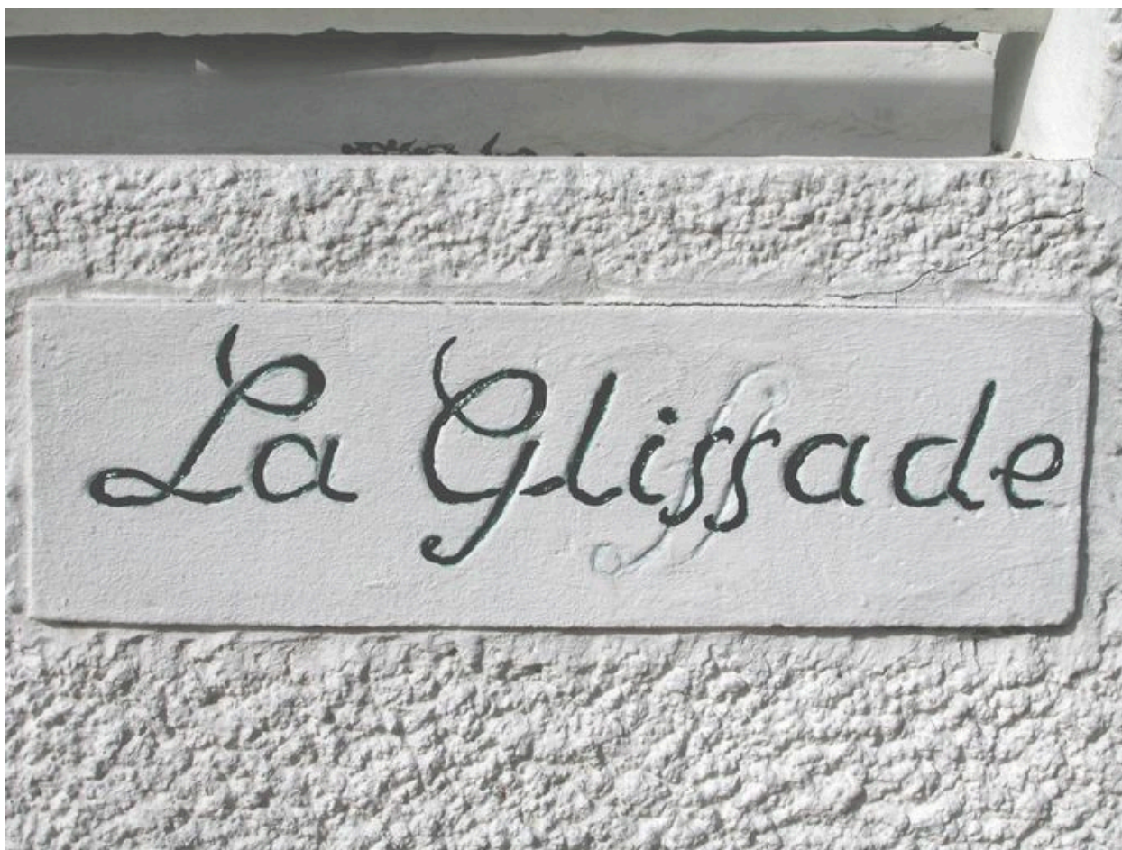
Détail d'une appellation gravée en creux dans le ciment.