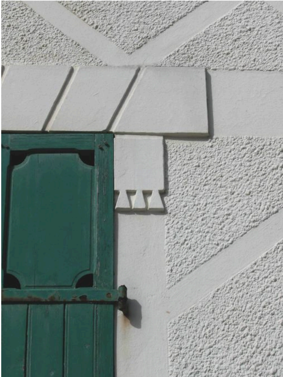
Détail du décor de ciment situé autour des baies.