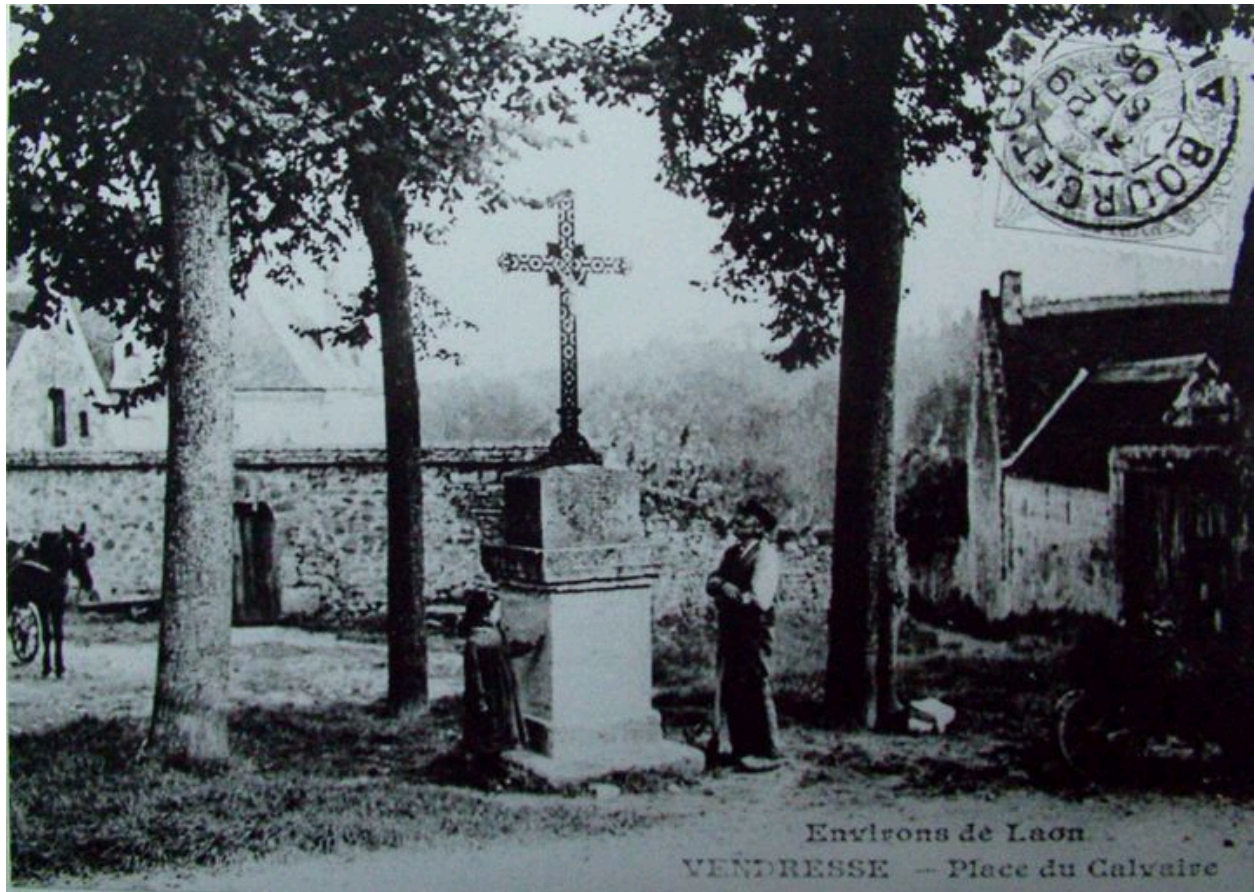
Vue du calvaire de l'ancien Vendresse.