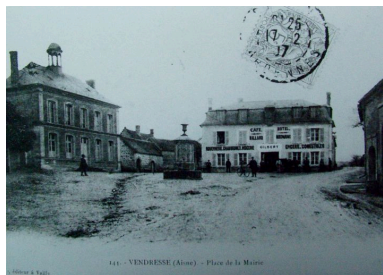
Vue ancienne de la place de la mairie (coll. part). Phot. Inès Guérin