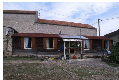
Maison provisoire dans le centre même du village de Vendresse.