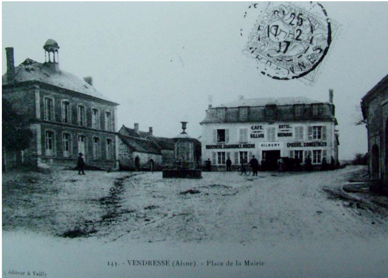
141. - VENDRESSE (Aisne). - Place de la Mairie

Vue ancienne de la place de la mairie (coll. part).