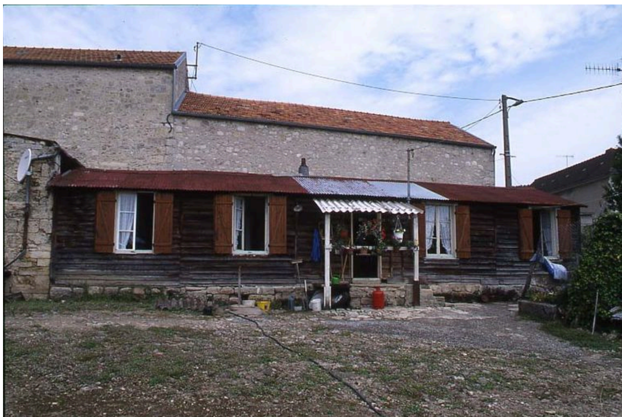
Maison provisoire dans le centre même du village de Vendresse.