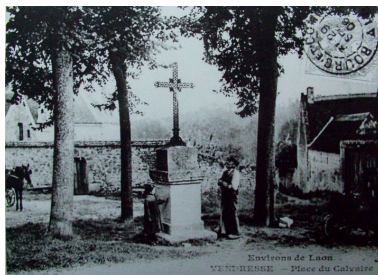
Vue du calvaire de l'ancien Vendresse (coll. part). Phot. Inès Guérin