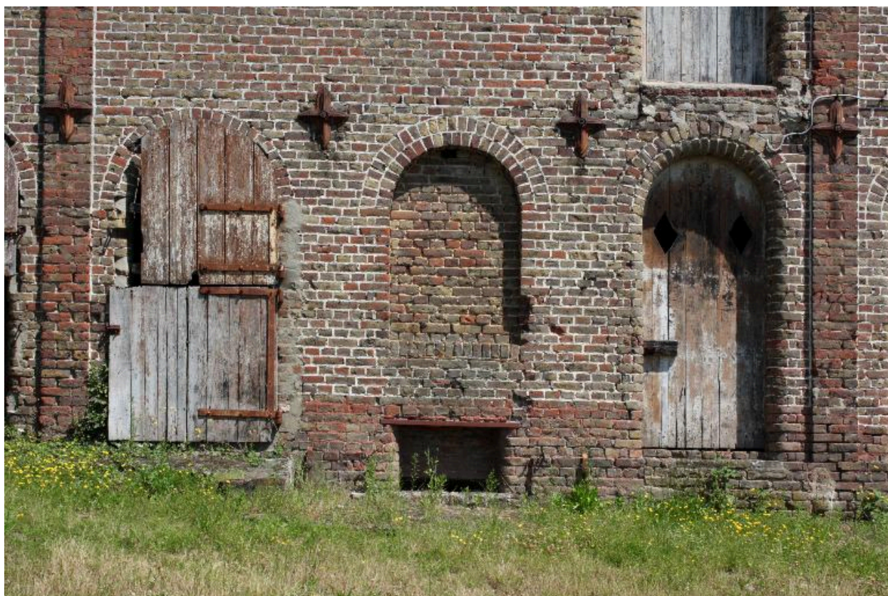
Détail des ouvertures sur cour de la laiterie.