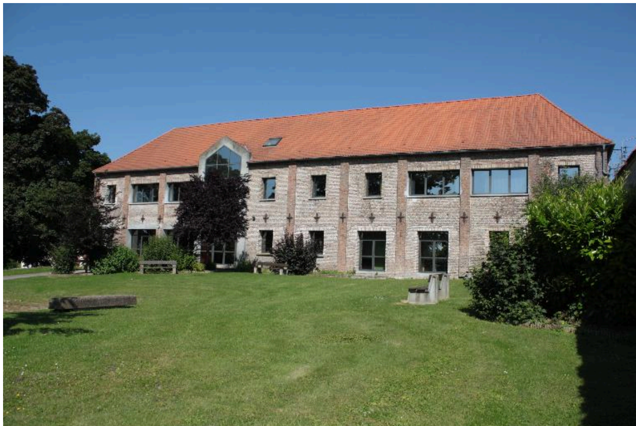
Façade extérieure des anciennes étables à vaches et écuries, converties en restaurant scolaire et salles de classe.