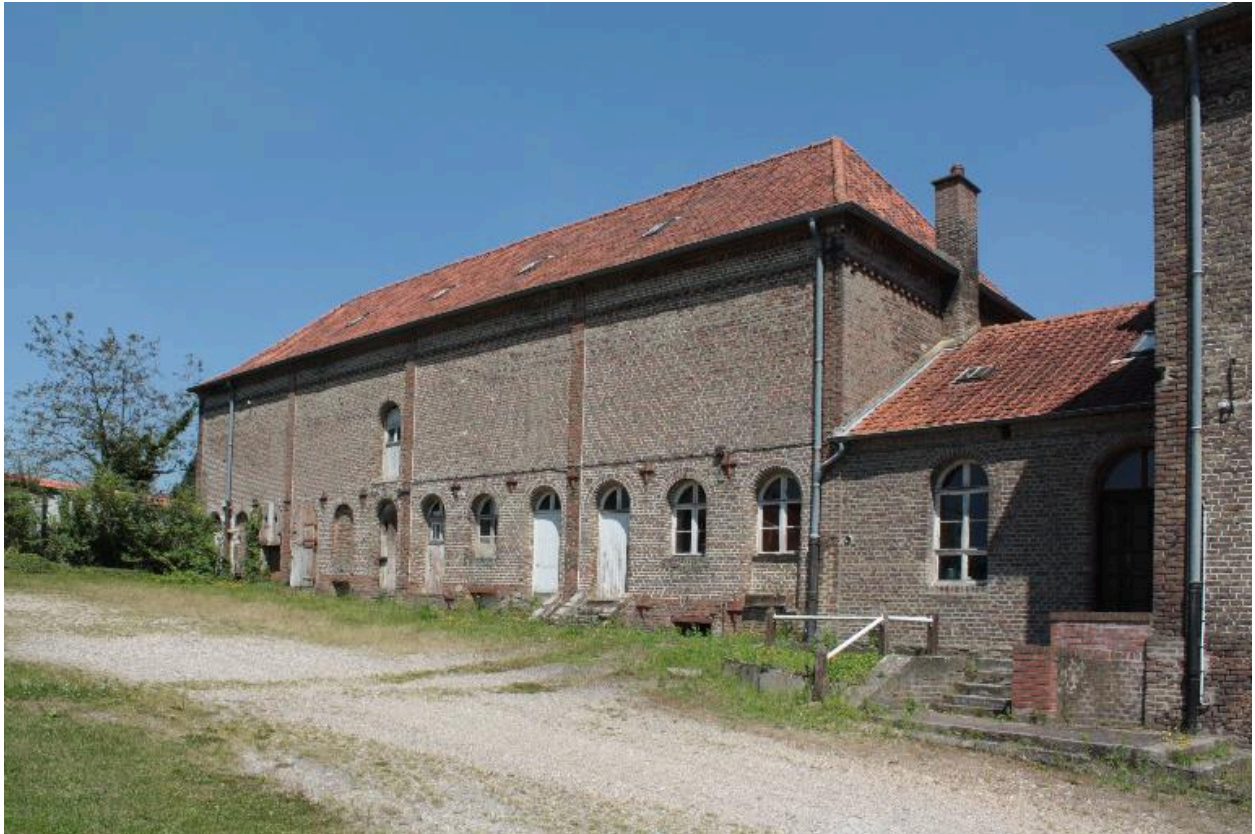
Façade sur cour de la laiterie, vue de trois-quarts.