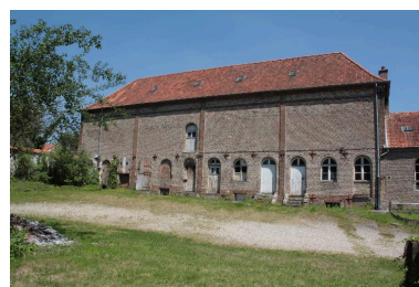
Façade sur cour de la laiterie, vue de face. IVR22_20138016131NUC2A