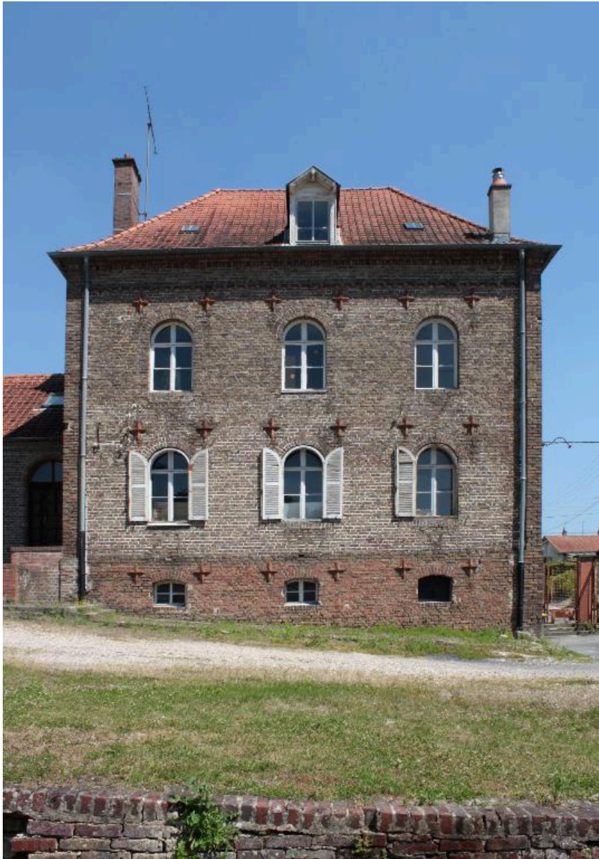
Logis de la ferme, façade sur cour.