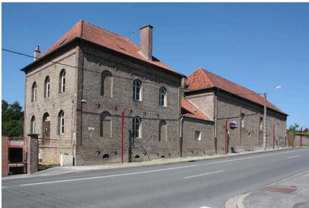
Vue d'ensemble sur rue de la ferme.