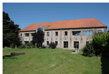
Façade extérieure des anciennes étables à vaches et écuries, converties en restaurant scolaire et salles de classe. IVR22_20138016134NUC2A