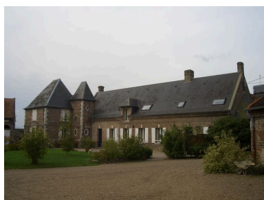
Vue postérieure du logis.