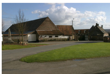
Vue d'ensemble de la ferme depuis la place publique.