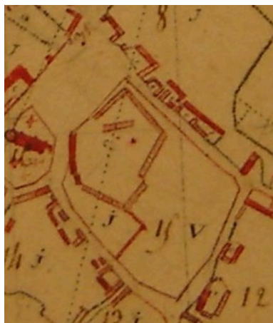
Extrait du plan par masse de culture présentant le plan de la ferme en 1802.