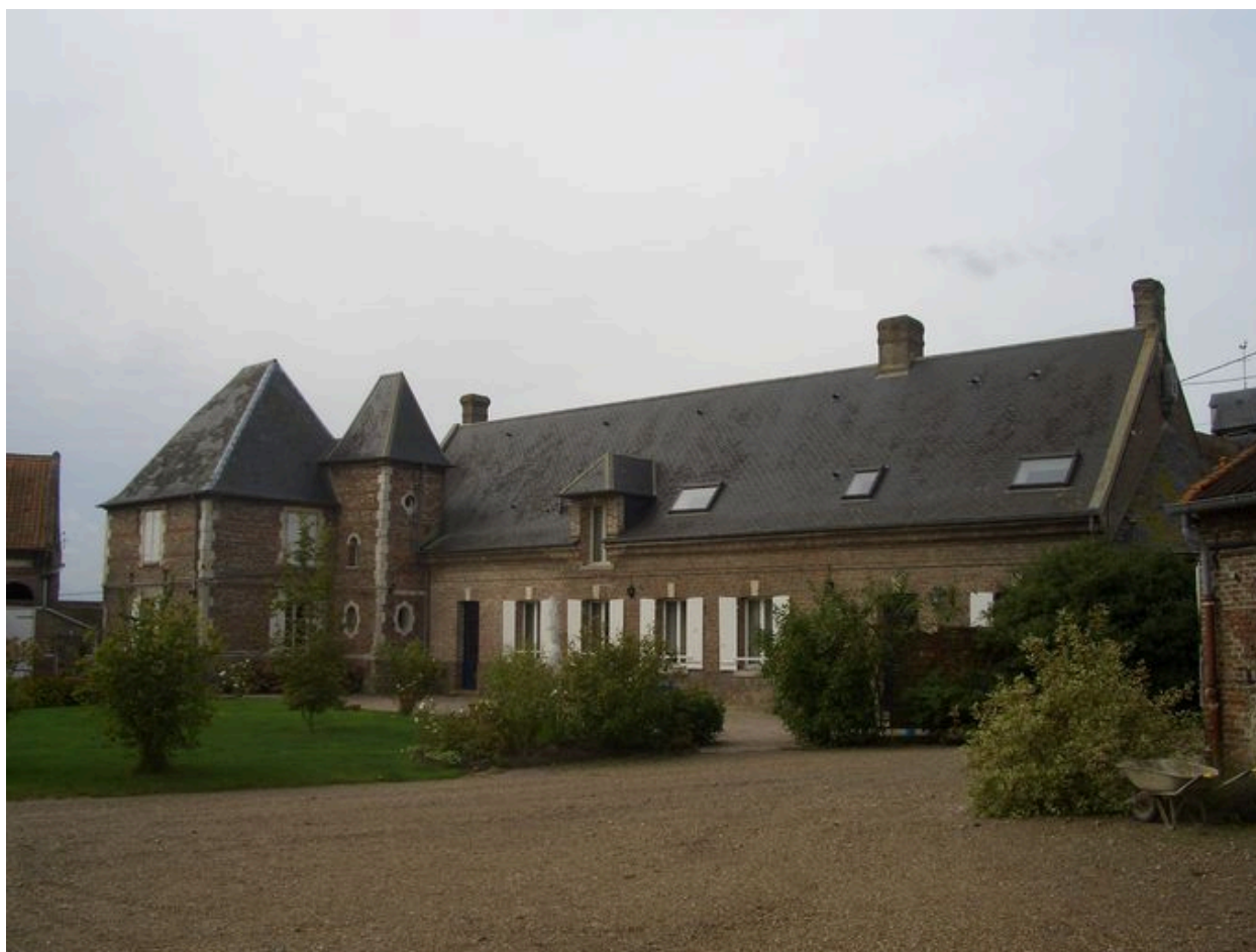
Vue postérieure du logis.