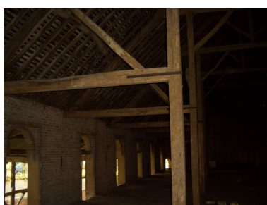
Vue des ouvertures donnant accès au grenier.