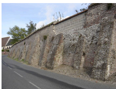
Mur d'enceinte dans la rue de la Somme.