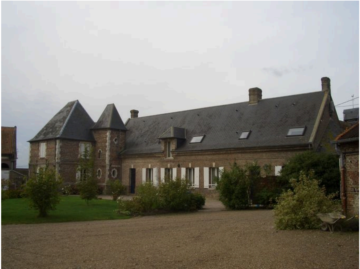
Vue postérieure du logis.