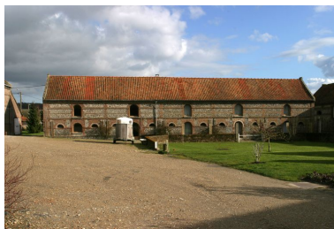
Vue de la vacherie et de la bergerie occupant tout le côté est de la cour.