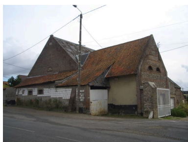
Vue des ateliers situés au nord du logis depuis la rue.