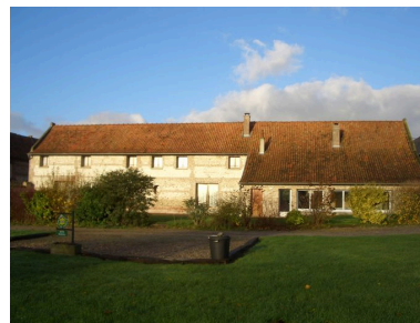
Vue postérieure de la vacherie et de la bergerie. IVR22_20068005603NUCA