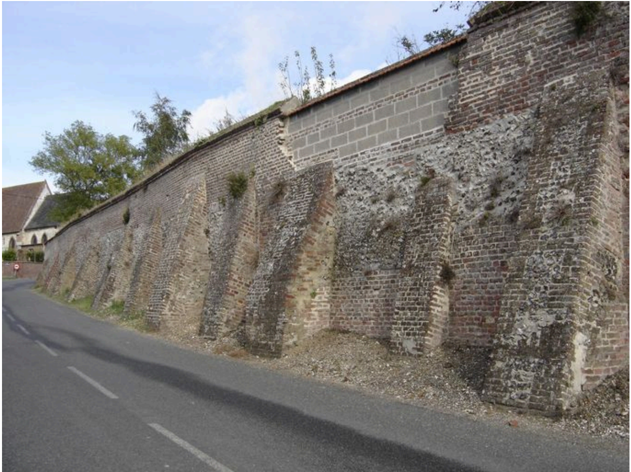
Mur d'enceinte dans la rue de la Somme.