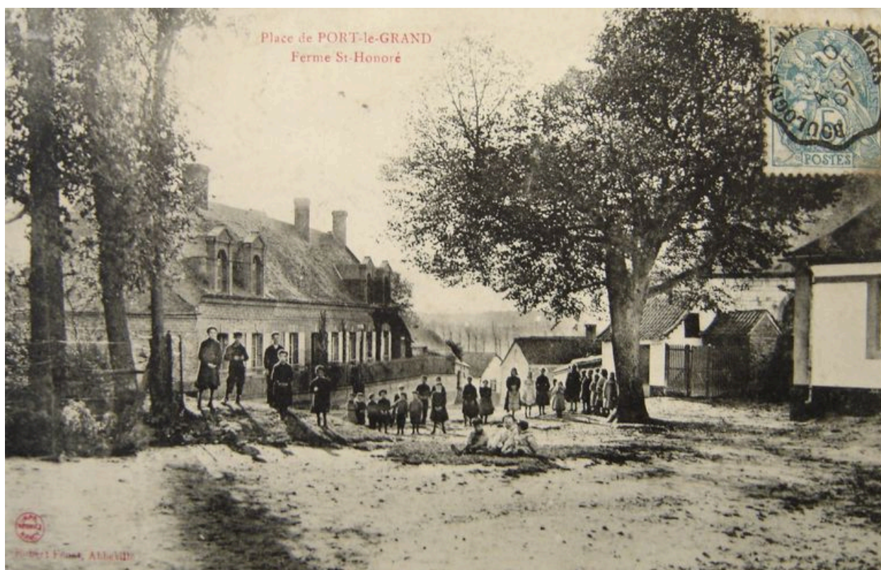
Vue de la ferme depuis la place publique au début du 20e siècle.