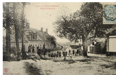
Vue de la ferme depuis la place publique au début du 20e siècle.