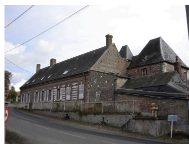
Vue du logis sur rue.