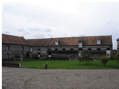
Vue des écuries au sud de la cour.