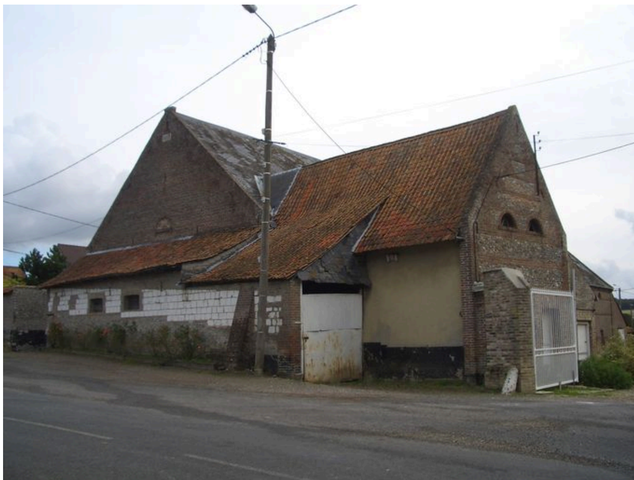
Vue des ateliers situés au nord du logis depuis la rue.