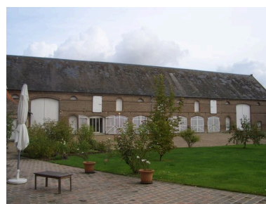
Vue des bouveries depuis la cour occupant tout le côté nord de la propriété.