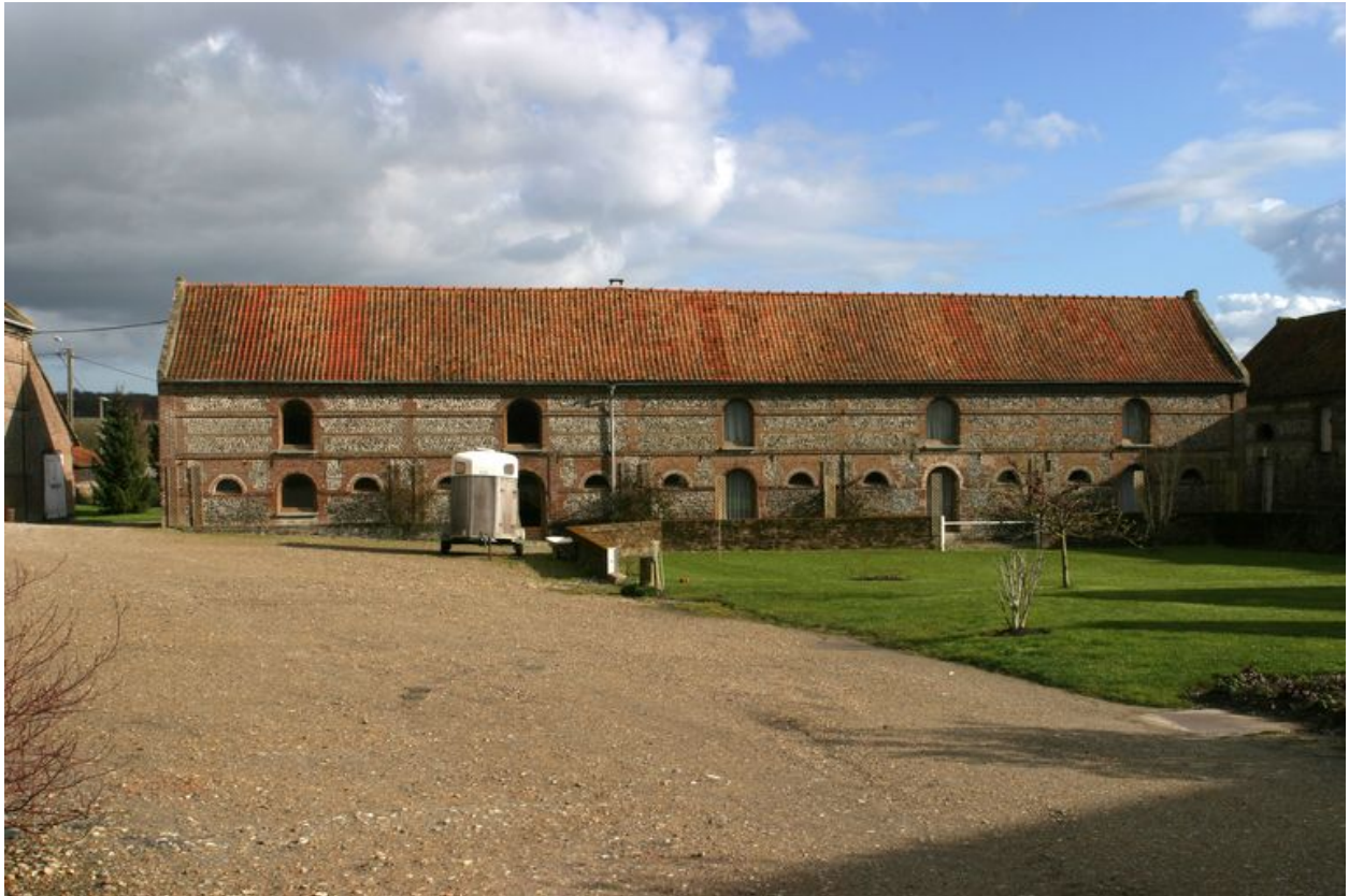
Vue de la vacherie et de la bergerie occupant tout le côté est de la cour.