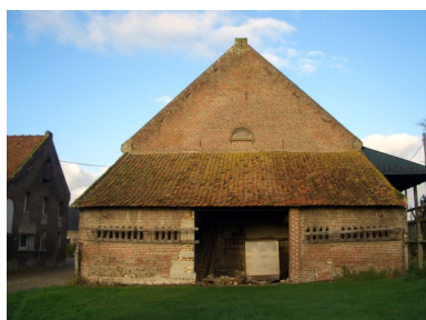
Vue du pignon est des bouveries. IVR22_20068005600NUCA