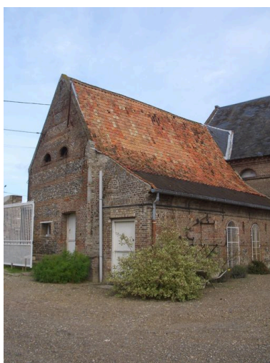
Vue des ateliers depuis la cour. IVR22_20068005409NUCA