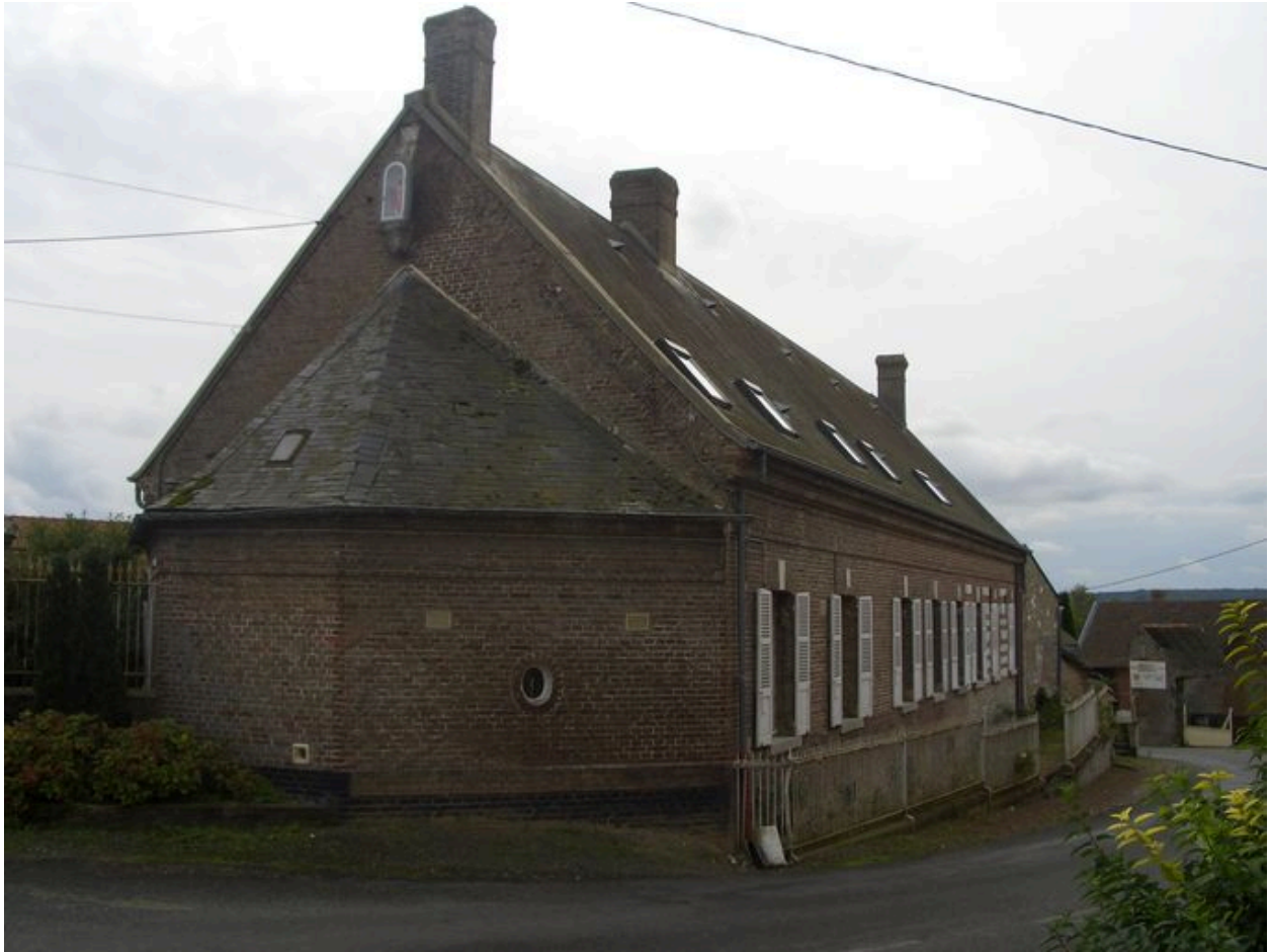
Vue latérale du logis avec appentis au nord.