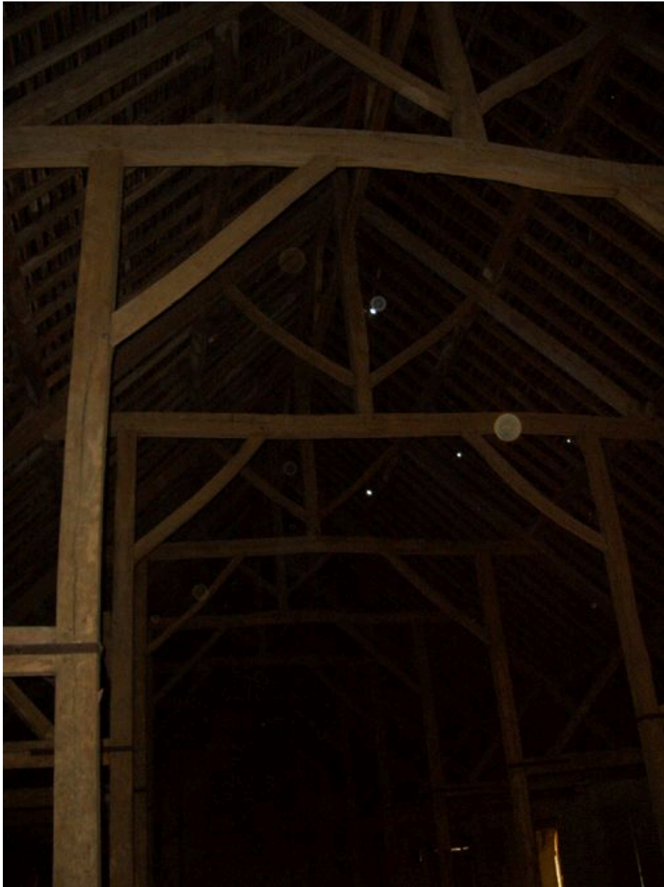
Vue partielle de la charpente des bouveries.