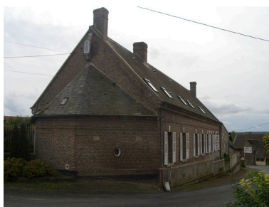
Vue latérale du logis avec appentis au nord. IVR22_20068005407NUCA