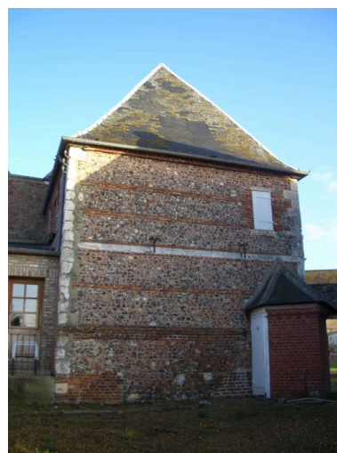
Vue méridionale de la tour.