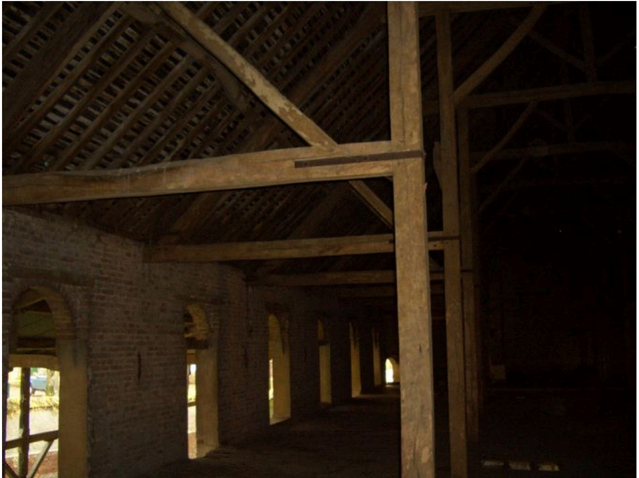
Vue des ouvertures donnant accès au grenier.