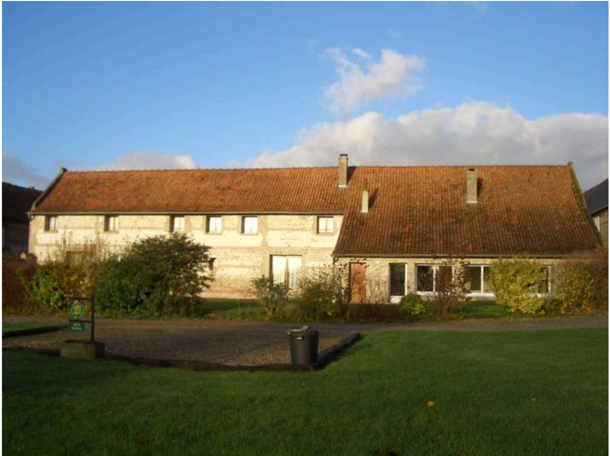
Vue postérieure de la vacherie et de la bergerie.