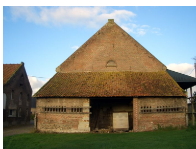
Vue du pignon est des bouveries.