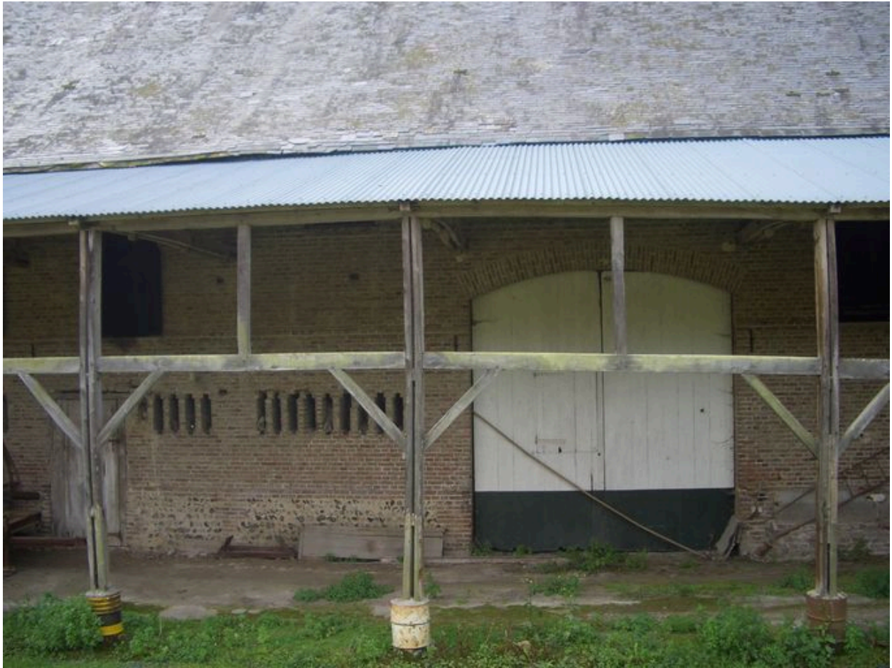
Vue postérieure d'une des travées.