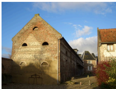
Vue latérale des écuries depuis l'est.