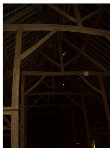
Vue partielle de la charpente des bouveries.