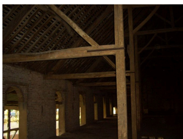
Vue des ouvertures donnant accès au grenier. IVR22_20068005602NUCA