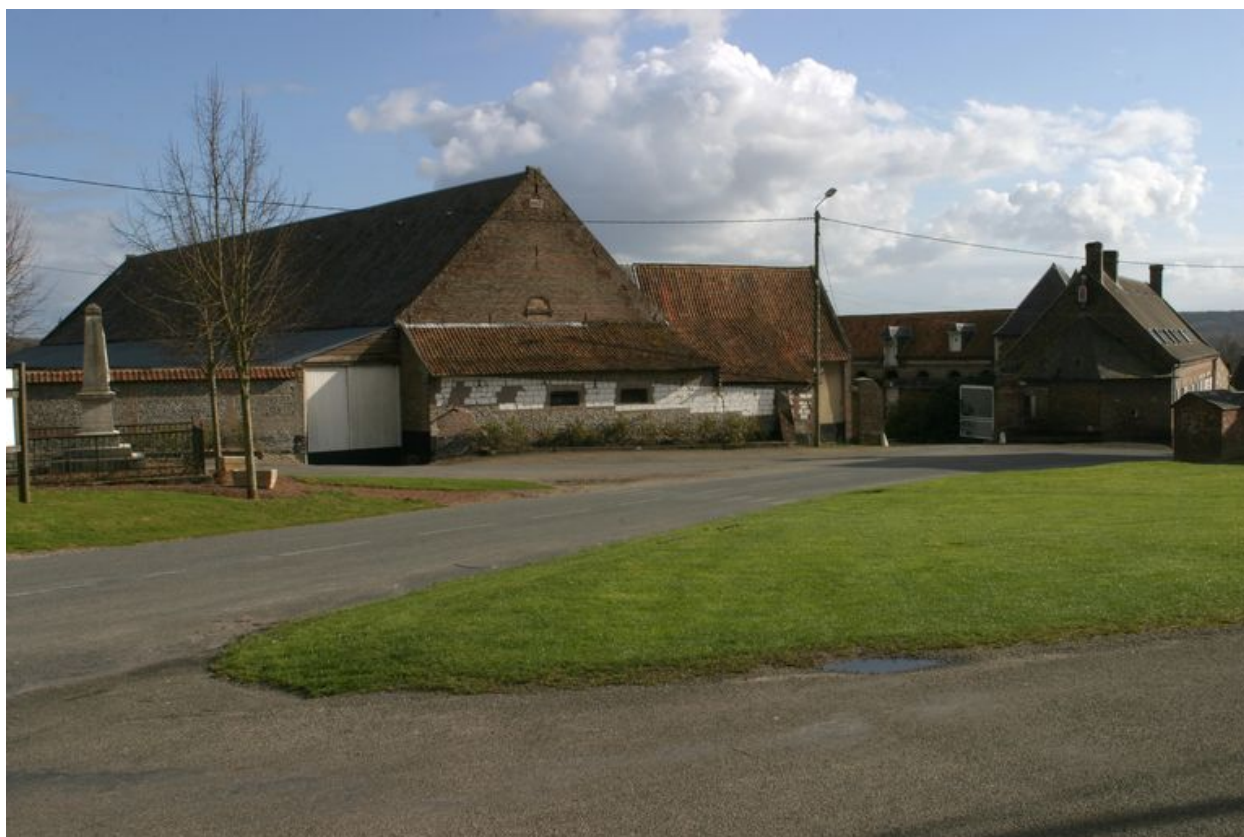
Vue d'ensemble de la ferme depuis la place publique.