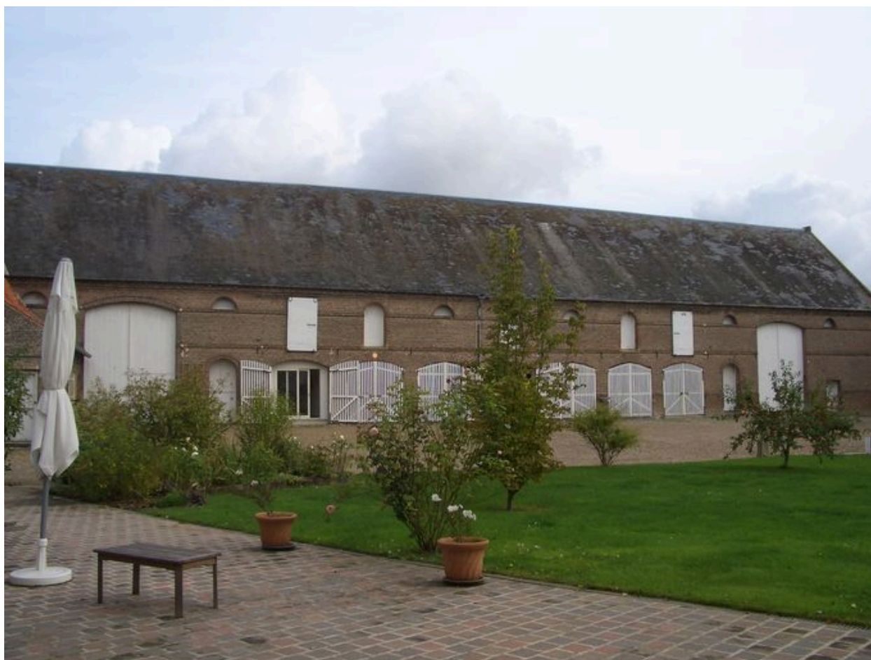
Vue des bouveries depuis la cour occupant tout le côté nord de la propriété.