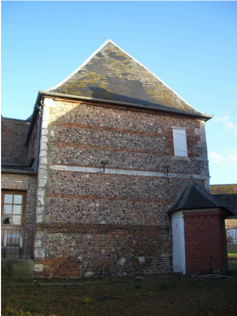
Vue méridionale de la tour.