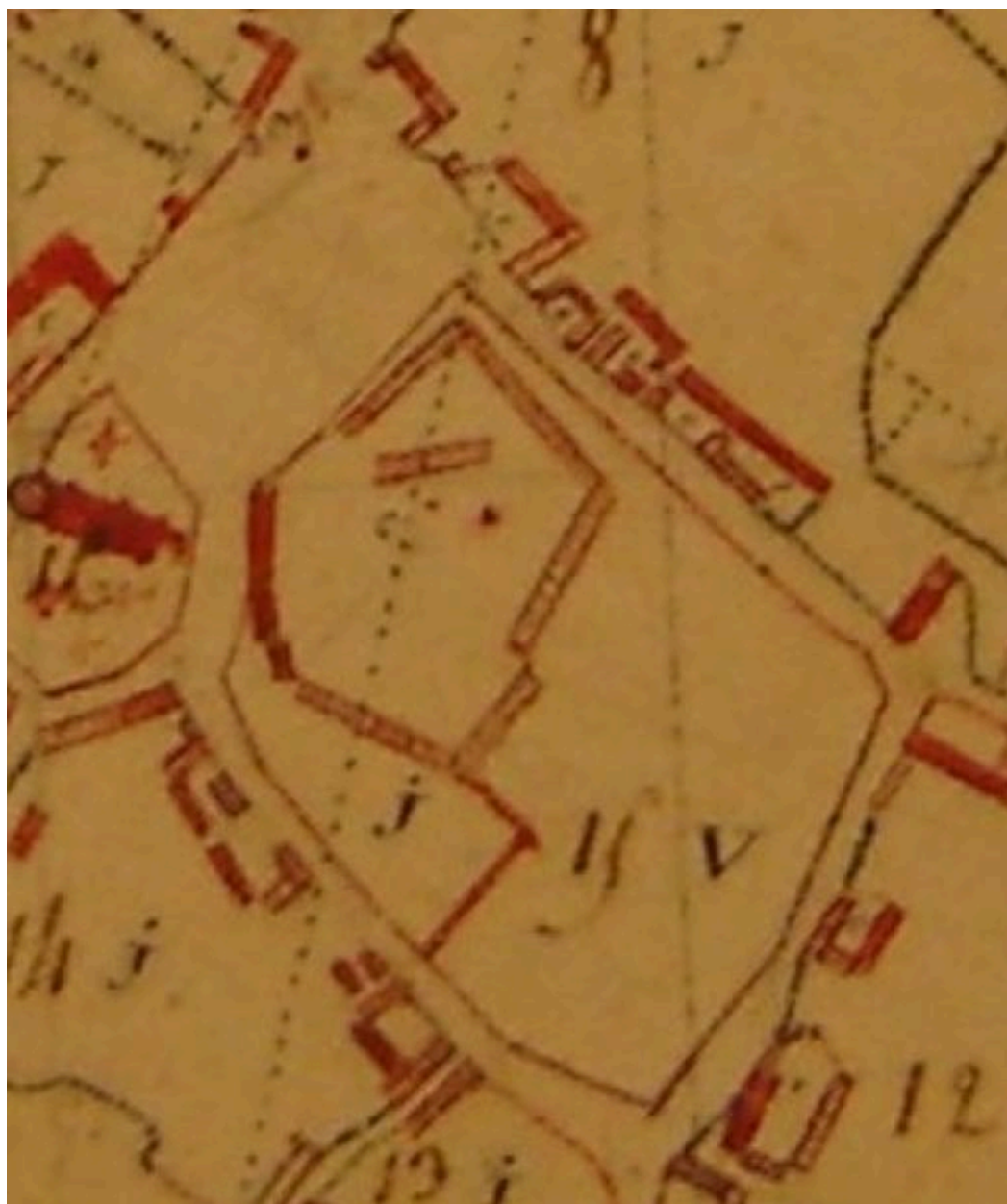
Extrait du plan par masse de culture présentant le plan de la ferme en 1802.