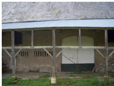
Vue postérieure d'une des travées.