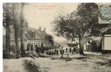
Vue de la ferme depuis la place publique au début du 20e siècle.