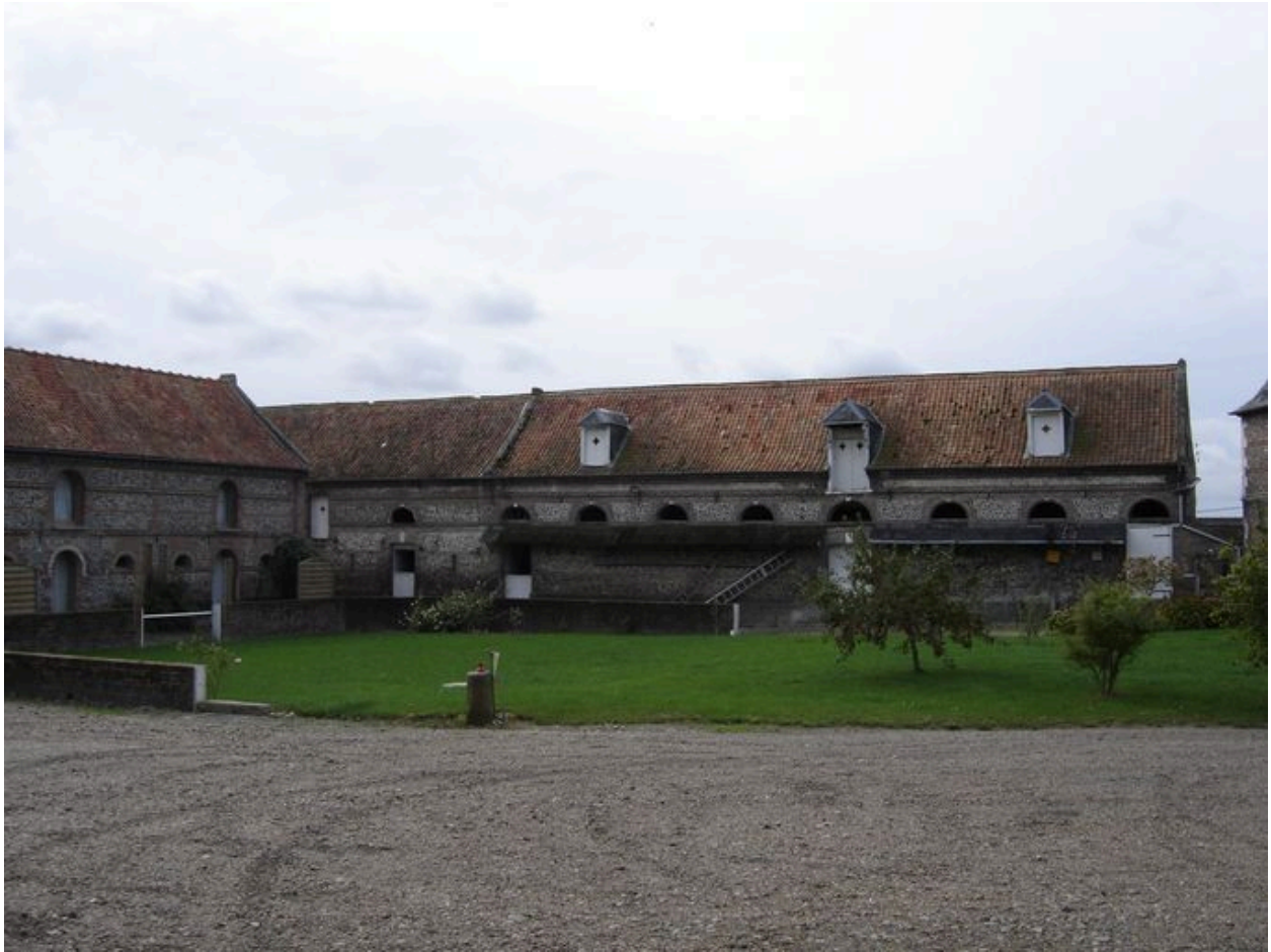
Vue des écuries au sud de la cour.