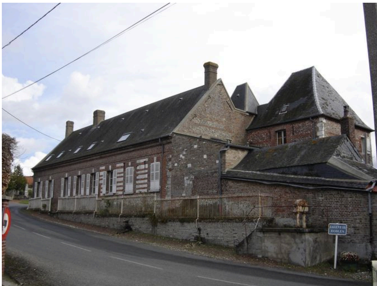
Vue du logis sur rue.