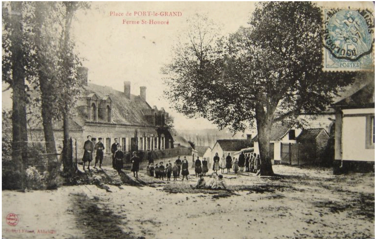
Vue de la ferme depuis la place publique au début du 20e siècle.