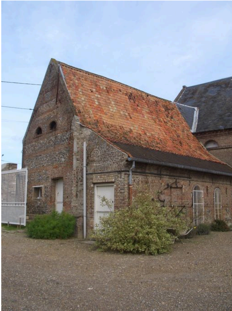
Vue des ateliers depuis la cour.