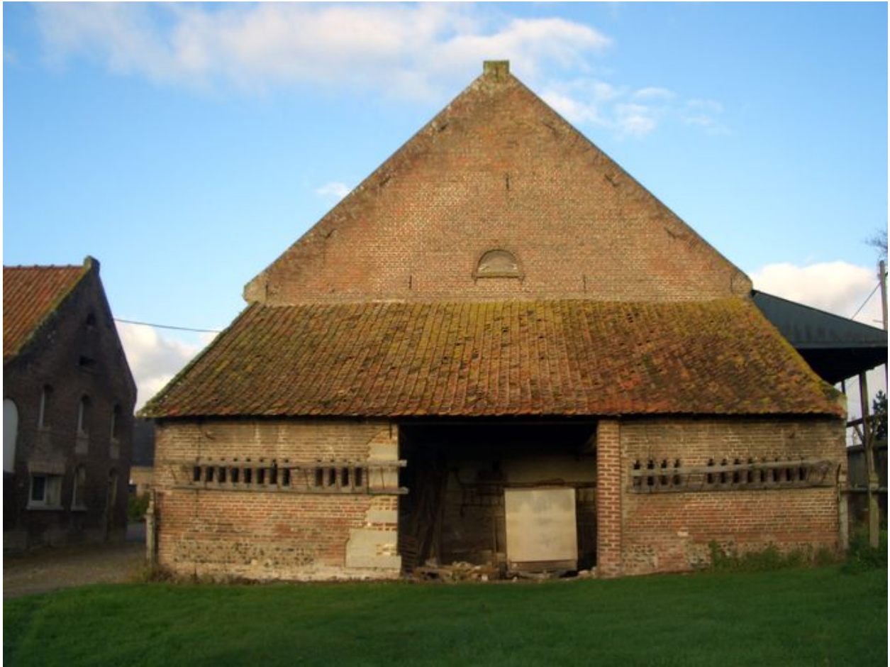
Vue du pignon est des bouveries.