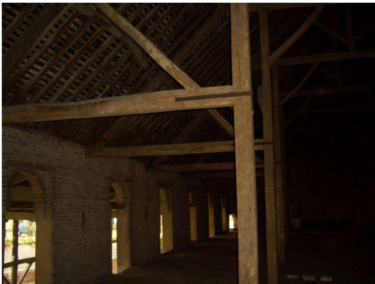
Vue des ouvertures donnant accès au grenier.