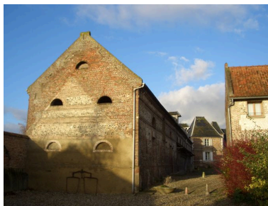
Vue latérale des écuries depuis l'est.