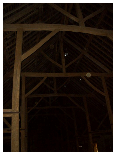
Vue partielle de la charpente des bouveries. IVR22_20068005601NUCA