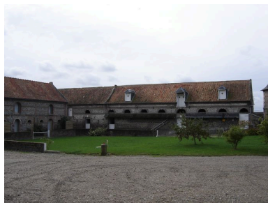
Vue des écuries au sud de la cour.