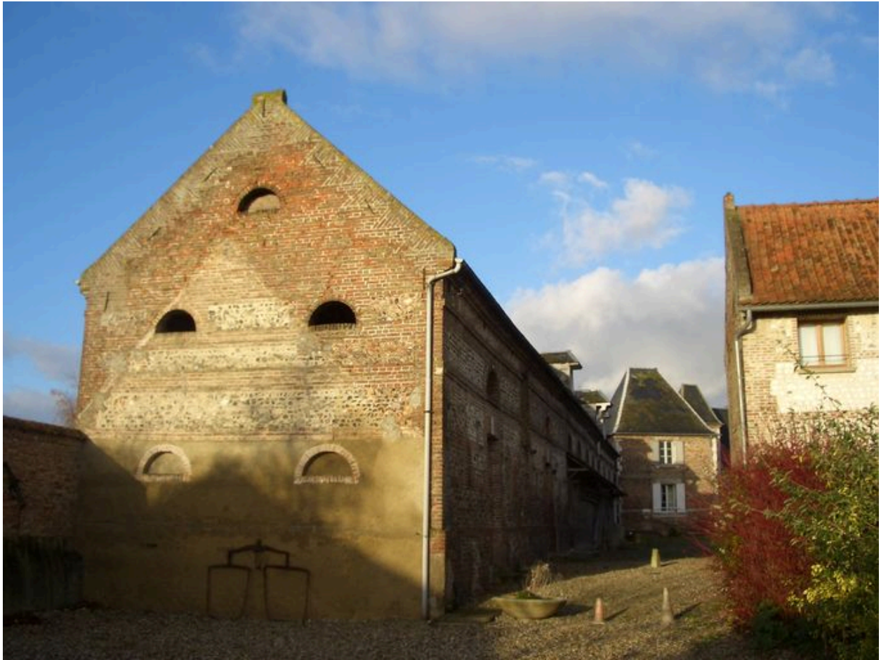
Vue latérale des écuries depuis l'est.