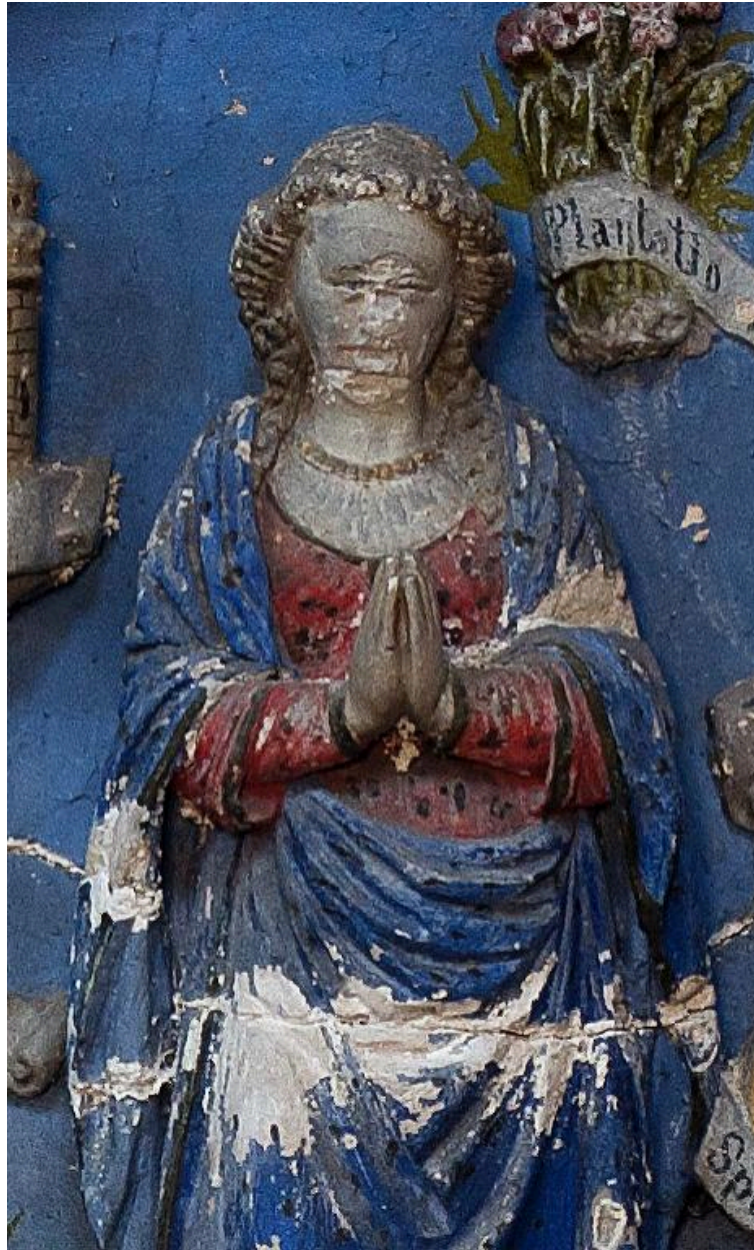
Vue de détail : la Vierge en prière.