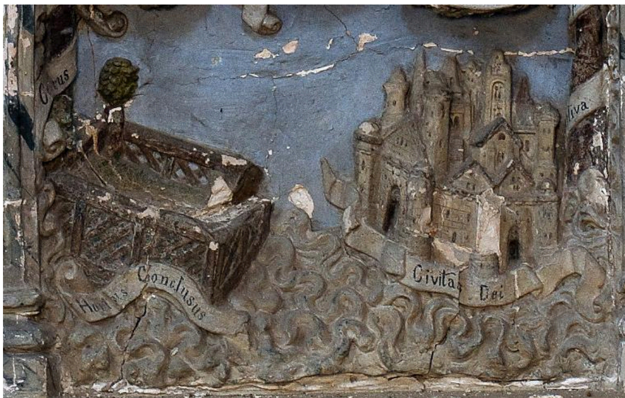
Vue de détail : le jardin clos et la Civitas Dei (registre inférieur du relief).