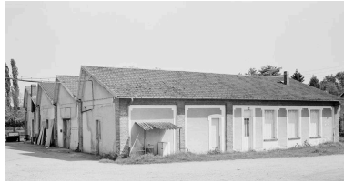
Atelier de fabrication. IVR22_19936000525X