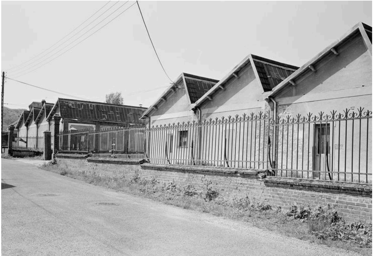
Atelier de fabrication.