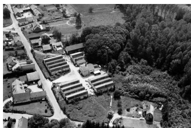
Vue aérienne.