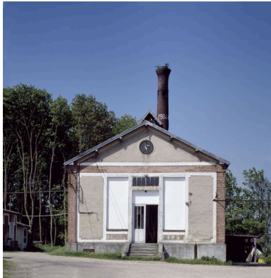
Chaufferie : élévation antérieure.