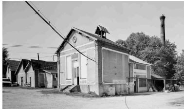
Chaufferie : élévation antérieure.