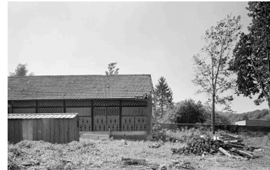
Entrepôt industriel. IVR22_19936000524X