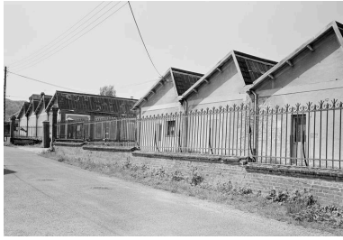
Atelier de fabrication. IVR22_19936000528X