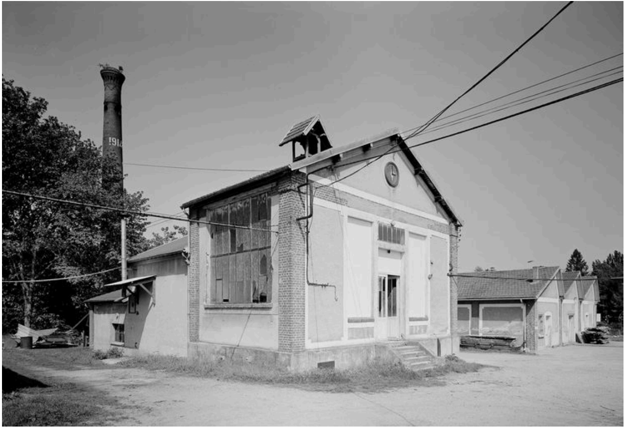
La chaufferie avec sa cheminée et les ateliers en shed à l'arrière plan.