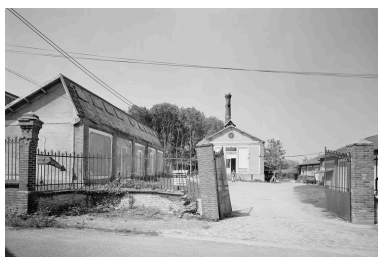
Entrée principale, chaufferie et atelier de fabrication.