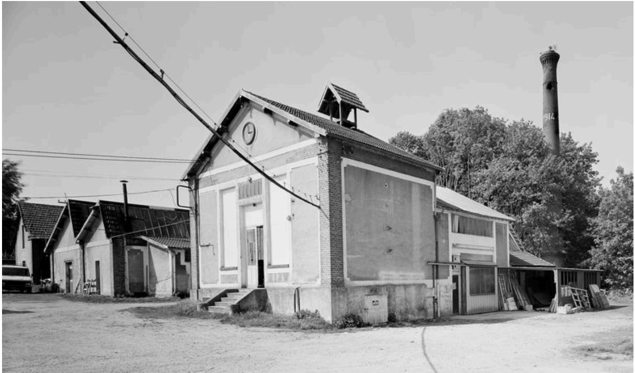
Chaufferie : élévation antérieure.