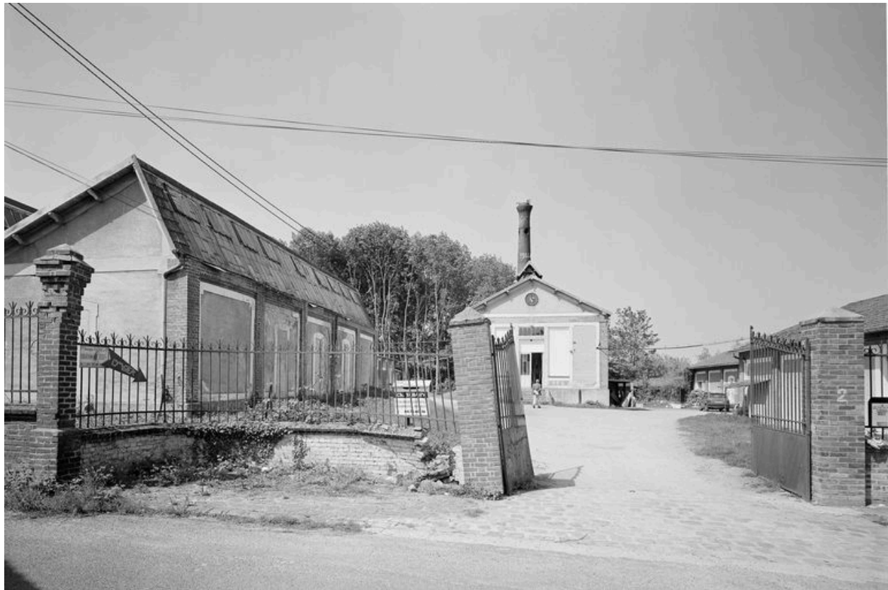
Entrée principale, chaufferie et atelier de fabrication.