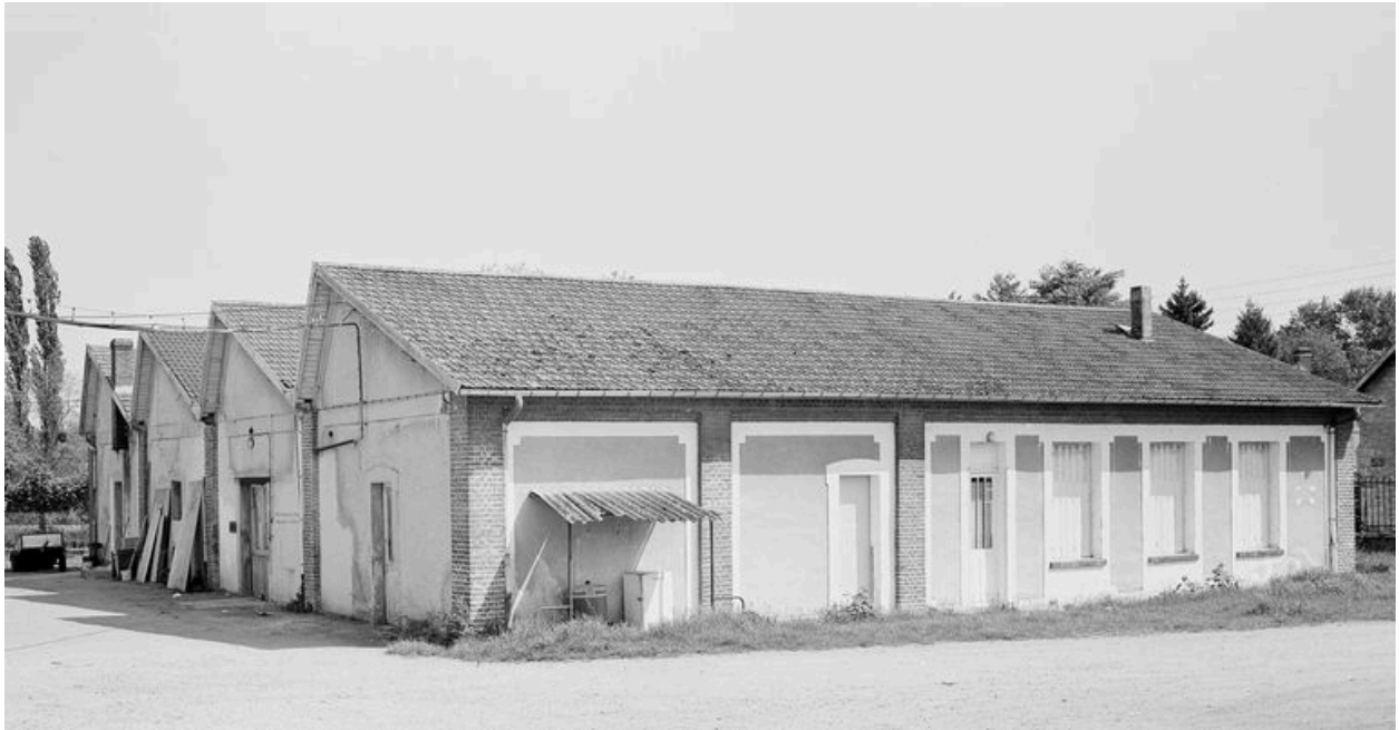
Atelier de fabrication.