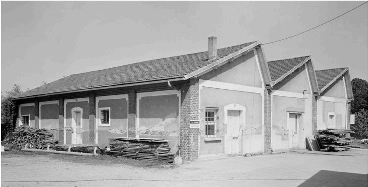
Atelier de fabrication.