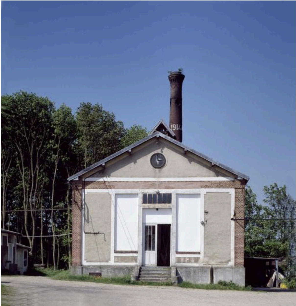
Chaufferie : élévation antérieure.