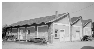
Atelier de fabrication. IVR22_19936000523X