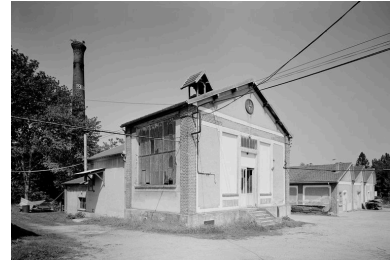
La chaufferie avec sa cheminée et les ateliers en shed à l'arrière plan. IVR22_19936000713V