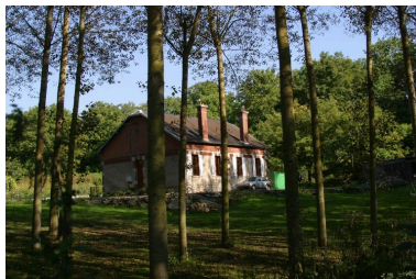
Vue d'une des trois maisons identiques dépendant de la ferme. IVR22_20050200881NUCA