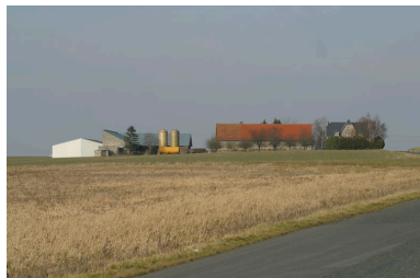
Vue générale. IVR22_20050200720NUCA