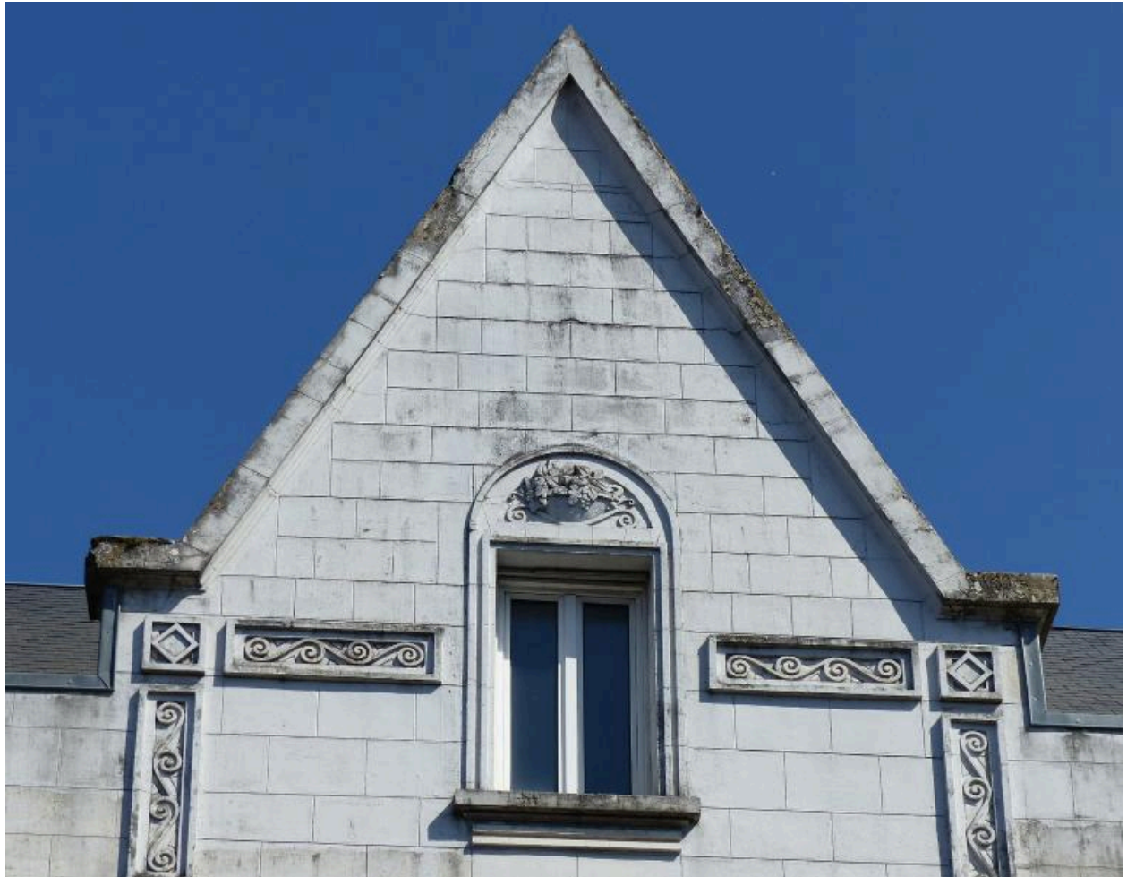
Vue de détail sur le décor du fronton.