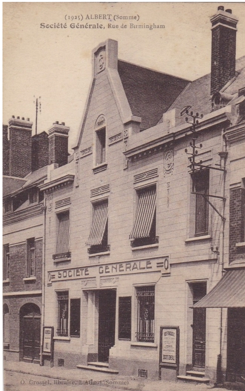
Albert (Somme). La société générale. Rue de Birmingham. Carte postale, vers 1930.