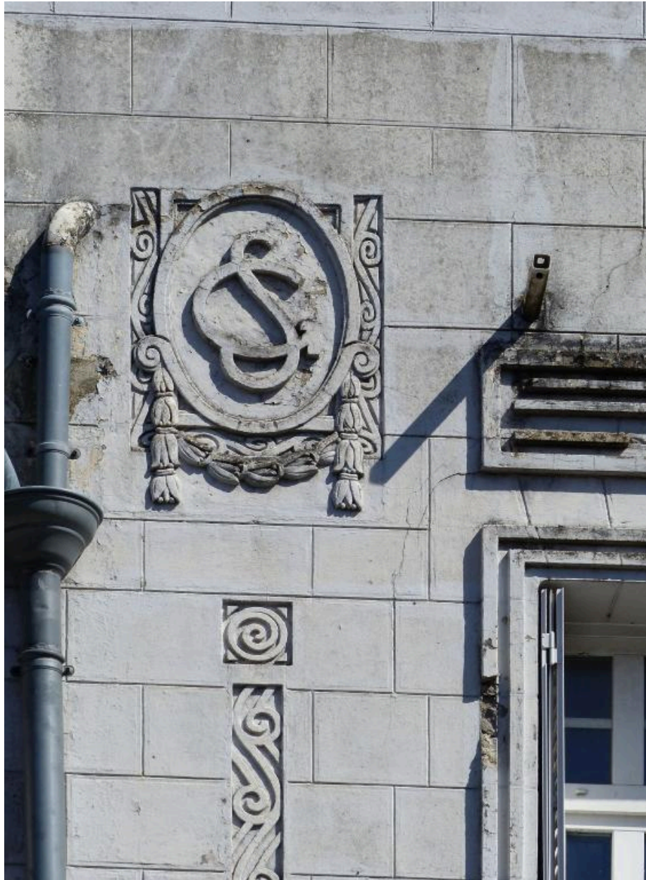
Vue de détail sur le monogramme de la Société Générale.