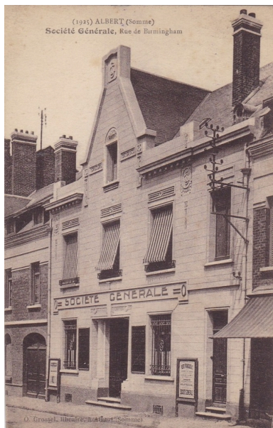
Albert (Somme). La société générale. Rue de Birmingham. Carte postale, vers 1930 (coll. part.). IVR32_20218005005NUCA