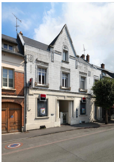
Vue générale. IVR32_20218000148NUCA