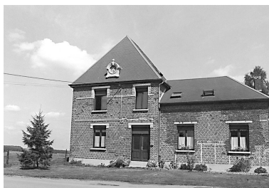
Ecole communale, rue du Moulin-Housseau : vue générale. IVR22_19980202679Z