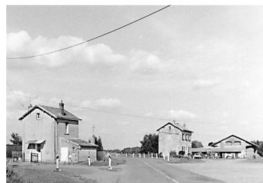
Ancienne gare : vue générale des bâtiments.