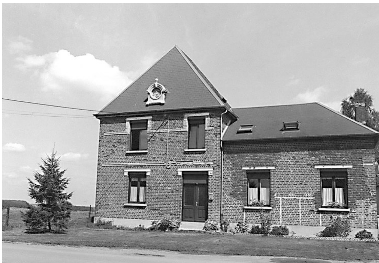
Ecole communale, rue du Moulin-Housseau : vue générale.