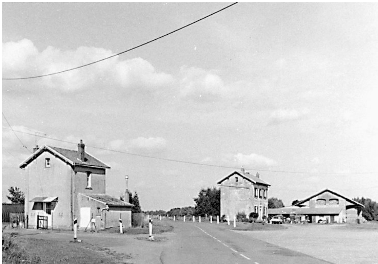
Ancienne gare : vue générale des bâtiments.