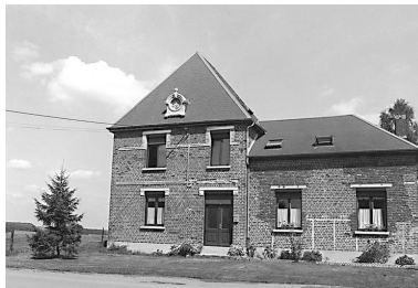
Ecole communale, rue du Moulin-Housseau : vue générale.