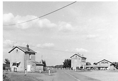
Ancienne gare : vue générale des bâtiments.