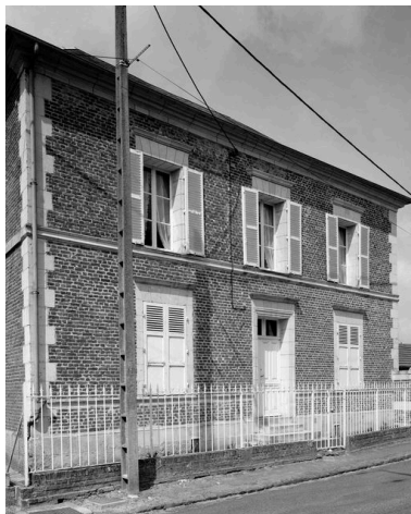
Elévation antérieure.