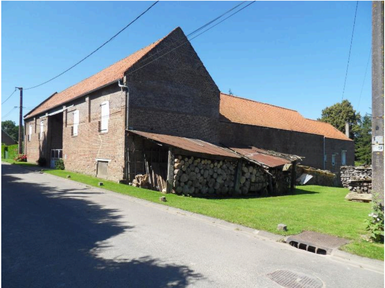
Ancienne ferme, 14 rue d'En-Bas.