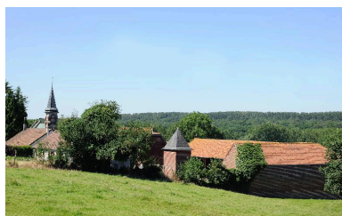
Vue du village depuis la colline

Phot. Isabelle Barbedor IVR22_20128005134NUCA