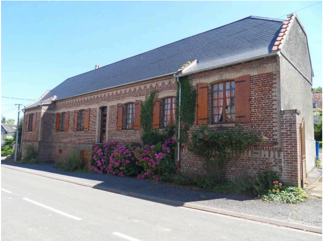
Maison, 27 rue d'Albert.