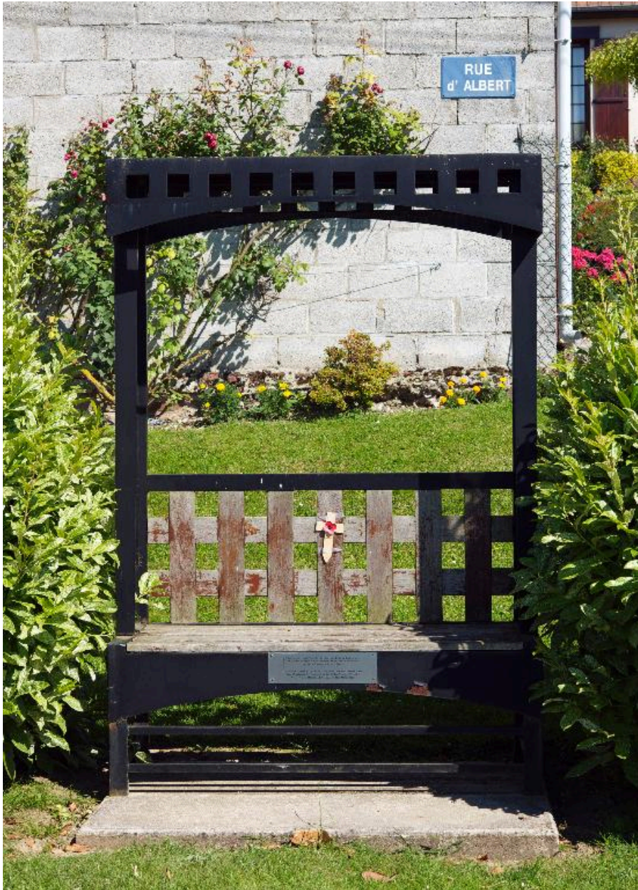
Banc public offert par les habitants de la ville de Glasgow