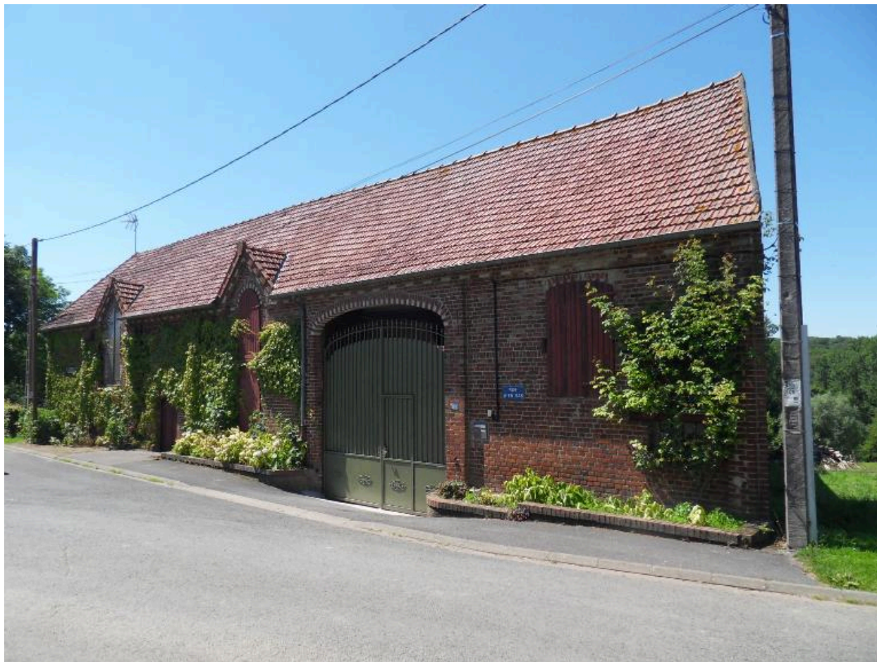
Ancienne ferme, 34 rue d'En-Bas