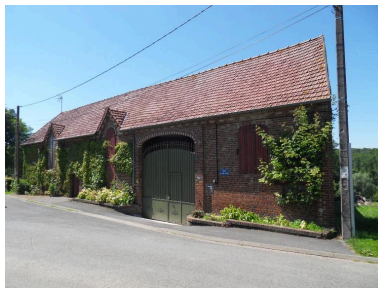
Ancienne ferme, 34 rue d'En-Bas IVR22_20128005129NUCA