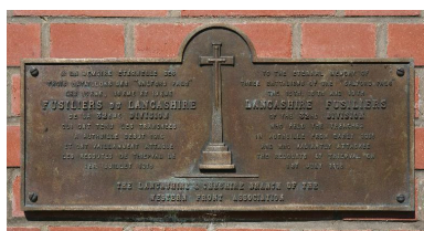
Plaque commémorative à la mémoire des 15e, 16e et 19e bataillons de Salford Pals

IVR22_20128000933NUC2A