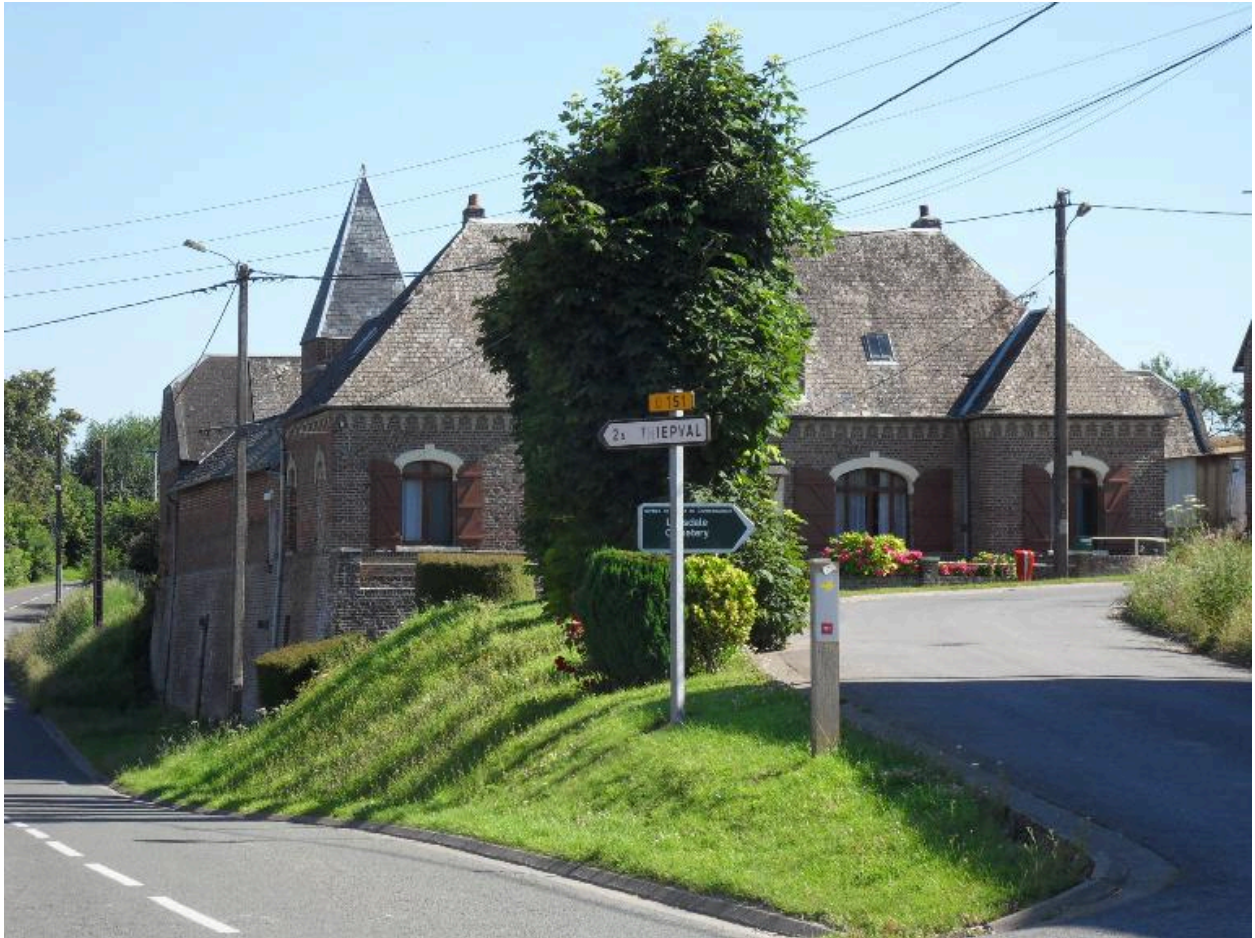
Ferme, 1 rue Bustière