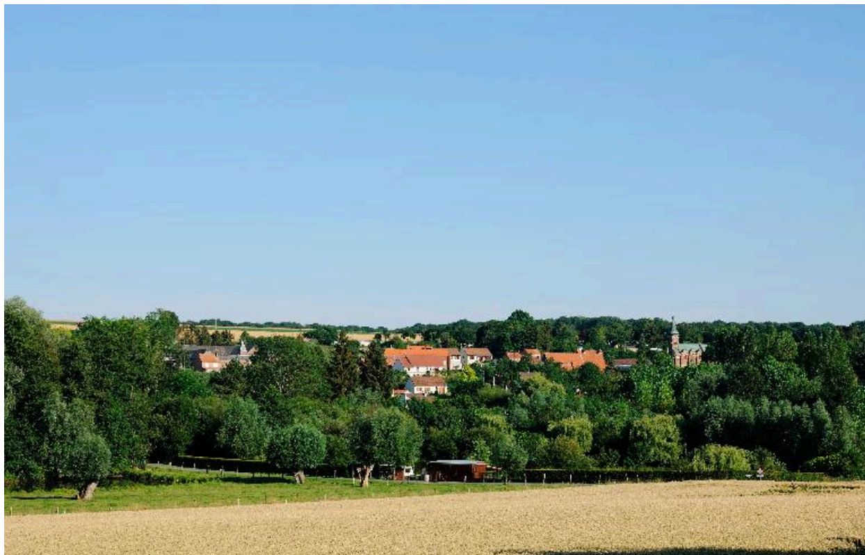
Vue du village depuis l'ouest