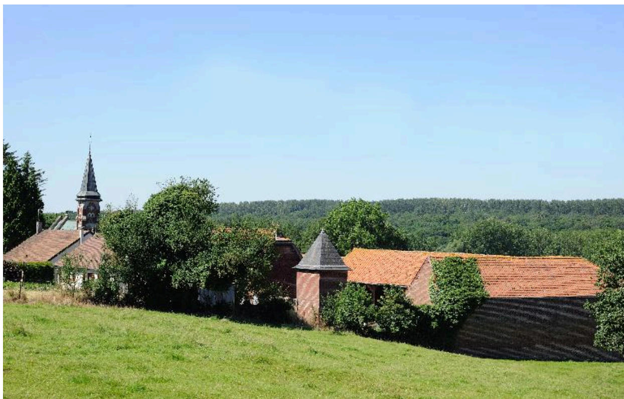
Vue du village depuis la colline