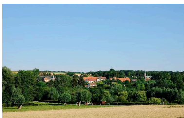
Vue du village depuis l'ouest

Phot. Marie-Laure Monnehay-Vulliet IVR22_20128000919NUC2A