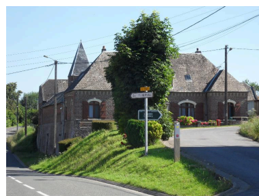
Ferme, 1 rue Bustière

Phot. Isabelle Barbedor IVR22_20128005132NUCA