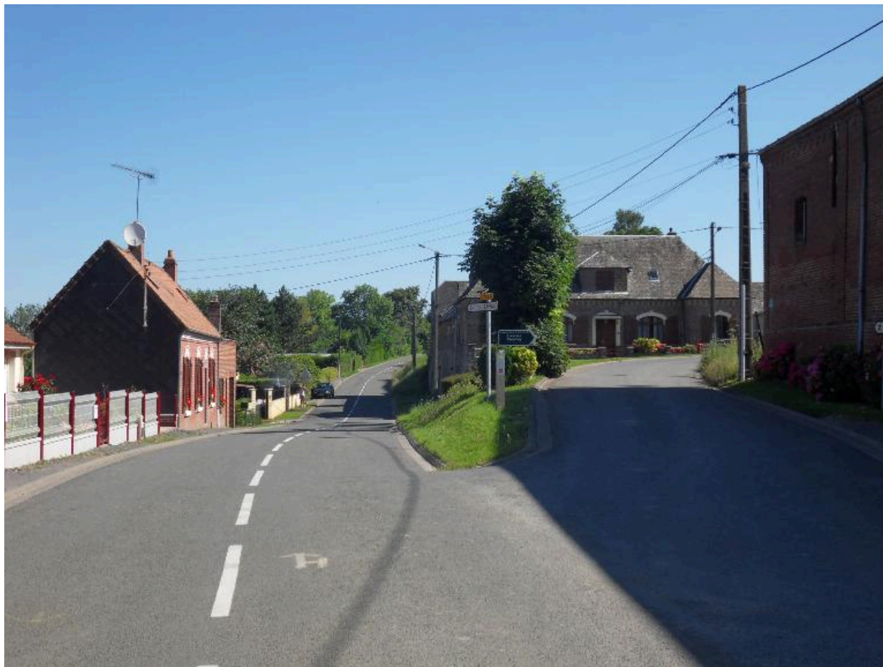
La rue Grandicourt et la montée de la rue Bustière, au nord du village.