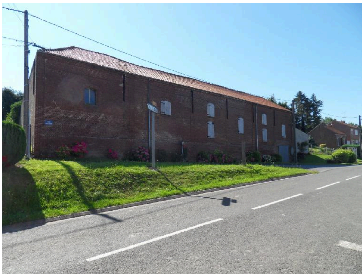
Ancienne ferme, 1 rue d'Albert.