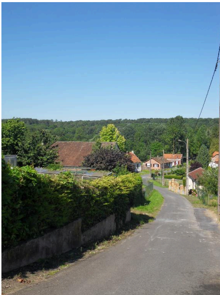
La rue du Moulin.