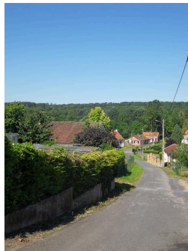
La rue du Moulin.

Phot. Isabelle Barbedor IVR22_20128005133NUCA