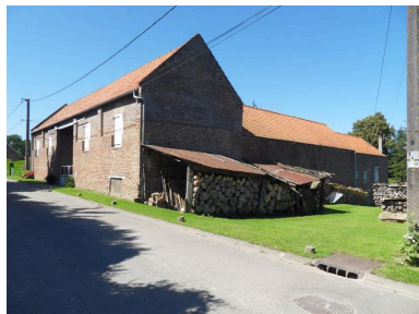
Ancienne ferme, 14 rue d'En-Bas.

Banc public offert par les habitants de la ville de Glasgow