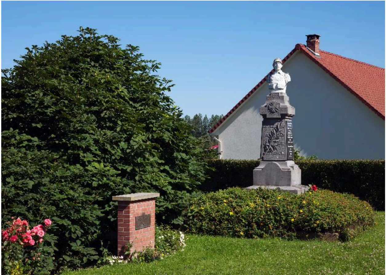
Les monuments commémoratifs