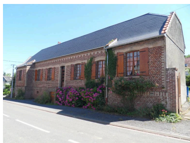
Maison, 27 rue d'Albert.