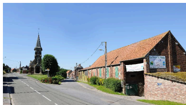
La place de l'Eglise, vue depuis le nord.

IVR22_20128000917NUC2A