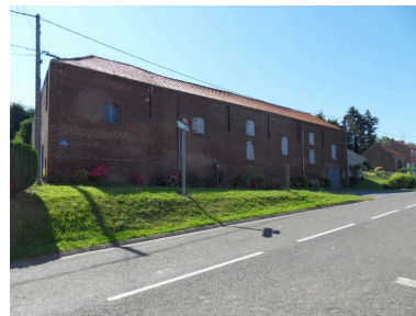
Ancienne ferme, 1 rue d'Albert.