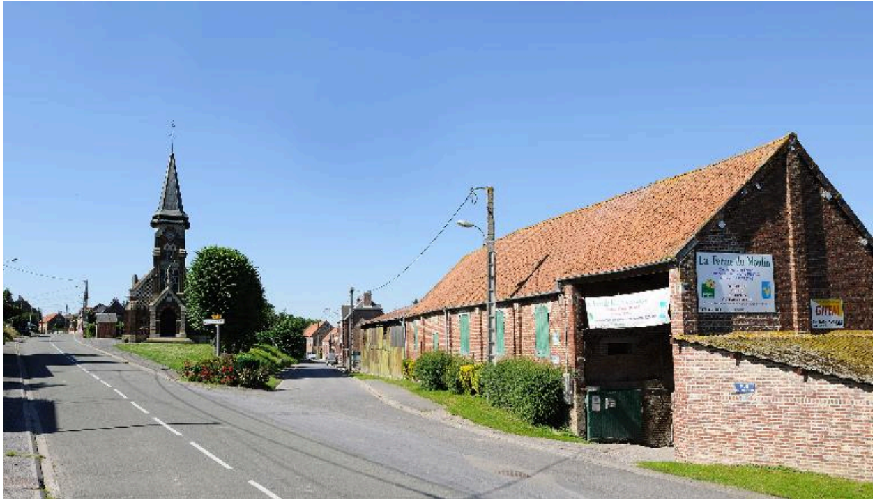
La place de l'Eglise, vue depuis le nord.