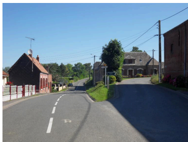
La rue Grandicourt et la montée de la rue Bustière, au nord du village.

IVR22_20128000917NUC2A