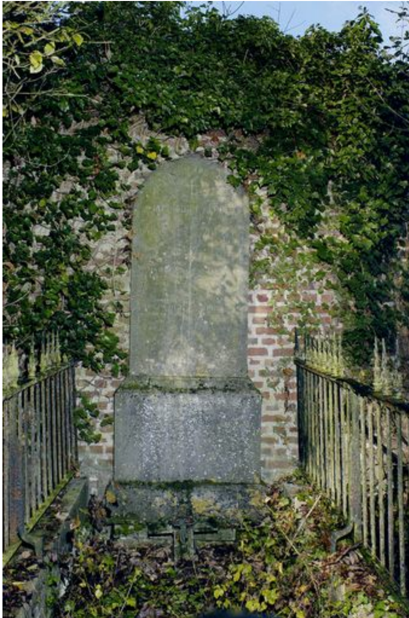
Vue de la stèle.