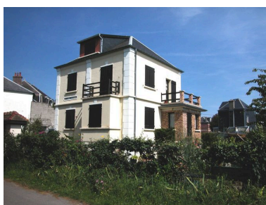
Vue d'ensemble, élévations antérieure et latérale droite. IVR22_20048001599NUCA