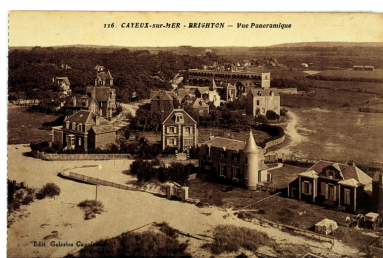
La maison, au centre, carte postale, 1er quart 20e siècle (coll. part.). IVR22_20058000505XAB