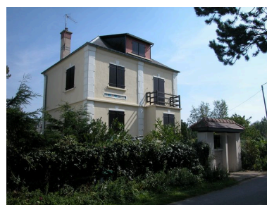
Vue d'ensemble, élévations antérieure et latérale gauche. IVR22_20048001600NUCA