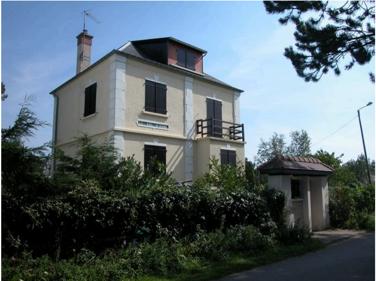
Vue d'ensemble, élévations antérieure et latérale gauche.