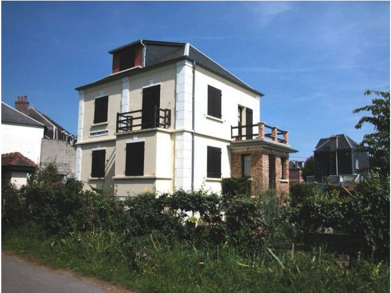
Vue d'ensemble, élévations antérieure et latérale droite.